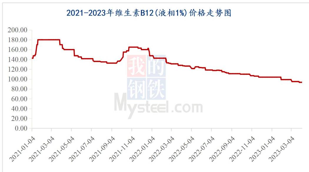
图 9 2021-2023 年维生素 B12 价格走势图