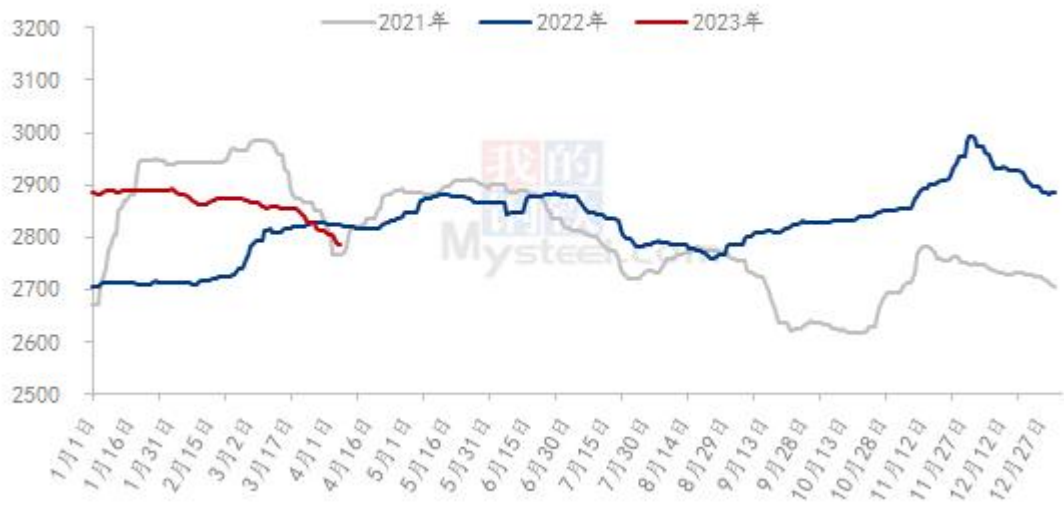
图 17 2021-2023 年全国玉米均价走势图