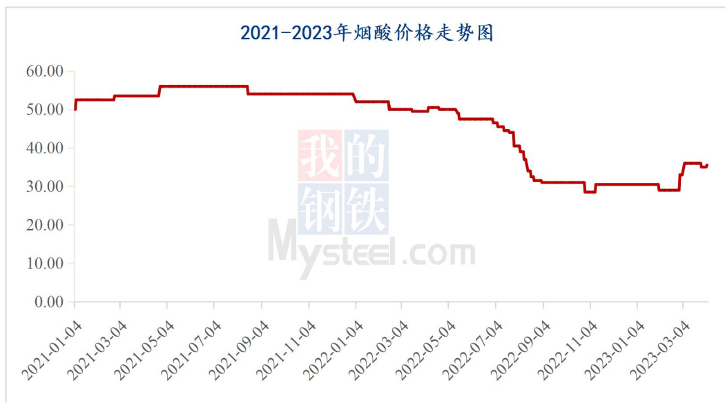
图 15 2021-2023 年烟酸价格走势图

本周国内市场主流报价 34-37 元/kg，市场整体相对平稳。受上游原料供应及年前低价接单等综合影响，导致年后各工厂交货相对紧张，主流工厂选择停报观望，市场供货暂时出现一定缺口，成交价格也随之小幅上涨。