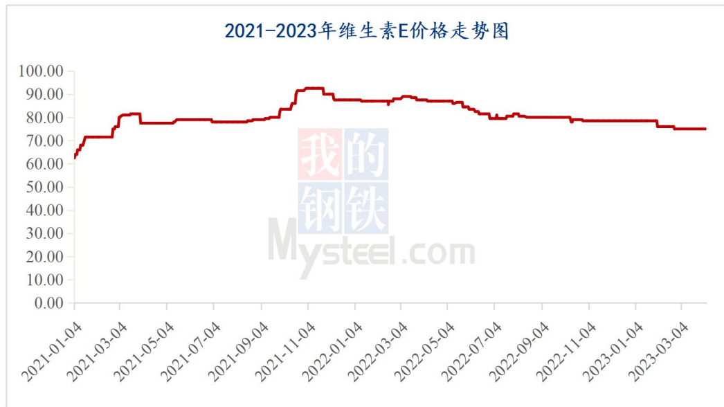
图 2 2021-2023 年维生素 E 价格走势图