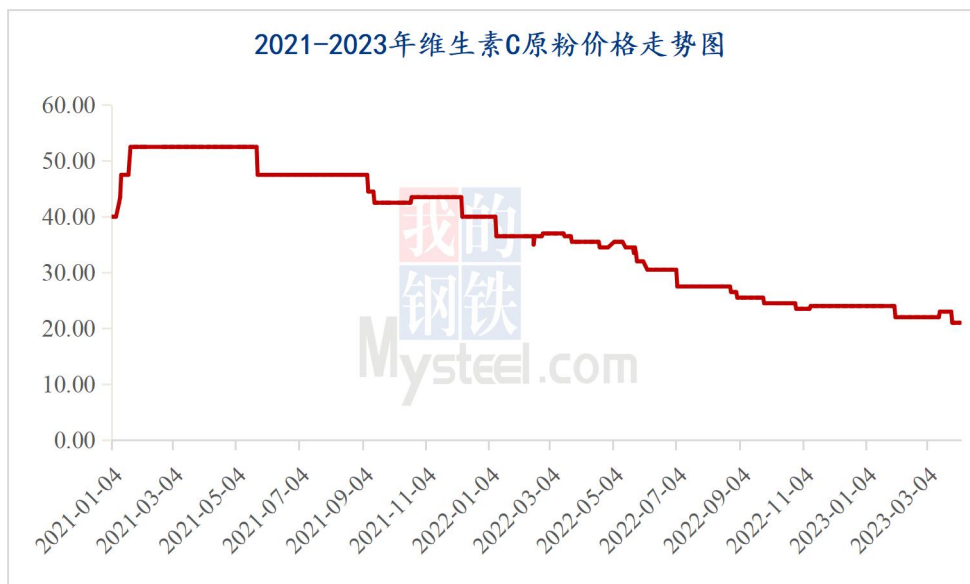
图 3 2021-2023 年维生素 C 价格走势图

本周 VC 原粉国内市场报价 20-22 元/kg，下游需求一般，终端适量补货，部分品牌略低一些。