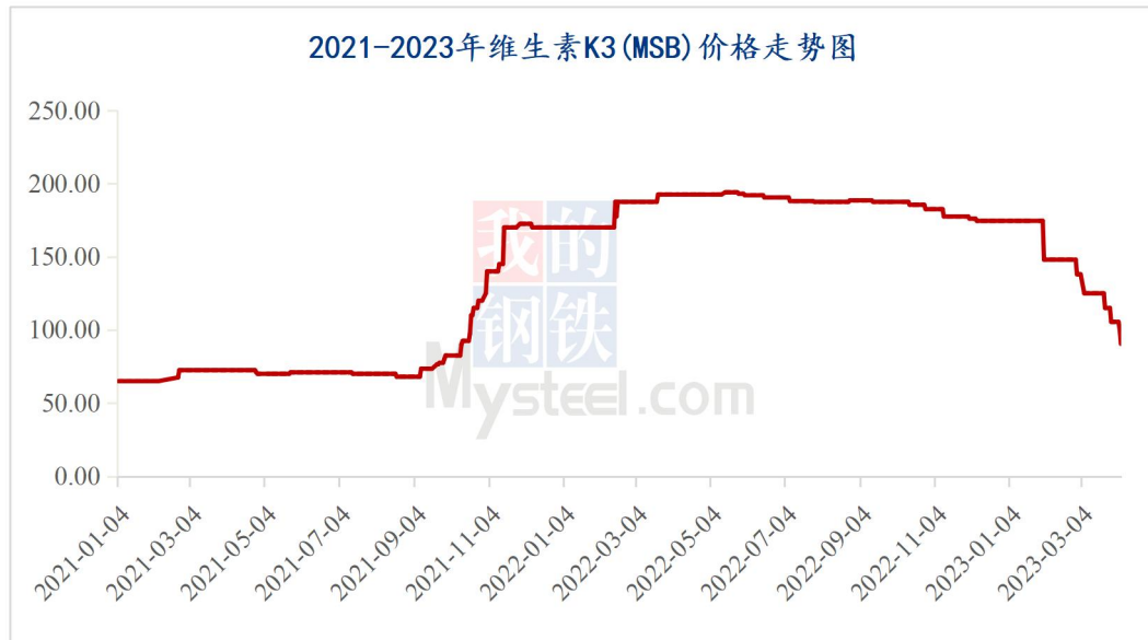
图 10 2021-2023 年维生素 K3 价格走势

本周国内维生素 K3（MSB）市场主流价格在 100-105 元/kg，MNB 市场价格在 110-115 元/kg。市场需求一般，询单略平淡，K3 价格平稳偏弱。