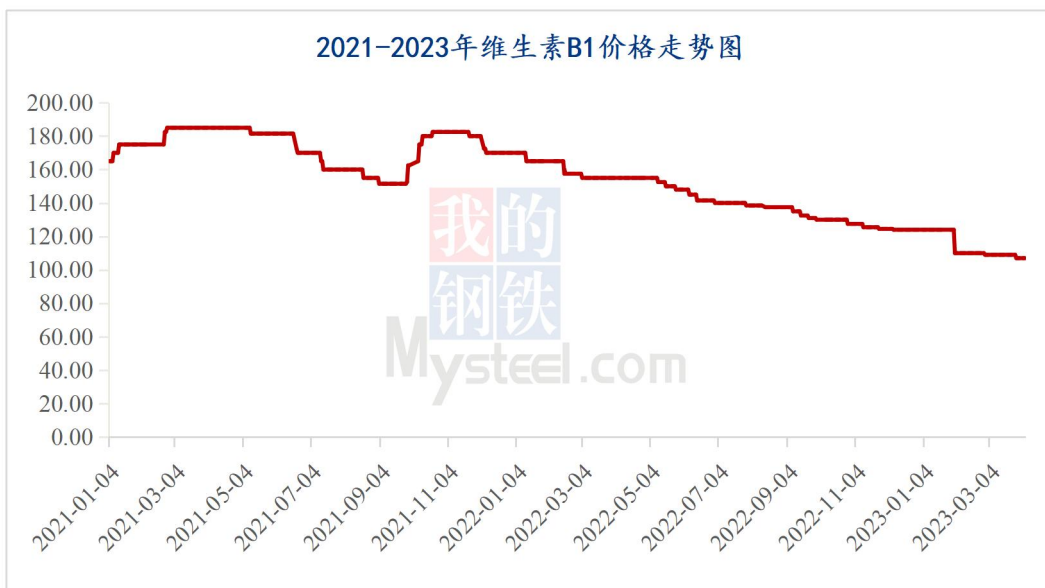
图 6 2021-2023 年维生素 B1 价格走势

本周国内维生素 B1 市场报价在 106-110 元/kg，下游需求较弱，询单较为平淡，上游工厂挺价意愿较强，不过市场询单较为平淡，价格平稳略弱。