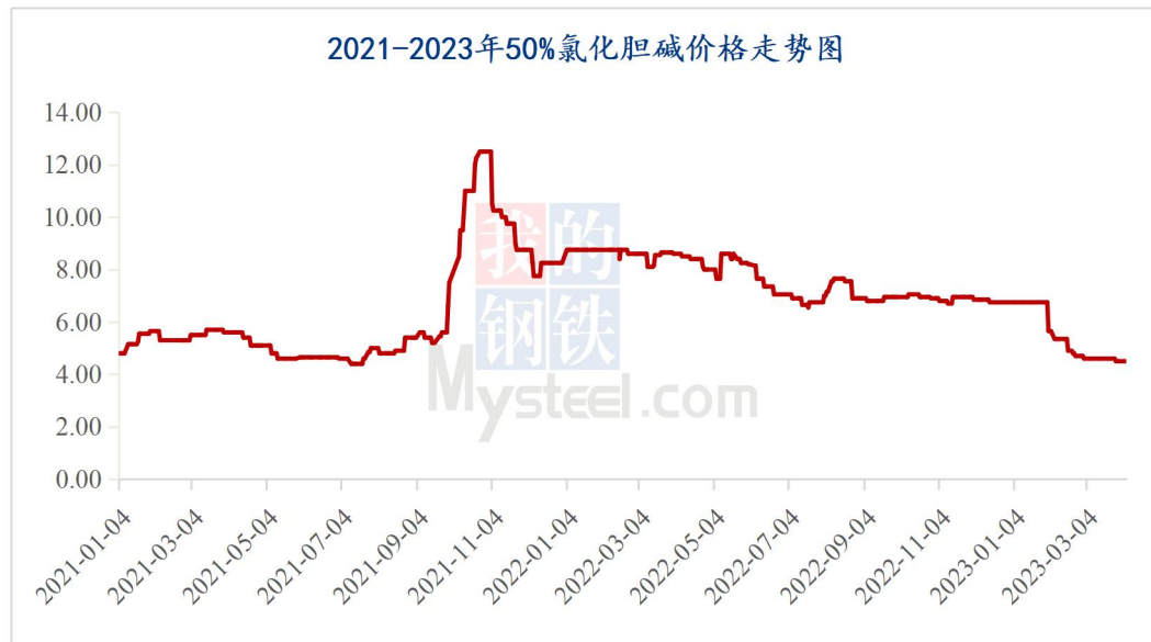
图 16 2021-2023 年氯化胆碱价格走势

本周国内氯化胆碱市场价格 4.4-4.7 元/kg。胆碱，受原料三甲胺价格波动，胆碱工厂报价动态调整，后续主要关注三甲胺变化情况。