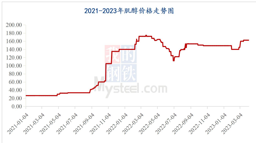
图 14 2021-2023 年肌醇价格走势图