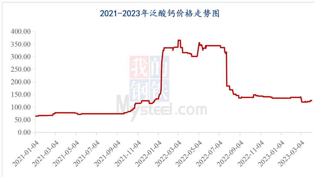
图 5 2021-2023 年泛酸钙价格走势