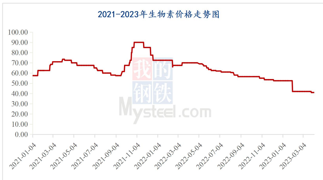
图 12 2021-2023 年生物素价格走势

本周国内 2%生物素市场价格在 40-42 元/kg，市场询单一般，交投价格平稳偏弱，部分价格略低。