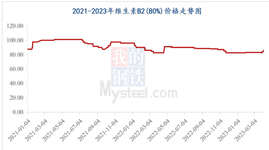
图 7 2021-2023 年维生素 B2（80%）价格走势图

本周国内 VB2(80%)市场价格 83-88 元/kg，欧洲市场价格 15.00-16.00 欧元/kg，VB2(98%)市场价格 325-350 元/kg。市场需求一般，整体报价有维持平稳，根据品牌、日期不同，局部价格略低。