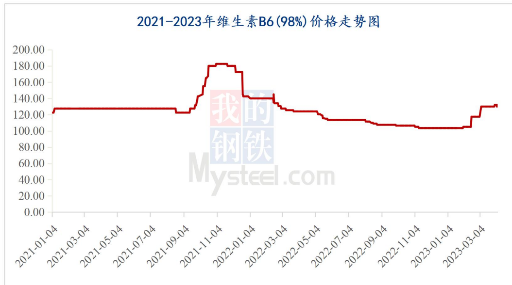
图 8 2021-2023 年维生素 B6 价格走势图