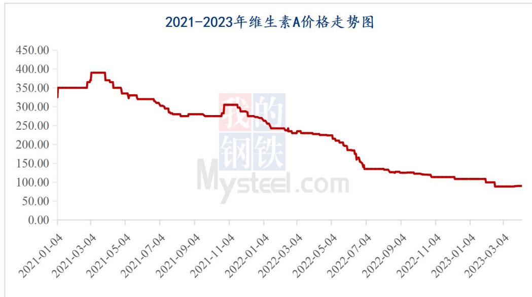
图 1 2023 年维生素 A 价格走势图

据 Mysteel 对全国维生素市场价格调查，本周维生素 A500 市场国内价格 89-91 元/kg，采购需求持续偏弱，上游工厂上调报价，市场报价偏强，询单稍活跃，根据品牌、日期不同，局部价格略低。欧洲 VA1000 市场报价 21.00-25.50 欧元/kg。