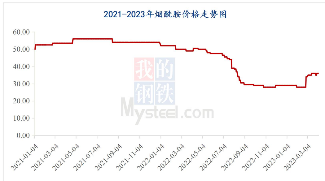
图 13 2021-2023 年烟酰胺价格走势图

本周国内市场主流报价 34-37 元/kg，由于上游原材料紧缺，产品供应出现缺口，工厂挺价意愿明显，目前主流出口报价基本在 USD 4.0-4.2，国内 RMB 31-32 左右，交期基本延至第二季度，市场活跃度，国内外询单量明显增加，短期内小幅上涨趋势明显。