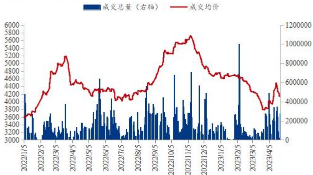
全国豆粕成交价量走势图（单位：吨）