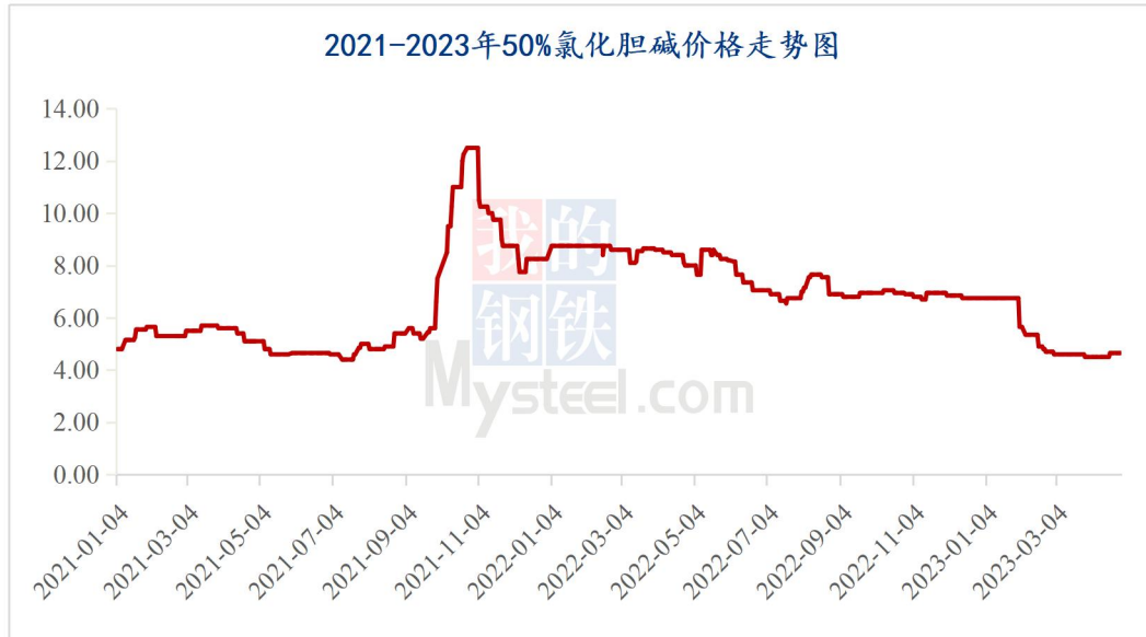
图 16 2021-2023 年氯化胆碱价格走势图

本周国内氯化胆碱市场价格 4.6-4.8 元/kg。胆碱，本周受原料三甲胺价格小幅波动，胆碱工厂报价动态调整，后续主要关注其原料端三甲胺及环氧乙烷变化情况。