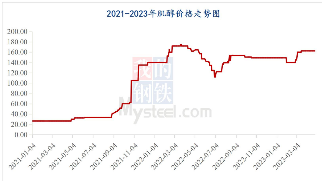
图 14 2021-2023 年肌醇价格走势