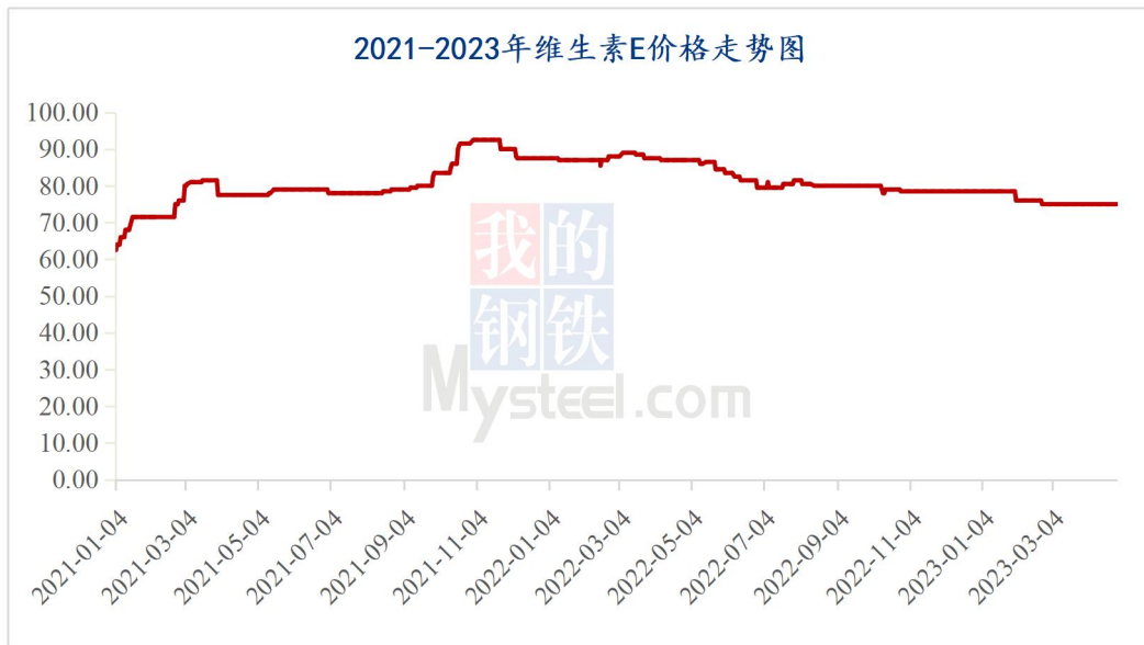
图 2 2021-2023 年维生素 E 价格走势图