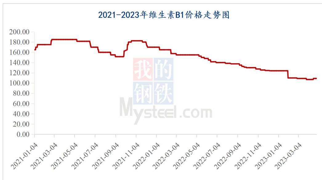
图 6 2021-2023 年维生素 B1 价格走势图

本周国内维生素 B1 市场报价在 108-112 元/kg，下游需求较弱，上游工厂挺价意愿较强，市场观望为主，市场询单较为平淡，价格平稳略强，4 月 21 日，受维生素 B1 主要原材料价格上涨影响，兄弟科技硝酸 B1 报价 120 元/kg，盐酸 B1 报价 150 元/kg。