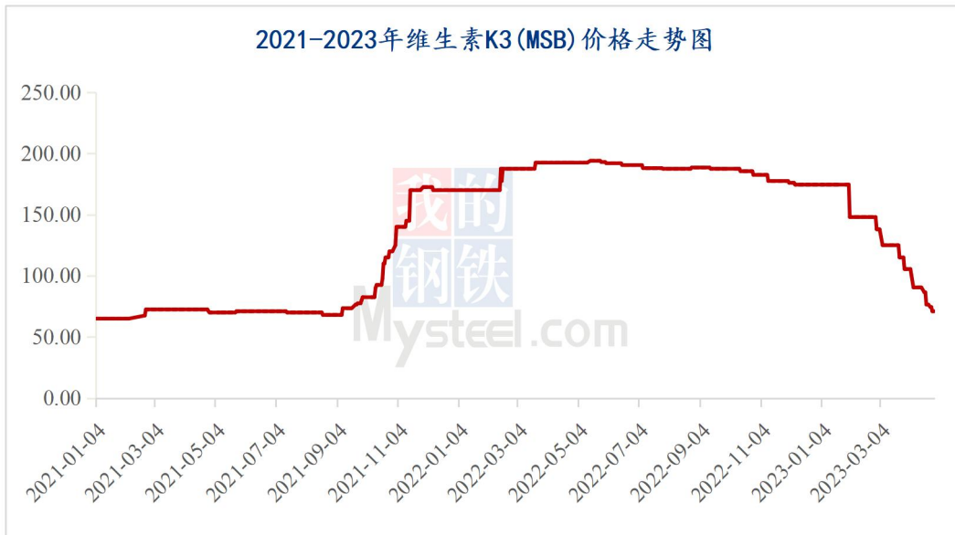
图 10 2021-2023 年维生素 K3 价格走势图

本周国内维生素 K3 (MSB) 市场主流价格在 70-73 元/kg, MNB 市场价格在 80-85 元/kg。下游需求寡淡, 受市场信息影响, 市场价格止跌, 议价成交为主, 受烟酰胺供应偏紧影响, 维生素 K3 MNB 发货紧张。