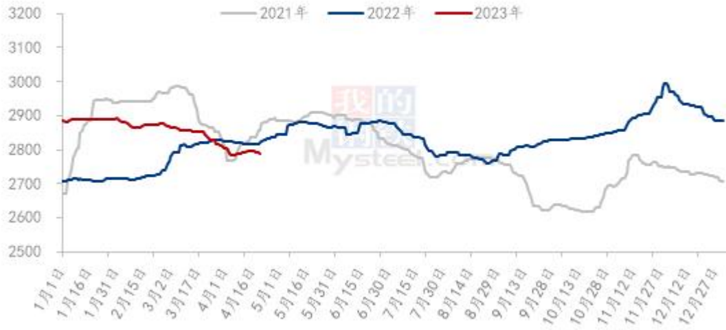
图 17 2021-2023 年全国玉米均价走势图