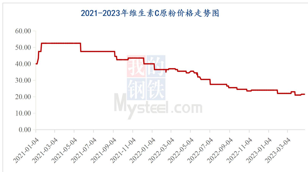
图 3 2021-2023 年维生素 C 价格走势图

本周 VC 原粉国内市场报价 21-22 元/kg，下游需求一般，终端适量补货，部分品牌略低一些。