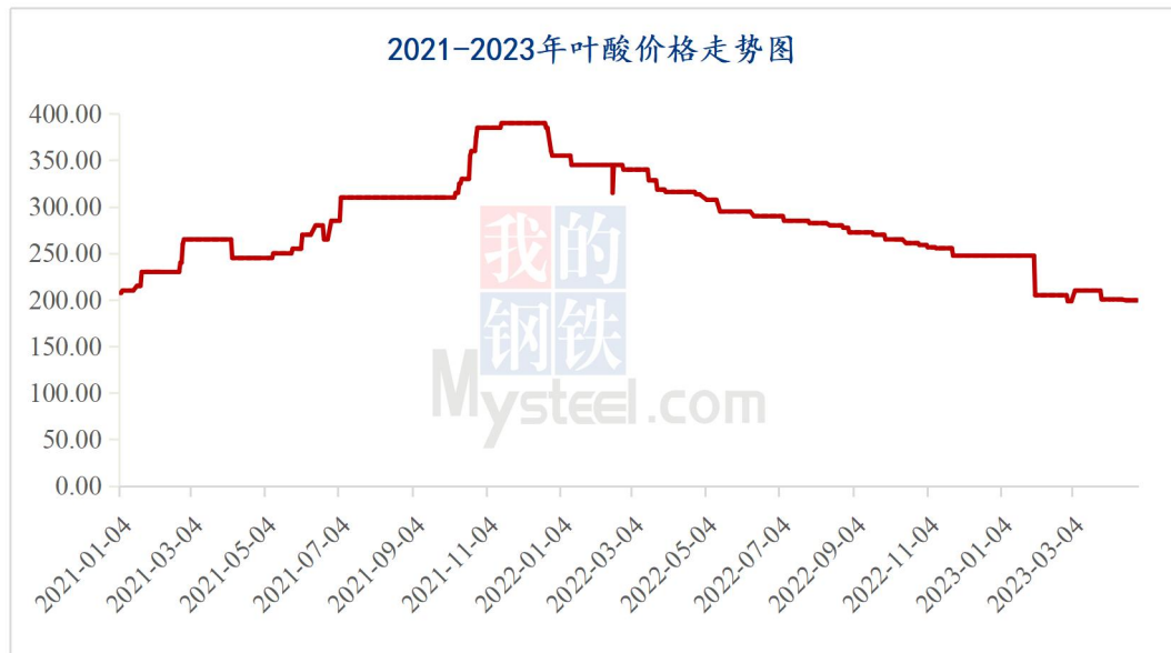
图 11 2021-2023 年叶酸价格走势