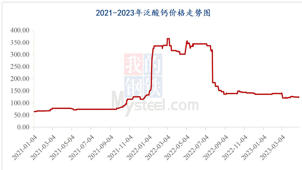
图 5 2021-2023 年泛酸钙价格走势图