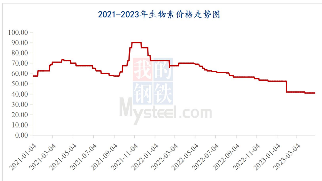
图 12 2021-2023 年生物素价格走势

本周国内 2%生物素市场价格在 40-43 元/kg，市场询单一般，交投价格平稳偏弱，部分价格略低，欧洲 2%生物素报价 4.10-4.40 欧元/kg。