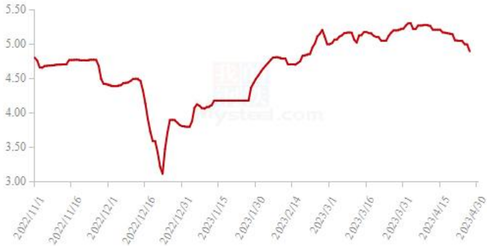
图 19 全国白羽肉鸡均价走势图