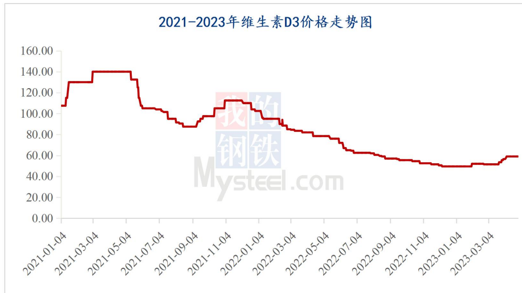
图 4 2021-2023 年维生素 D3 价格走势图

本周国内维生素 D3 国内市场主流价格为 58-60 元/kg，欧洲市场报价为 8.00-9.00 欧元/kg。市场需求一般，受市场信息影响，询单成交均有所活跃，经销渠道出货积极，价格偏强。4 月 3 日，受原料价格上涨等因素影响，天新药业饲料级维生素 D3 最新报价提高至 62 元/kg。市场需求偏淡，询单一般，经销渠道出货积极，价格平稳偏强。