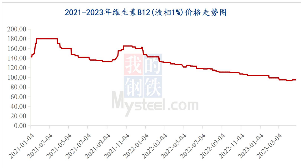
图 9 2021-2023 年维生素 B12 价格走势图

本周国内市场主流报价 94-96 元/kg，整体价格基本平稳，市场需求一般，价格较上周平稳运行。