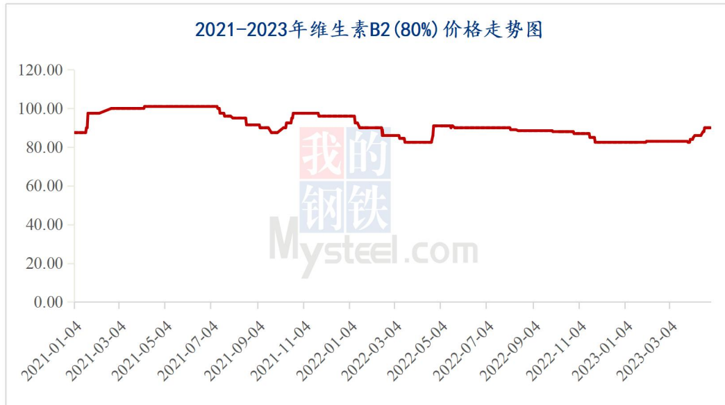
图 7 2021-2023 年维生素 B2（80%）价格走势图

本周国内 VB2(80%)市场价格 88-92 元/kg，欧洲市场价格 15.00-17.00 欧元/kg，VB2(98%)市场价格 330-350 元/kg。市场需求一般，上游工厂上调报价或停报，整体报价有维持平稳，根据品牌、日期不同，局部价格略低。