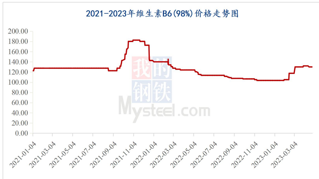
图 8 2021-2023 年维生素 B6 价格走势图