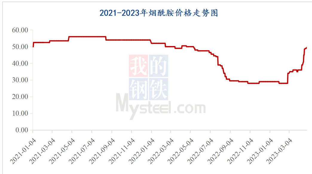
图 13 2021-2023 年烟酰胺价格走势图

本周国内市场主流报价 47-50 元/kg，由于上游原材料紧缺，产品供应出现缺口，工厂挺价意愿明显，交期基本延至第二季度，市场活跃度，国内外询单量明显增加，短期内小幅上涨趋势明显。