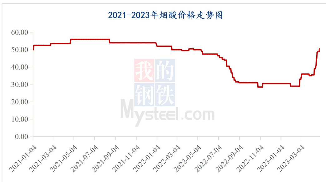
图 15 2021-2023 年烟酸价格走势

本周国内市场主流报价 47-50 元/kg，市场成交较为活跃。受上游原料供应及年前低价接单等综合影响，导致年后各工厂交货相对紧张，主流工厂选择停报观望，市场供货暂时出现一定缺口，成交价格也随之小幅上涨。