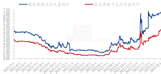
中国生姜主产区主流价格统计(元/斤)