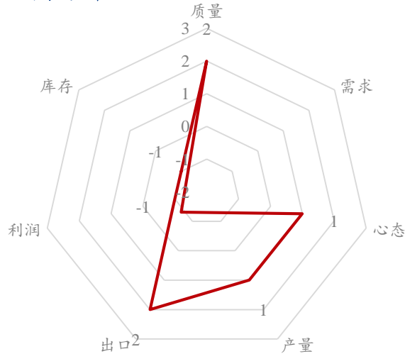
洋葱后市价格影响因素分析