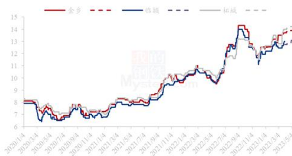
2021年-2022年国内三樱椒产区价格走势(元/斤)

本月生姜价格震荡上行，行情运行偏强。进入3月份，大姜产区货源供应量整体一般，农户多在农忙，出货积极性一般，农户、商贩及持有好货的冷库持货商均有挺价出货表现，采购客商拿货积极，本月整体走货尚可；本月琨福市场鲜姜主流洗姜均价在6.85元/斤，较2月份均价6.59元/斤环比上涨3.95%；安丘黑埠子市场主流泥姜本月均价3.79元/斤，较2月份均价3.36元/斤环比上涨12.80%。