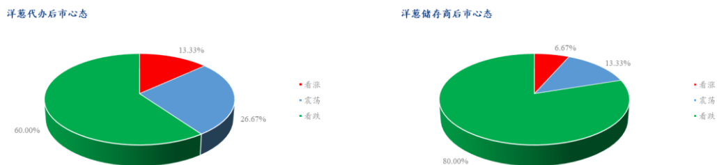
图 4 洋葱市场后市心态占比

本周【Mysteel 农产品】统计了山东、河南、四川、云南等产区 45 位洋葱种植户、经纪人、储存商等专业人士对于近期洋葱价格走势的看法。其中看涨心态占 13.33%，震荡心态占 28.89%，看跌心态占 57.78%。目前来说，整个国内市场需求一般，国外订单一般，需求不旺。