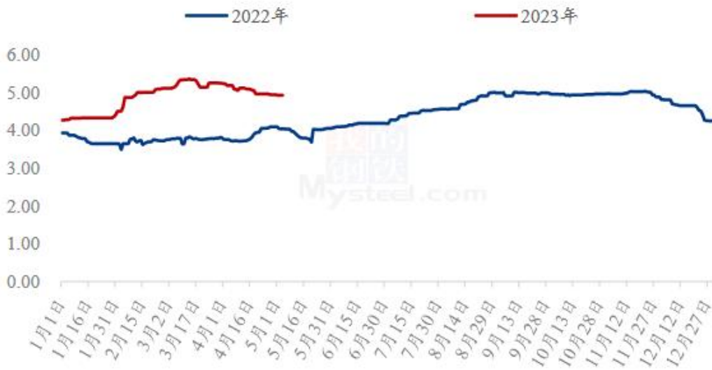
图 3 全国肉鸭均价走势图