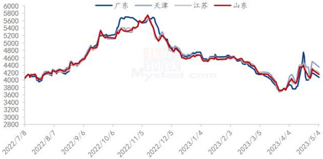
图 4 国内沿海区域豆粕主流出厂价