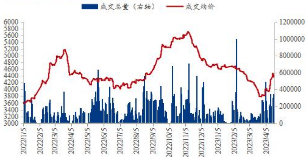
全国豆粕成交价量走势图（单位：吨）