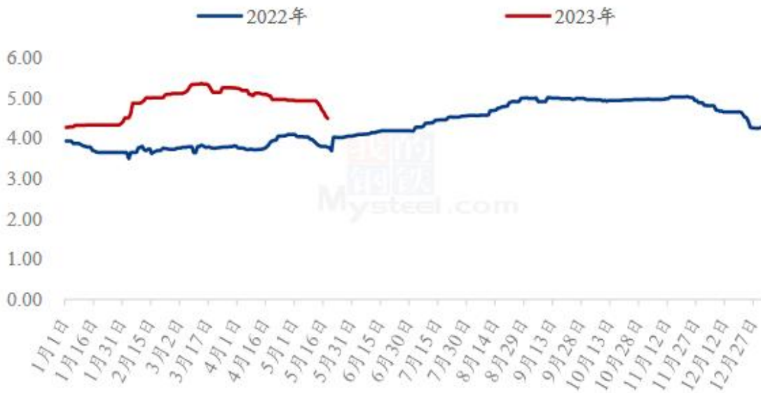
图 3 全国肉鸭均价走势图