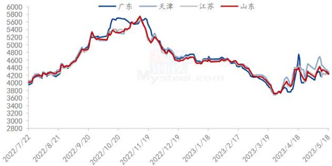
图 4 国内沿海区域豆粕主流出厂价