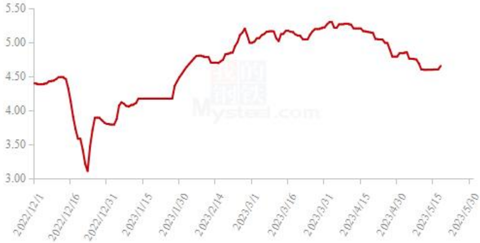
图 2 全国白羽肉鸡均价走势图