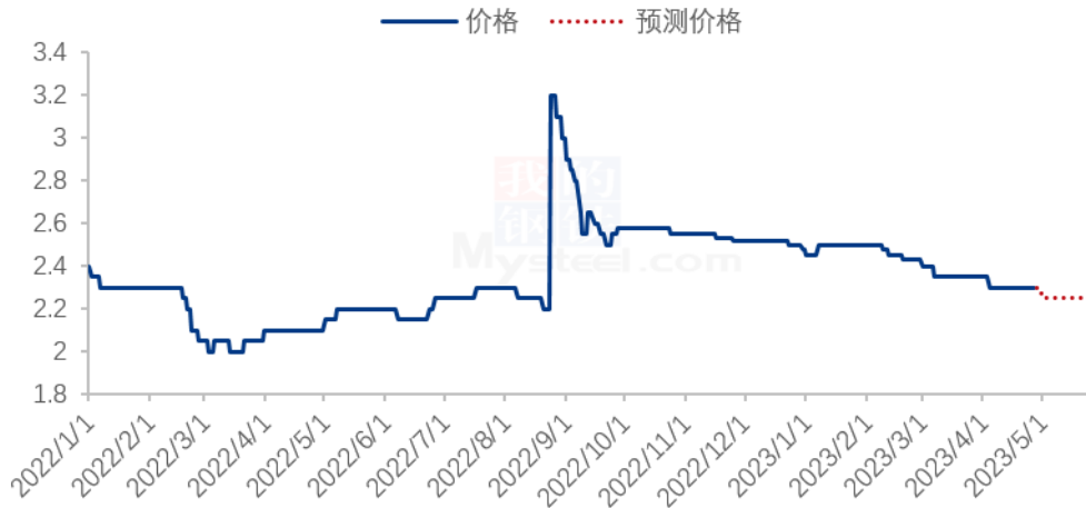
2023年赤峰张杂13号谷子价格走势预测（元/斤）

春播结束后，农户出货意向或将提高，流通环节货源增多，市场供需矛盾将进一步增加，关注后期终端需求情况，若终端小米需求持续萎缩，价格存在继续下滑可能。