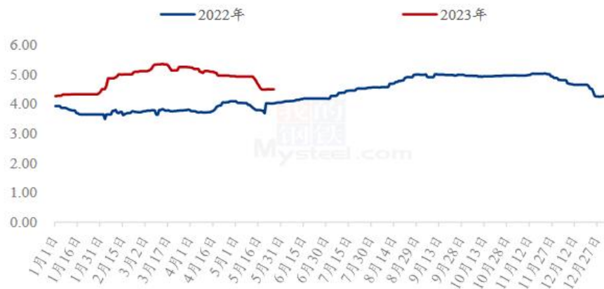
图 3 全国肉鸭均价走势图