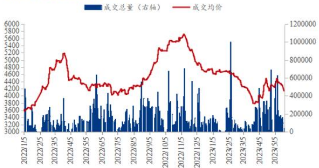
图 4 国内沿海区域豆粕主流出厂价