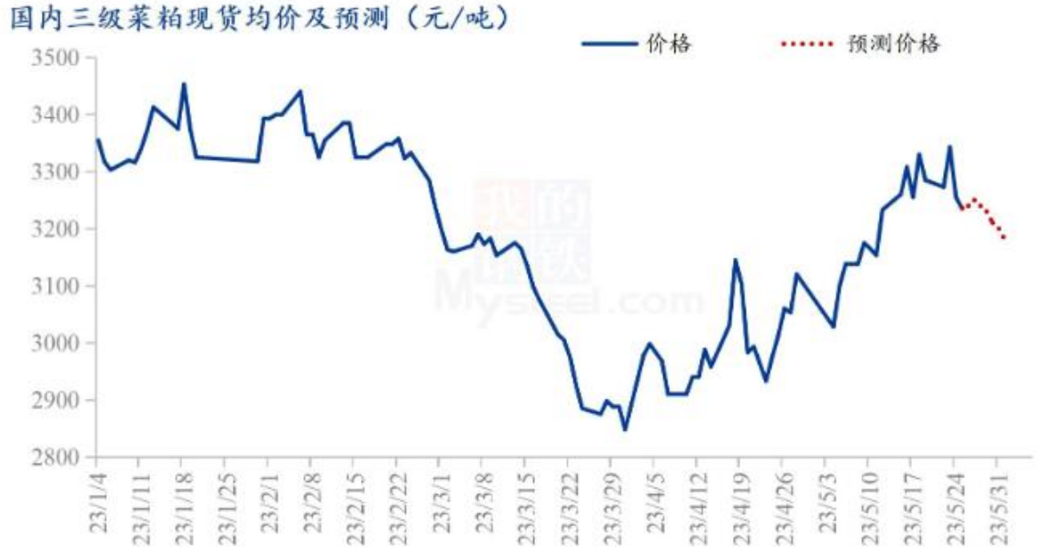
图5 国内菜粕现货均价及预测

差本周较为坚挺。本周菜粕呈现近强远弱格局，近月合约表现强势，沿海菜籽油厂菜粕供应预期减少，同时迎来菜粕传统需求旺季，本周全国菜粕库存小幅减少。当前菜粕与豆粕价差区间震荡向下，后市重点关注油脂、美豆及RM仓单情况。