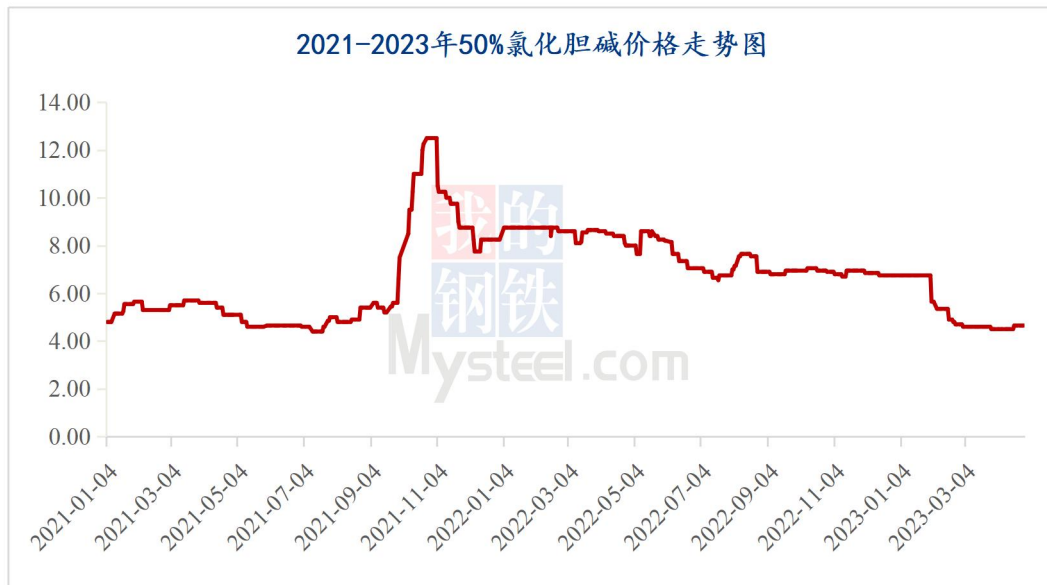
图 16 2021-2023 年氯化胆碱价格走势

本周国内氯化胆碱市场价格 4.6-4.8 元/kg。胆碱，本周受原料三甲胺价格小幅波动，胆碱工厂报价动态调整，后续主要关注其原料端三甲胺及环氧乙烷变化情况。