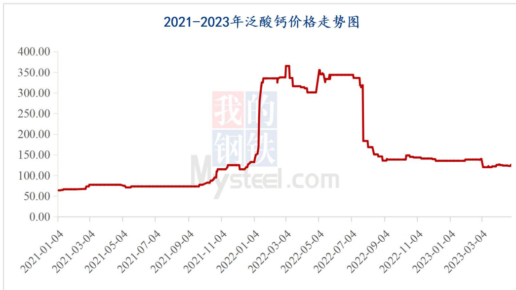
图 5 2021-2023 年泛酸钙价格走势图