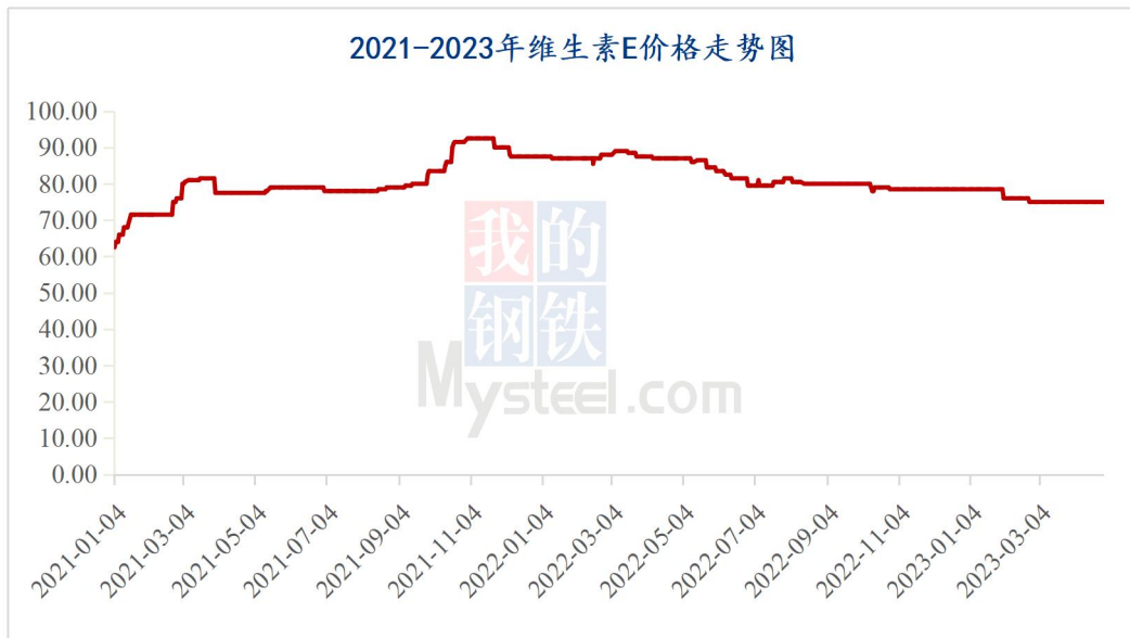
图 2 2021-2023 年维生素 E 价格走势图