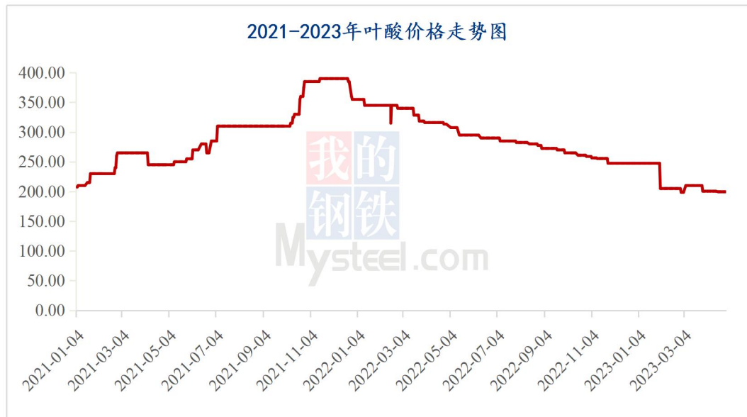
图 11 2021-2023 年叶酸价格走势