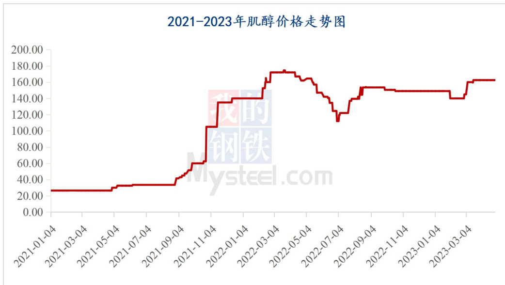
图 14 2021-2023 年肌醇价格走势图