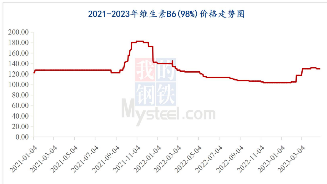
图 8 2021-2023 年维生素 B6 价格走势图