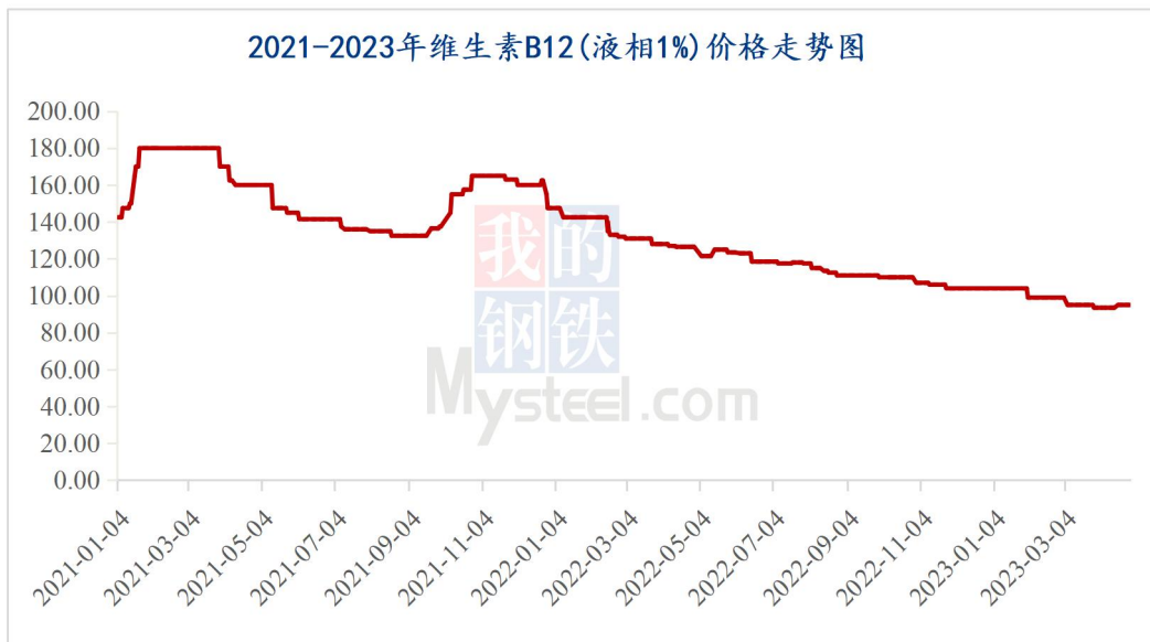
图 9 2021-2023 年维生素 B12 价格走势图

本周国内市场主流报价 94-96 元/kg，整体价格基本平稳，市场需求一般，价格较上周平稳运行。