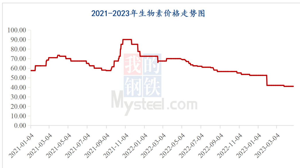
图 12 2021-2023 年生物素价格走势

本周国内 2%生物素市场价格在 40-43 元/kg，市场询单一般，交投价格平稳偏弱，部分价格略低，欧洲 2%生物素报价 4.10-4.40 欧元/kg。