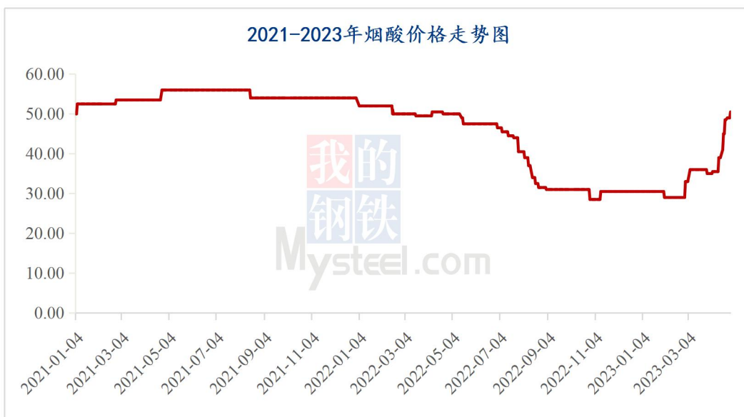
图 15 2021-2023 年烟酸价格走势图

本周国内市场主流报价 47-50 元/kg，市场成交较为活跃。受上游原料供应及年前低价接单等综合影响，导致年后各工厂交货相对紧张，主流工厂选择停报观望，市场供货暂时出现一定缺口，成交价格也随之小幅上涨。