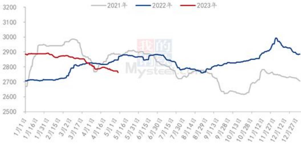
图 17 2021-2023 年全国玉米均价走势图