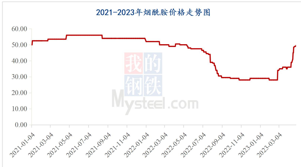
图 13 2021-2023 年烟酰胺价格走势图

本周国内市场主流报价 47-50 元/kg，由于上游原材料紧缺，产品供应出现缺口，工厂挺价意愿明显，交期基本延至第二季度，市场活跃度，国内外询单量明显增加，短期内小幅上涨趋势明显。