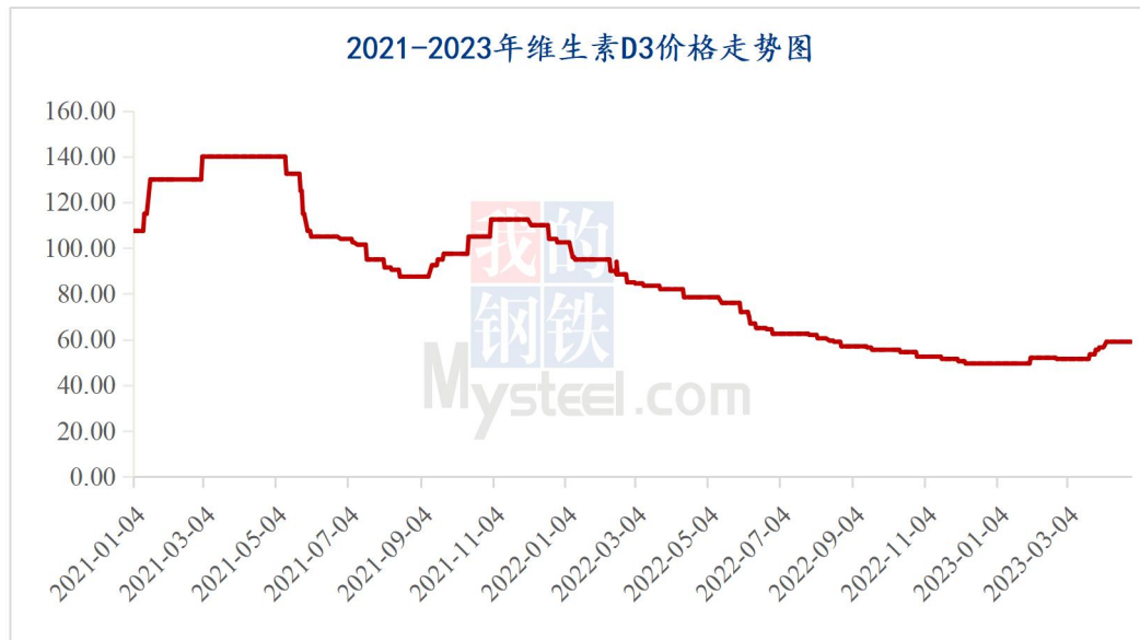
图 4 2021-2023 年维生素 D3 价格走势图

本周国内维生素 D3 国内市场主流价格为 58-60 元/kg，欧洲市场报价为 8.00-9.00 欧元/kg。市场需求一般，受市场信息影响，询单成交均有所活跃，经销渠道出货积极，价格偏强。4 月 3 日，受原料价格上涨等因素影响，天新药业饲料级维生素 D3 最新报价提高至 62 元/kg。市场需求偏淡，询单一般，经销渠道出货积极，价格平稳偏强。