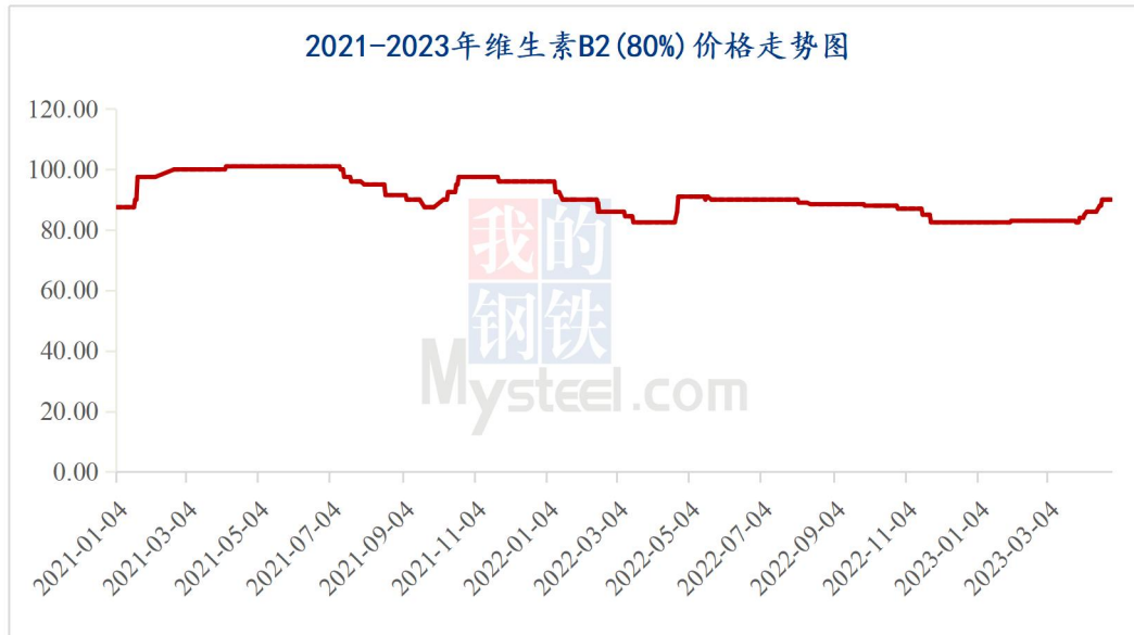
图 7 2021-2023 年维生素 B2（80%）价格走势图

本周国内 VB2(80%)市场价格 88-92 元/kg，欧洲市场价格 15.00-17.00 欧元/kg，VB2(98%)市场价格 330-350 元/kg。市场需求一般，上游工厂上调报价或停报，整体报价有维持平稳，根据品牌、日期不同，局部价格略低。