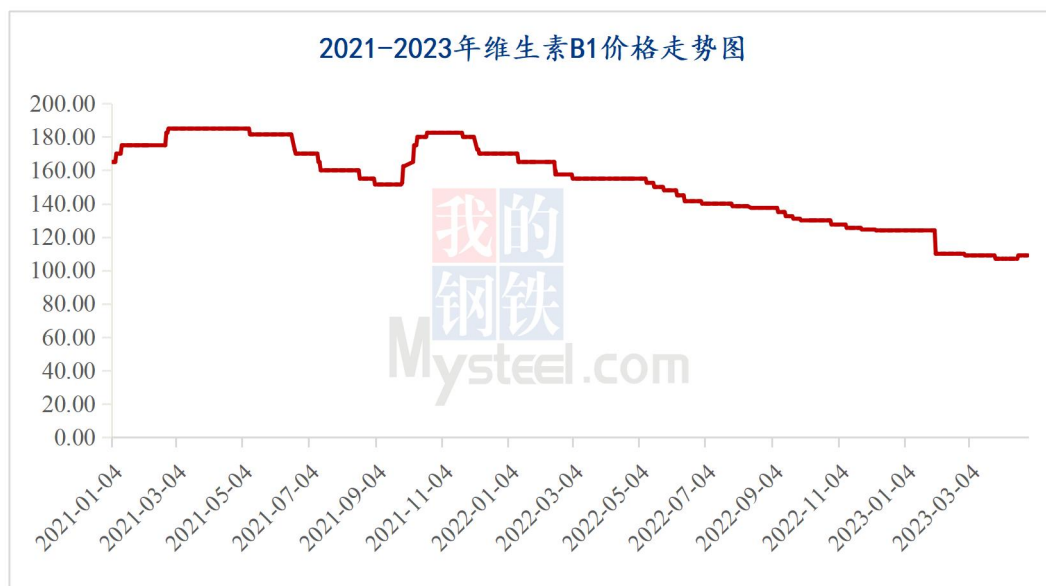
图 6 2021-2023 年维生素 B1 价格走势图

本周国内维生素 B1 市场报价在 108-112 元/kg，下游需求较弱，上游工厂挺价意愿较强，市场观望为主，市场询单较为平淡，价格平稳略强，4 月 21 日，受维生素 B1 主要原材料价格上涨影响，兄弟科技硝酸 B1 报价 120 元/kg，盐酸 B1 报价 150 元/kg。