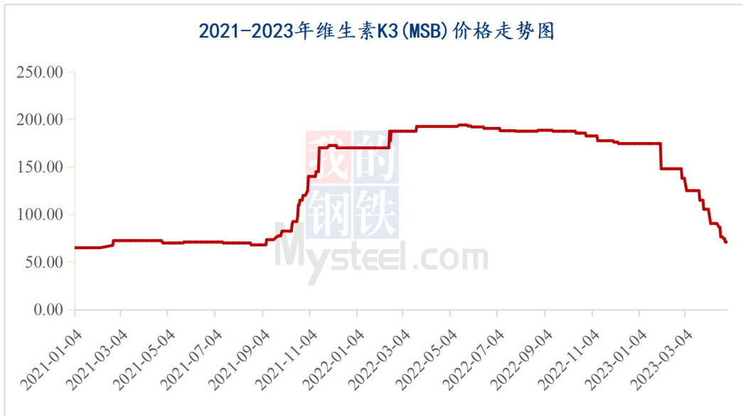
图 10 2021-2023 年维生素 K3 价格走势图

本周国内维生素 K3（MSB）市场主流价格在 70-73 元/kg，MNB 市场价格在 80-85 元/kg。下游需求寡淡，受市场信息影响，市场价格止跌，议价成交为主，受烟酰胺供应偏紧影响，维生素 K3 MNB 发货紧张。