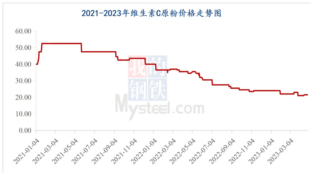
图 3 2021-2023 年维生素 C 价格走势图

本周 VC 原粉国内市场报价 21-22 元/kg，下游需求一般，终端适量补货，部分品牌略低一些。