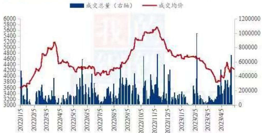
全国豆粕成交价量走势图（单位：吨）