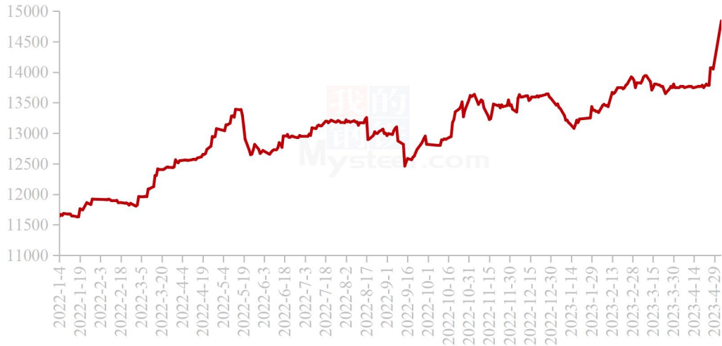
国内秘鲁68%超级蒸汽鱼粉进口成本走势图（单位：元/吨）