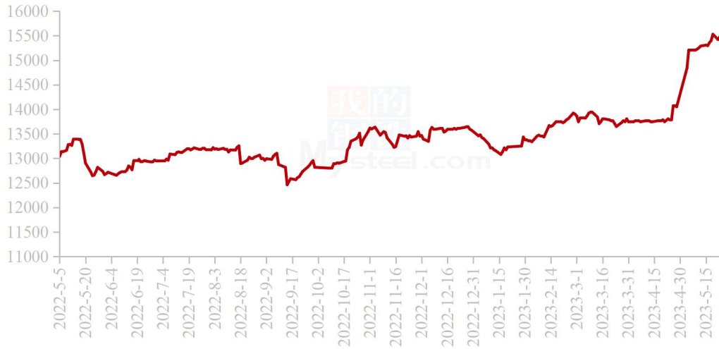
国内秘鲁68%超级蒸汽鱼粉进口成本走势图（单位：元/吨）