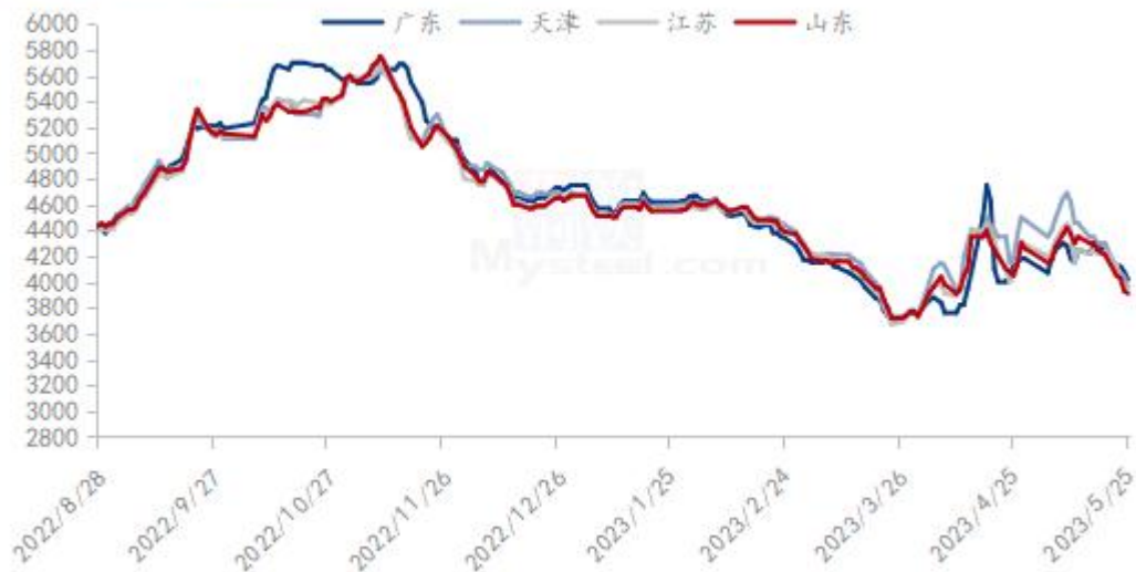
国内沿海区域豆粕主流出厂价（元/吨）