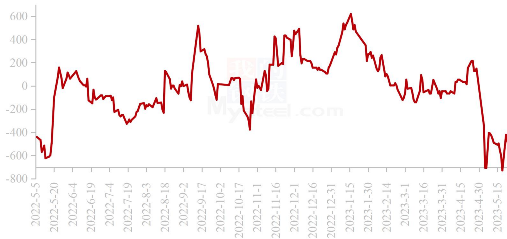
国内秘鲁68%超级蒸汽鱼粉进口利润走势图（单位：元/吨）