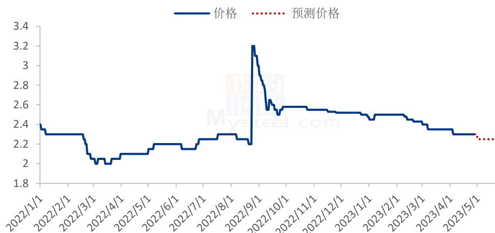
2023年赤峰张杂13号谷子价格走势预测（元/斤）

注：新陈粮交接，9月份开始市场流通新粮为主，Mysteel 农产品开始更新新粮报价。