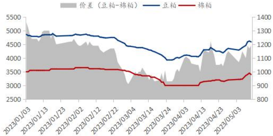
图 1 棉粕和豆粕价差对比走势图