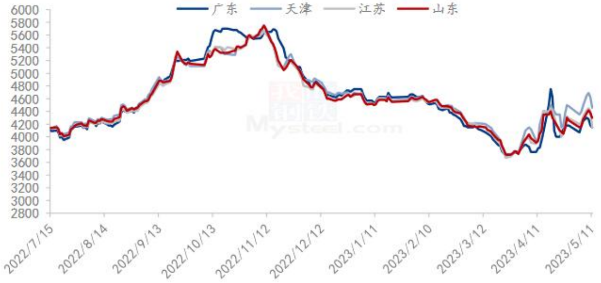
图 4 国内沿海区域豆粕主流出厂价