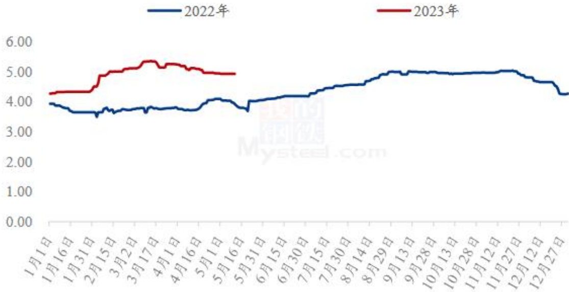
图 3 全国肉鸭均价走势图