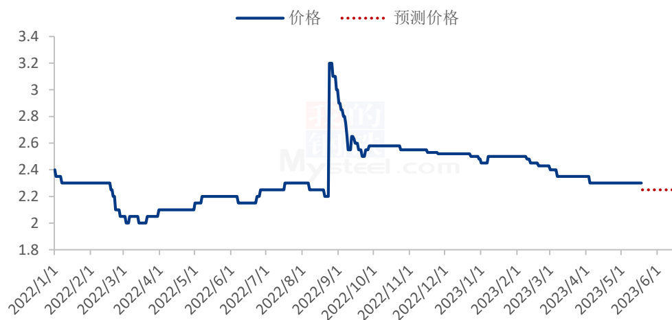
2023年赤峰张杂13号谷子价格走势预测（元/斤）

注：新陈粮交接，9月份开始市场流通新粮为主，Mysteel农产品开始更新新粮报价。