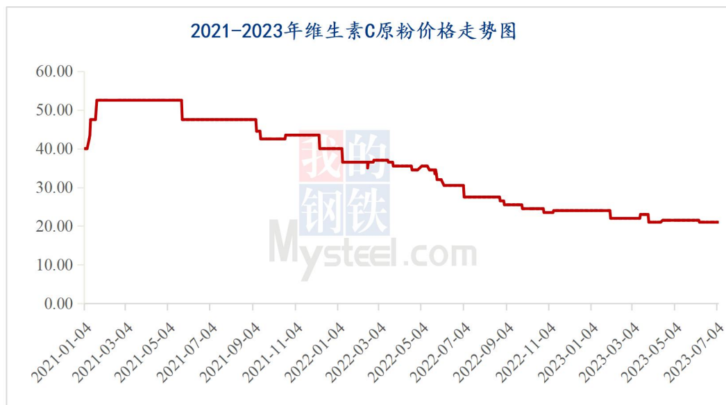
图 3 2021-2023 年维生素 C 价格走势图

本周 VC 原粉国内市场报价 21-22 元/kg，价格平稳，下游需求一般，终端适量补货，部分品牌略低一些。