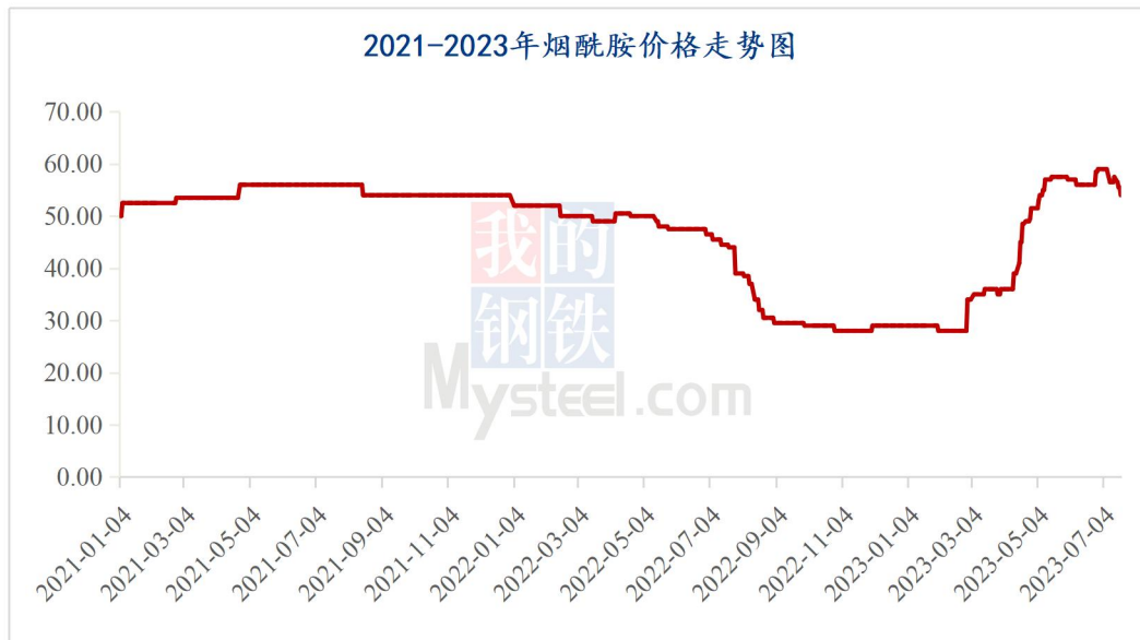
图 13 2021-2023 年烟酰胺价格走势