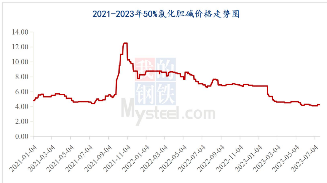
图 16 2021-2023 年氯化胆碱价格走势