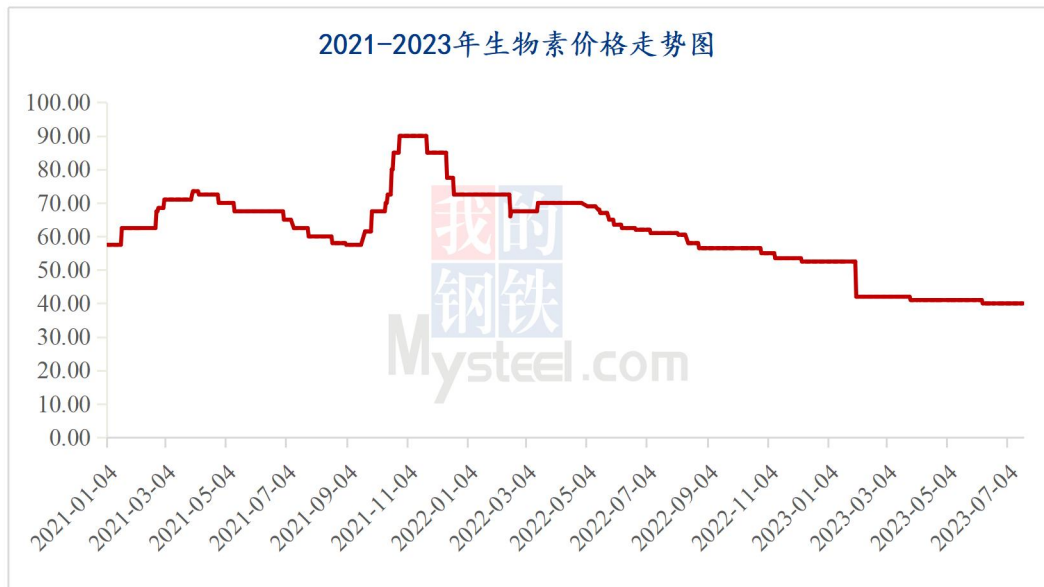
图 12 2021-2023 年生物素价格走势

本周国内 2%生物素市场价格在 39-42 元/kg，市场询单一般，交投价格平稳偏弱，部分价格略低，欧洲 2%生物素报价 4.05-4.30 欧元/kg。