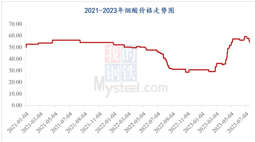
图 15 2021-2023 年烟酸价格走势图

本周国内市场主流报价 55-57 元/kg，市场成交较为平稳。受上游原料供应及年前低价接单等综合影响，导致年后各工厂交货相对紧张，主流工厂选择停报观望，市场供货暂时出现一定缺口，成交价格也随之小幅上涨。