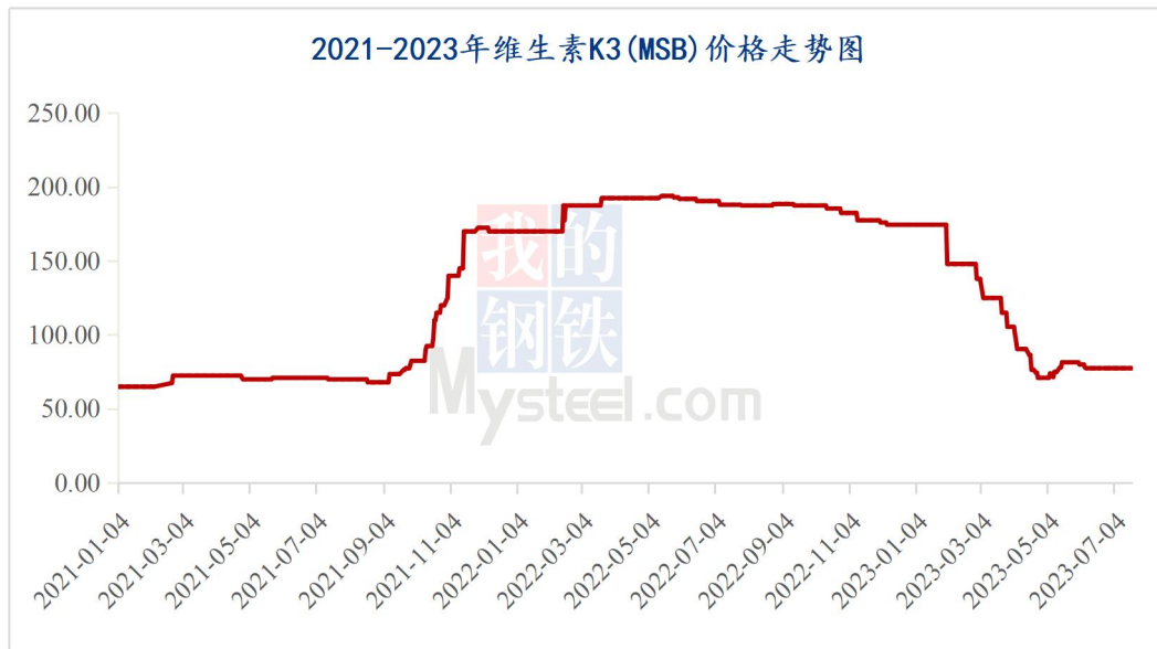
图 10 2021-2023 年维生素 K3 价格走势图