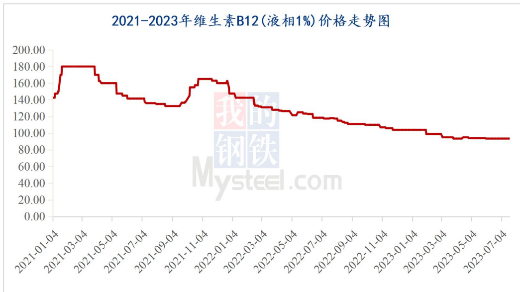
图 9 2021-2023 年维生素 B12 价格走势

本周国内市场主流报价 93-95 元/kg，整体价格基本平稳，市场需求一般，价格较上周平稳运行。