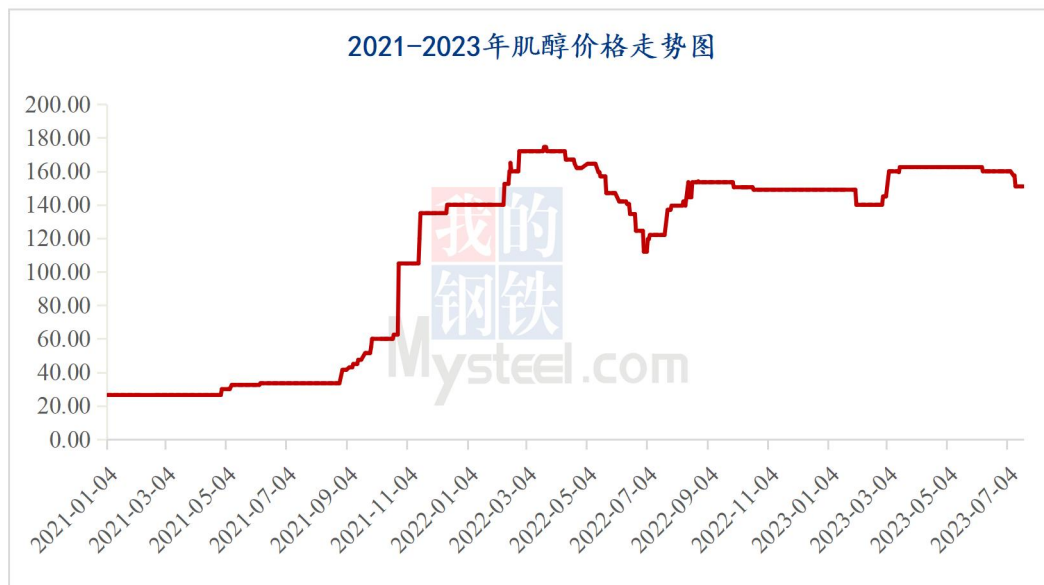
图 14 2021-2023 年肌醇价格走势

本周国内肌醇主流厂家提高报价至 140-162 元/kg，随着市场货源持续消耗，市场货源逐渐减少，需求较弱，后期需关注工厂生产和发货情况。