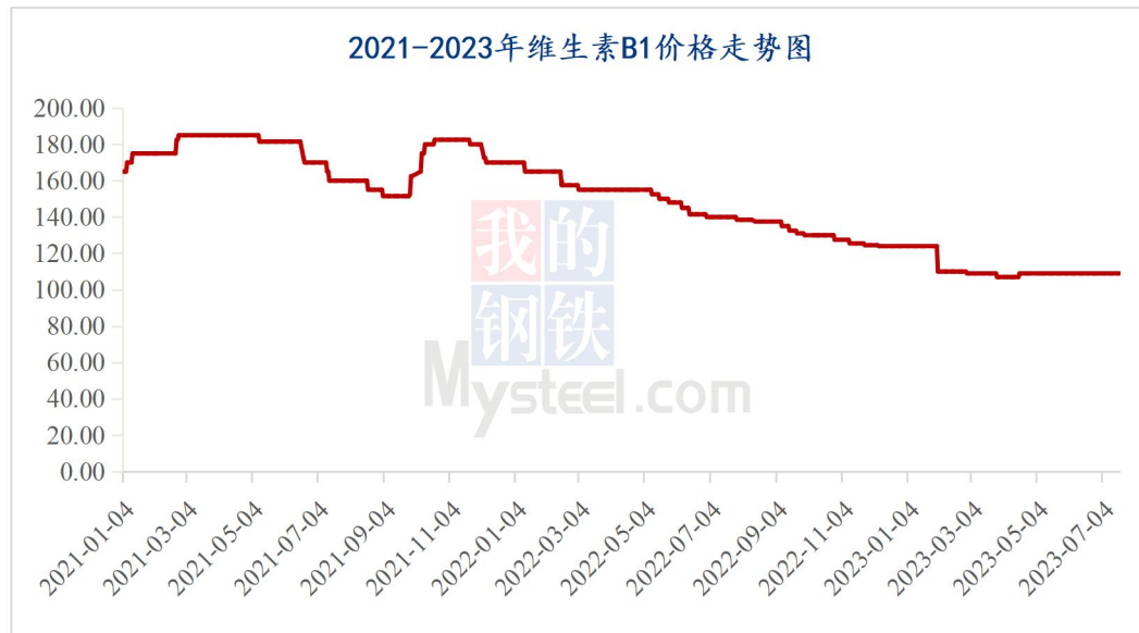
图 6 2021-2023 年维生素 B1 价格走势图

本周国内维生素 B1（80%）市场报价在 108-112 元/kg，下游需求较弱，上游工厂挺价意愿较强，市场观望为主，市场询单较为平淡，价格平稳略强，6 月 15 日，天新药业计划于 7 月 1 日开始，进行为期 8-10 周的夏季停产检修。4 月 21 日，受维生素 B1 主要原材料价格上涨影响，兄弟科技硝酸 B1 报价 120 元/kg，盐酸 B1 报价 150 元/kg。