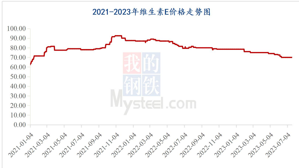
图 2 2021-2023 年维生素 E 价格走势图