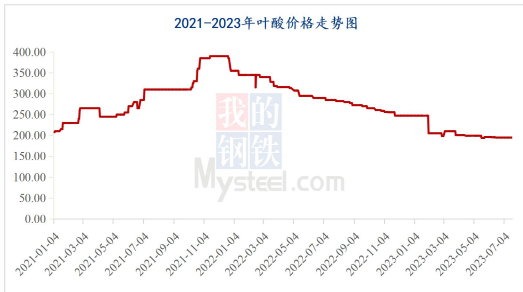
图 11 2021-2023 年叶酸价格走势图

本周国内市场主流报价 192-198 元/kg，叶酸目前总体需求不旺，市场成交一般，价格平稳。6月15日，天新药业饲料级叶酸停报停签。