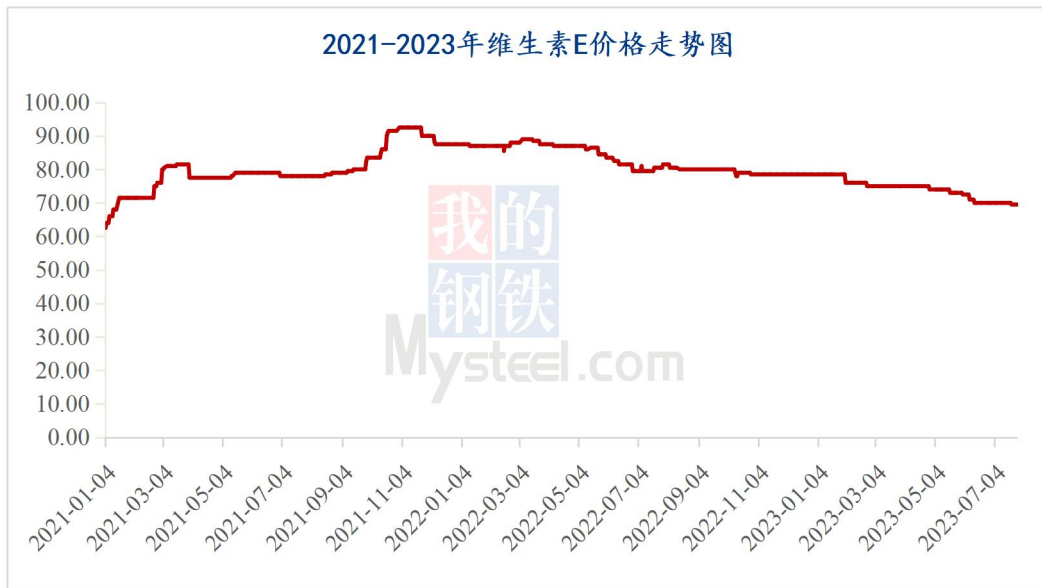
图 2 2021-2023 年维生素 E 价格走势图