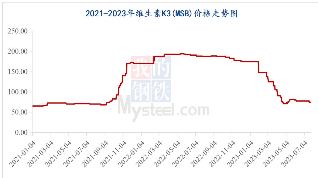
图 10 2021-2023 年维生素 K3 价格走势