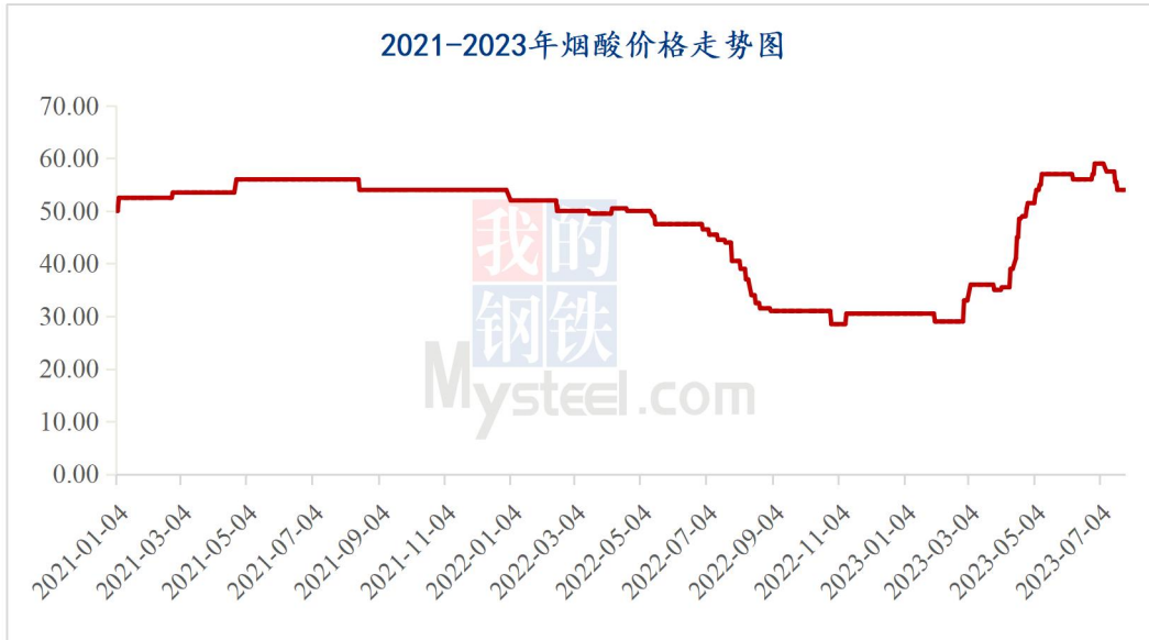
图 15 2021-2023 年烟酸价格走势图

本周国内市场主流报价 55-57 元/kg，市场成交较为平稳。受上游原料供应及年前低价接单等综合影响，导致年后各工厂交货相对紧张，主流工厂选择停报观望，市场供货暂时出现一定缺口，成交价格也随之小幅上涨。