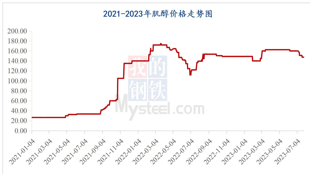
图 14 2021-2023 年肌醇价格走势

本周国内肌醇主流厂家提高报价至 140-162 元/kg，随着市场货源持续消耗，市场货源逐渐减少，需求较弱，后期需关注工厂生产和发货情况。