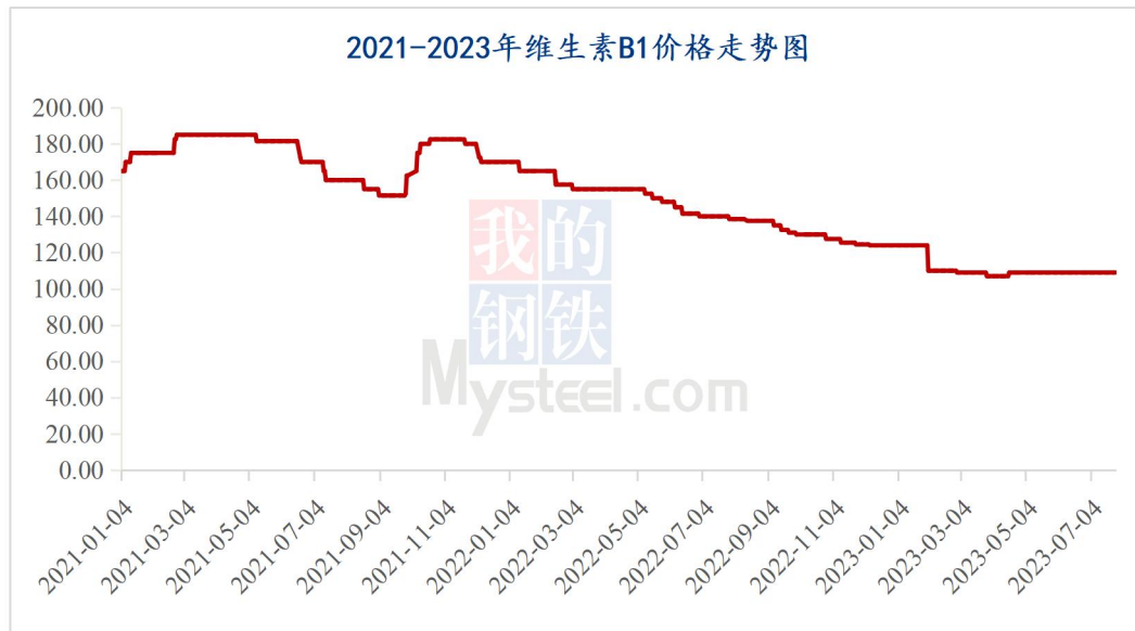
图 6 2021-2023 年维生素 B1 价格走势

本周国内维生素 B1（80%）市场报价在 108-112 元/kg，下游需求较弱，上游工厂挺价意愿较强，市场观望为主，市场询单较为平淡，价格平稳略强，6 月 15 日，天新药业计划于 7 月 1 日开始，进行为期 8-10 周的夏季停产检修。4 月 21 日，受维生素 B1 主要原材料价格上涨影响，兄弟科技硝酸 B1 报价 120 元/kg，盐酸 B1 报价 150 元/kg。