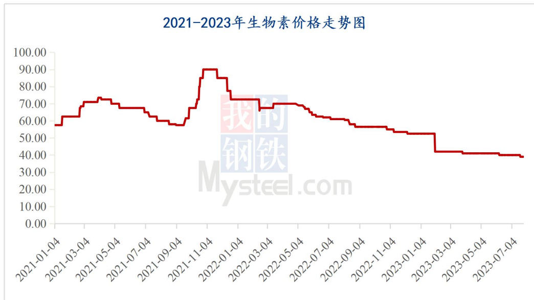
图 12 2021-2023 年生物素价格走势图

本周国内 2%生物素市场价格在 39-42 元/kg，市场询单一般，交投价格平稳偏弱，部分价格略低，欧洲 2%生物素报价 4.05-4.30 欧元/kg。