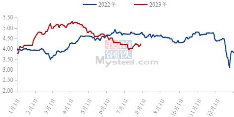
图 19 全国白羽肉鸡均价走势图