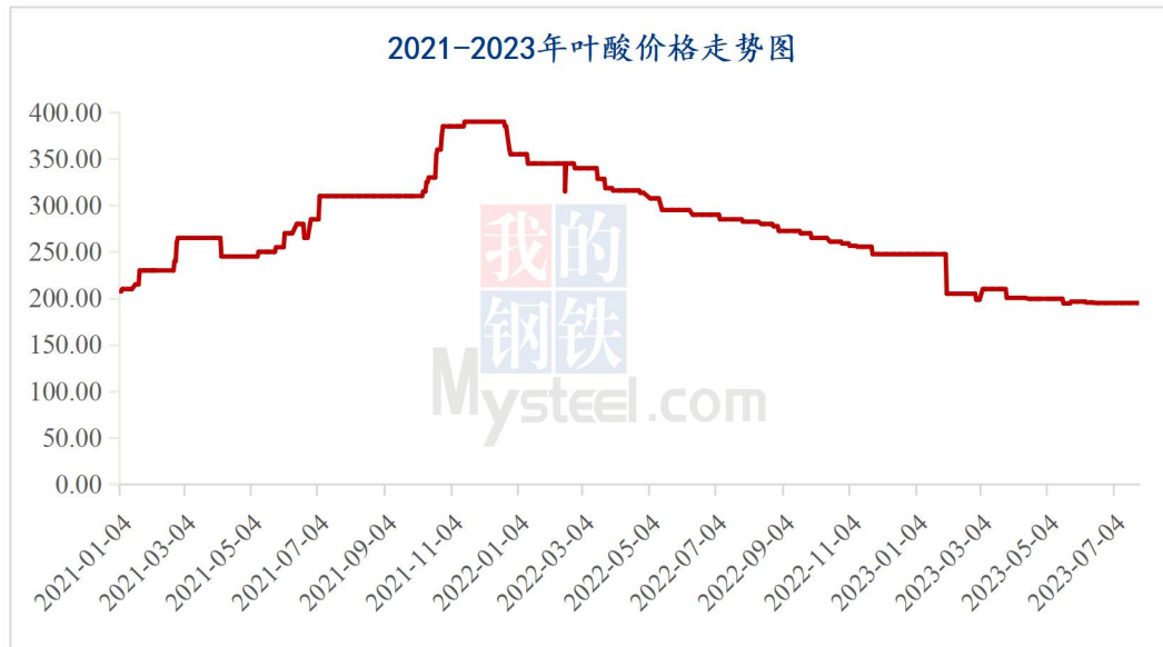
图 11 2021-2023 年叶酸价格走势

本周国内市场主流报价 192-198 元/kg，叶酸目前总体需求不旺，市场成交一般，价格平稳。6月15日，天新药业饲料级叶酸停报停签。