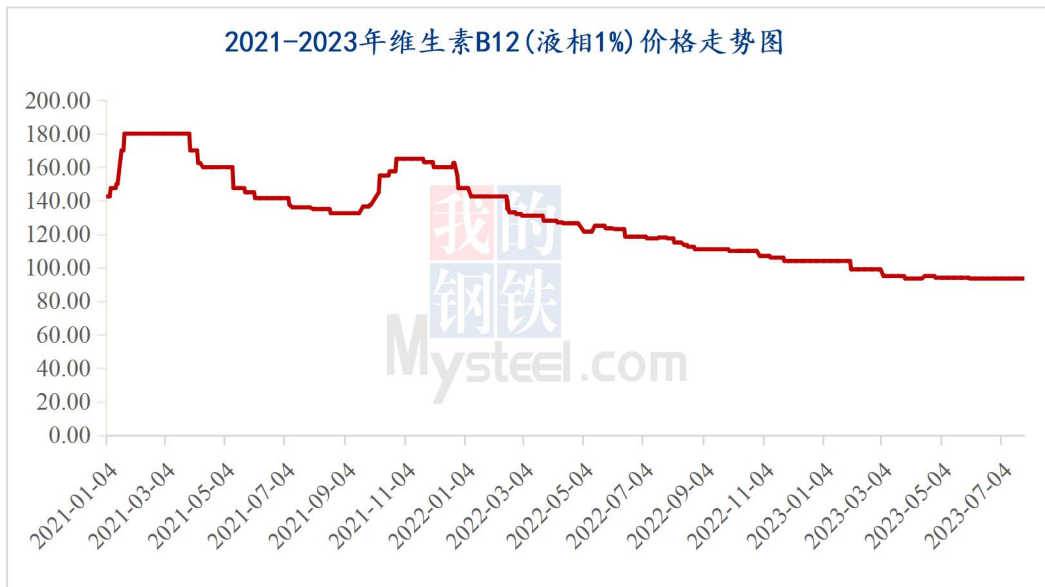
图 9 2021-2023 年维生素 B12 价格走势图

本周国内市场主流报价 93-95 元/kg，整体价格基本平稳，市场需求一般，价格较上周平稳运行。