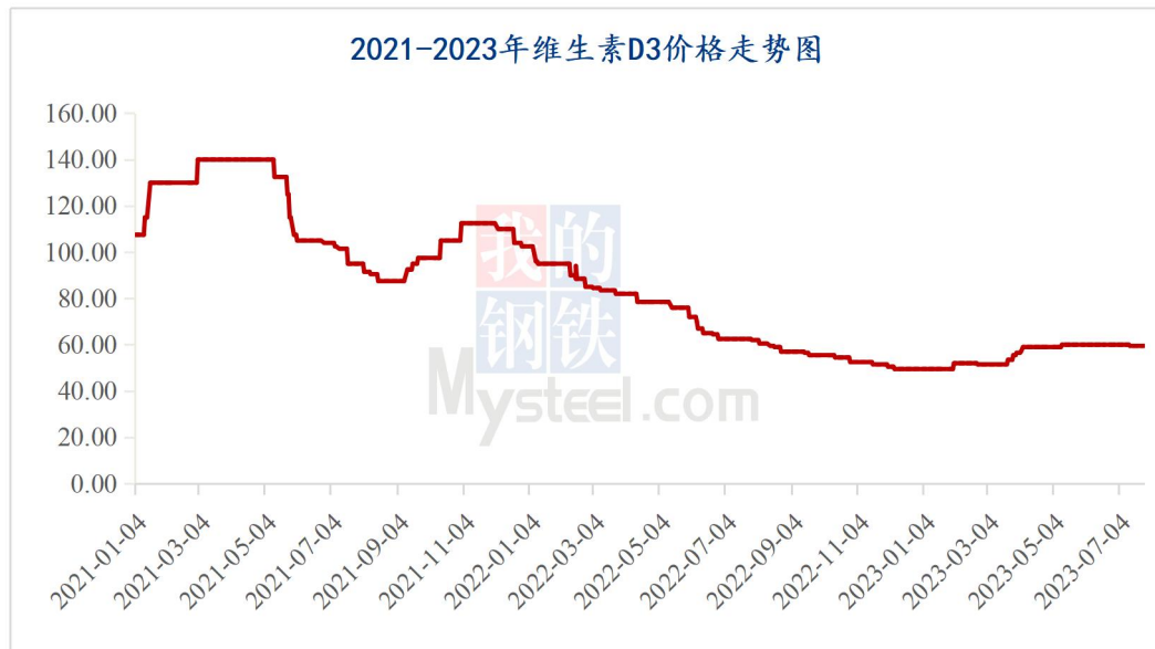
图 4 2021-2023 年维生素 D3 价格走势图

本周国内维生素 D3 国内市场主流价格为 58-62 元/kg，欧洲市场报价为 7.00-7.50 欧元/kg。询单一般，经销渠道出货积极，价格平稳偏强。