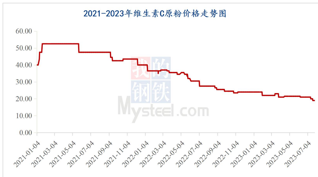
图 3 2021-2023 年维生素 C 价格走势图

本周 VC 原粉国内市场报价 18-22 元/kg，价格平稳，下游需求一般，终端适量补货，部分品牌略低一些。