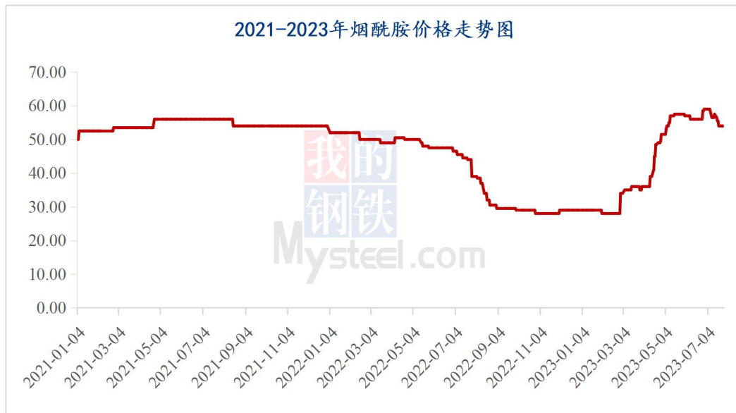
图 13 2021-2023 年烟酰胺价格走势