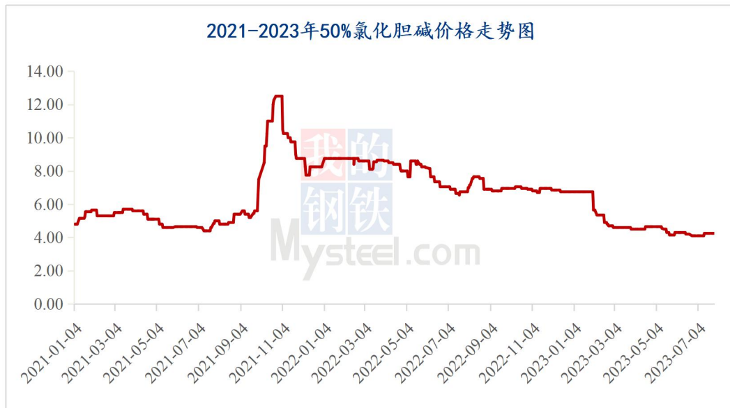
图 16 2021-2023 年氯化胆碱价格走势