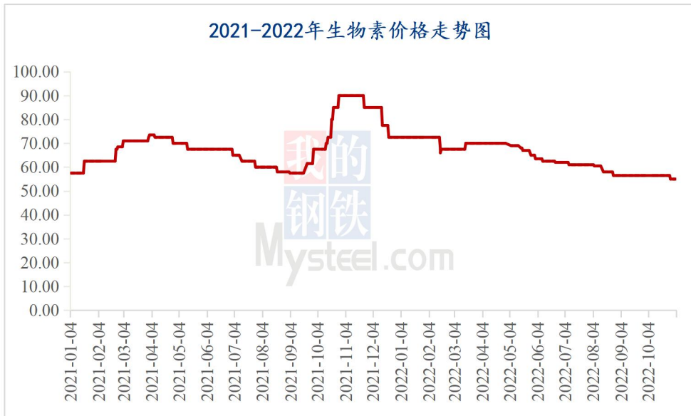
图 12 2021-2022 年生物素价格走势

本周国内 2%生物素市场价格在 45-48 元/kg，市场询单一般，交投价格平稳偏弱，部分价格略低。欧洲 2%生物素报价 5.60-6.10 欧元/kg。大丰海嘉诺 10 月 1 日起进行为期 40 天的停产检修。