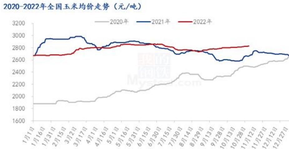
图 17 2020-2022 年全国玉米均价走势图

本周全国玉米均价 2824 元/吨，较上周上涨 8 元/吨，上涨幅度 0.28%。主产区玉米报价坚定，下游到货成本高位，国内产销区玉米价格整体偏强。东北地区地趴粮销售较慢，农户要价坚定和局部物流受限，潮粮上量整体有限，需求有所好转，站台发运量提升，供应偏紧，价格高位。华北企业到货以本地粮购销为主，农户售粮积极性不高，深加工企业门前到货量维持低位，饲料企业干粮收购无量，企业价格持续上涨。南方销区受到货成本高位提振，本周价格上涨，饲料企业刚性补库为主，个别地区逐渐开始建库，关注产区售粮进度和后期进口玉米价格。