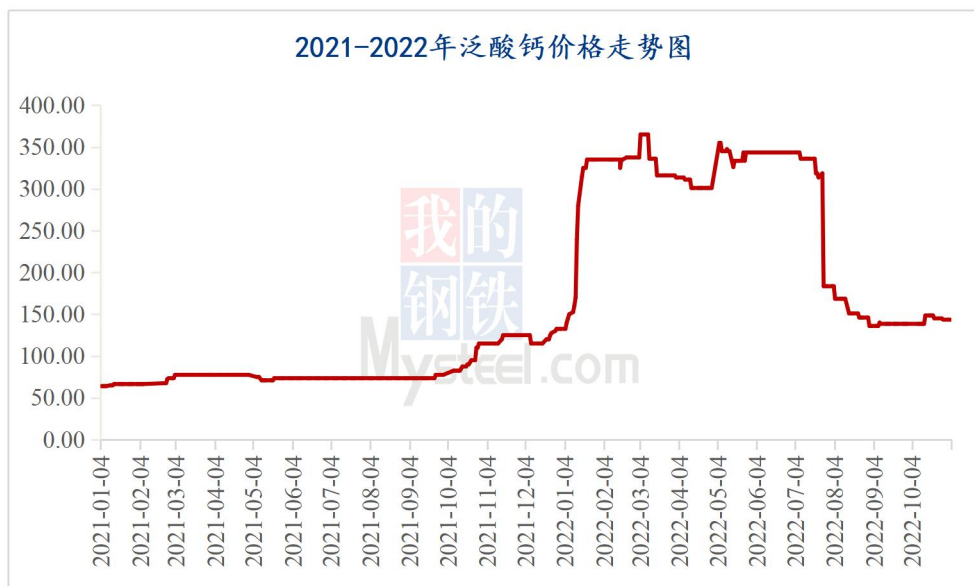
图 5 2021-2022 年泛酸钙价格走势图

本周国内泛酸钙市场主流价格在 160-175 元/kg，市场需求一般，前期价格经历大幅下滑后趋于缓和，整体价格基本平稳，略有小幅波动。欧洲市场主流报价 23.00-27.00 欧元/kg，价格平稳。