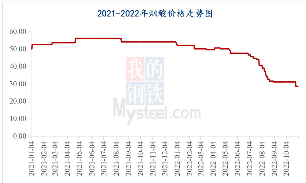
图 15 2021-2022 年烟酸价格走势图