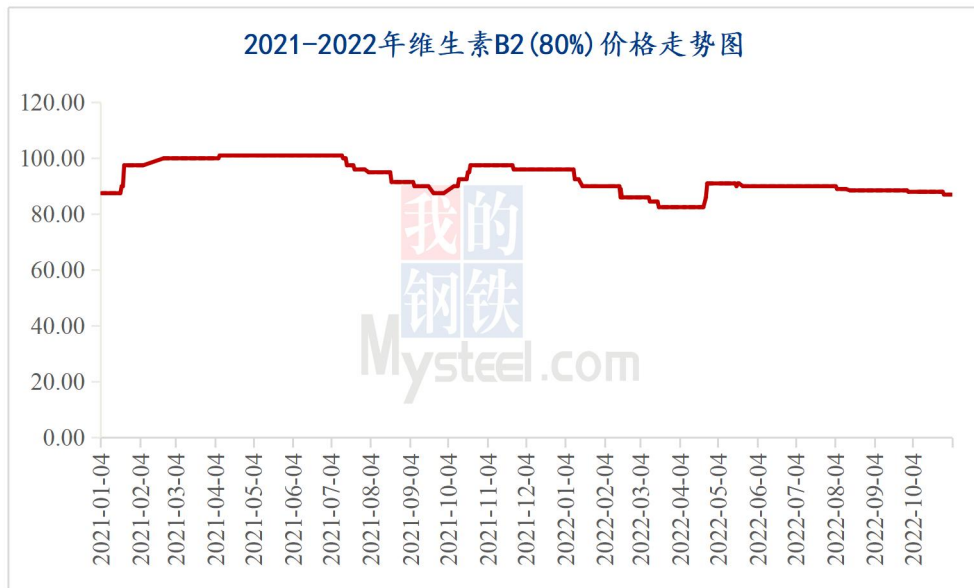
图 7 2021-2022 年维生素 B2 (80%) 价格走势图