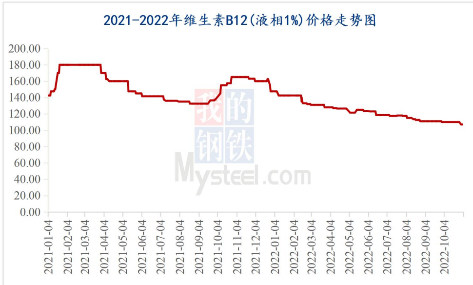
图 9 2021-2022 年维生素 B12 价格走势