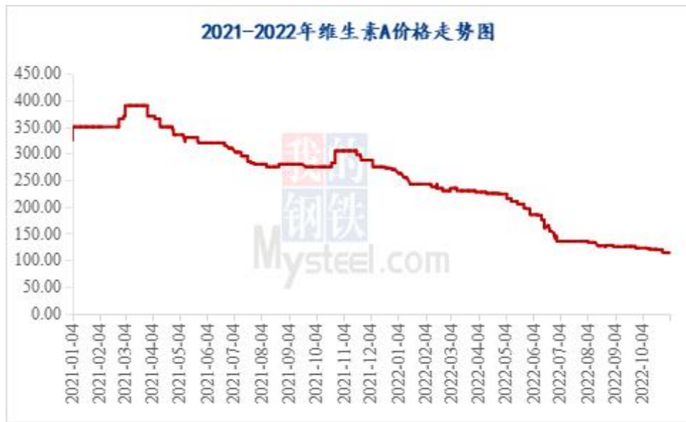
图 1 2022 年维生素 A 价格走势图