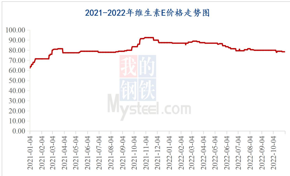
图 3 2021-2022 年维生素 E 价格走势

本周 VC 原粉国内市场报价 21-23 元/kg，下游需求一般，终端适量补货，主流厂家 11 月 2 日起暂停对外报价，市场关注度增加，出口 FOB 报价在 2.6-2.8 美元，部分品牌略低一些。