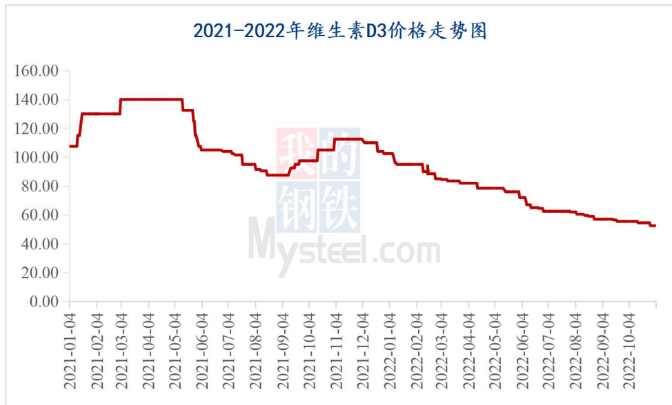
图 4 2021-2022 年维生素 D3 价格走势图