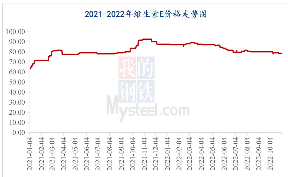
图 2 2021-2022 年维生素 E 价格走势图

本周国内维生素 E 市场报价 80-82 元/kg，下游需求一般，终端适量补货，市场价格平稳偏弱，根据品牌、日期不同，局部有低价货源。欧洲市场贸易商报价 8.80-9.30 欧元/kg。