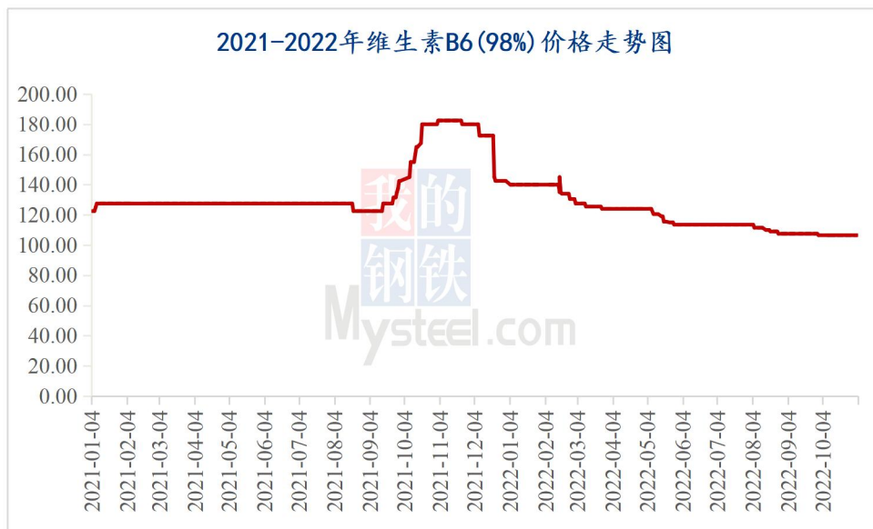
图 8 2021-2022 年维生素 B6 价格走势图