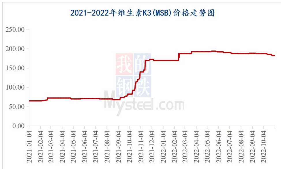
图 10 2021-2022 年维生素 K3 价格走势图