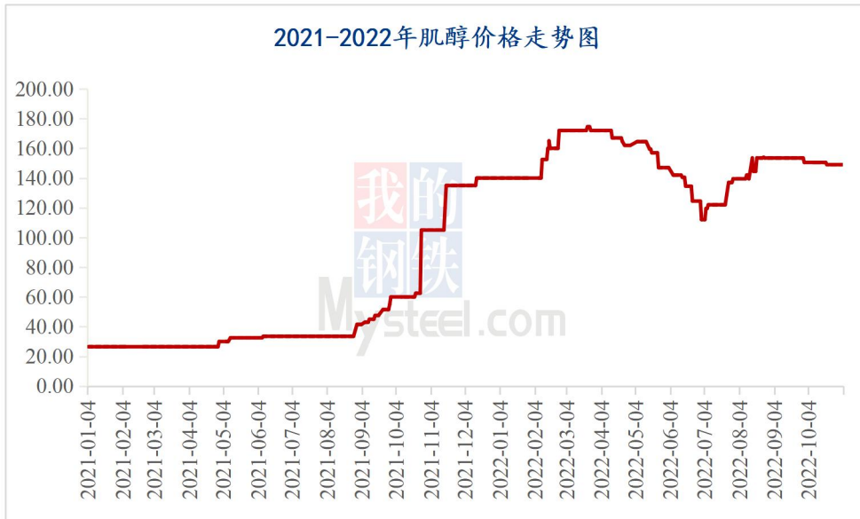
图 14 2021-2022 年肌醇价格走势

本周国内市场主流报价 150-160 元/kg，整体价格基本平稳，略有小幅波动。