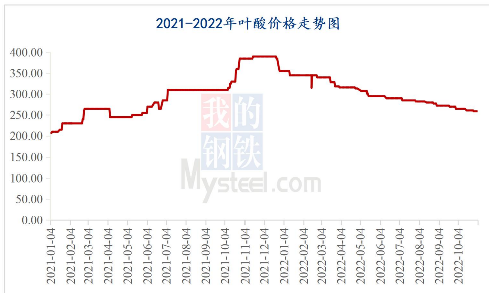
图 11 2021-2022 年叶酸价格走势图