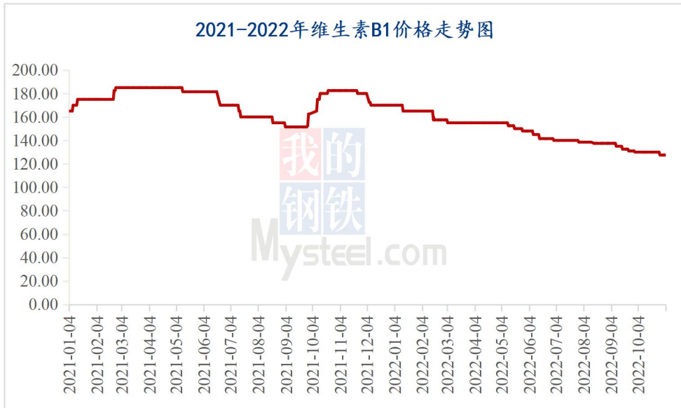
图 6 2021-2022 年维生素 B1 价格走势

本周国内维生素 B1 市场报价在 125-130 元/kg，受成本上涨影响，B1 工厂挺价意愿较强，下游需求偏弱，询单平平，市场价格维持弱稳。