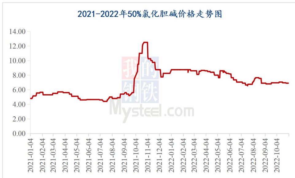
图 16 2021-2022 年氯化胆碱价格走势图

本周国内氯化胆碱市场价格 6.8-7.0 元/kg。胆碱主要原料三甲胺价格高位波动，胆碱工厂报价动态调整，后期需关注胆碱成本端价格变化及生产出货情况。