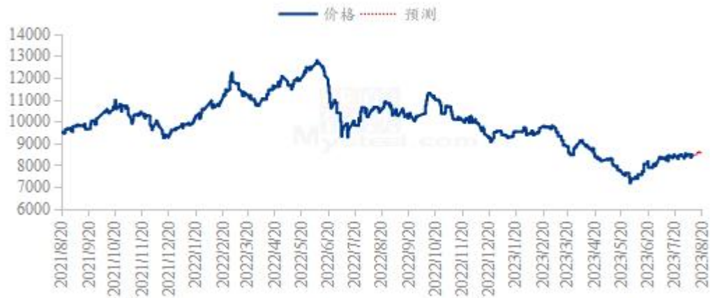
豆油价格走势预测图（元/吨）