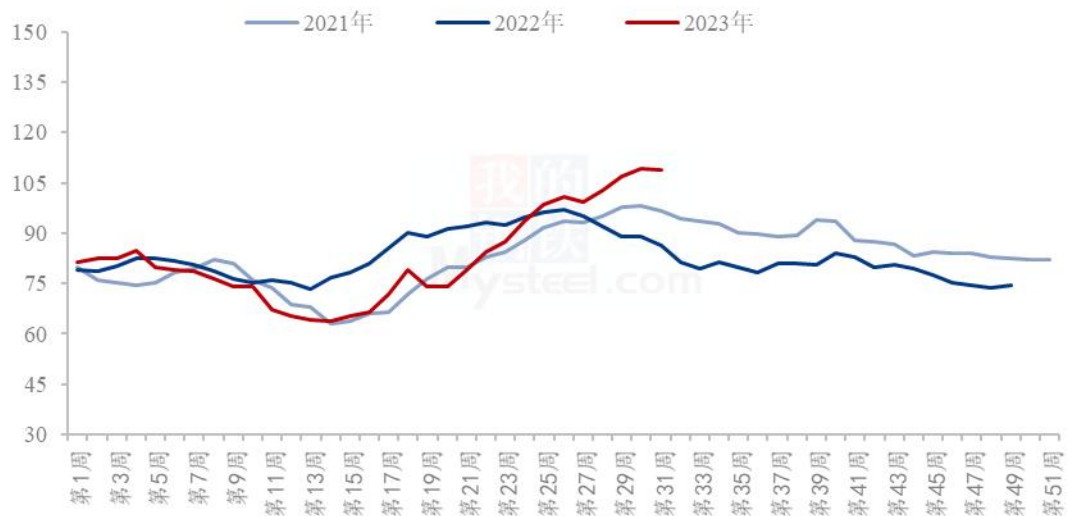
全国重点油厂豆油库存统计 (万吨)

据 Mysteel 调研显示，截至 2023 年 8 月 4 日（第 31 周），全国重点地区豆油商业库存约 108.83 万吨，较上次统计减少 0.25 万吨，减幅 0.23%。