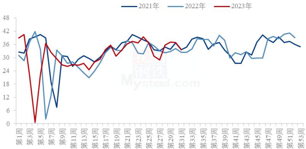
主要油厂豆油周度产量统计 (万吨)