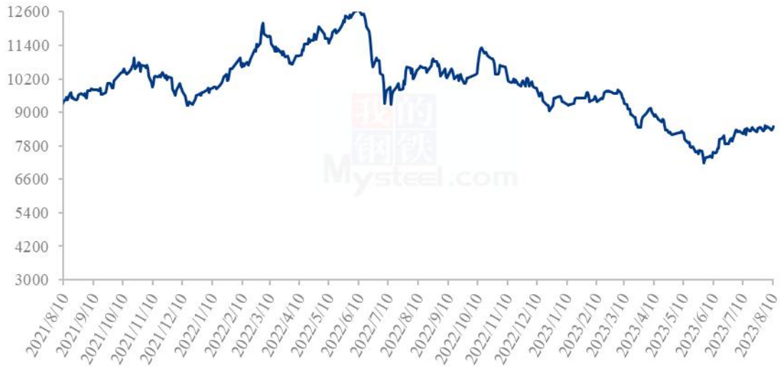
全国豆油均价走势图（元/吨）