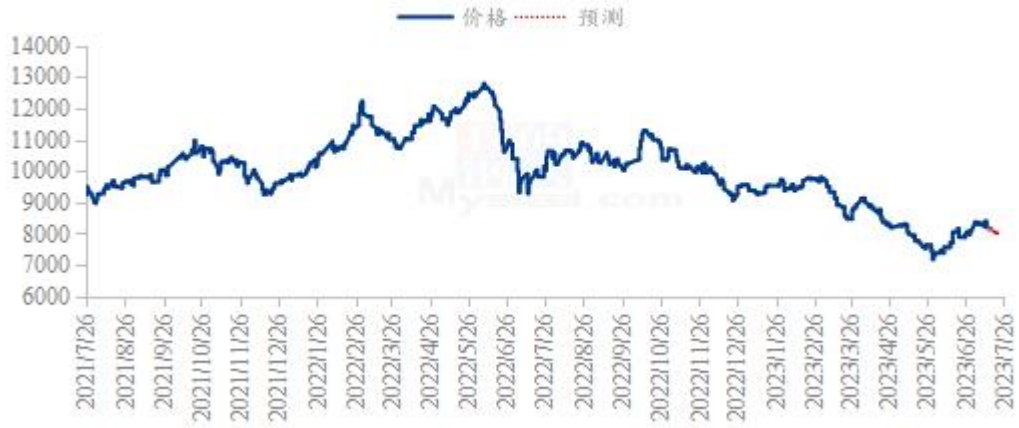
豆油价格走势预测图 (元/吨)