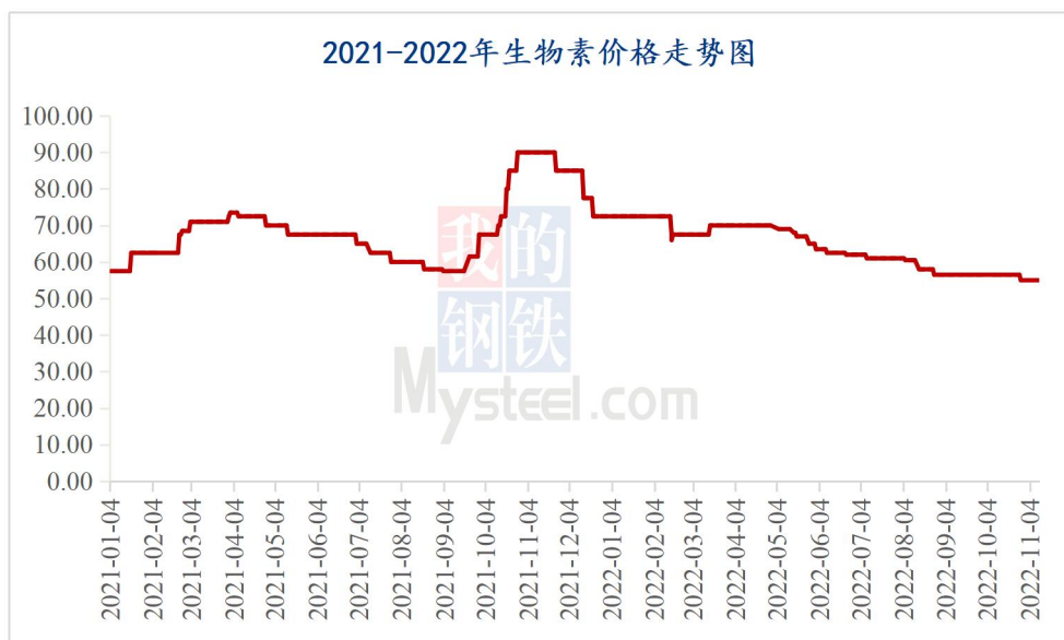
图 12 2021-2022 年生物素价格走势

本周国内 2%生物素市场价格在 45-48 元/kg，市场询单一般，交投价格平稳偏弱，部分价格略低。欧洲 2%生物素报价 5.60-6.10 欧元/kg。大丰海嘉诺 10 月 1 日起进行为期 40 天的停产检修。