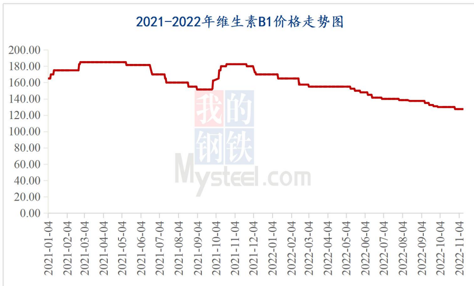
图 6 2021-2022 年维生素 B1 价格走势