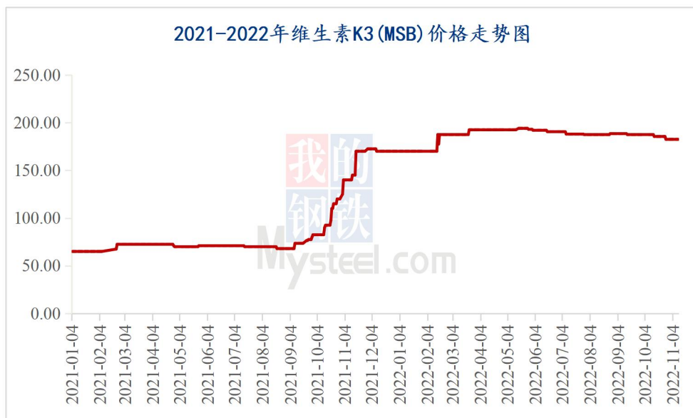
图 10 2021-2022 年维生素 K3 价格走势

本周国内维生素 K3（MSB）市场主流价格在 170-178 元/kg，MNB 市场价格在 190-205 元/kg。市场需求一般，询单略平淡，K3 价格基本平稳。受原材料供应偏紧影响，主流维生素 K3 工厂停报。