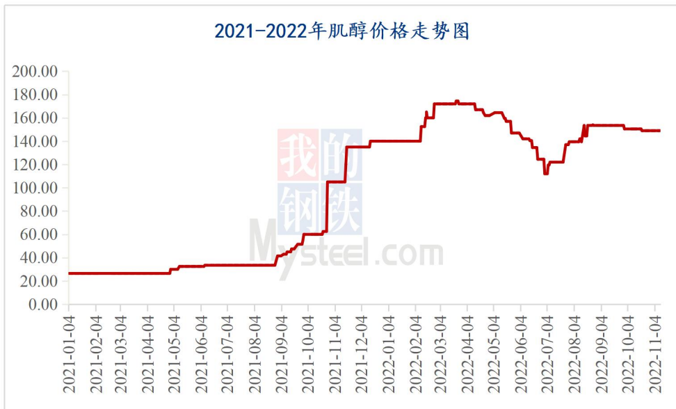
图 14 2021-2022 年肌醇价格走势