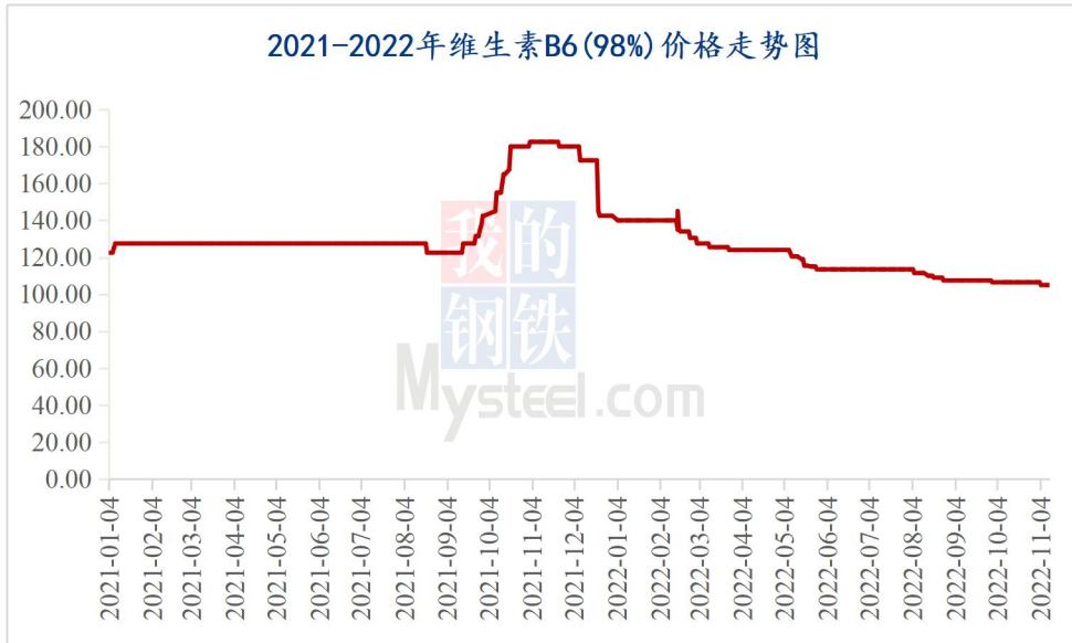
图 8 2021-2022 年维生素 B6 价格走势图