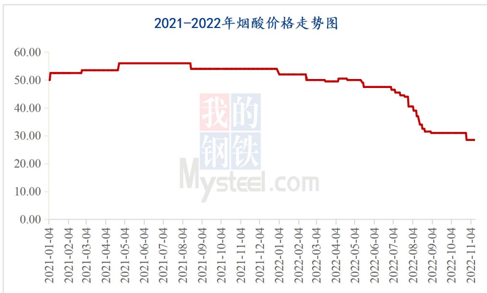
图 15 2021-2022 年烟酸价格走势