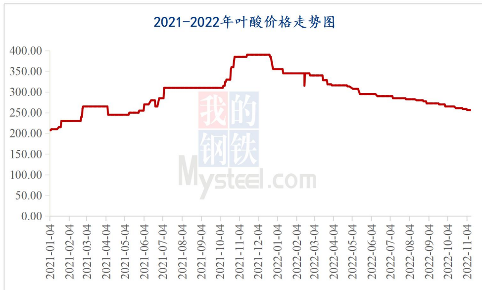
图 11 2021-2022 年叶酸价格走势