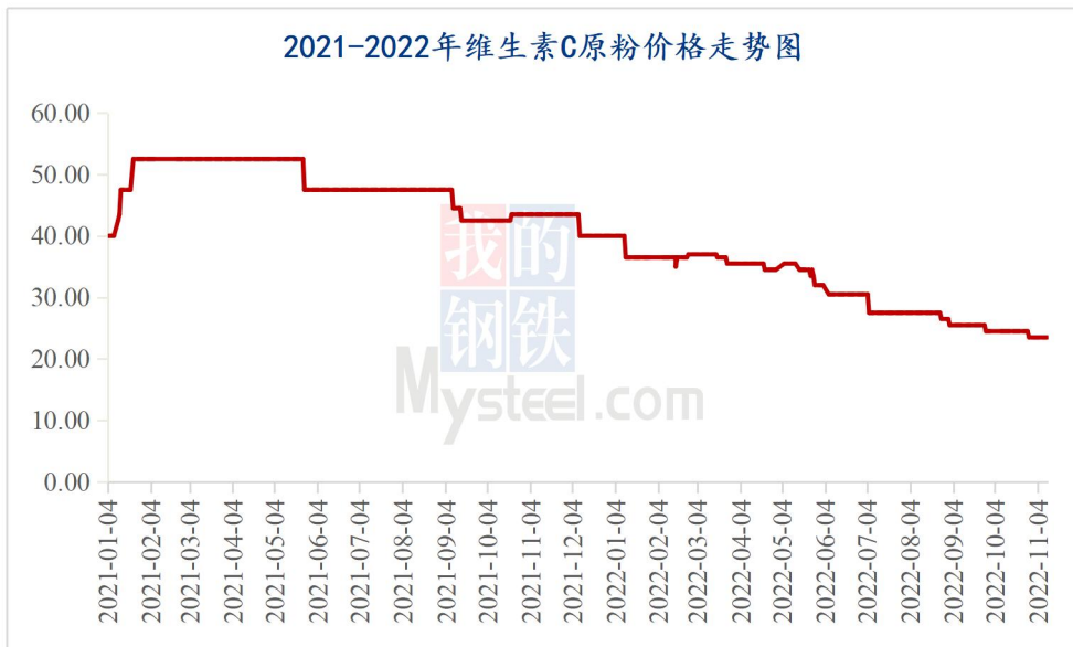
图 3 2021-2022 年维生素 C 价格走势