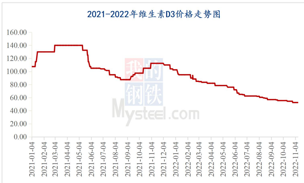
图 4 2021-2022 年维生素 D3 价格走势

本周国内维生素 D3 国内市场主流价格为 55-60 元/kg，欧洲市场报价为 8.25-9.15 欧元/kg。市场需求偏淡，询单一般，经销渠道出货积极，价格平稳偏弱。