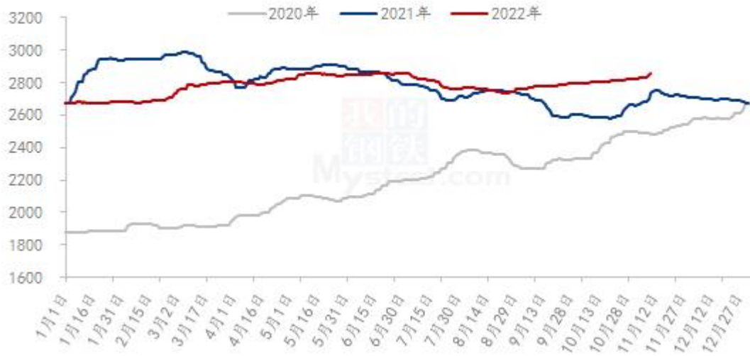
图 17 2020-2022 年全国玉米均价走势图