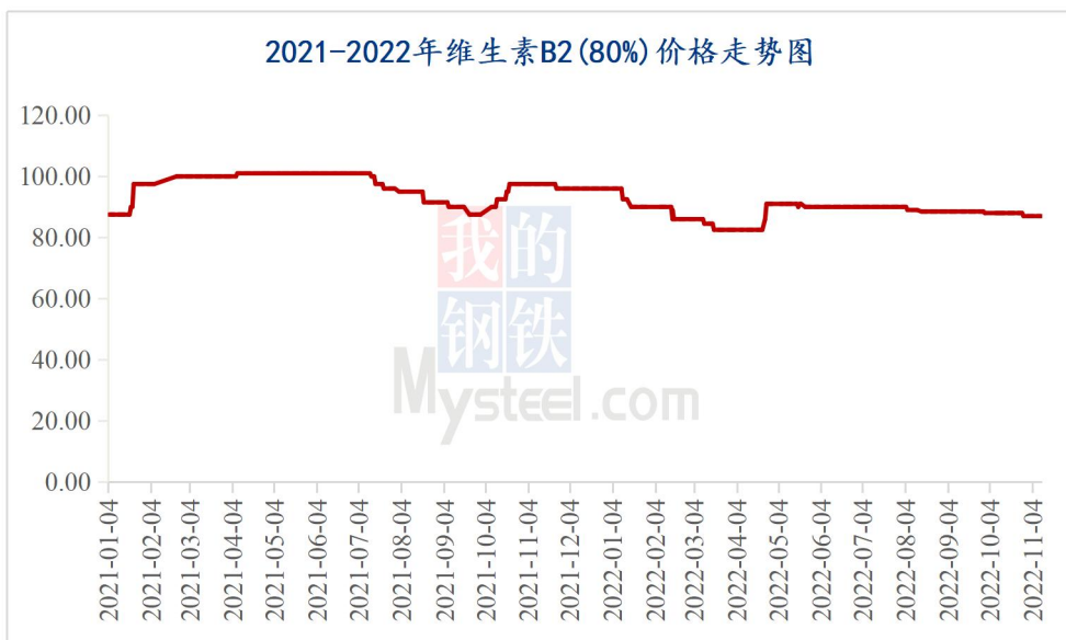
图 7 2021-2022 年维生素 B2 (80%) 价格走势

本周国内 VB2(80%)市场价格 90-94 元/kg，欧洲市场价格 14.50-16.00 欧元/kg，VB2(98%)市场价格 340-355 元/kg。市场需求一般，整体报价有维持平稳，根据品牌、日期不同，局部价格略低。