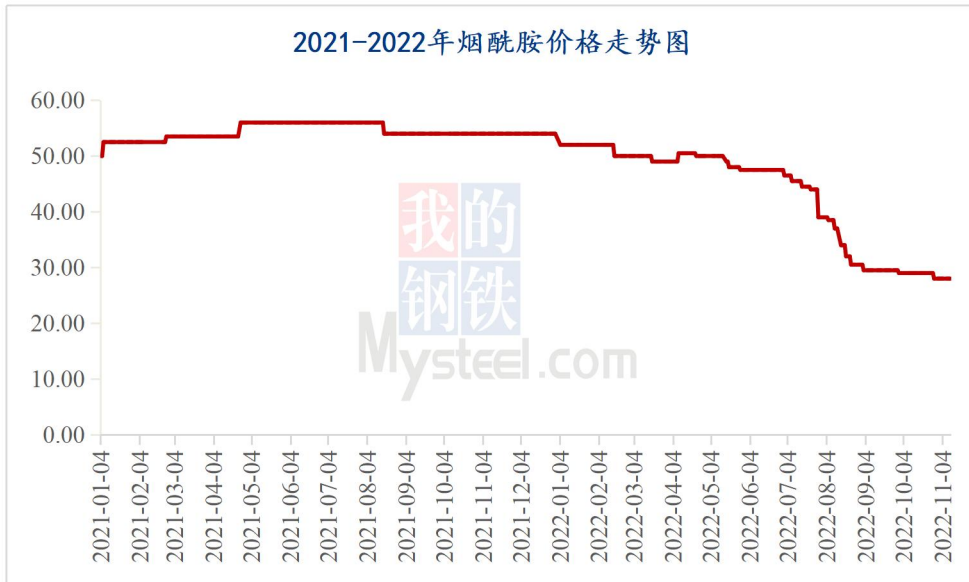
图 13 2021-2022 年烟酰胺价格走势图