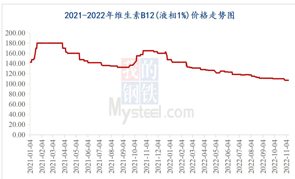
图 9 2021-2022 年维生素 B12 价格走势图