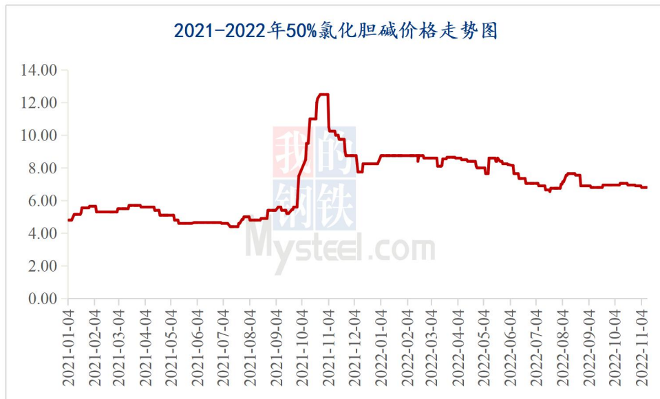
图 16 2021-2022 年氯化胆碱价格走势

本周国内氯化胆碱市场价格 6.8-7.0 元/kg。胆碱主要原料三甲胺价格高位波动，胆碱工厂报价动态调整，后期需关注胆碱成本端价格变化及生产出货情况。