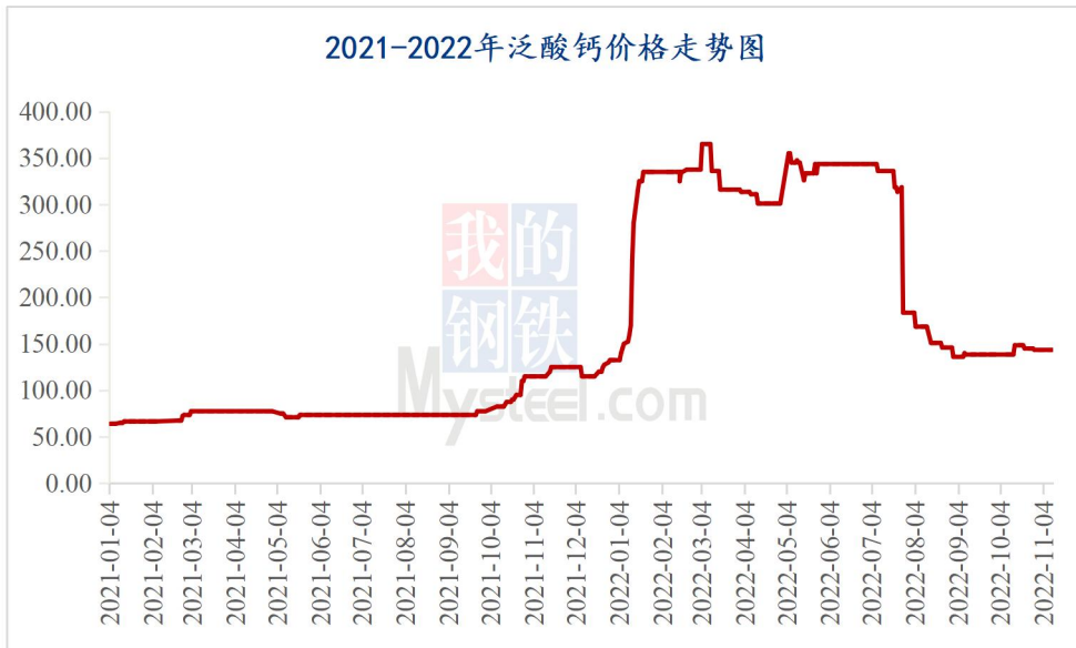
图 5 2021-2022 年泛酸钙价格走势

本周国内泛酸钙市场主流价格在 160-175 元/kg，市场需求一般，前期价格经历大幅下滑后趋于缓和，整体价格基本平稳，略有小幅波动。欧洲市场主流报价 23.00-27.00 欧元/kg，价格平稳。