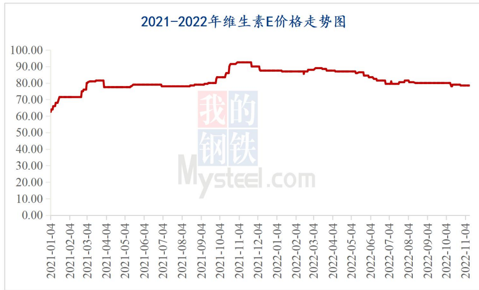
图 2 2021-2022 年维生素 E 价格走势

本周国内维生素 E 市场报价 80-82 元/kg，下游需求一般，终端适量补货，市场价格平稳偏弱，根据品牌、日期不同，局部有低价货源。欧洲市场贸易商报价 8.80-9.30 欧元/kg。