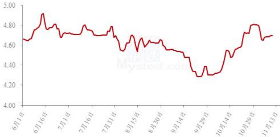
图 19 全国白羽肉鸡均价走势图