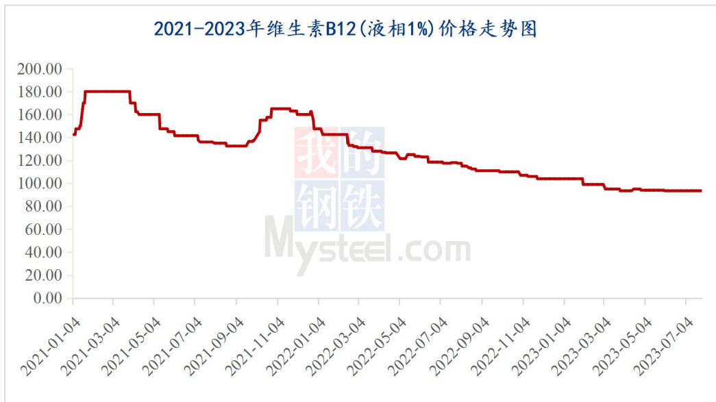
图 9 2021-2023 年维生素 B12 价格走势图