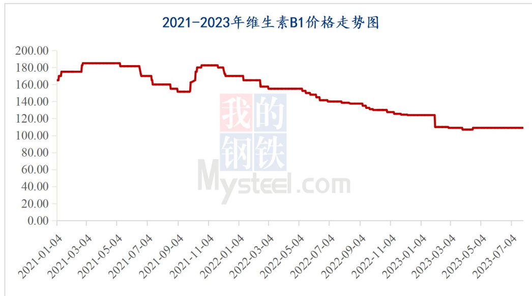
图 6 2021-2023 年维生素 B1 价格走势

本周国内维生素 B1（80%）市场报价在 108-112 元/kg，下游需求较弱，上游工厂挺价意愿较强，市场观望为主，市场询单较为平淡，价格平稳略强，6 月 15 日，天新药业计划于 7 月 1 日开始，进行为期 8-10 周的夏季停产检修。4 月 21 日，受维生素 B1 主要原材料价格上涨影响，兄弟科技硝酸 B1 报价 120 元/kg，盐酸 B1 报价 150 元/kg。