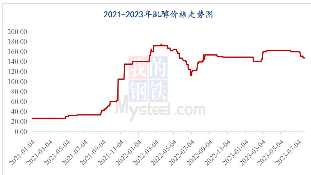
图 14 2021-2023 年肌醇价格走势

本周国内肌醇主流厂家提高报价至 140-162 元/kg，随着市场货源持续消耗，市场货源逐渐减少，需求较弱，后期需关注工厂生产和发货情况。