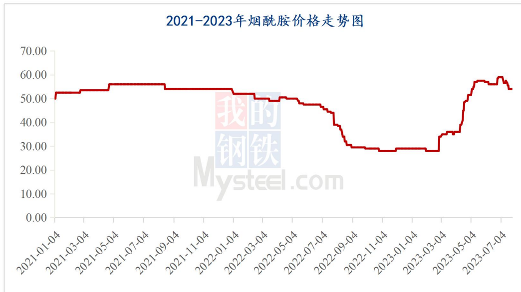
图 13 2021-2023 年烟酰胺价格走势