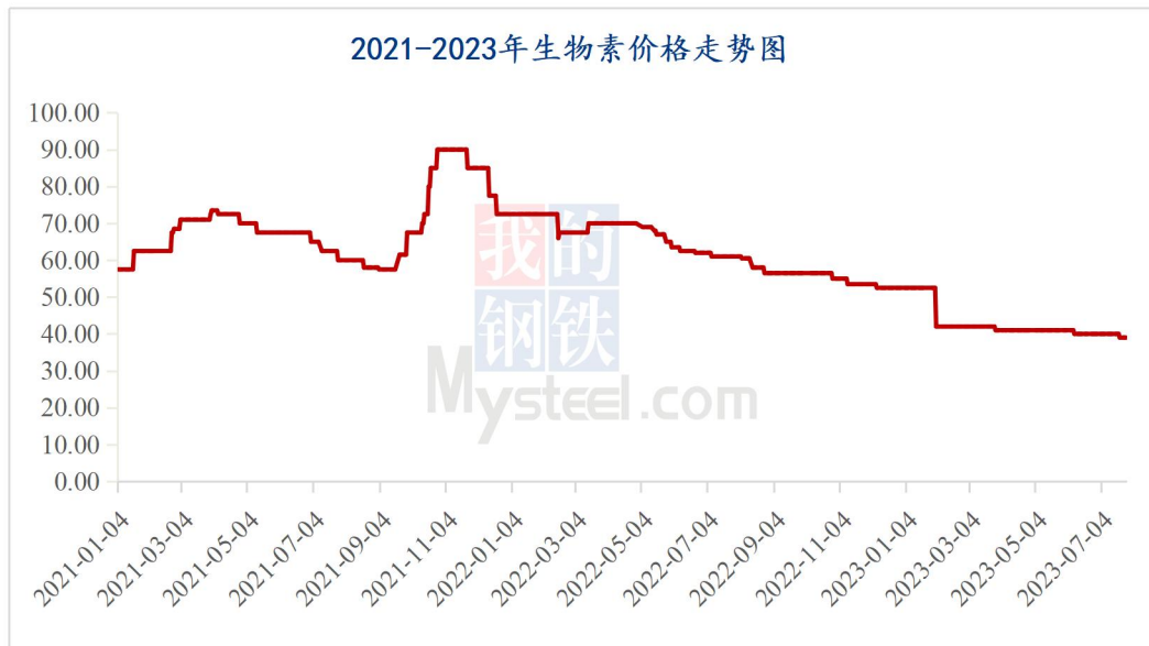
图 12 2021-2023 年生物素价格走势

本周国内 2%生物素市场价格在 39-42 元/kg，市场询单一般，交投价格平稳偏弱，部分价格略低，欧洲 2%生物素报价 4.05-4.30 欧元/kg。