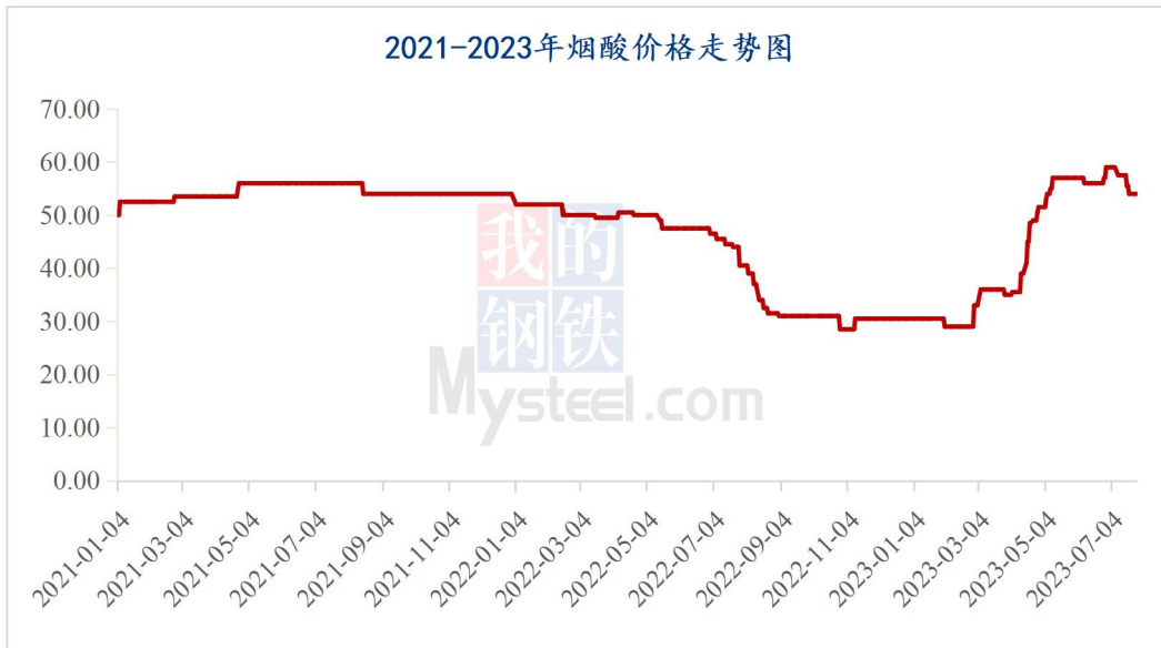
图 15 2021-2023 年烟酸价格走势图

本周国内市场主流报价 55-57 元/kg，市场成交较为平稳。受上游原料供应及年前低价接单等综合影响，导致年后各工厂交货相对紧张，主流工厂选择停报观望，市场供货暂时出现一定缺口，成交价格也随之小幅上涨。