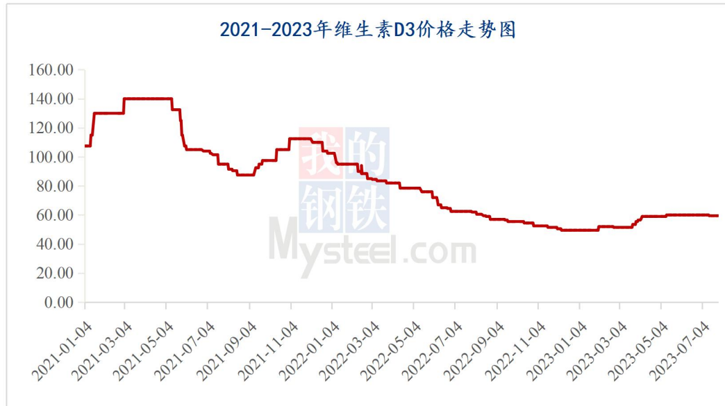
图 4 2021-2023 年维生素 D3 价格走势图

本周国内维生素 D3 国内市场主流价格为 58-62 元/kg，欧洲市场报价为 7.00-7.50 欧元/kg。询单一般，经销渠道出货积极，价格平稳偏强。