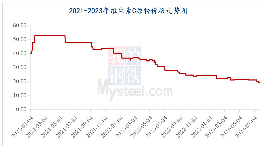
图 3 2021-2023 年维生素 C 价格走势图

本周 VC 原粉国内市场报价 18-22 元/kg，价格平稳，下游需求一般，终端适量补货，部分品牌略低一些。