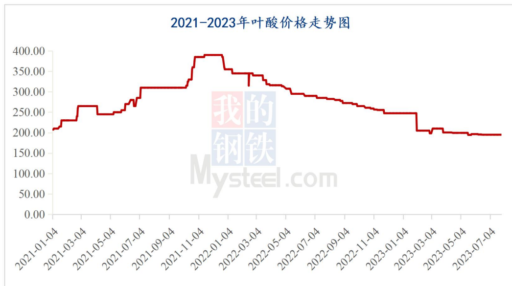
图 11 2021-2023 年叶酸价格走势图

本周国内市场主流报价 192-198 元/kg，叶酸目前总体需求不旺，市场成交一般，价格平稳。6月15日，天新药业饲料级叶酸停报停签。