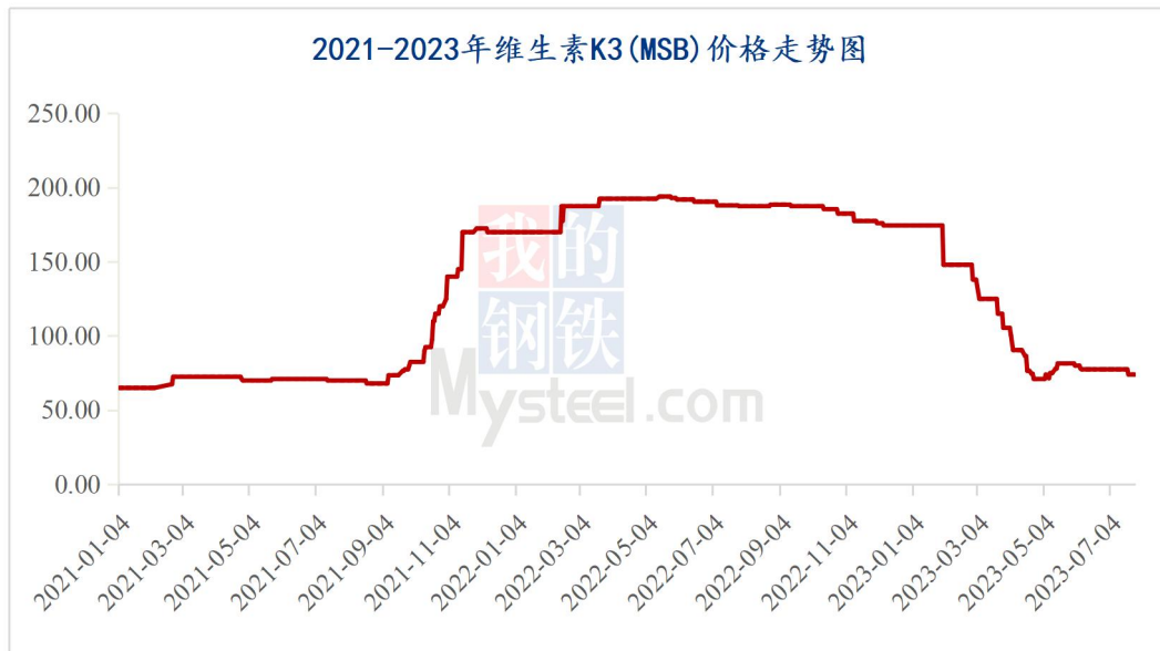
图 10 2021-2023 年维生素 K3 价格走势图