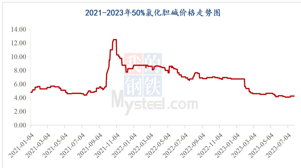
图 16 2021-2023 年氯化胆碱价格走势