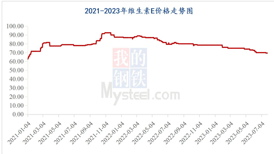
图 2 2021-2023 年维生素 E 价格走势图