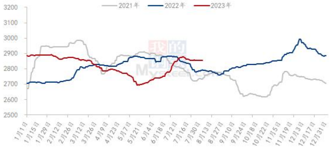
图 17 2021-2023 年全国玉米均价走势图