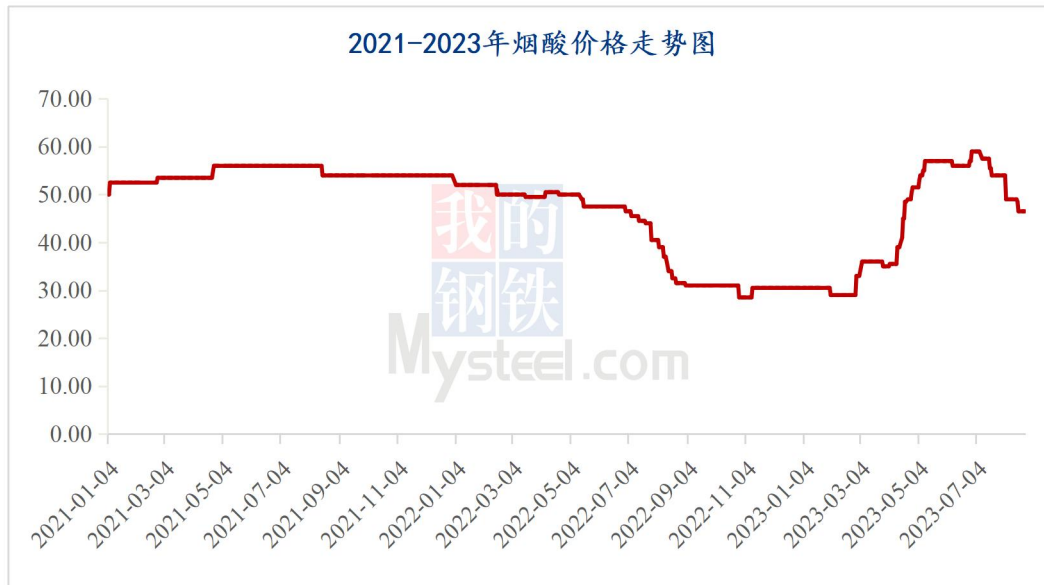
图 15 2021-2023 年烟酸价格走势图

本周国内市场主流报价 45-48 元/kg，市场成交较为平稳，市场询单一般，交投价格平稳偏弱，部分价格略低。