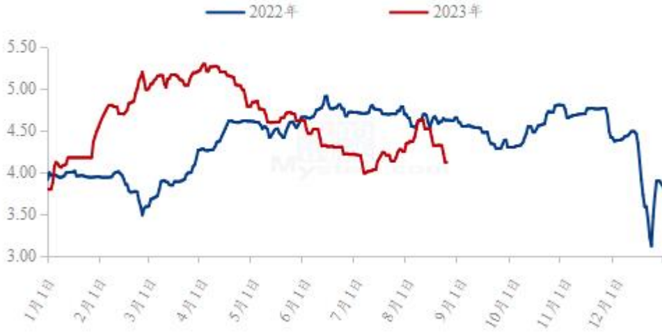
图 19 全国白羽肉鸡均价走势图