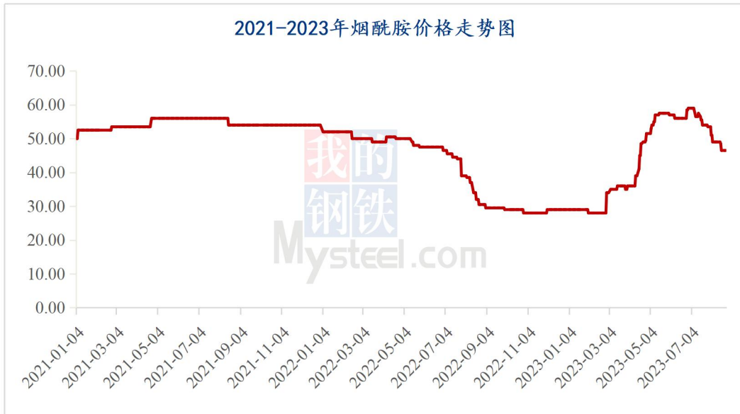
图 13 2021-2023 年烟酰胺价格走势图

本周国内市场主流报价 45-48 元/kg，价格较为平稳，市场询单一般，交投价格平稳偏弱，部分价格略低。