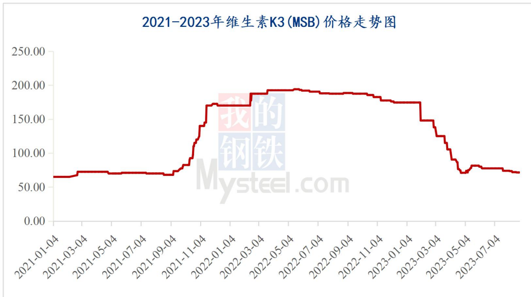
图 10 2021-2023 年维生素 K3 价格走势图

本周国内维生素 K3（MSB）市场主流价格在 70-73 元/kg，MNB 市场价格在 82-85 元/kg。下游需求一般，下游需求一般，上游工厂发货正常，市场价格基本维持平稳，实单议价成交为主。