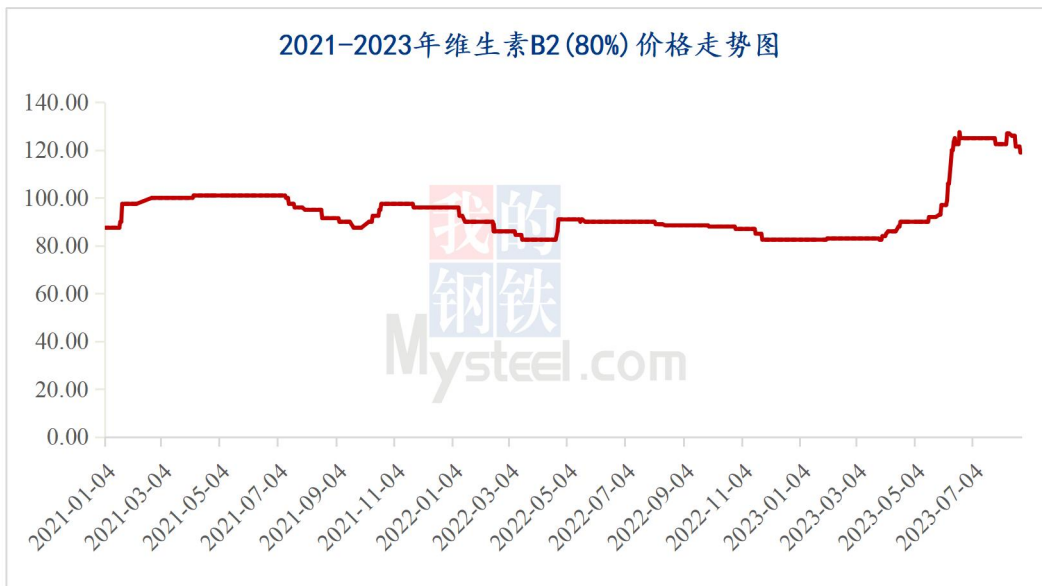
图 7 2021-2023 年维生素 B2 (80%) 价格走势

本周国内 VB2(80%)市场价格 116-122 元/kg，欧洲市场价格 15.00-16.00 欧元/kg，VB2(98%)市场价格 360-385 元/kg。市场询单活跃，上游工厂挺价意愿强烈，贸易渠道报价相对坚挺，观望情绪较浓，成交一般，根据品牌、日期不同，局部价格略低。7月4日，广济药业饲料级 80%维生素 B2 价格上调至 160 元/KG。7月5日，海嘉诺饲料级 80%维生素 B2 价格上调至 162 元/kg。7月7日，山东丰银饲料级 80%维生素 B2 价格上调至 165 元/kg。6月13日，海嘉诺上调 80%维生素 B2 报价为 153 元/kg。6月13日，山东恩贝丰银调整报价 155 元/kg。6月6日，梅花生物上调 80%维生素 B2 报价为 150 元/kg。