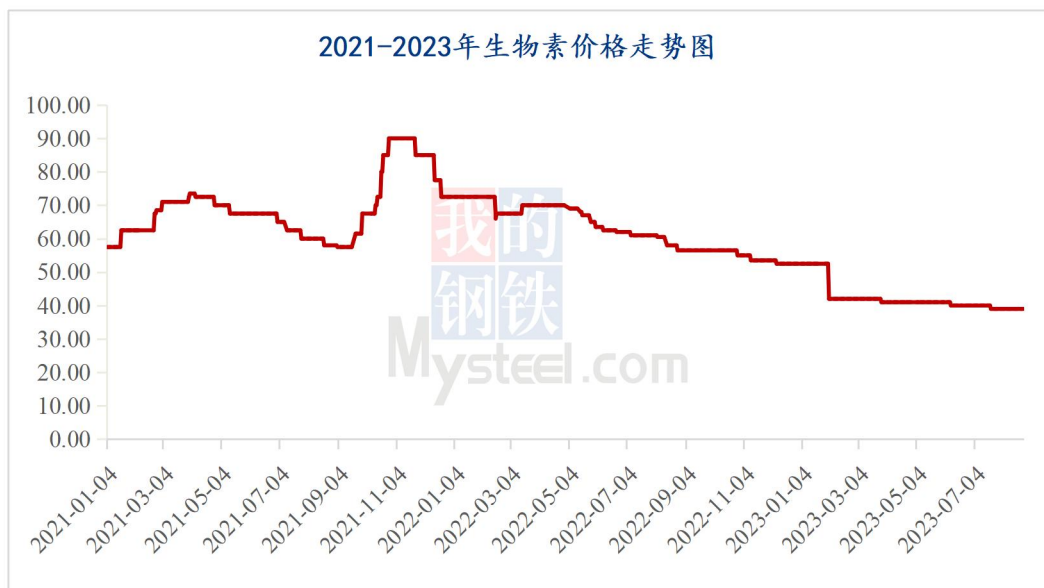
图 12 2021-2023 年生物素价格走势图

本周国内 2%生物素市场价格在 38-40 元/kg，市场询单一般，交投价格平稳偏弱，部分价格略低，欧洲 2%生物素报价 3.95-4.10 欧元/kg。