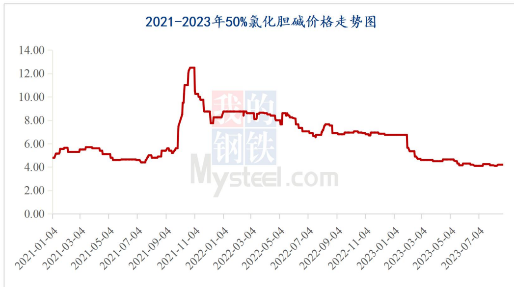
图 16 2021-2023 年氯化胆碱价格走势图