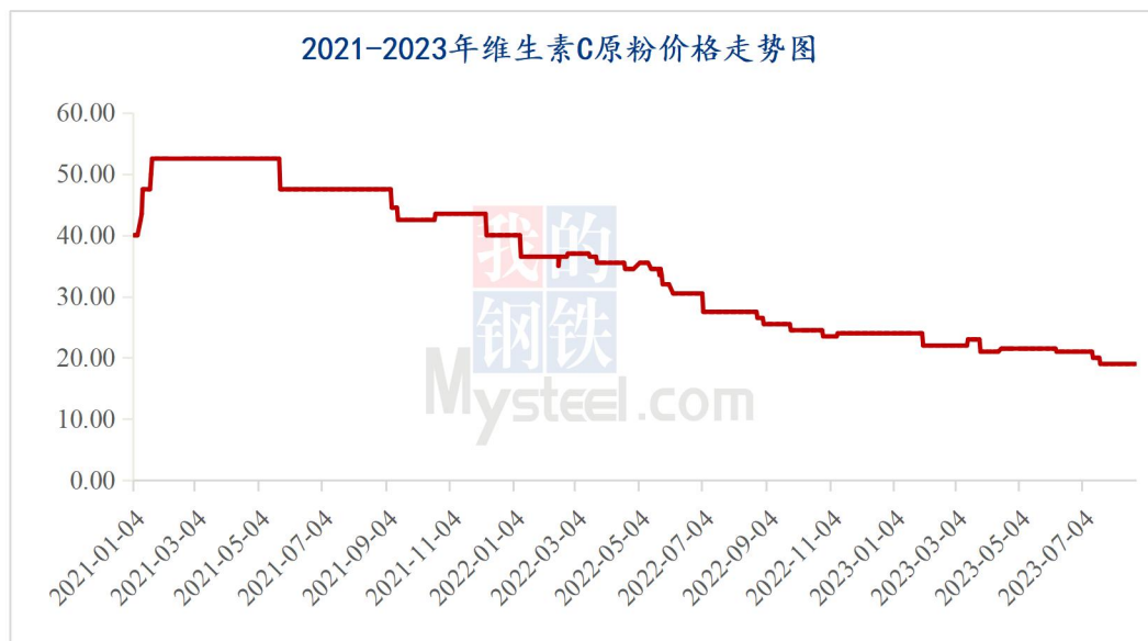
图 3 2021-2023 年维生素 C 价格走势图

本周 VC 原粉国内市场报价 18-19.5 元/kg，价格平稳，下游需求一般，终端适量补货，部分品牌略低一些。