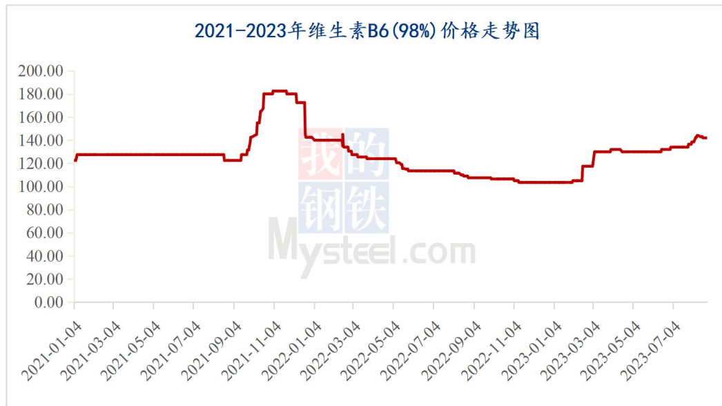
图 8 2021-2023 年维生素 B6 价格走势图