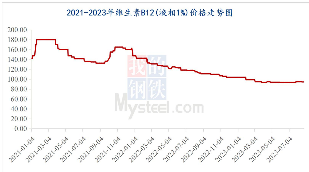
图 9 2021-2023 年维生素 B12 价格走势图

本周国内市场主流报价 93-96 元/kg，整体价格基本平稳，市场需求一般，价格较上周平稳运行。