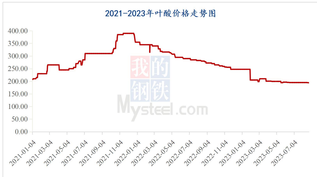
图 11 2021-2023 年叶酸价格走势图