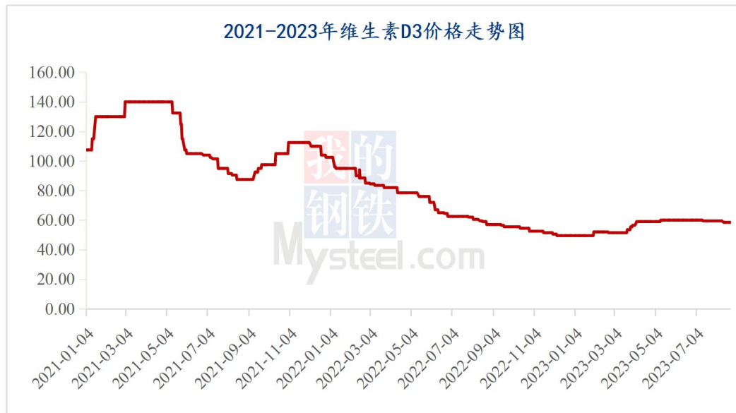
图 4 2021-2023 年维生素 D3 价格走势图

本周国内维生素 D3 国内市场主流价格为 57-60 元/kg，欧洲市场报价为 7.20-7.50 欧元/kg。市场需求一般，上游挺价意愿较强，经销渠道出货积极，价格平稳运行。