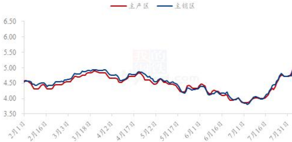
全国鸡蛋主产区与主销区价格对比图（元/斤）