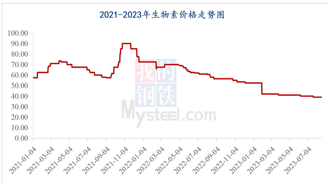
图 12 2021-2023 年生物素价格走势

本周国内 2%生物素市场价格在 38-41 元/kg，市场询单一般，交投价格平稳偏弱，部分价格略低，欧洲 2%生物素报价 3.95-4.10 欧元/kg。