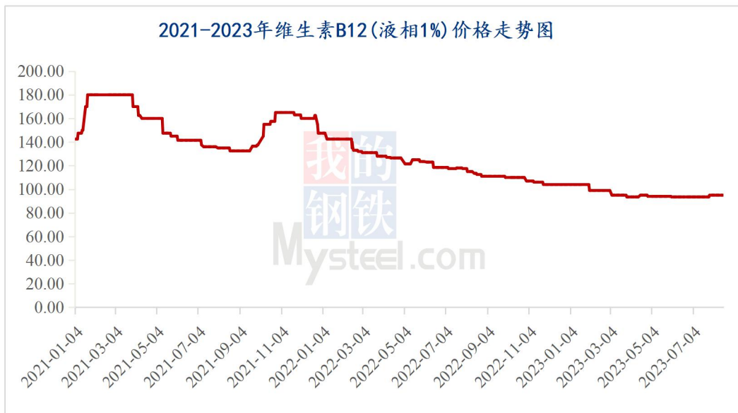
图 9 2021-2023 年维生素 B12 价格走势图

本周国内市场主流报价 94-96 元/kg，整体价格基本平稳，市场需求一般，价格较上周平稳运行。