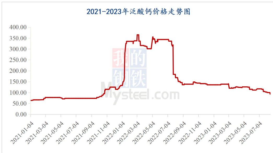
图 5 2021-2023 年泛酸钙价格走势图