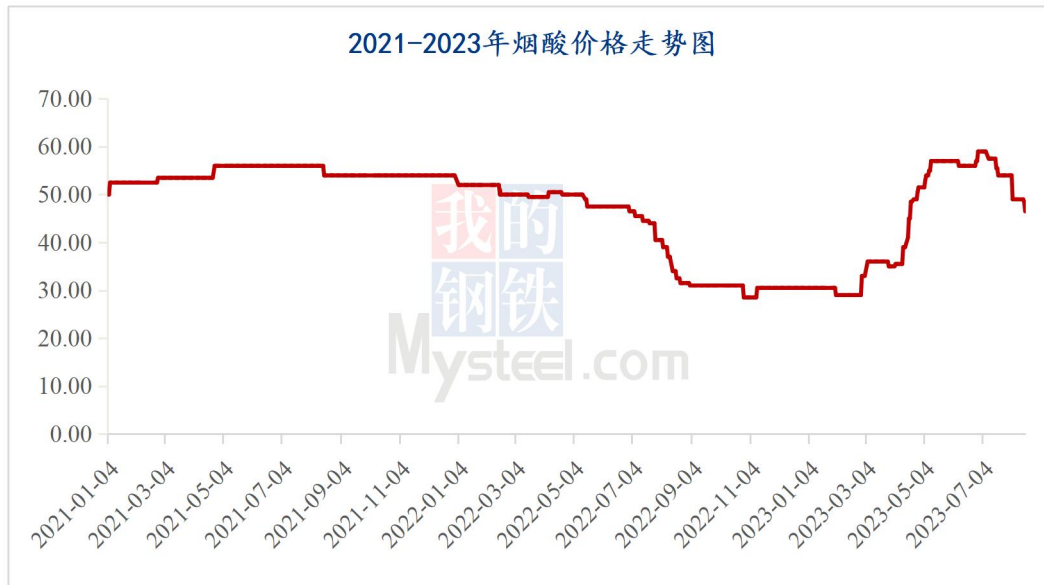
图 15 2021-2023 年烟酸价格走势图

本周国内市场主流报价 45-48 元/kg，市场成交较为平稳，市场询单一般，交投价格平稳偏弱，部分价格略低。