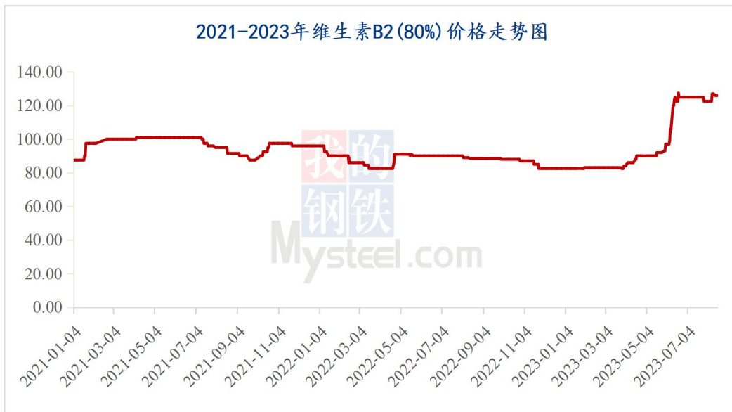
图 7 2021-2023 年维生素 B2 (80%) 价格走势

本周国内 VB2(80%)市场价格 122-130 元/kg，欧洲市场价格 15.00-16.00 欧元/kg，VB2(98%)市场价格 360-390 元/kg。市场询单活跃，上游工厂挺价意愿强烈，贸易渠道报价相对坚挺，观望情绪较浓，成交一般，根据品牌、日期不同，局部价格略低。7月4日，广济药业饲料级 80%维生素 B2 价格上调至 160 元/KG。7月5日，海嘉诺饲料级 80%维生素 B2 价格上调至 162 元/kg。7月7日，山东丰银饲料级 80%维生素 B2 价格上调至 165 元/kg。6月13日，海嘉诺上调 80%维生素 B2 报价为 153 元/kg。6月13日，山东恩贝丰银调整报价 155 元/kg。6月6日，梅花生物上调 80%维生素 B2 报价为 150 元/kg。