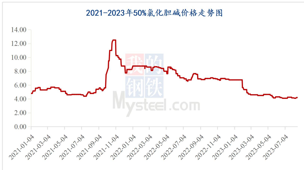
图 16 2021-2023 年氯化胆碱价格走势图