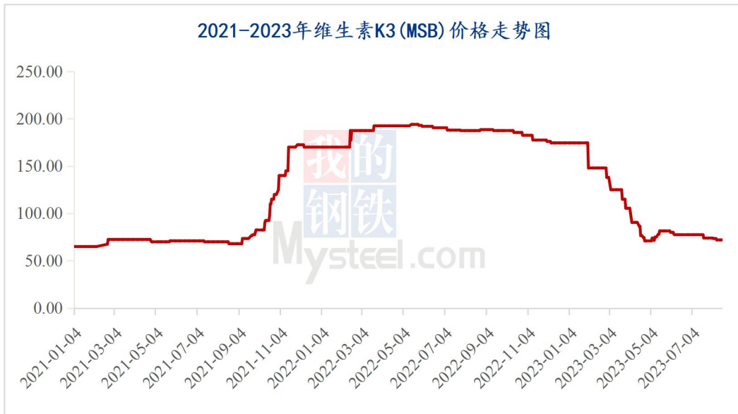
图 10 2021-2023 年维生素 K3 价格走势图

本周国内维生素 K3（MSB）市场主流价格在 70-74 元/kg，MNB 市场价格在 83-86 元/kg。下游需求一般，下游需求一般，上游工厂发货正常，市场价格基本维持平稳，实单议价成交为主。