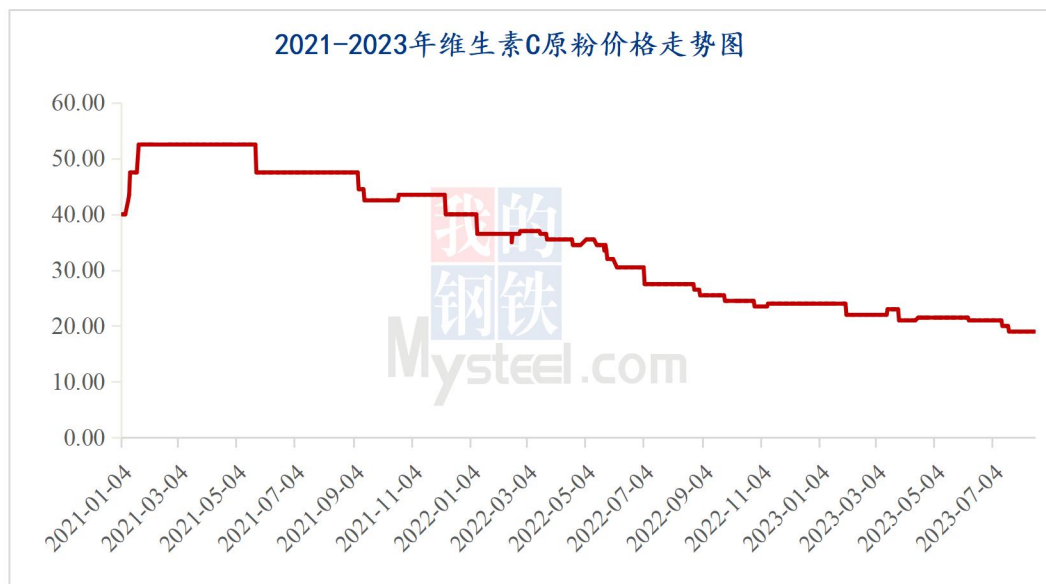
图 3 2021-2023 年维生素 C 价格走势图

本周 VC 原粉国内市场报价 18-19.5 元/kg，价格平稳，下游需求一般，终端适量补货，部分品牌略低一些。