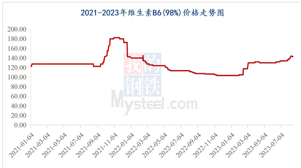
图 8 2021-2023 年维生素 B6 价格走势图