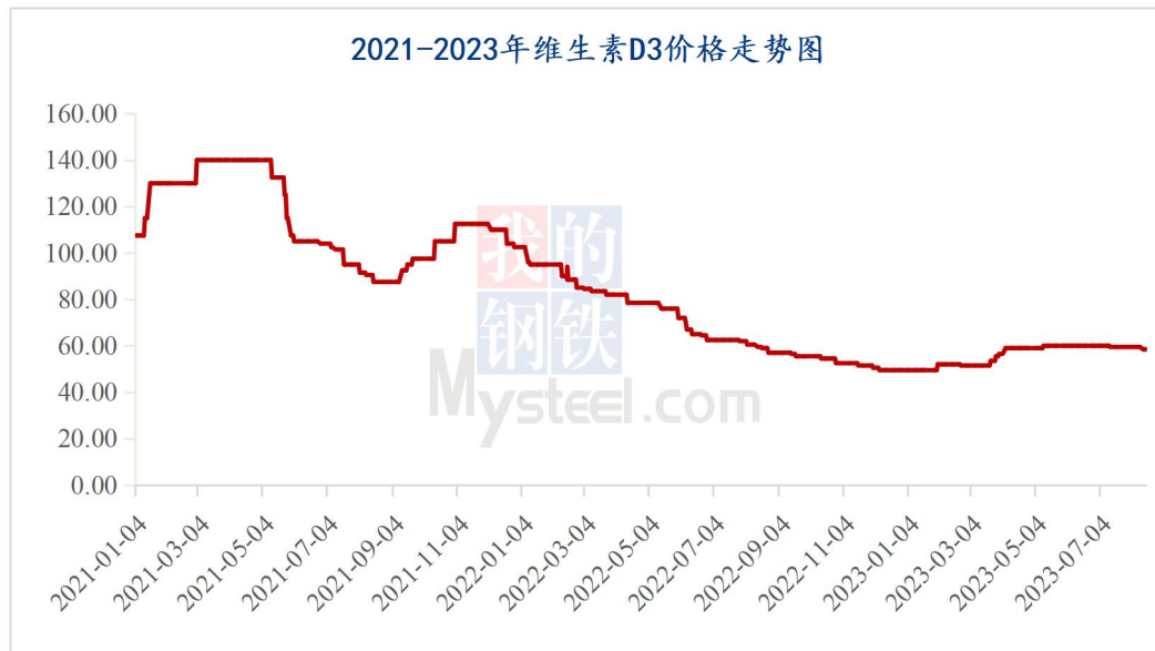
图 4 2021-2023 年维生素 D3 价格走势图

本周国内维生素 D3 国内市场主流价格为 57-60 元/kg，欧洲市场报价为 7.20-7.50 欧元/kg。市场需求一般，上游挺价意愿较强，经销渠道出货积极，价格平稳运行。