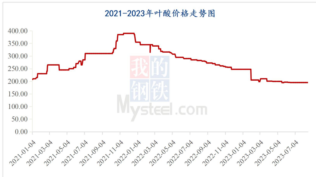
图 11 2021-2023 年叶酸价格走势