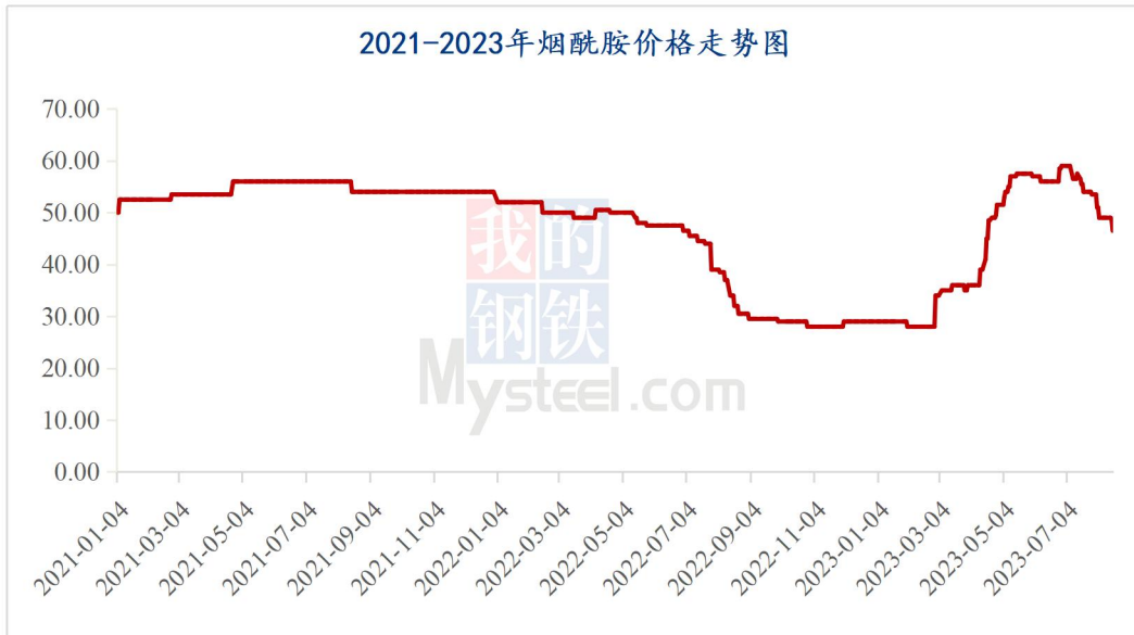
图 13 2021-2023 年烟酰胺价格走势图

本周国内市场主流报价 45-48 元/kg，价格较为平稳，市场询单一般，交投价格平稳偏弱，部分价格略低。