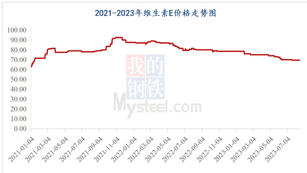
图 2 2021-2023 年维生素 E 价格走势图