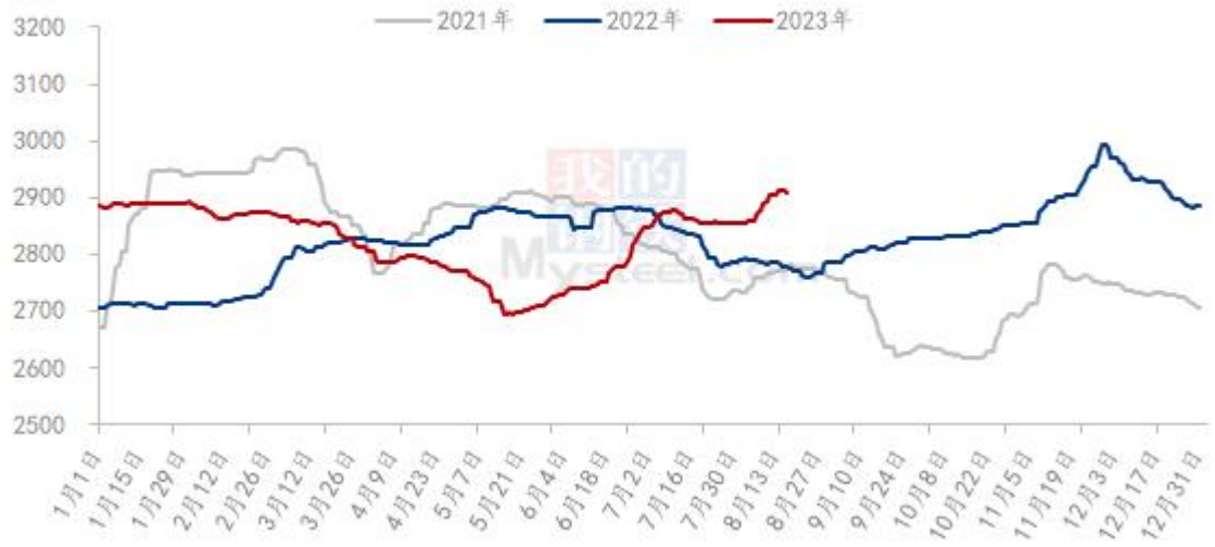
图 17 2021-2023 年全国玉米均价走势图