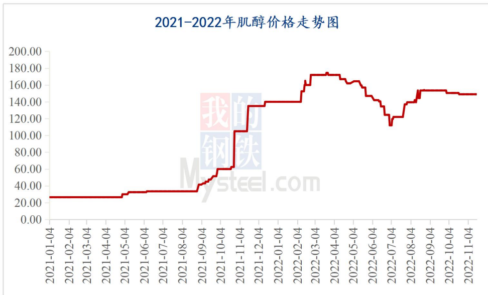
图 14 2021-2022 年肌醇价格走势图