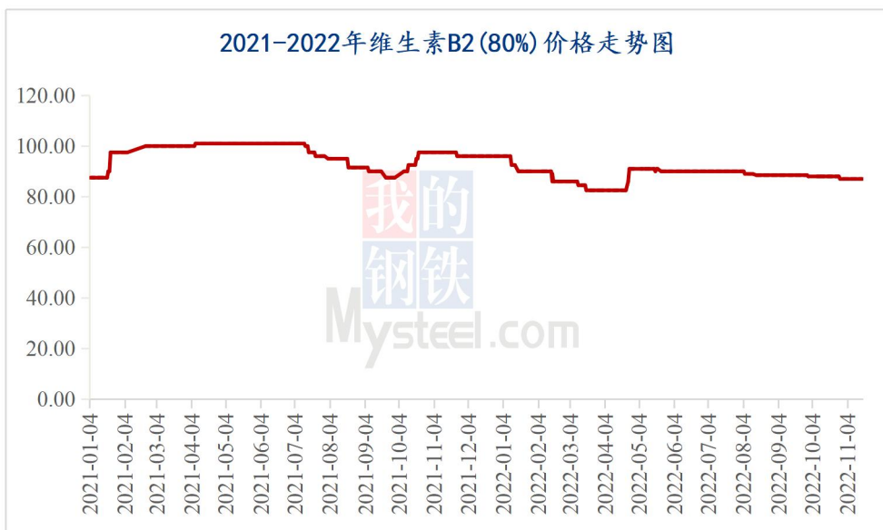
图 7 2021-2022 年维生素 B2 (80%) 价格走势

本周国内 VB2(80%)市场价格 88-94 元/kg，欧洲市场价格 13.50-14.50 欧元/kg，VB2(98%)市场价格 335-350 元/kg。价格较上周均有小幅下调，市场需求一般，整体报价有维持平稳，根据品牌、日期不同，局部价格略低。