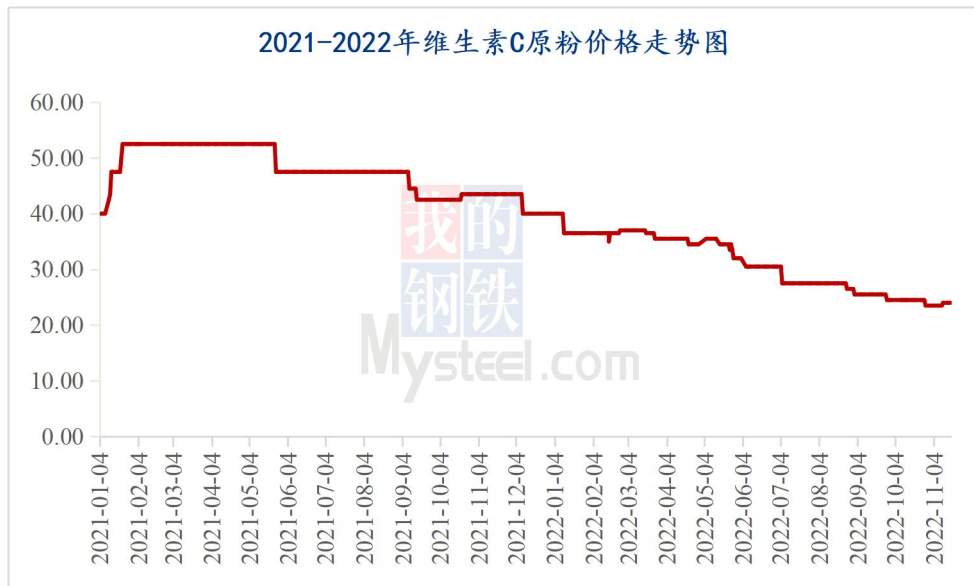
图 3 2021-2022 年维生素 C 价格走势