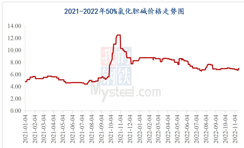
图 16 2021-2022 年氯化胆碱价格走势

本周国内氯化胆碱市场价格 6.8-7.0 元/kg。胆碱主要原料三甲胺价格高位波动，胆碱工厂报价动态调整，后期需关注胆碱成本端价格变化及生产出货情况。