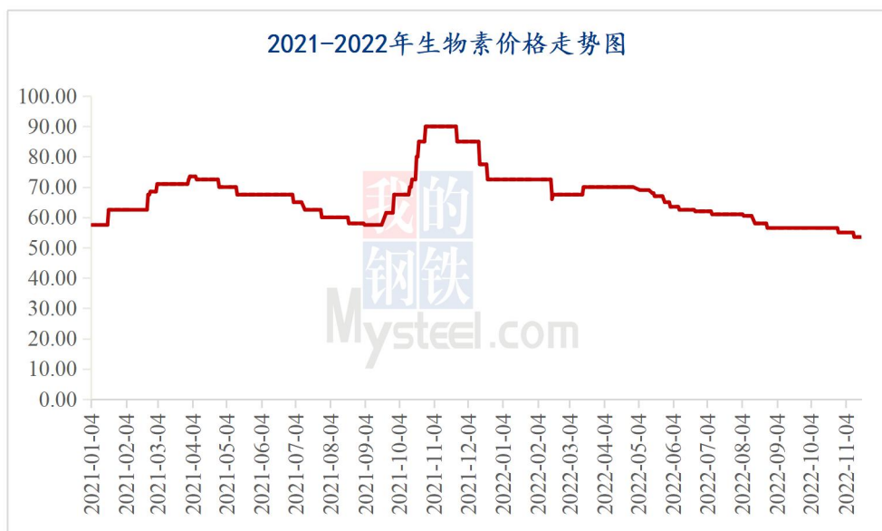
图 12 2021-2022 年生物素价格走势图

本周国内 2%生物素市场价格在 44-47 元/kg，市场询单一般，交投价格平稳偏弱，部分价格略低。欧洲 2%生物素报价 5.45-6.00 欧元/kg。大丰海嘉诺 10 月 1 日起进行为期 40 天的停产检修。