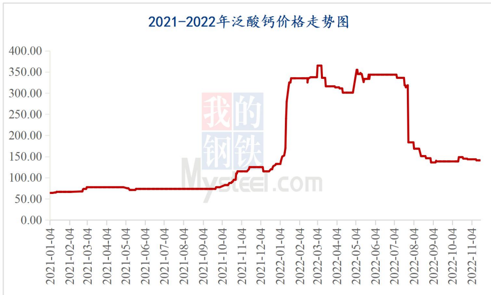
图 5 2021-2022 年泛酸钙价格走势

本周国内泛酸钙市场主流价格在 158-170 元/kg，市场需求一般，前期价格经历大幅下滑后趋于缓和，整体价格基本平稳，略有小幅波动。欧洲市场主流报价 23.00-25.00 欧元/kg，价格平稳。