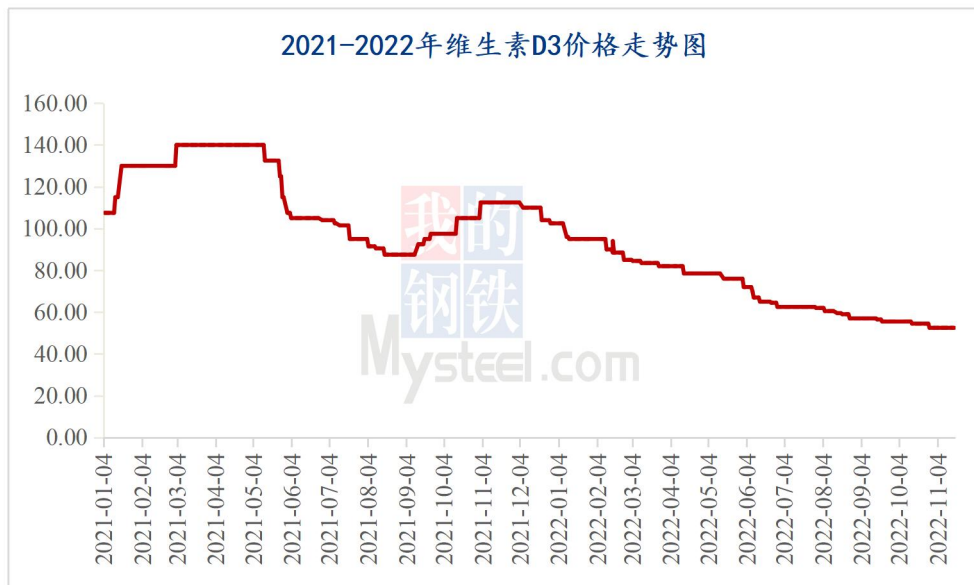
图 4 2021-2022 年维生素 D3 价格走势

本周国内维生素 D3 国内市场主流价格为 55-60 元/kg，欧洲市场报价为 8.25-9.00 欧元/kg。市场需求偏淡，询单一般，经销渠道出货积极，价格平稳偏弱。