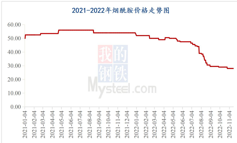
图 13 2021-2022 年烟酰胺价格走势