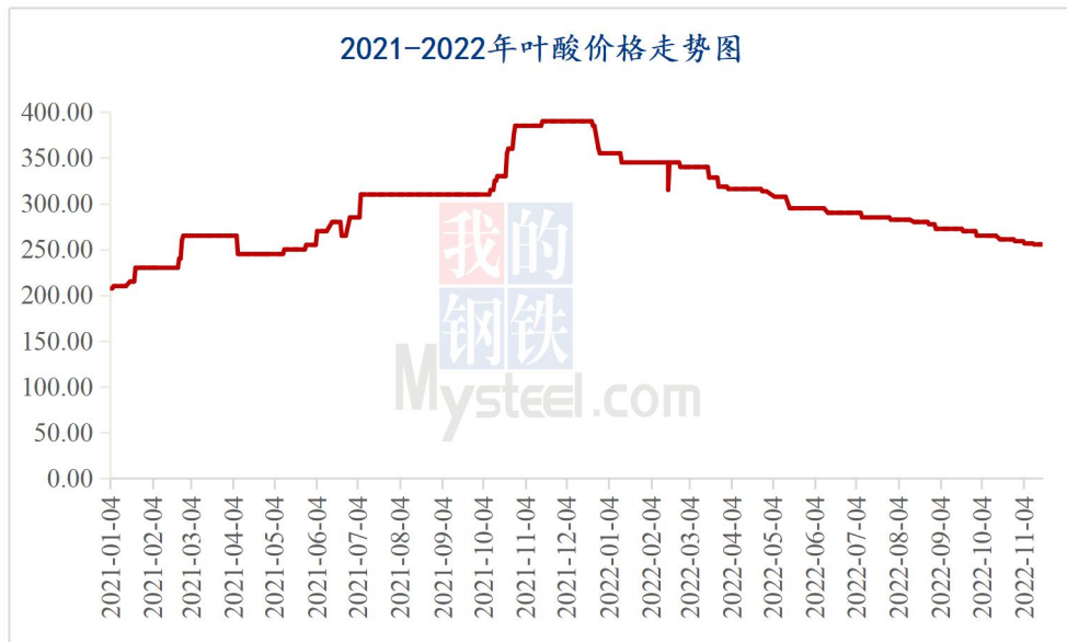
图 11 2021-2022 年叶酸价格走势图