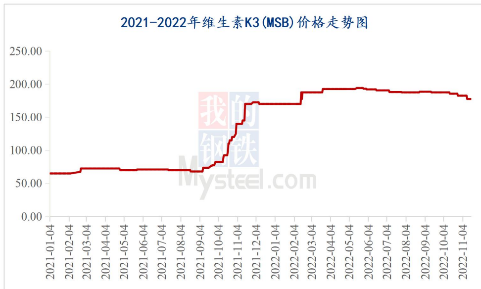
图 10 2021-2022 年维生素 K3 价格走势

本周国内维生素 K3 (MSB) 市场主流价格在 165-175 元/kg，MNB 市场价格在 190-200 元/kg。市场需求一般，询单略平淡，K3 价格基本平稳，小幅震荡。受原材料供应偏紧影响，主流维生素 K3 工厂停报。