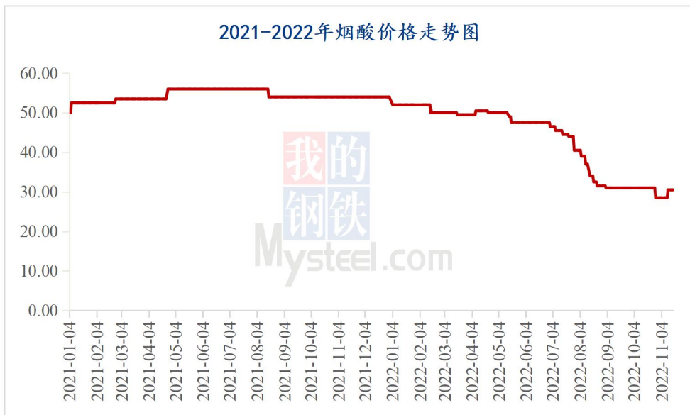
图 15 2021-2022 年烟酸价格走势图

本周国内市场主流报价 28-32 元/kg，本周询单较上周有所活跃，价格小幅上调，整体弱势调整。