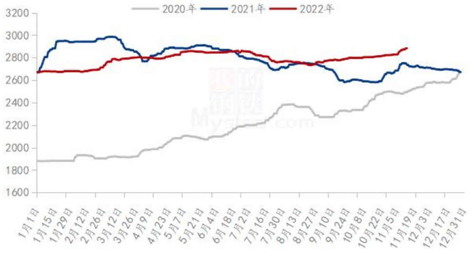
图 17 2020-2022 年全国玉米均价走势图