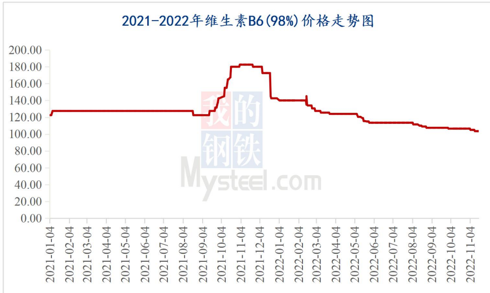
图 8 2021-2022 年维生素 B6 价格走势图

本周国内市场主流报价 110-114 元/kg，市场需求一般，价格较上周小幅下调。