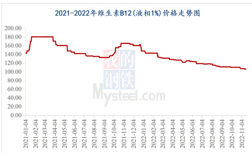
图 9 2021-2022 年维生素 B12 价格走势图