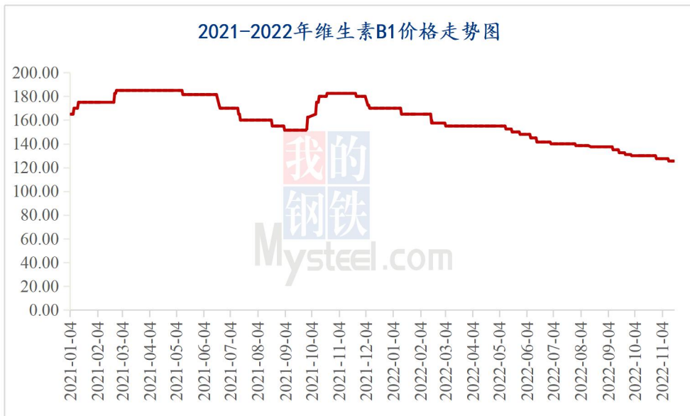
图 6 2021-2022 年维生素 B1 价格走势