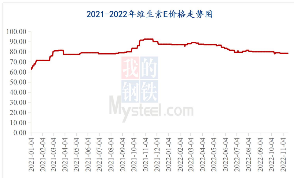
图 2 2021-2022 年维生素 E 价格走势

本周国内维生素 E 市场报价 80-82 元/kg，下游需求一般，终端适量补货，市场价格平稳偏弱，根据品牌、日期不同，局部有低价货源。欧洲市场贸易商报价 8.80-9.30 欧元/kg。