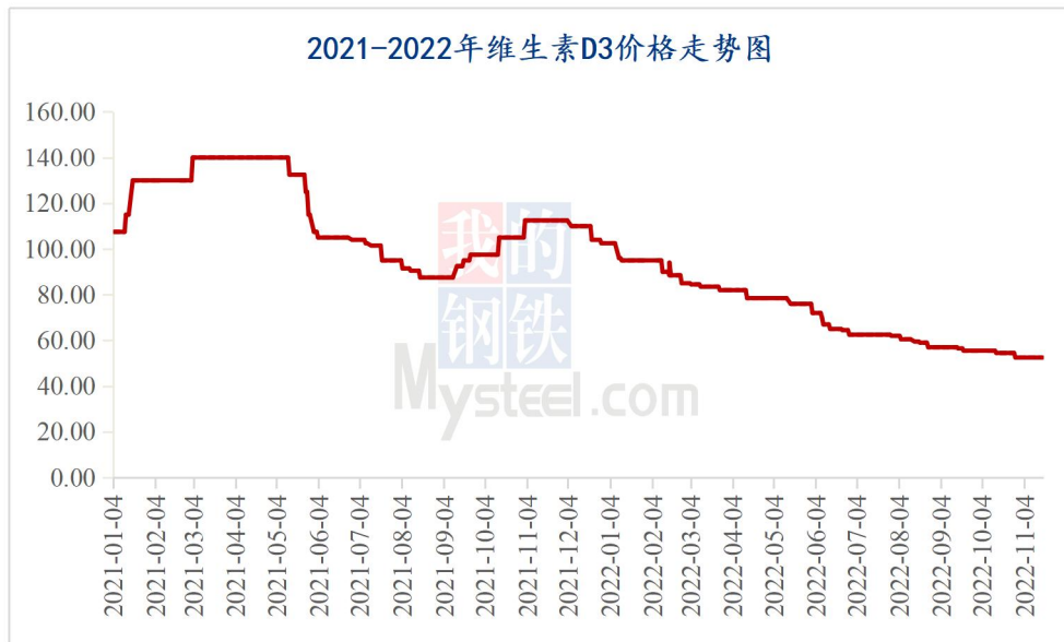
图 4 2021-2022 年维生素 D3 价格走势图