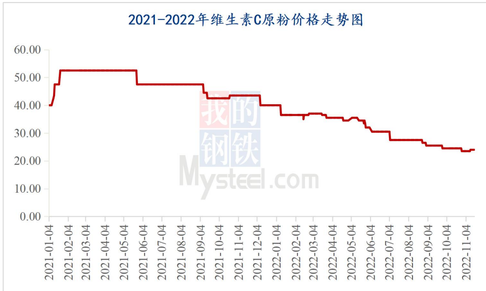
图 3 2021-2022 年维生素 C 价格走势

本周 VC 原粉国内市场报价 22-23 元/kg，下游需求一般，终端适量补货，主流厂家 11 月 2 日起暂停对外报价，市场关注度增加，出口 FOB 报价在 2.6-2.8 美元，部分品牌略低一些。