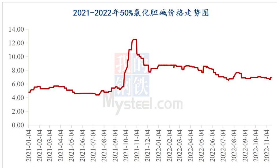
图 16 2021-2022 年氯化胆碱价格走势