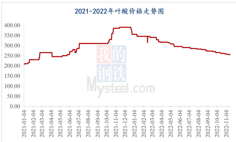
图 11 2021-2022 年叶酸价格走势图