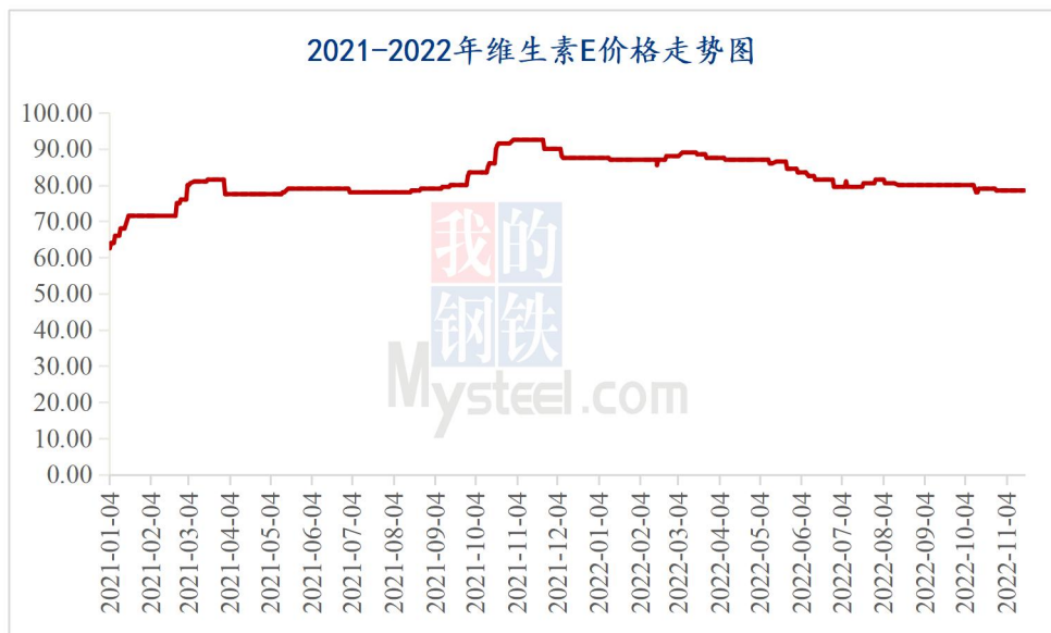
图 2 2021-2022 年维生素 E 价格走势图

本周国内维生素 E 市场报价 80-82 元/kg，下游需求一般，终端适量补货，市场价格平稳偏弱，根据品牌、日期不同，局部有低价货源。欧洲市场贸易商报价 8.95-9.30 欧元/kg。