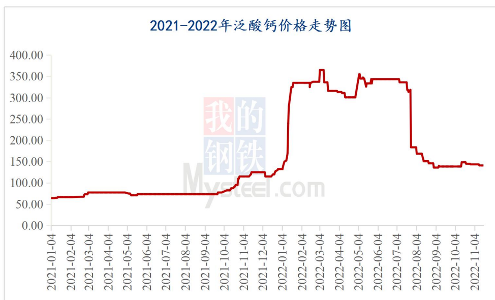
图 5 2021-2022 年泛酸钙价格走势图

本周国内泛酸钙市场主流价格在 156-170 元/kg，市场需求一般，前期价格经历大幅下滑后趋于缓和，整体价格基本平稳，略有小幅波动。据了解,本周国内有厂家泛酸钙报价上调至 RMB180/KG。近期工厂一直供货紧张，限量签单。出口询单活跃，当前出口市场报价 USD22-25/KG，后续关注工厂发货情况。欧洲市场主流报价 22.2-23.5 欧元/kg，价格平稳。