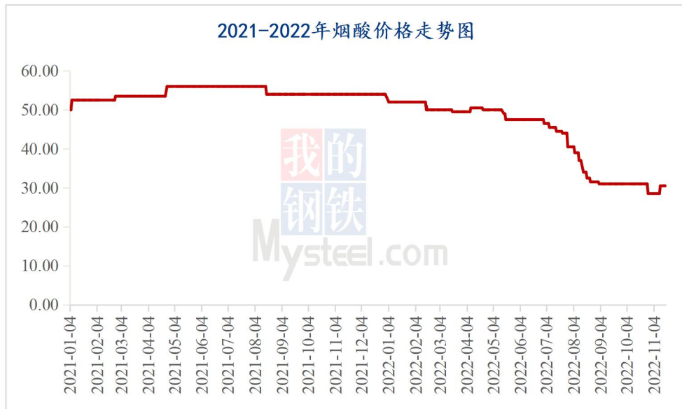
图 15 2021-2022 年烟酸价格走势

本周国内市场主流报价 28-32 元/kg，本周询单较上周价格小幅上调，整体弱势调整。由于工厂前期低价位持续接单，外加疫情等不可控因素对生产和物流造成的影响，主流工厂均超负荷运行，部分工厂交期排到中国年后。虽市场报价略微提高，但成交价格仍有可议空间。市场报价国内 CNY 27-28 左右，出口 USD 3.6-3.8 左右；预计交货会持续紧张，但价格是否上一个台阶，还有待观望。