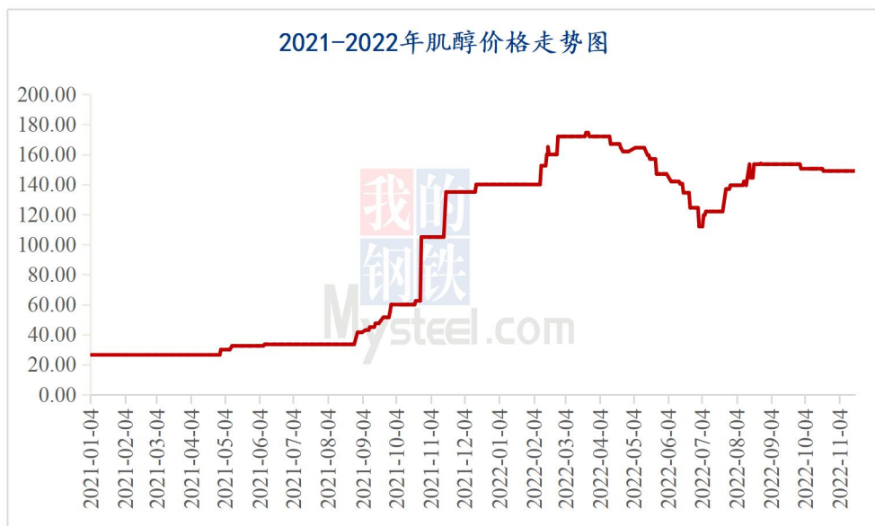
图 14 2021-2022 年肌醇价格走势

本周国内市场主流报价 150-160 元/kg，肌醇近期低价货源基本消耗完，主流工厂价格有所上调，市场成交价格也略有上浮。目前，根据不同品牌，主流厂家报价在 165-180，中国出口 FOB 价格在 19-21 美元左右。整体价格基本平稳。