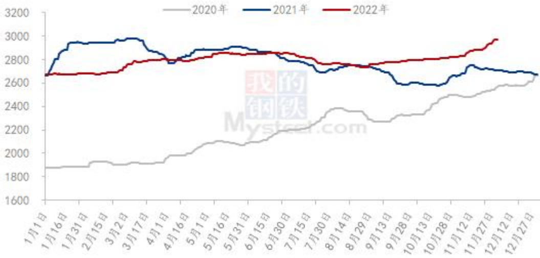
图 17 2020-2022 年全国玉米均价走势图