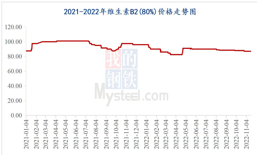
图 7 2021-2022 年维生素 B2 (80%) 价格走势图