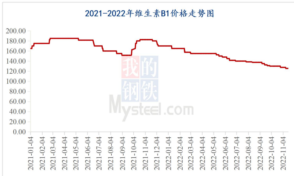
图 6 2021-2022 年维生素 B1 价格走势图

本周国内维生素 B1 市场报价在 122-128 元/kg，受成本上涨影响，B1 工厂挺价意愿较强，下游需求偏弱，询单一般，市场价格维持弱稳。