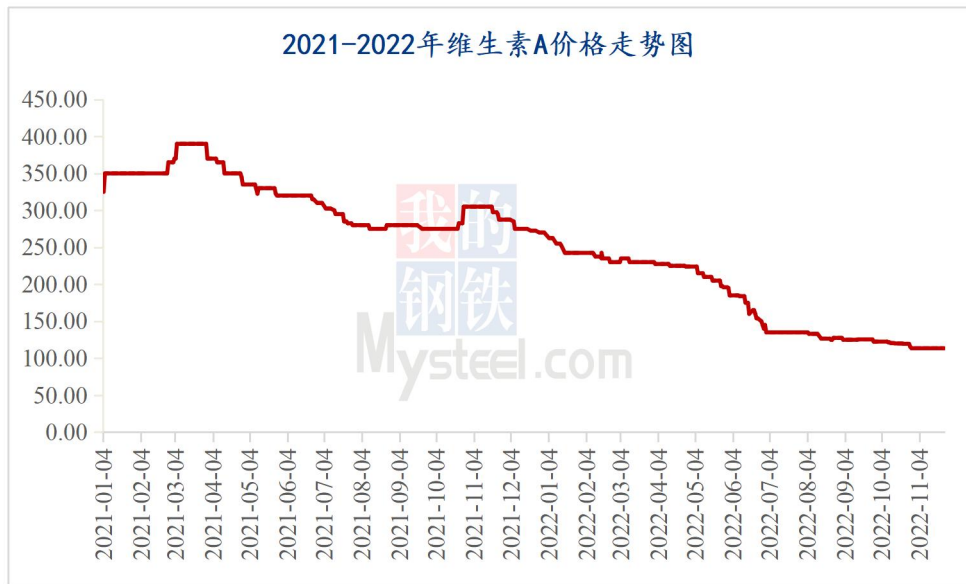
图 1 2022 年维生素 A 价格走势图