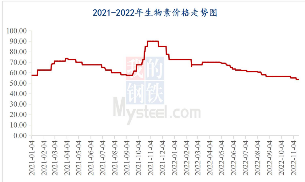
图 12 2021-2022 年生物素价格走势图

本周国内 2%生物素市场价格在 44-47 元/kg，市场询单一般，交投价格平稳偏弱，部分价格略低。欧洲 2%生物素报价 5.45-5.70 欧元/kg。