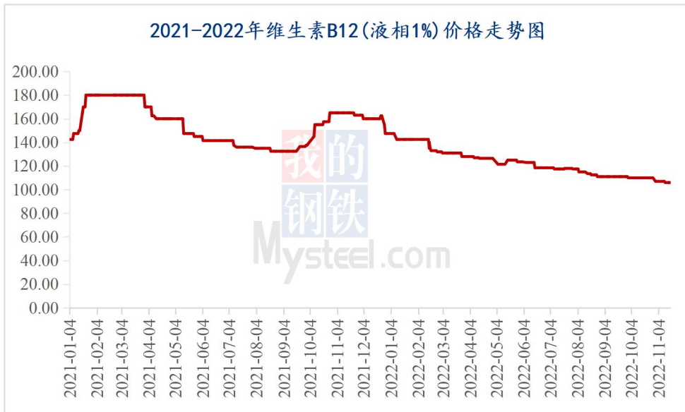
图 9 2021-2022 年维生素 B12 价格走势图