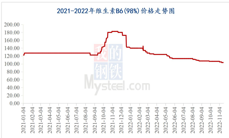
图 8 2021-2022 年维生素 B6 价格走势图

本周国内市场主流报价 110-114 元/kg，市场需求一般，价格较上周小幅下调。