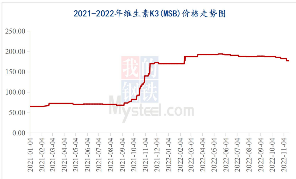
图 10 2021-2022 年维生素 K3 价格走势图