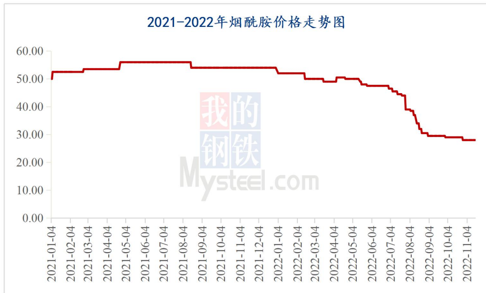
图 13 2021-2022 年烟酰胺价格走势