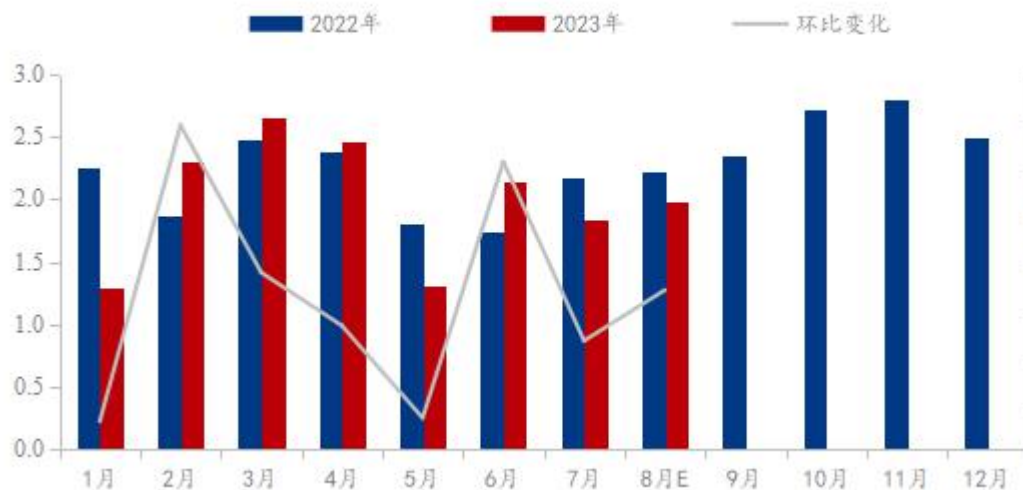
Mysteel 电池级硫酸锰月度产量(万吨)

2023年9月中国电池级硫酸锰预估产量为20600吨，环比增加4%，预计个别企业恢复正常生产后，产量略有上升，而下游三元前驱体企业生产有小幅减量计划，对硫酸锰整体需求可能会略有减少，预计9月硫酸锰企业排产与8月相比变化不大，产量略增。