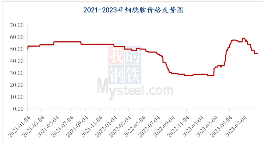
图 13 2021-2023 年烟酰胺价格走势图

截至本月国内市场均价 48.15 元/kg，较上月下调 7.89 元/kg，上游工厂挺价意愿强烈，但市场的原材料问题明显改善，然而下游补货需求不佳，市场价格趋弱运行。