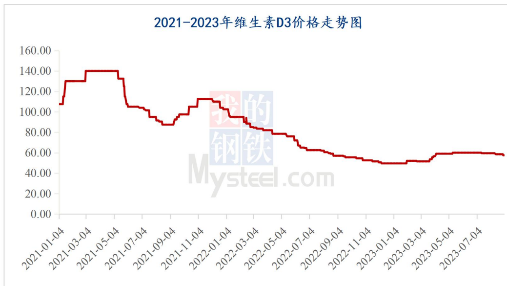
图 4 2021-2023 年维生素 D3 价格走势图

截至本月国内维生素 D3 国内市场均价为 58.8 元/kg，较上月减少 0.91 元/kg，欧洲市场报价为 7.20-7.50 欧元/kg。市场需求一般，上游挺价意愿较强，经销渠道出货积极，价格坚挺。虽然整体库存不多，但是由于目前维生素 D3 需求不佳，因此价格比较稳定。据悉，维生素 D3 的进口手续、文件要求以及进口清关流程仍然不明确，不同港口海关的要求和操作存在差异。