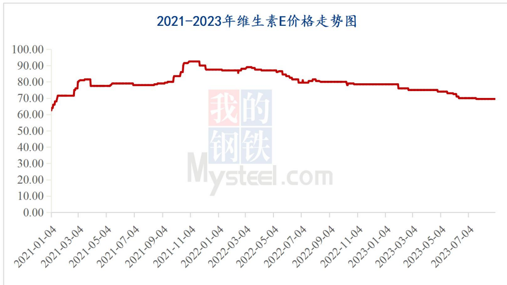
图 2 2021-2023 年维生素 E 价格走势

中旬开始进行为期 10 周的停产检修。5 月 23 日，浙江医药维生素 E 报价 76 元/kg。5 月 30 日，北沙制药维生素 E 生产线计划 6 月底开始进行时长 6-7 周的停产检修。