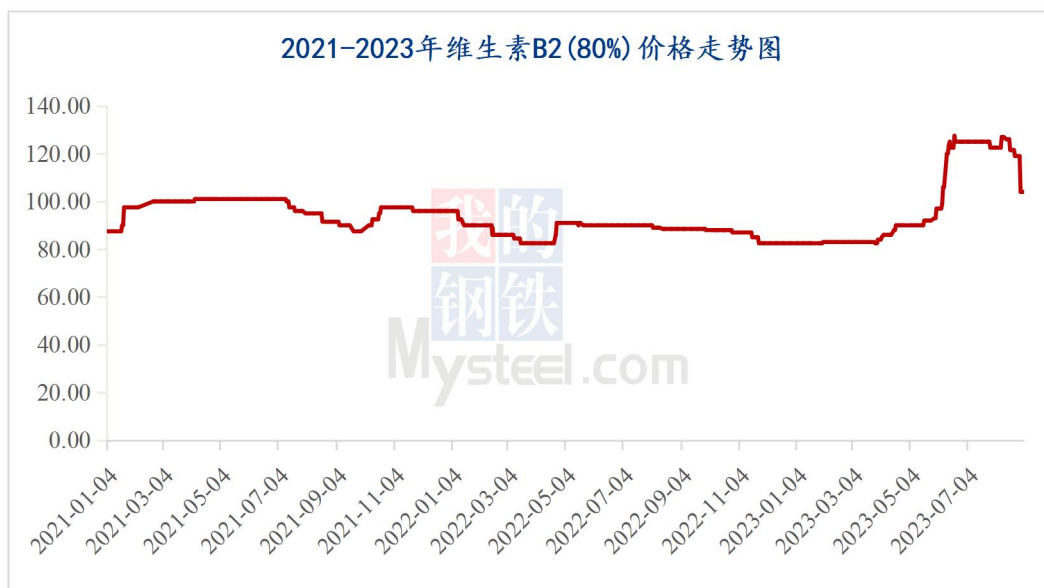
图 7 2021-2023 年维生素 B2（80%）价格走势

截至本月国内 VB2(80%)市场均价为 120.54 元/kg，较上月下调 4.2 元/kg，VB2(98%)市场均价为 372.6 元/kg/kg，较上月下调 2.39 元/kg。上游工厂挺价意愿强烈，市场报价宽泛，局部价格略低，市场需求一般，成交一般。价格维持平稳，根据品牌、日期不同，局部价格略低。6月6日，梅花生物上调 80%维生素 B2 报价为 150 元/kg。6月13日，海嘉诺上调 80%维生素 B2 报价为 153 元/kg。6月13日，山东丰银上调 80%维生素 B2 报价为 155 元/kg。