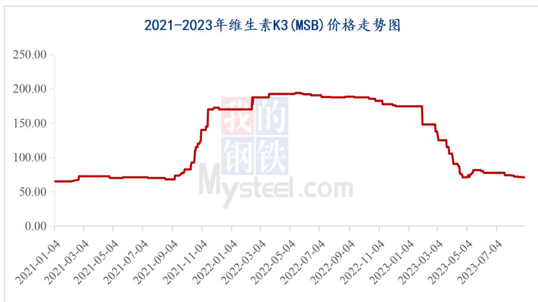
图 10 2021-2023 年维生素 K3 价格走势图

截至本月国内维生素 K3 (MSB) 市场均价 72.1 元/kg, 较上月下调 4.20 元/kg, MNB 市场均价为 85 元/kg, 较上月下调 5.57 元/kg。下游需求一般, 上游工厂发货正常, 需求弱, 生产商以出货为主。由于烟酰胺市场价格明显下滑, 难以对维生素 K3 (MNB) 提供价格支撑。市场价格基本维持平稳, 实单议价成交为主。