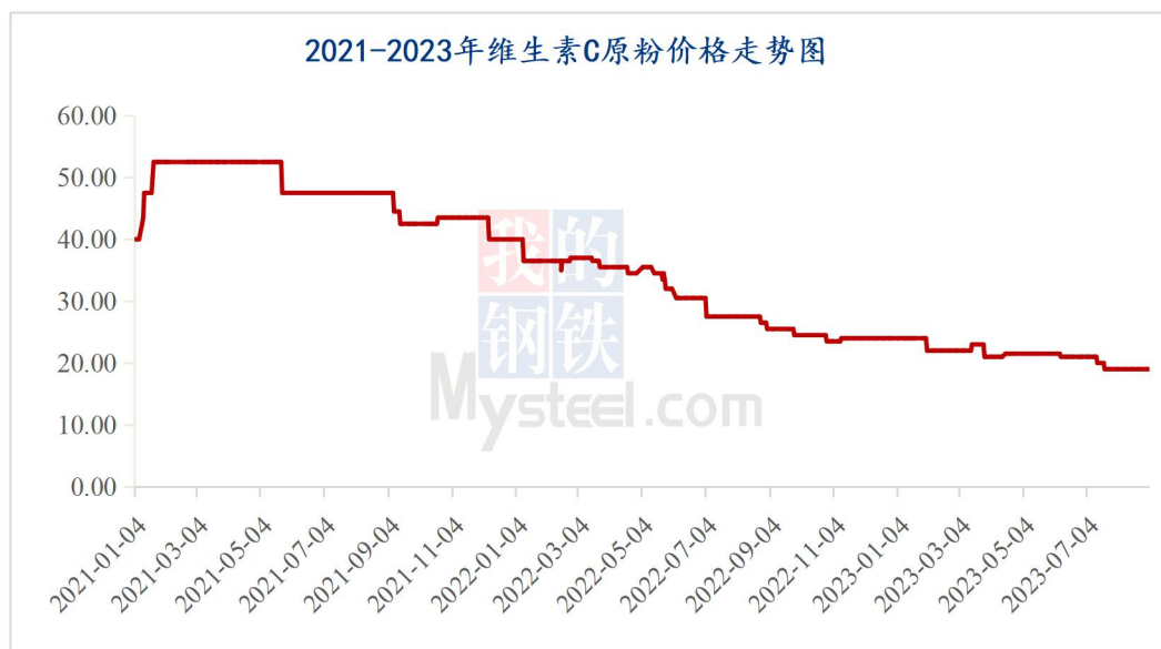
图 3 2021-2023 年维生素 C 价格走势

截至本月 VC 原粉国内市场均价 19 元/kg，较上月下跌 1.1 元/kg，下游需求一般，终端适量补货，部分品牌略低一些。