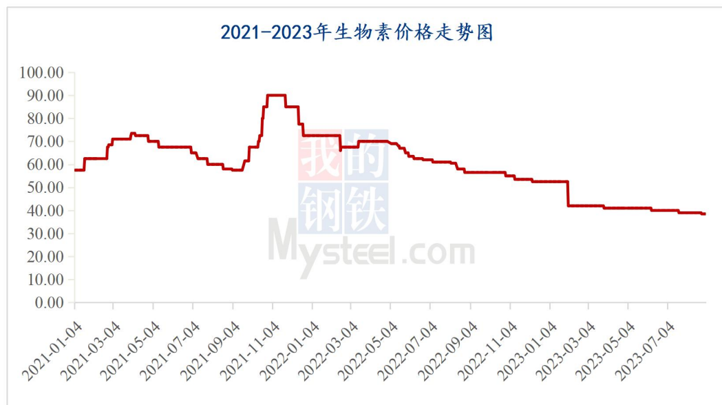
图 12 2021-2023 年生物素价格走势走势图

截至本月国内 2%生物素市场价格在 38.89 元/kg，较上月下调 0.78 元/kg，市场询单一般，交投价格平稳偏弱，部分价格略低。欧洲 2%生物素报价 3.7-3.8 欧元/kg。