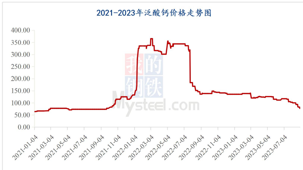
图 5 2021-2023 年泛酸钙价格走势图