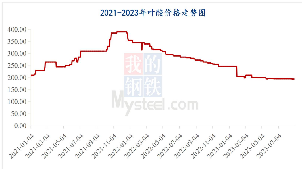
图 11 2021-2023 年叶酸价格走势走势图