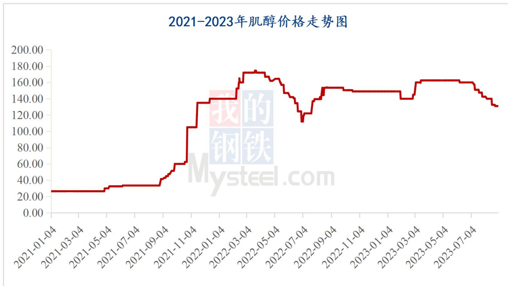
图 14 2021-2023 年肌醇价格走势图