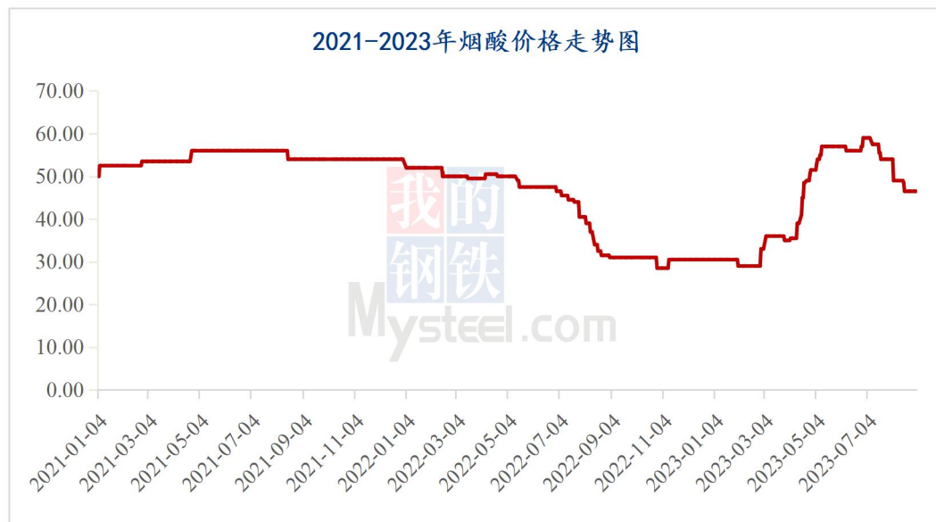
图 15 2021-2023 年烟酸价格走势图

截至本月国内市场均价为 48.43 元/kg，较上月下调 7.89 元/kg，厂家涨价意愿较强，但市场持观望态度为主，成交价格较上月明显下调。