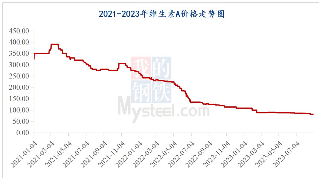
图 1 2021-2023 年维生素 A 价格走势图

据 Mysteel 对全国维生素市场价格调查，截至本月维生素 A500 市场国内均价在 83.6 元/kg，较上月价格下跌 2.32 元/kg，采购需求持续偏弱，市场报价基本维持平稳，根据品牌、日期不同，局部价格略低。欧洲 VA1000 市场报价 19.00-21.00 欧元/kg。5 月 23 日，浙江医药维生素 A 报价 90 元/kg。