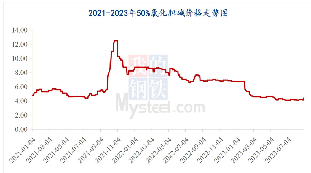
图 16 2021-2023 年氯化胆碱价格走势

截至本月底国内氯化胆碱市场均价 4.19 元/kg。较上月上调 0.01 元/kg，胆碱主要原料三甲胺、环氧乙烷价格窄幅波动，胆碱工厂报价动态微调，后期需关注胆碱成本端价格变化及生产出货情况。7 月 12 日，受上游原料价格上涨影响，山东丰银饲料级 50% 氯化胆碱价格上调至 4.1 元/kg，60%氯化胆碱价格上调至 4.6 元/kg。7 月 13 日，受原料价格上涨影响，辽宁中信生物上调 50%氯化胆碱报价为 4.4 元/kg。