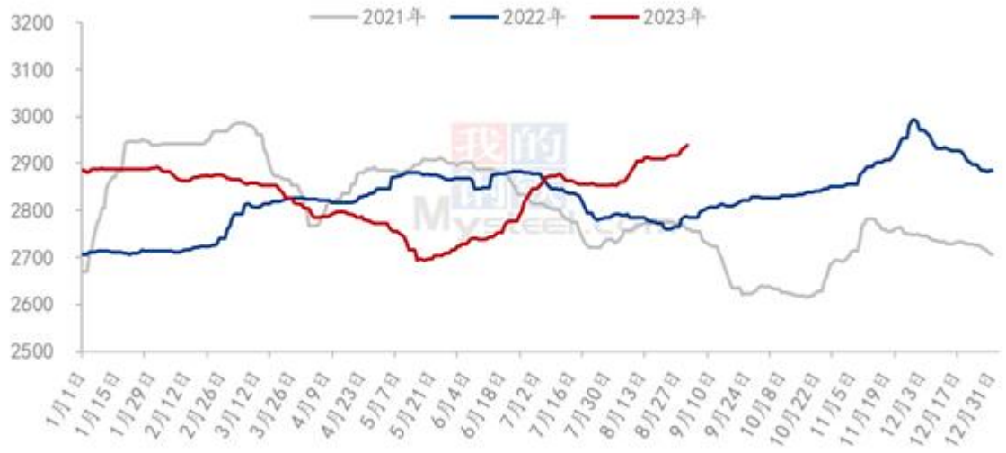
图 17 2021-2023 年全国玉米均价走势图