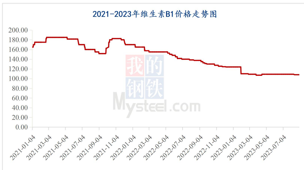
图 6 2021-2023 年维生素 B1 价格走势图

截至本月底国内维生素 B1 市场均价在 108.4 元/kg，较上月下调 0.6 元/kg，下游需求较弱，上游工厂挺价意愿较强，市场观望为主，价格平稳略强。4 月 21 日，受维生素 B1 主要原材料价格上涨影响，兄弟科技硝酸 B1 报价 120 元/kg，盐酸 B1 报价 150 元/kg。6 月 15 日，天新药业计划于 7 月 1 日开始，进行为期 8-10 周的夏季停产检修。