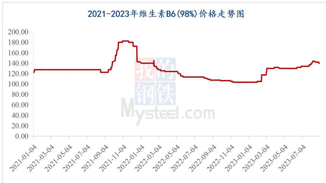
图 8 2021-2023 年维生素 B6 价格走势图