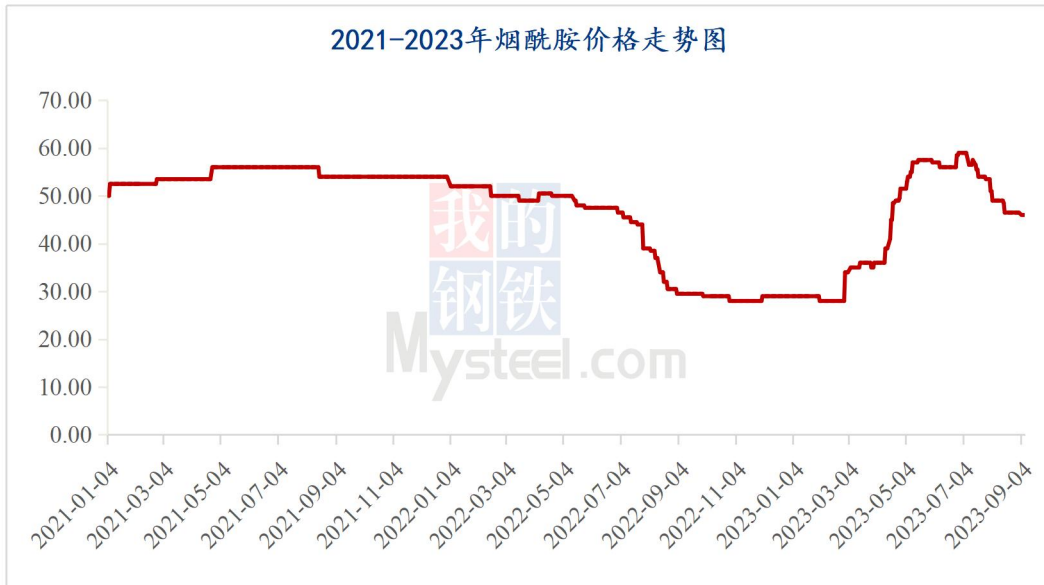
图 13 2021-2023 年烟酰胺价格走势图

本周国内市场主流报价 42-46 元/kg，价格较为平稳，市场询单一般，交投价格平稳偏弱，部分价格略低。