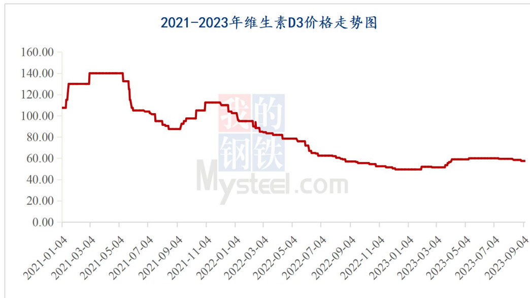
图 4 2021-2023 年维生素 D3 价格走势图

本周国内维生素 D3 国内市场主流价格为 56-59 元/kg，欧洲市场报价为 7.5-8.0 欧元/kg。市场需求一般，上游挺价意愿较强，经销渠道出货积极，价格平稳运行。