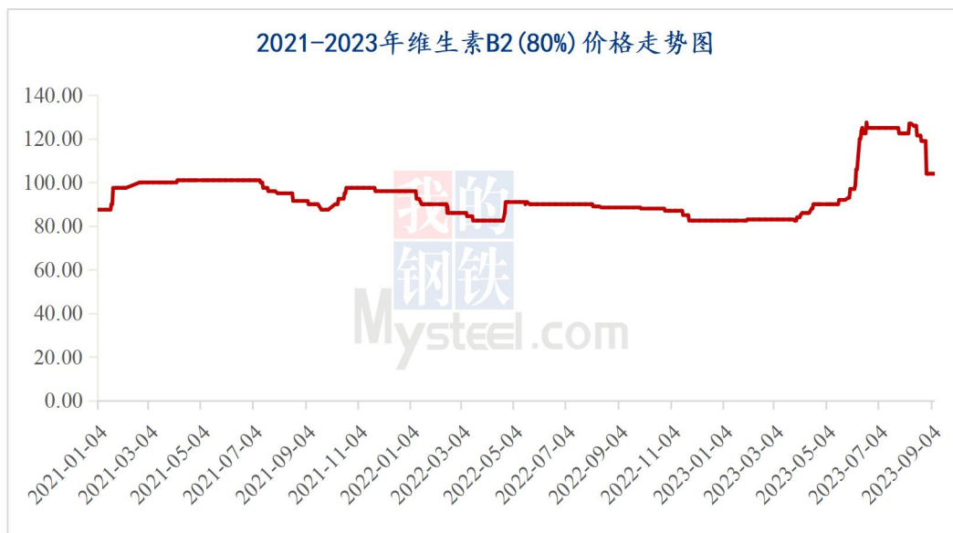
图 7 2021-2023 年维生素 B2 (80%) 价格走势

本周国内 VB2(80%)市场价格 94-100 元/kg，欧洲市场价格 15.0-16.5 欧元/kg，VB2(98%)市场价格 340-375 元/kg。市场询单活跃，上游工厂挺价意愿强烈，贸易渠道报价相对坚挺，观望情绪较浓，成交一般，根据品牌、日期不同，局部价格略低。7月4日，广济药业饲料级 80%维生素 B2 价格上调至 160 元/KG。7月5日，海嘉诺饲料级 80%维生素 B2 价格上调至 162 元/kg。7月7日，山东丰银饲料级 80%维生素 B2 价格上调至 165 元/kg。6月13日，海嘉诺上调 80%维生素 B2 报价为 153 元/kg。6月13日，山东恩贝丰银调整报价 155 元/kg。6月6日，梅花生物上调 80%维生素 B2 报价为 150 元/kg。