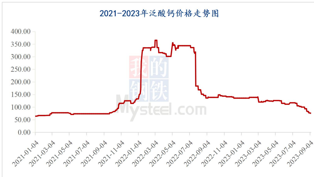
图 5 2021-2023 年泛酸钙价格走势图