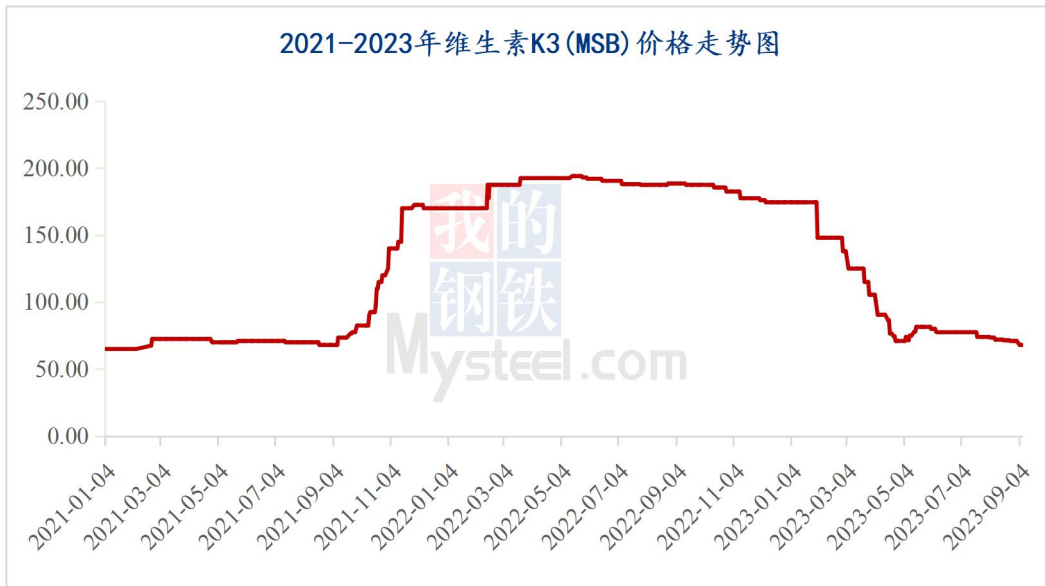
图 10 2021-2023 年维生素 K3 价格走势

本周国内维生素 K3（MSB）市场主流价格在 66-70 元/kg，MNB 市场价格在 76-78 元/kg。下游需求一般，下游需求一般，上游工厂发货正常，市场价格基本维持平稳，实单议价成交为主。