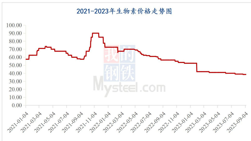
图 12 2021-2023 年生物素价格走势走势图

本周国内 2%生物素市场价格在 37-40 元/kg，市场询单一般，交投价格平稳偏弱，部分价格略低，欧洲 2%生物素报价 3.90-4.10 欧元/kg。