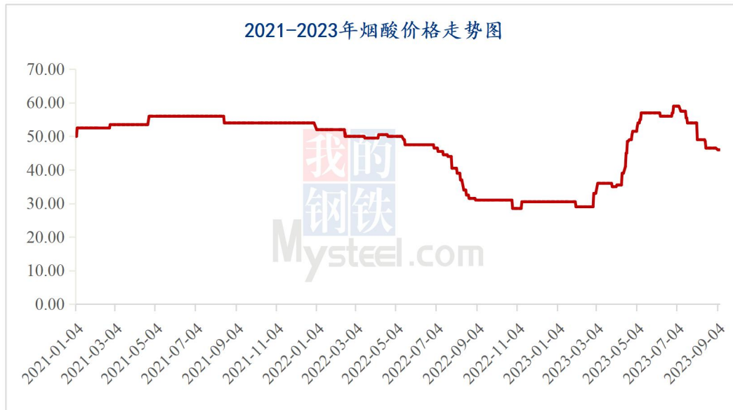
图 15 2021-2023 年烟酸价格走势图

本周国内市场主流报价 42-46 元/kg，市场成交较为平稳，市场询单一般，交投价格平稳偏弱，部分价格略低。