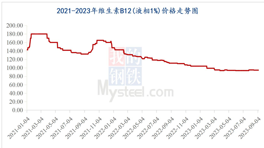
图 9 2021-2023 年维生素 B12 价格走势图

本周国内市场主流报价 93-96 元/kg，整体价格基本平稳，市场需求一般，价格较上周平稳运行。