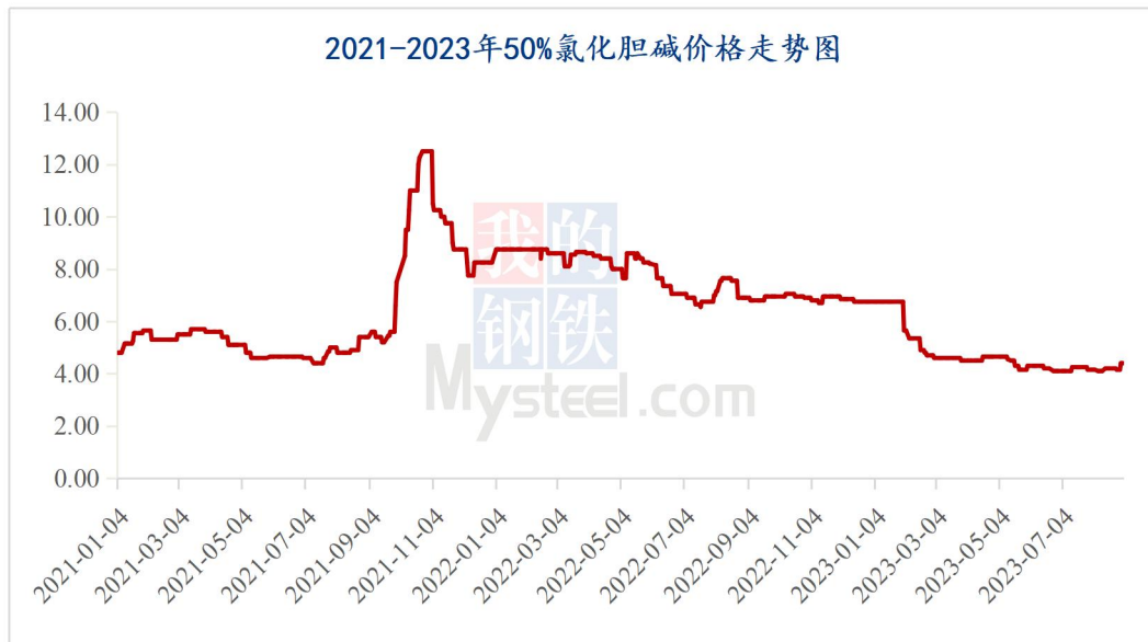
图 16 2021-2023 年氯化胆碱价格走势图