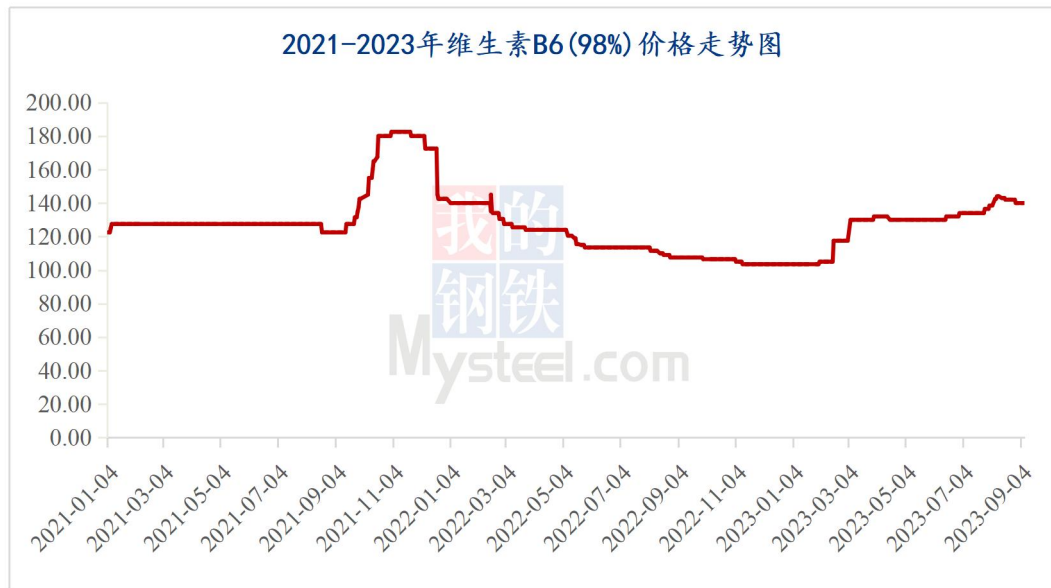
图 8 2021-2023 年维生素 B6 价格走势图