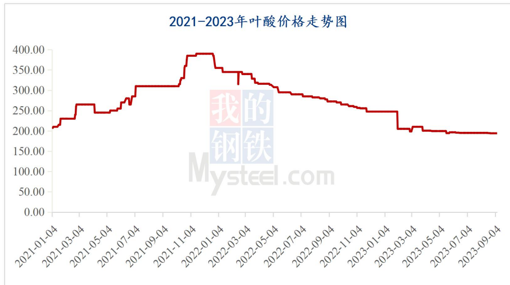
图 11 2021-2023 年叶酸价格走势走势图