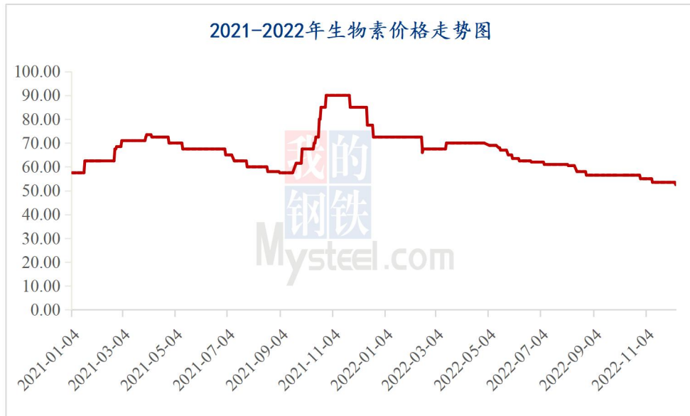
图 12 2021-2022 年生物素价格走势图

本周国内 2%生物素市场价格在 43-46 元/kg，市场询单一般，交投价格平稳偏弱，部分价格略低。欧洲 2%生物素报价 5.45-5.70 欧元/kg。