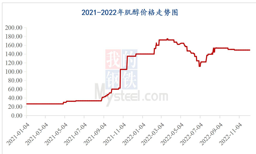
图 14 2021-2022 年肌醇价格走势

本周国内市场主流报价 150-160 元/kg，肌醇近期货源基本消耗完，主流工厂价格有所上调。目前，根据不同品牌，主流厂家报价在 165-180 元/kg，中国出口 FOB 价格在 19-21 美元左右。整体价格基本平稳。