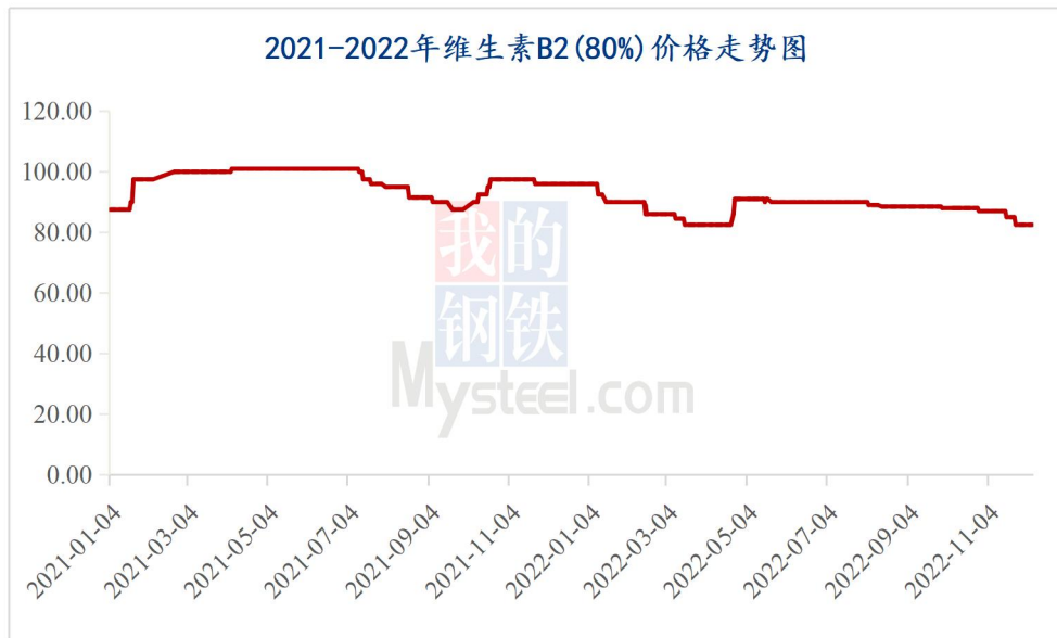
图 7 2021-2022 年维生素 B2 (80%) 价格走势图