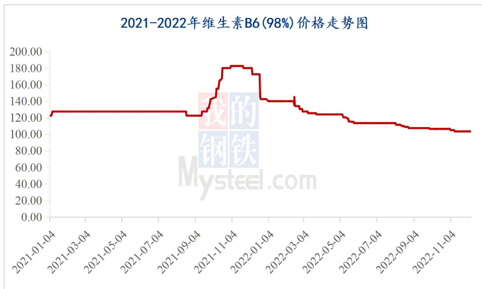
图 8 2021-2022 年维生素 B6 价格走势图

本周国内市场主流报价 110-114 元/kg，市场需求一般，价格较上周平稳运行。