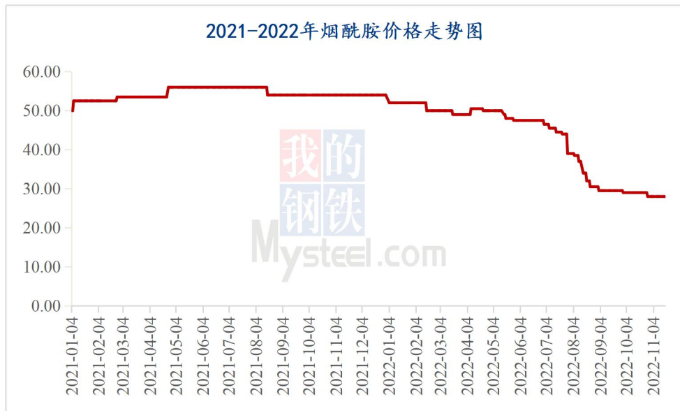
图 13 2021-2022 年烟酰胺价格走势