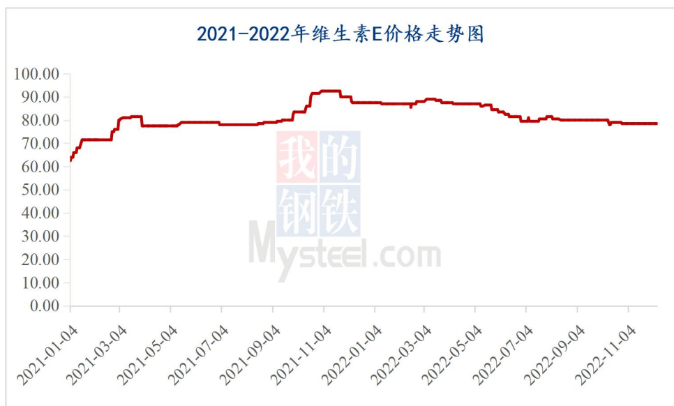
图 2 2021-2022 年维生素 E 价格走势图

本周国内维生素 E 市场报价 80-82 元/kg，下游需求一般，终端适量补货，市场价格平稳偏弱，根据品牌、日期不同，局部有低价货源。欧洲市场贸易商报价 8.80-9.30 欧元/kg。