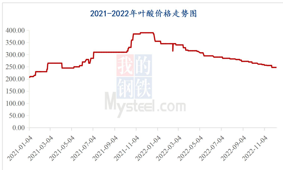
图 11 2021-2022 年叶酸价格走势图