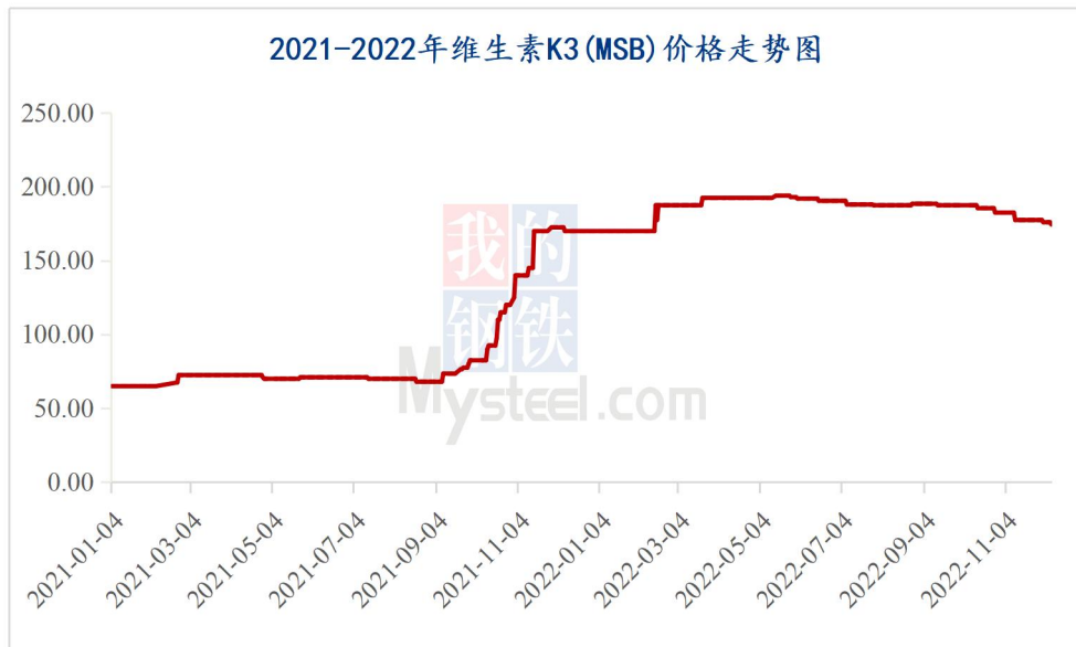
图 10 2021-2022 年维生素 K3 价格走势图