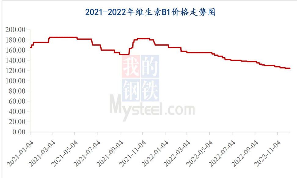
图 6 2021-2022 年维生素 B1 价格走势

本周国内维生素 B1 市场报价在 120-126 元/kg，受成本上涨影响，B1 工厂挺价意愿较强，下游需求偏弱，询单一般，市场价格维持弱稳。