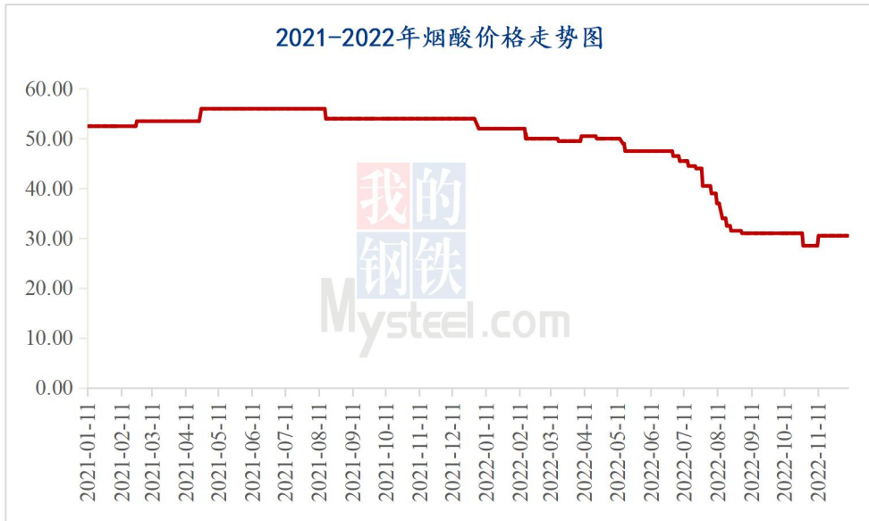
图 15 2021-2022 年烟酸价格走势

本周国内市场主流报价 28-32 元/kg，本周询单较上周价格小幅上调，整体弱势调整。由于工厂前期低价位持续接单，外加疫情等不可控因素对生产和物流造成的影响，主流工厂均超负荷运行，部分工厂交期排到中国年后。虽市场报价略微提高，但成交价格仍有可议空间。市场报价国内 CNY 27-28 左右，出口 USD 3.6-3.8 左右；预计交货会持续紧张，但价格是否上一个台阶，还有待观望。