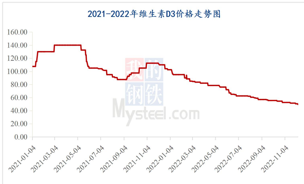
图 4 2021-2022 年维生素 D3 价格走势图