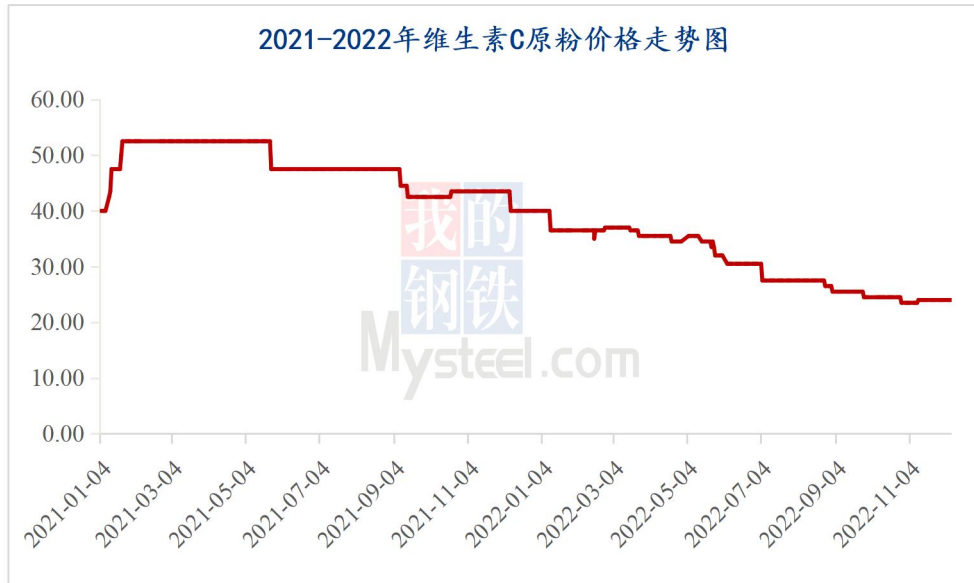
图 3 2021-2022 年维生素 C 价格走势

本周 VC 原粉国内市场报价 22-23 元/kg，下游需求一般，终端适量补货，主流厂家 11 月 2 日起暂停对外报价，市场关注度增加，出口 FOB 报价在 2.6-2.8 美元，部分品牌略低一些。