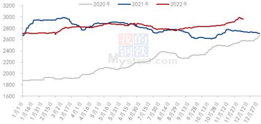
图 17 2020-2022 年全国玉米均价走势图