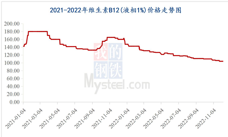
图 9 2021-2022 年维生素 B12 价格走势图