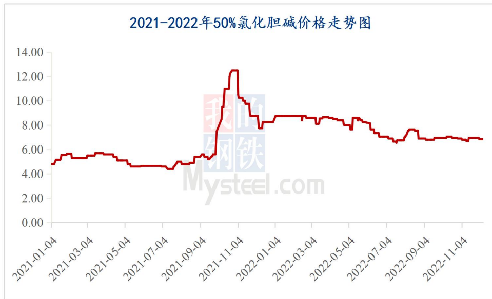
图 16 2021-2022 年氯化胆碱价格走势