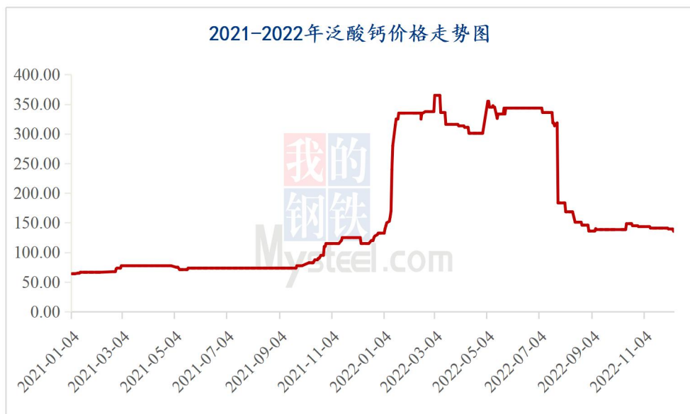
图 5 2021-2022 年泛酸钙价格走势图

本周国内泛酸钙市场主流价格在 150-160 元/kg，市场需求一般，整体价格基本平稳，略有小幅波动。据了解,本周国内有厂家泛酸钙报价上调至 RMB180/KG。近期工厂一直供货紧张，限量签单。欧洲市场主流报价 22.2-23.5 欧元/kg，价格平稳。后续关注工厂发货情况。