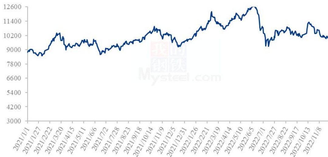
全国豆油均价走势图（元/吨）