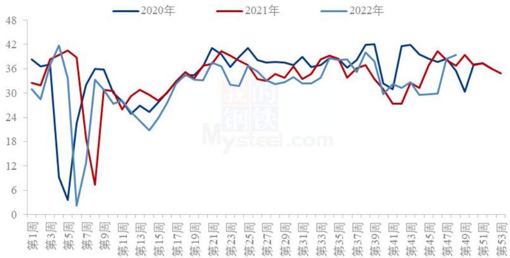
主要油厂豆油周度产量统计（万吨）