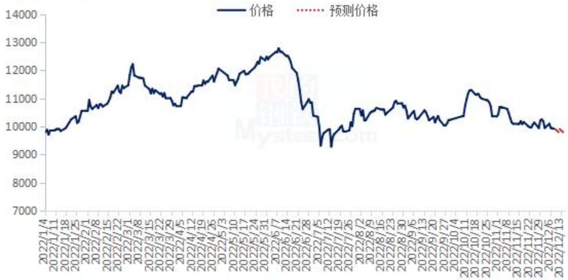
豆油价格走势预测图 (元/吨)