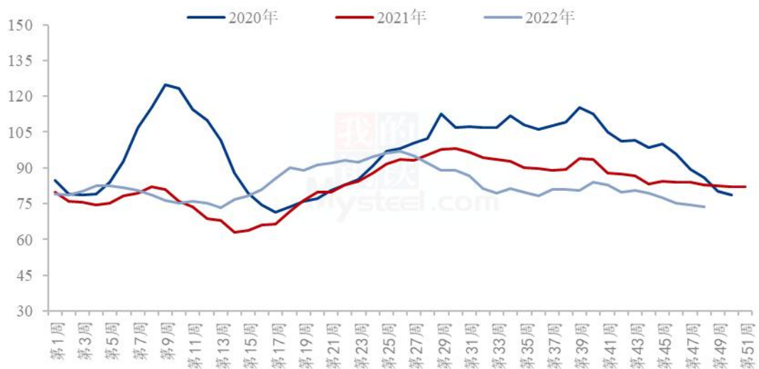
全国重点油厂豆油库存统计（万吨）

据 Mysteel 调研显示，截至 2022 年 12 月 2 日（第 48 周），全国重点地区豆油商业库存约 73.835 万吨，较上周减少 0.725 万吨，降幅 0.97%。