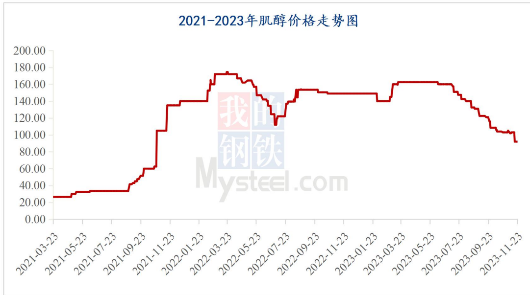
图 14 2021-2023 年肌醇价格走势图

本周国内肌醇主流厂家提高报价至 88-96 元/kg，市场需求较弱，后期需关注工厂生产和发货情况。