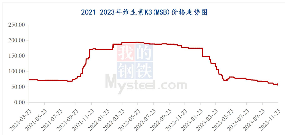
图 10 2021-2023 年维生素 K3 价格走势图

本周国内维生素 K3 (MSB) 市场主流价格在 60-62 元/kg，MNB 市场价格在 71-72 元/kg。下游需求活跃，上游工厂发货正常，市场价格较上周小幅上调，实单议价成交为主。