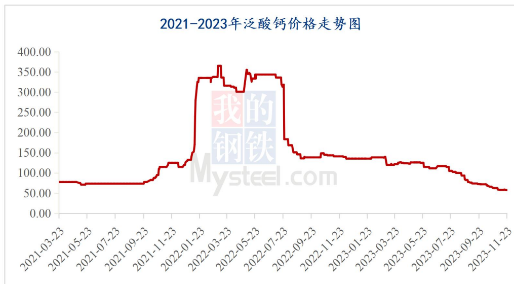
图 5 2021-2023 年泛酸钙价格走势

本周国内泛酸钙市场主流价格在 56-59 元/kg，上游工厂报价暂稳，下游需求一般，市场价格偏稳运行，实单议价。