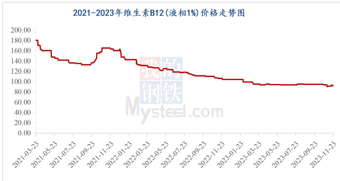
图 9 2021-2023 年维生素 B12 价格走势图