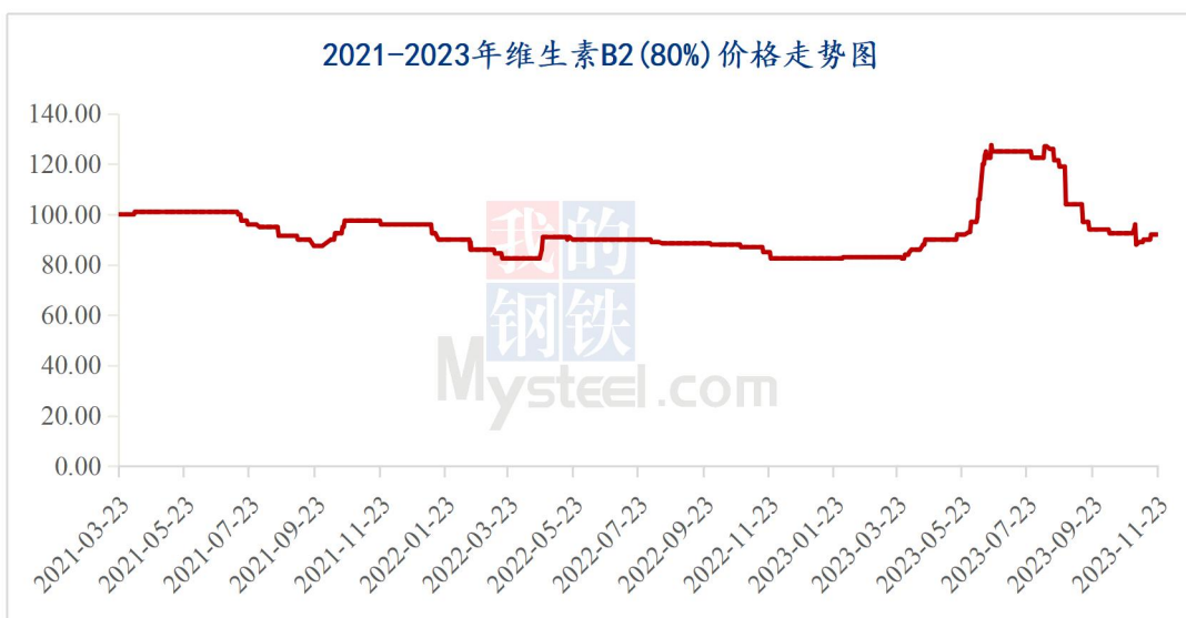
图 7 2021-2023 年维生素 B2（80%）价格走势

本周国内 VB2(80%)市场价格 90-94 元/kg，VB2(98%)市场价格 300 元/kg。市场询单一般，贸易渠道报价相对稳定，观望情绪较浓，成交一般，根据品牌、日期不同，局部价格略低。