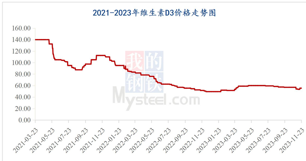
图 4 2021-2023 年维生素 D3 价格走势