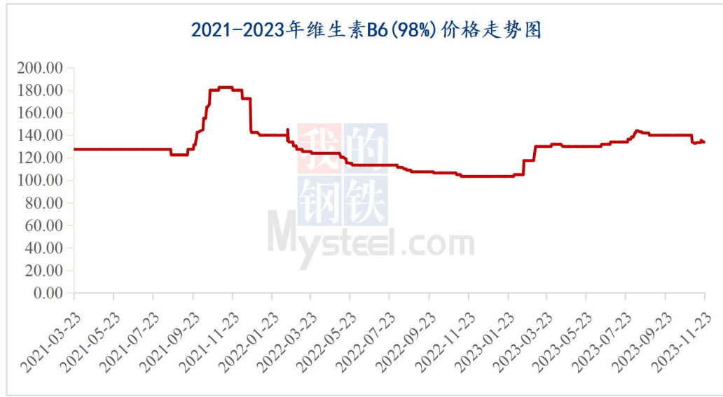
图 8 2021-2023 年维生素 B6 价格走势图

本周国内市场主流报价 130-138 元/kg，价格暂时企稳。市场需求一般，价格较上周小幅下调。6月15日，天新药业饲料级 VB6 停报停签。10月11日，天新药业饲料级 VB6 停报停签。