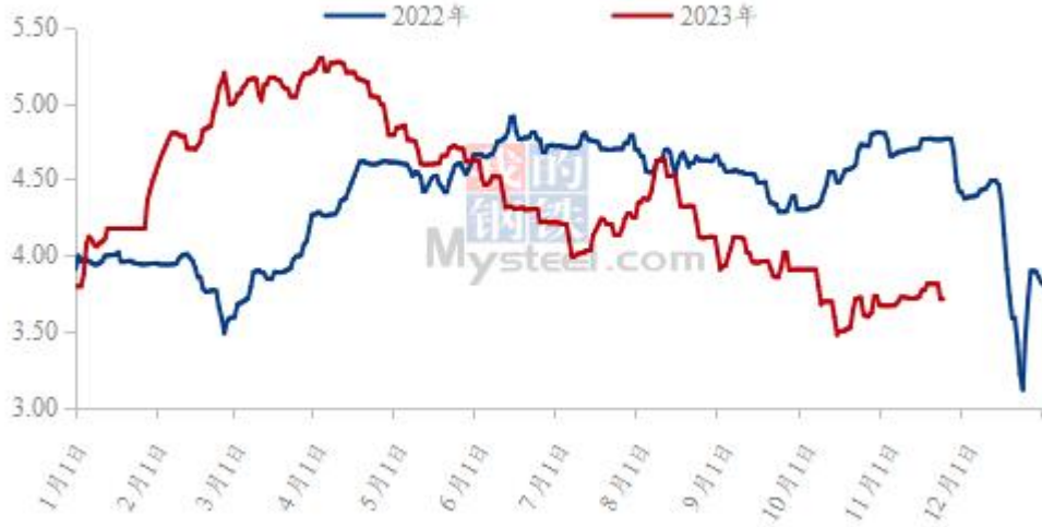
图 19 全国白羽肉鸡均价走势图