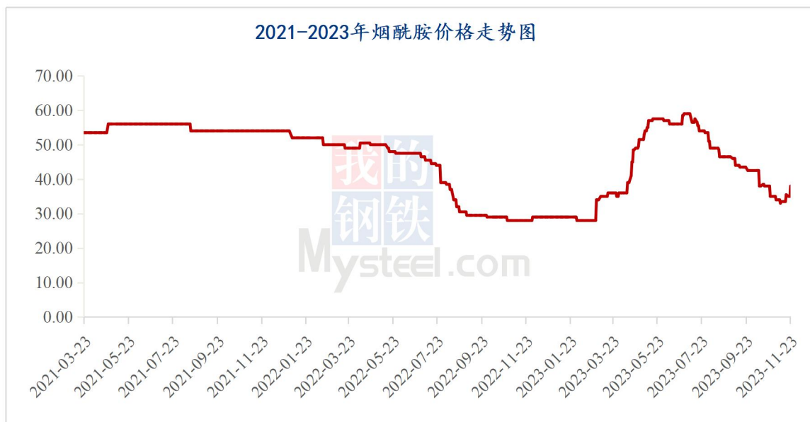
图 13 2021-2023 年烟酰胺价格走势

本周国内市场主流报价 37-39 元/kg，价格较上周小幅上涨，市场询单一般，交投价格平稳偏强，部分价格略低。