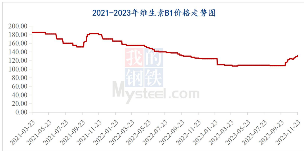
图 6 2021-2023 年维生素 B1 价格走势

本周国内维生素 B1（80%）市场报价在 130-132 元/kg，下游需求较稳，市场询单和寻货较活跃，成交价格偏稳运行。