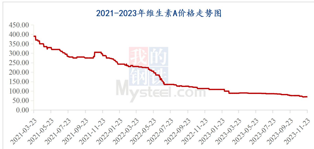
图 1 2023 年维生素 A 价格走势

据 Mysteel 对全国维生素市场价格调查，本周维生素 AVA500 市场价格 69-70 元/kg，采购需求持续偏弱，市场报价偏稳运行。