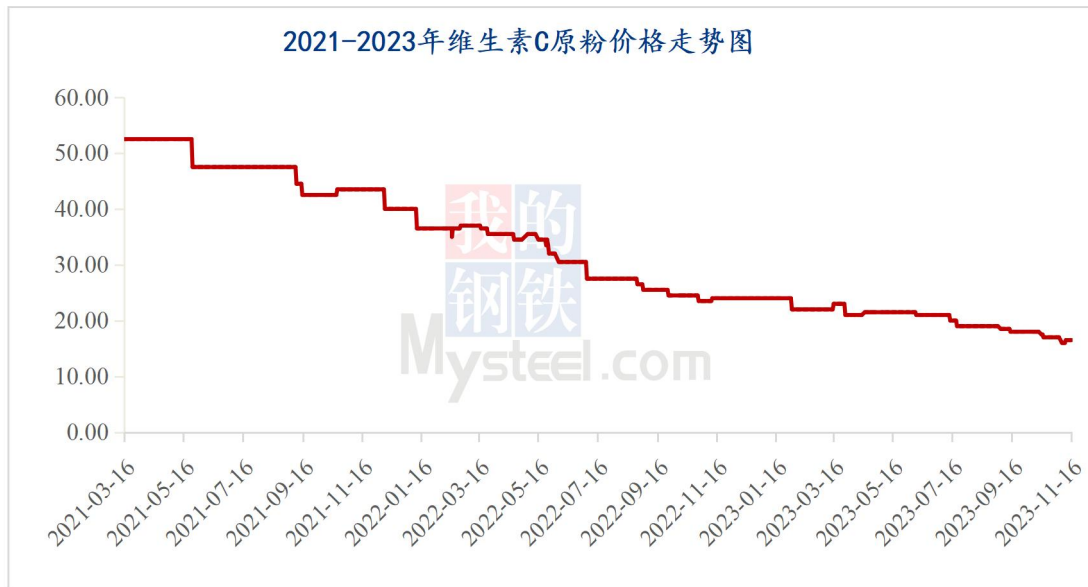
图 3 2021-2023 年维生素 C 价格走势图

本周 VC 原粉国内市场报价 18-20 元/kg，价格小幅上涨，下游需求活跃，询单较为积极，终端适量补货，部分品牌略低一些。