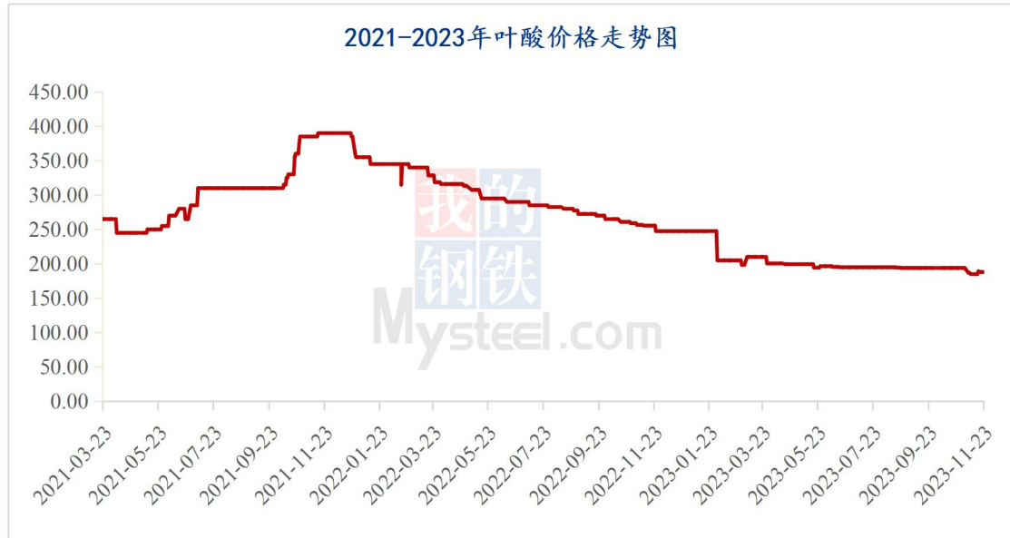
图 11 2021-2023 年叶酸价格走势图

本周国内市场主流报价 185-191 元/kg，叶酸目前总体需求不旺，市场成交一般，价格偏弱运行。6月15日，天新药业饲料级叶酸停报停签。