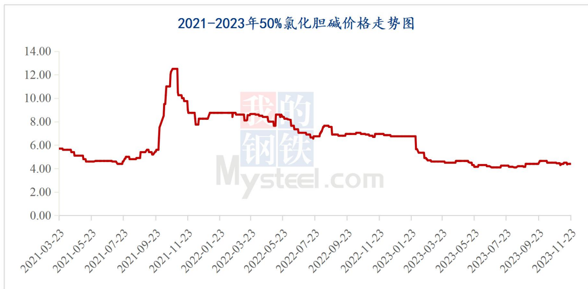
图 16 2021-2023 年氯化胆碱价格走势

本周国内氯化胆碱市场价格 4.3-4.5 元/kg。胆碱，受原料三甲胺价格小幅波动，胆碱工厂报价动态调整，后续主要关注其原料端三甲胺及环氧乙烷变化情况。7 月 12 日，受上游原料价格上涨影响，山东丰银饲料级 50%氯化胆碱价格上调至 4.1 元/kg，60%氯化胆碱价格上调至 4.6 元/kg。7 月 13 日，受原料价格上涨影响，辽宁中信生物上调 50%氯化胆碱报价为 4.4 元/kg。