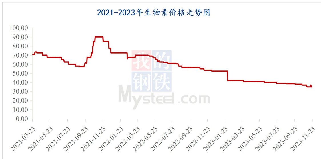
图 12 2021-2023 年生物素价格走势