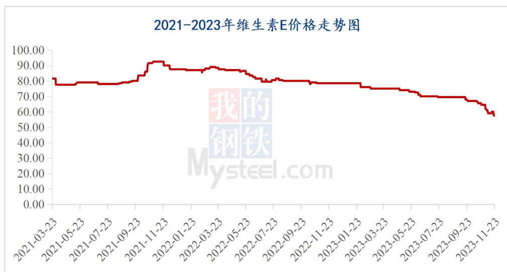
图 2 2021-2023 年维生素 E 价格走势

本周国内维生素 E 市场报价 57-58 元/kg，下游需求一般，终端适量补货，市场价格平稳偏弱，根据品牌、日期不同，局部有低价货源。