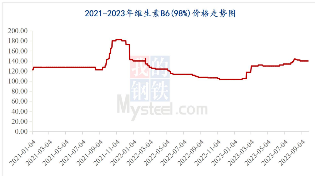
图 8 2021-2023 年维生素 B6 价格走势图