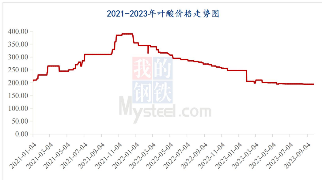
图 11 2021-2023 年叶酸价格走势