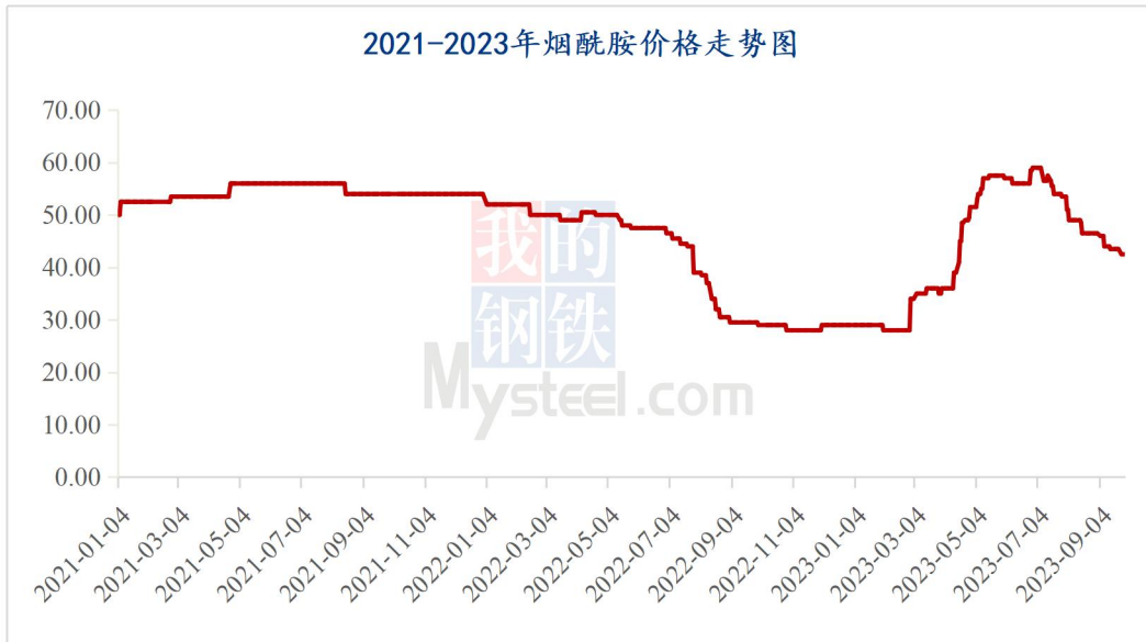
图 13 2021-2023 年烟酰胺价格走势图

本周国内市场主流报价 41-44 元/kg，价格较为平稳，市场询单一般，交投价格平稳偏弱，部分价格略低。