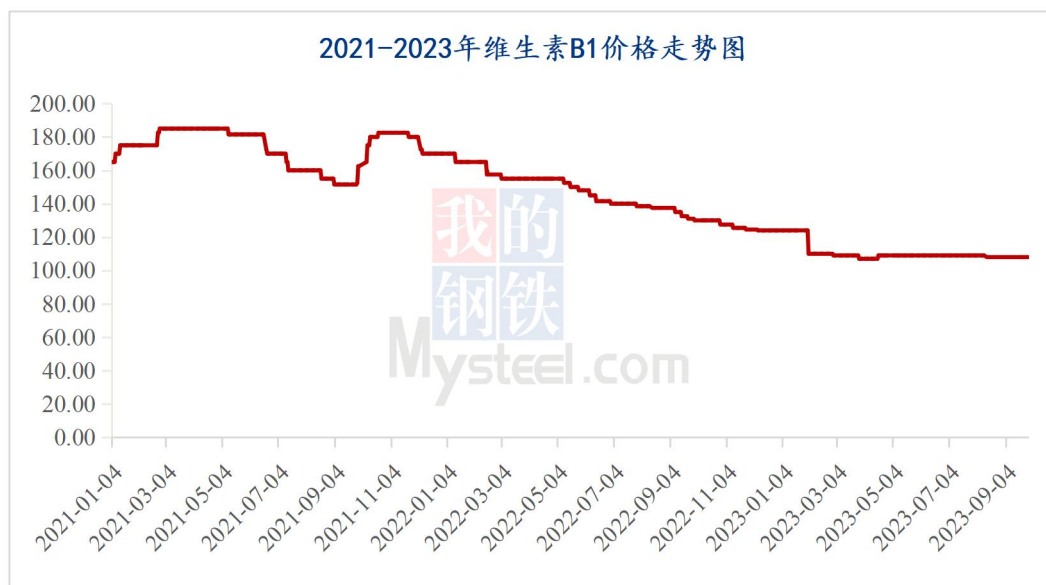
图 6 2021-2023 年维生素 B1 价格走势图

本周国内维生素 B1（80%）市场报价在 106-110 元/kg，下游需求较弱，上游工厂暂停报价，市场观望为主，市场询单和寻货较活跃，价格平稳运行，天新药业计划于 7 月 1 日开始，进行为期 8-10 周的夏季停产检修。4 月 21 日，受维生素 B1 主要原材料价格上涨影响，兄弟科技硝酸 B1 报价 120 元/kg，盐酸 B1 报价 150 元/kg。