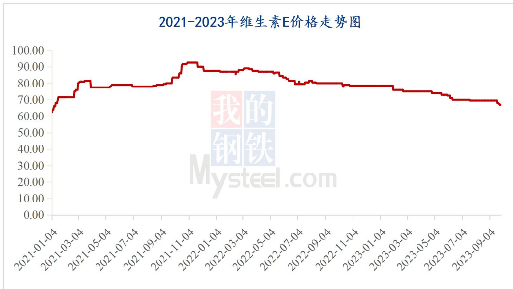
图 2 2021-2023 年维生素 E 价格走势图