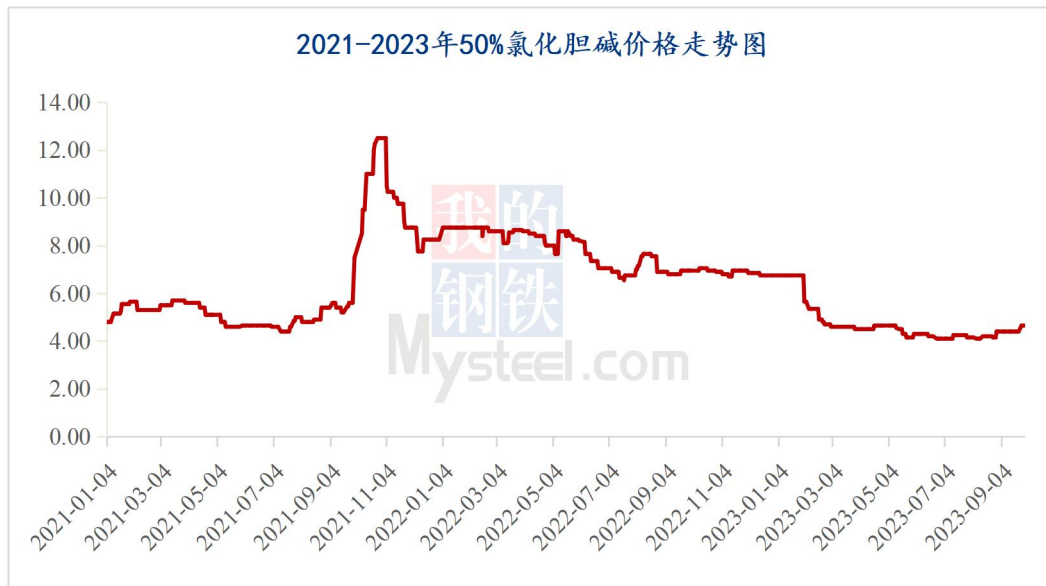
图 16 2021-2023 年氯化胆碱价格走势图