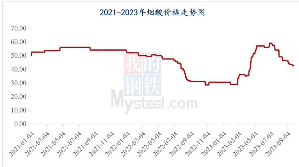
图 15 2021-2023 年烟酸价格走势图

本周国内市场主流报价 41-44 元/kg，市场成交较为平稳，市场询单一般，交投价格平稳偏弱，部分价格略低。