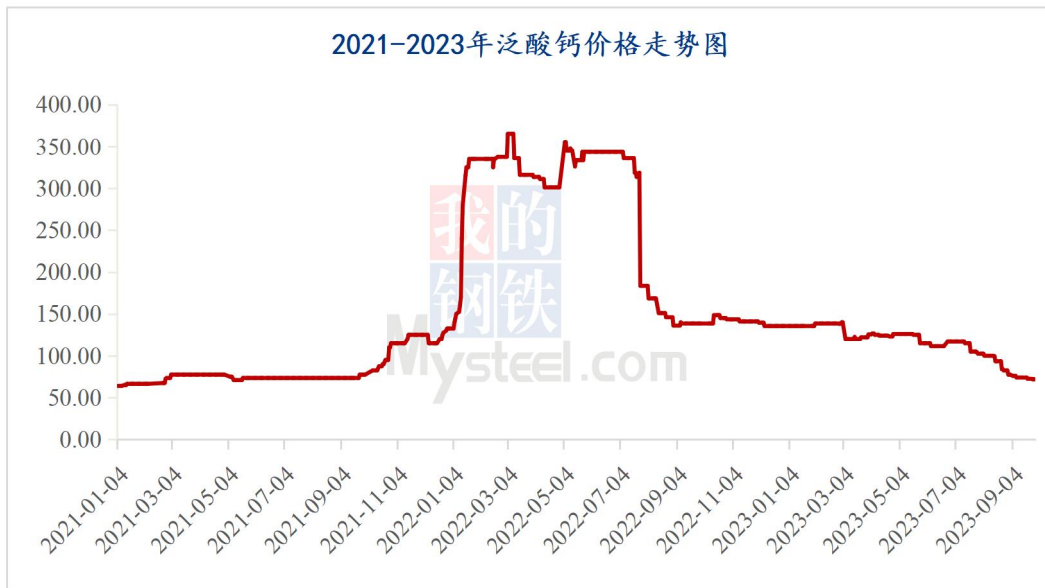
图 5 2021-2023 年泛酸钙价格走势图