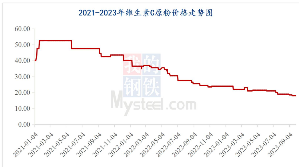
图 3 2021-2023 年维生素 C 价格走势图

本周 VC 原粉国内市场报价 17-19 元/kg，价格平稳，下游需求一般，终端适量补货，部分品牌略低一些。