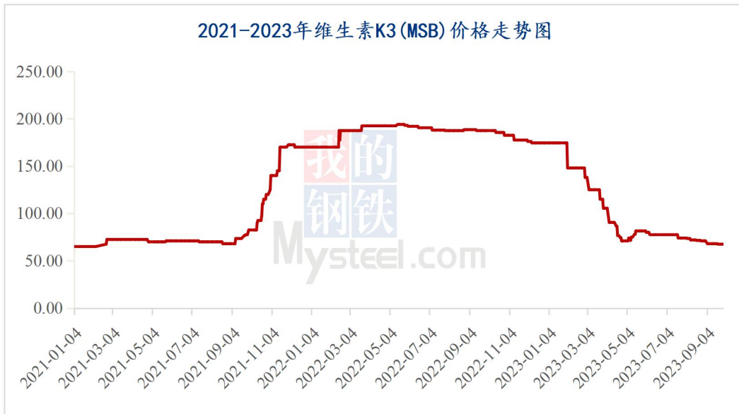
图 10 2021-2023 年维生素 K3 价格走势图

本周国内维生素 K3（MSB）市场主流价格在 65-70 元/kg，MNB 市场价格在 76-78 元/kg。下游需求一般，下游需求一般，上游工厂发货正常，市场价格基本维持平稳，实单议价成交为主。