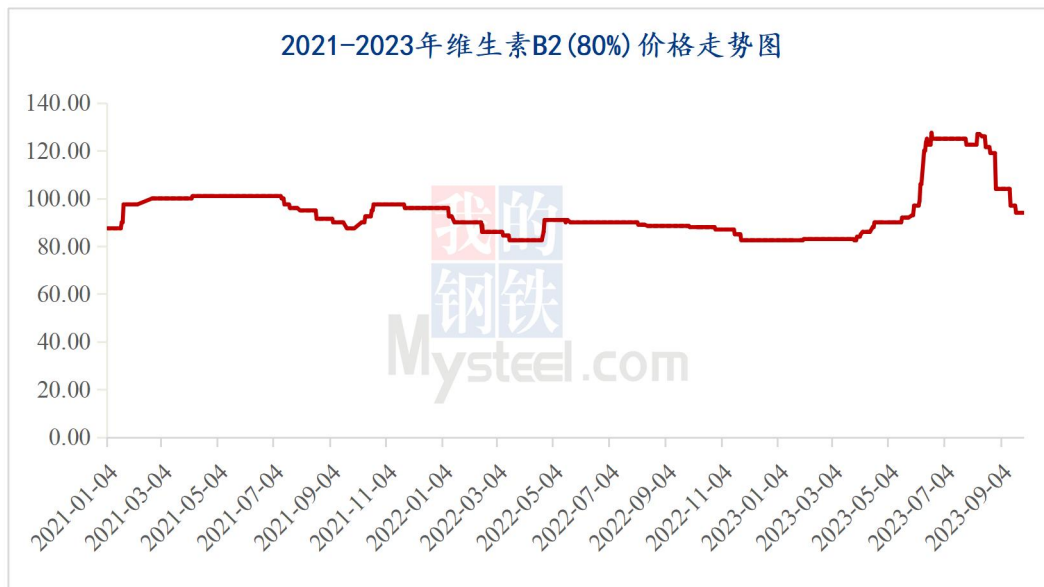
图 7 2021-2023 年维生素 B2（80%）价格走势图

本周国内 VB2(80%)市场价格 92-96 元/kg，VB2(98%)市场价格 340-375 元/kg。市场询单活跃，上游工厂挺价意愿强烈，贸易渠道报价相对坚挺，观望情绪较浓，成交一般，根据品牌、日期不同，局部价格略低。7月4日，广济药业饲料级 80%维生素 B2 价格上调至 160 元/KG。7月5日，海嘉诺饲料级 80%维生素 B2 价格上调至 162 元/kg。7月7日，山东丰银饲料级 80%维生素 B2 价格上调至 165 元/kg。6月13日，海嘉诺上调 80%维生素 B2 报价为 153 元/kg。6月13日，山东恩贝丰银调整报价 155 元/kg。6月6日，梅花生物上调 80%维生素 B2 报价为 150 元/kg。