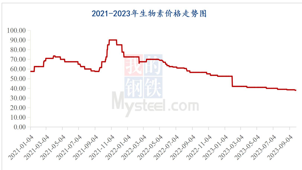
图 12 2021-2023 年生物素价格走势

本周国内 2%生物素市场价格在 37-39 元/kg，市场询单一般，交投价格平稳偏弱，部分价格略低，欧洲 2%生物素报价 3.90-4.10 欧元/kg。