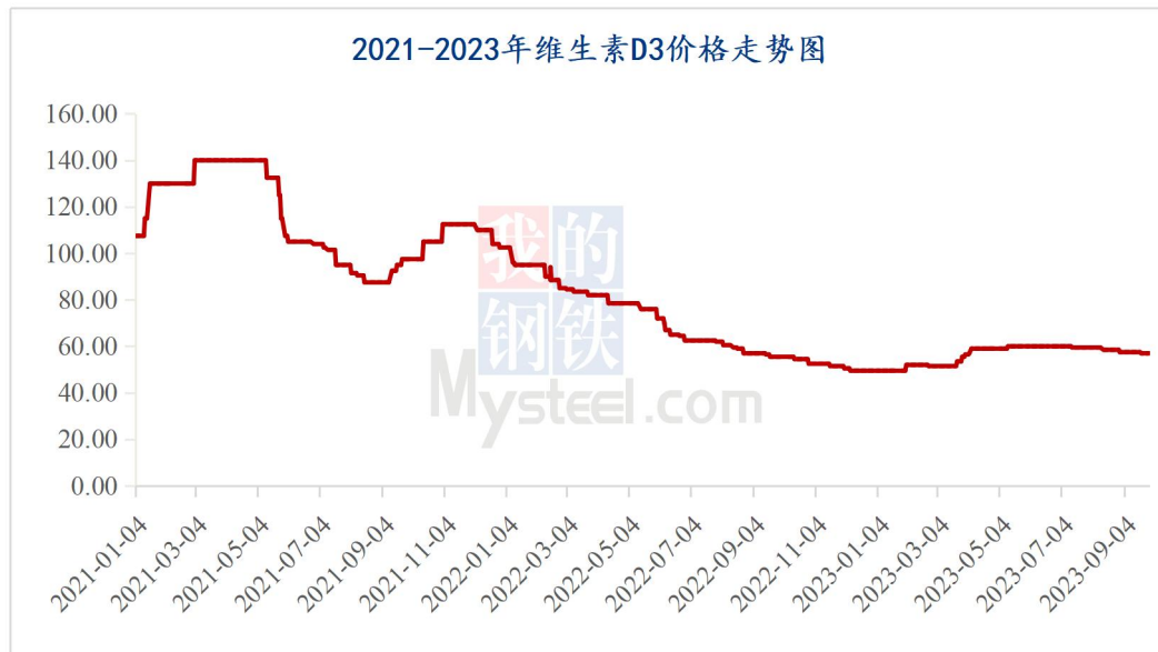
图 4 2021-2023 年维生素 D3 价格走势图

本周国内维生素 D3 国内市场主流价格为 55-59 元/kg，市场需求一般，上游挺价意愿较强，经销渠道出货积极，价格平稳运行。