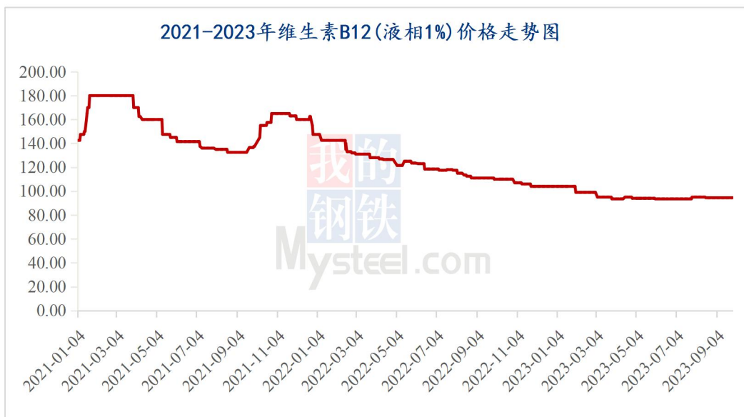
图 9 2021-2023 年维生素 B12 价格走势图

本周国内市场主流报价 93-96 元/kg，整体价格基本平稳，市场需求一般，价格较上周平稳运行。