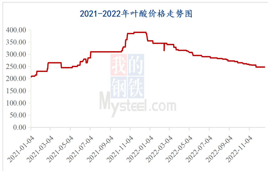
图 11 2021-2022 年叶酸价格走势