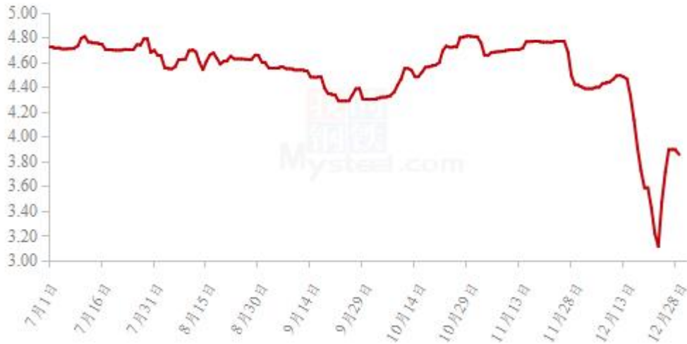
图 19 全国白羽肉鸡均价走势图