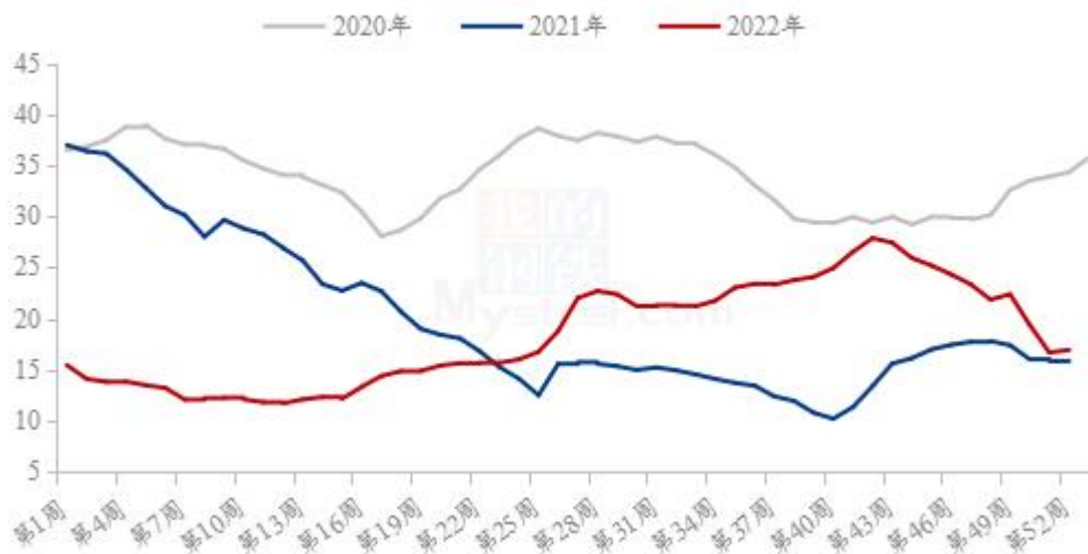
图 18 全国外三元生猪出栏均价走势图