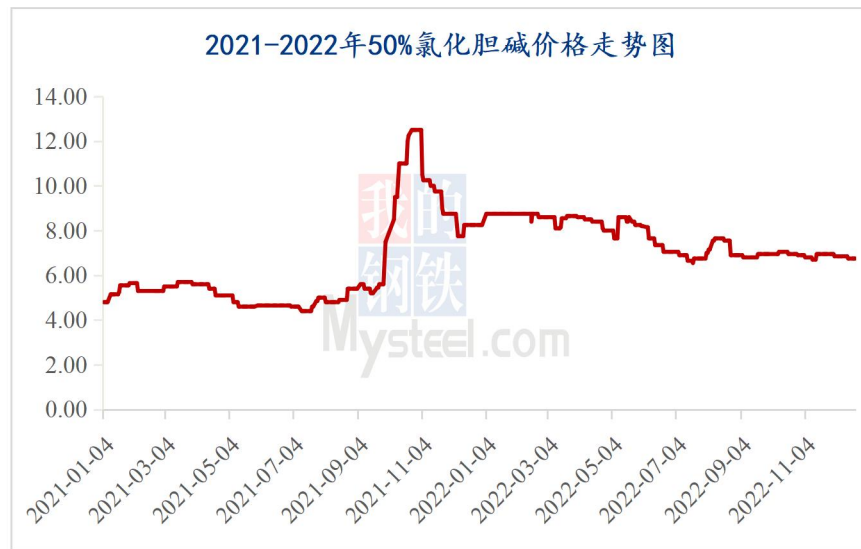
图 16 2021-2022 年氯化胆碱价格走势图

本周国内氯化胆碱市场价格 6.5-6.8 元/kg。胆碱主要原料三甲胺价格高位波动，胆碱工厂报价动态调整，后期需关注胆碱成本端价格变化及生产出货情况。