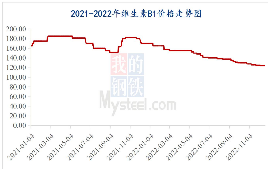
图 6 2021-2022 年维生素 B1 价格走势图