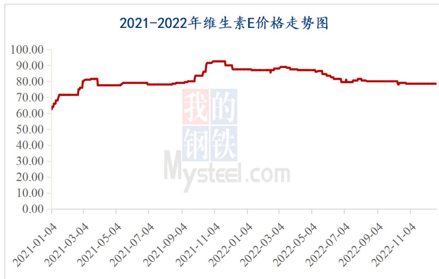
图 2 2021-2022 年维生素 E 价格走势图

本周国内维生素 E 市场报价 78-81 元/kg，下游需求一般，终端适量补货，市场价格平稳偏弱，根据品牌、日期不同，局部有低价货源。欧洲市场贸易商报价 8.80-9.30 欧元/kg。