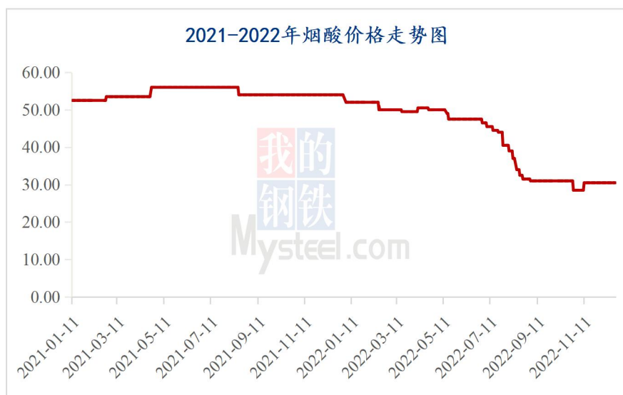
图 15 2021-2022 年烟酸价格走势

本周国内市场主流报价 28-32 元/kg，本周询单较上周价格小幅上调，整体弱势调整。由于工厂前期低价位持续接单，外加疫情等不可控因素对生产和物流造成的影响，主流工厂均超负荷运行，部分工厂交期排到中国年后。虽市场报价略微提高，但成交价格仍有可议空间。市场报价国内 CNY 27-28 左右，出口 USD 3.6-3.8 左右；预计交货会持续紧张，但价格是否上一个台阶，还有待观望。