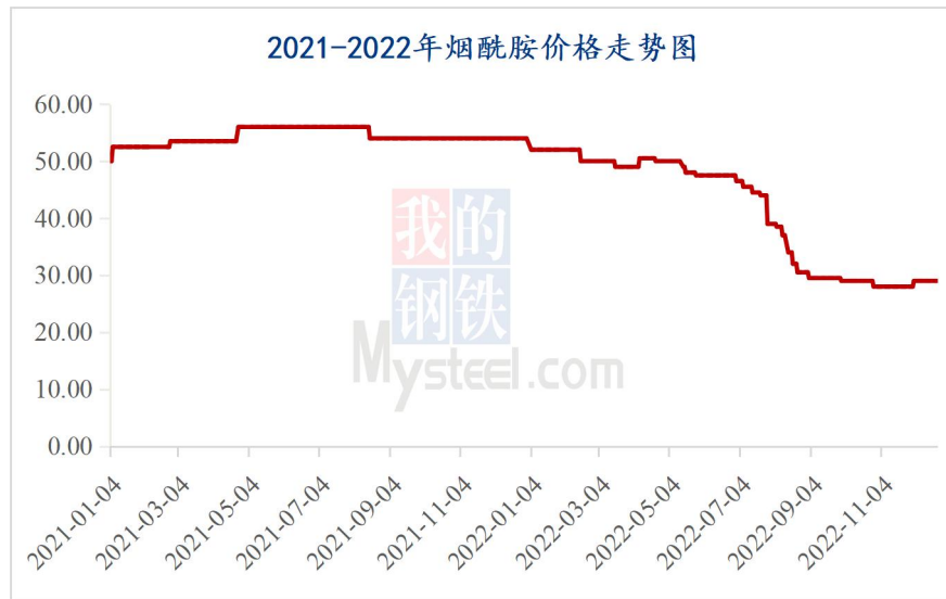
图 13 2021-2022 年烟酰胺价格走势

本周国内市场主流报价 26-28 元/kg，价格小幅上调，整体弱势调整。由于工厂前期低价位持续接单，外加疫情等不可控因素对生产和物流造成的影响，主流工厂均超负荷运行，部分工厂交期排到中国年后。虽市场报价略微提高，但成交价格仍有可议空间。市场报价国内 CNY 27-28 左右，出口 USD 3.6-3.8 左右；预计交货会持续紧张，但价格是否上一个台阶，还有待观望。