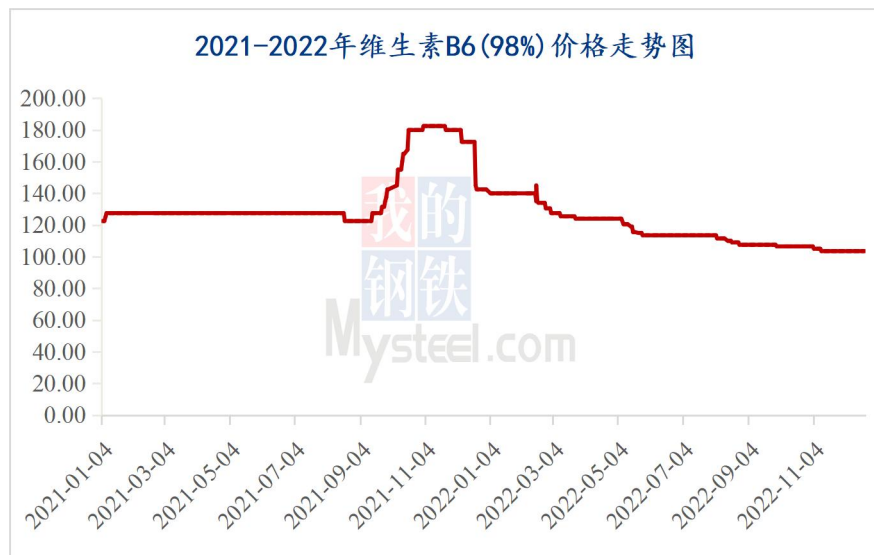
图 8 2021-2022 年维生素 B6 价格走势图

本周价格仍缓慢下跌，近日有企稳迹象。今年以来，B6 竞争格局变化，进入洗牌期，部分厂家接单积极，以价换量。虽然当前进入传统采购旺季，客户对后市预期一般，以即买即用为主。出口报价 USD14/KG 左右。国内市场主流报价 108 元/kg，市场需求一般，价格较上周平稳运行。