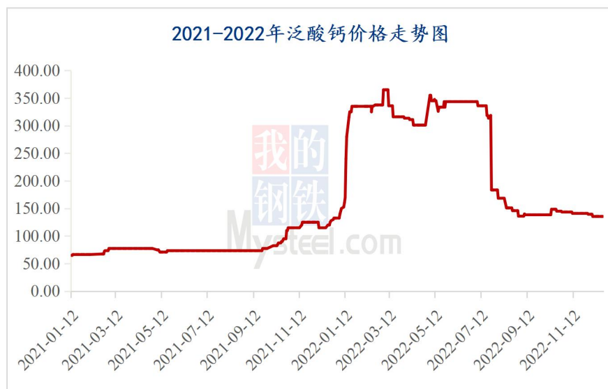
图 5 2021-2022 年泛酸钙价格走势

本周国内泛酸钙市场主流价格在 150-160 元/kg，市场需求一般，整体价格基本平稳，略有小幅波动。据了解,本周国内有厂家泛酸钙报价上调至 RMB180/KG。近期工厂一直供货紧张，限量签单。欧洲市场主流报价 22.2-23.5 欧元/kg，价格平稳。后续关注工厂发货情况。