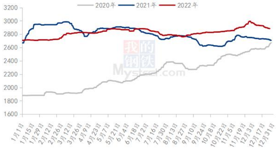
图 17 2020-2022 年全国玉米均价走势图