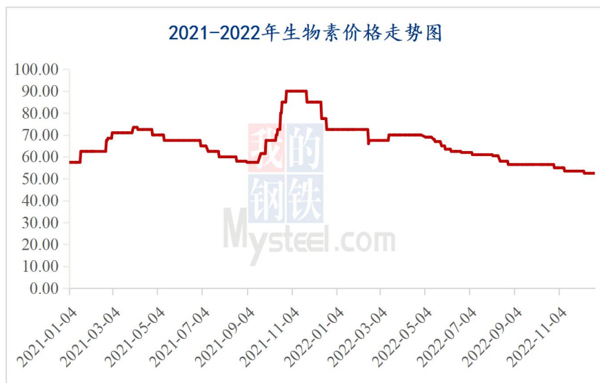
图 12 2021-2022 年生物素价格走势

本周国内 2%生物素市场价格在 43-46 元/kg，市场询单一般，交投价格平稳偏弱，部分价格略低。欧洲 2%生物素报价 5.45-5.70 欧元/kg。