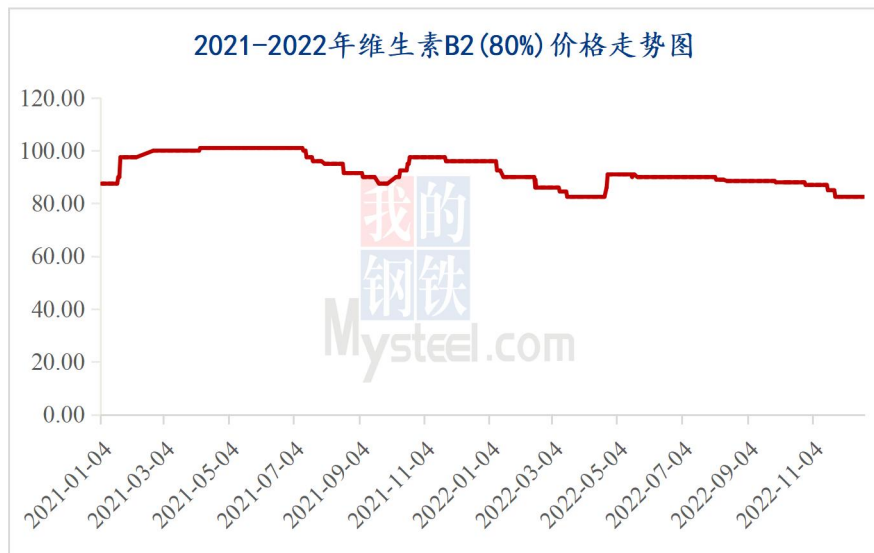
图 7 2021-2022 年维生素 B2 (80%) 价格走势图

本周国内 VB2(80%)市场价格 82-90 元/kg，欧洲市场价格 15-17 欧元/kg，VB2(98%)市场价格 330-350 元/kg。市场需求一般，整体报价有维持平稳，根据品牌、日期不同，局部价格略低。