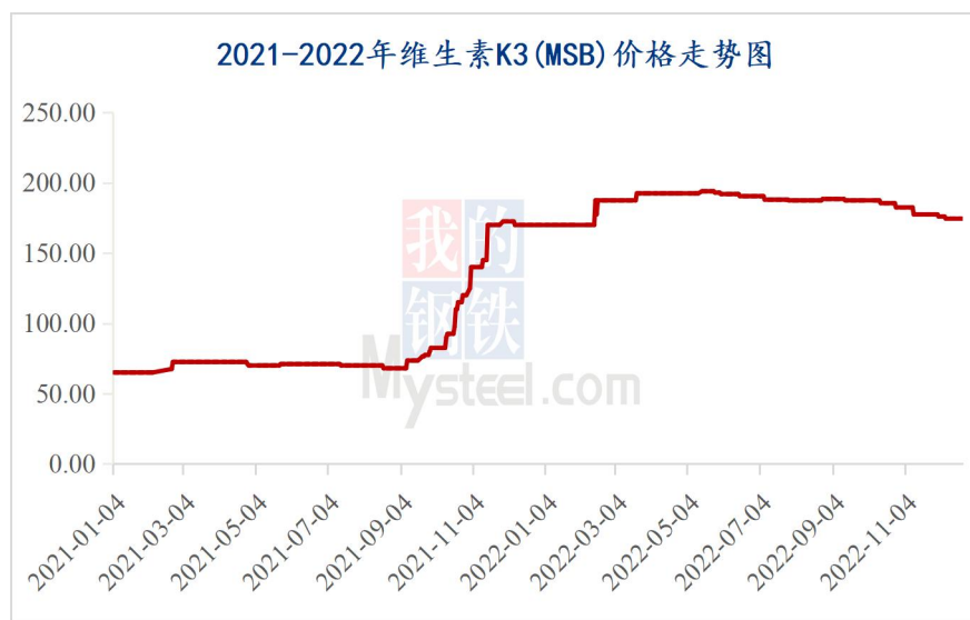
图 10 2021-2022 年维生素 K3 价格走势

本周国内维生素 K3（MSB）市场主流价格在 160-165 元/kg，MNB 市场价格在 180-190 元/kg。市场需求一般，询单略平淡，K3 价格平稳偏弱。受原材料成本上涨及供应偏紧影响，维生素 K3 工厂挺价意愿较强。振华股份维生素潼南和黄石基地，依照惯例计划从 12 月下旬开始进行年度设备检修，预计时长 4~6 周。