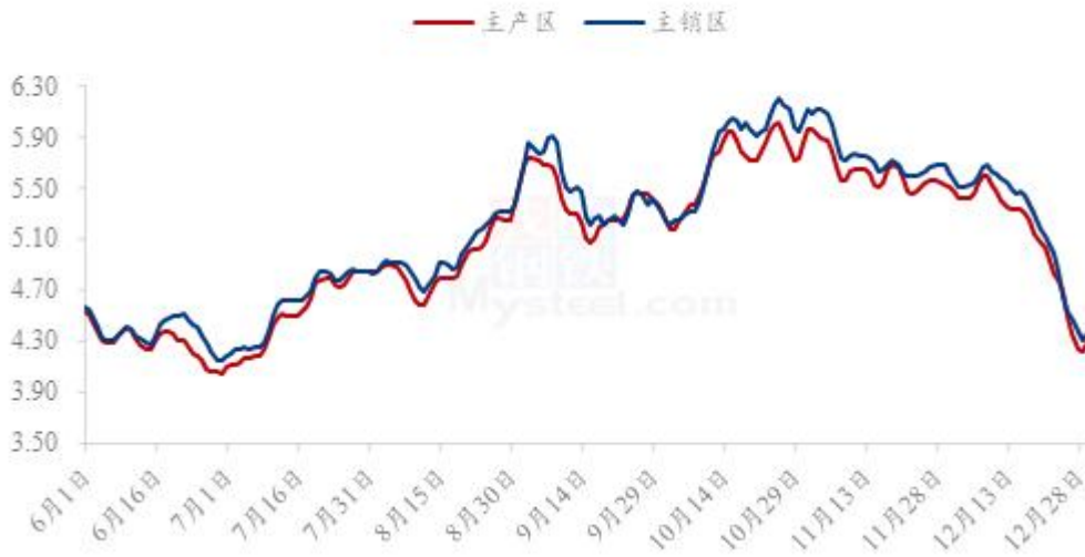
图 20 全国鸡蛋主产区与主销区价格对比图