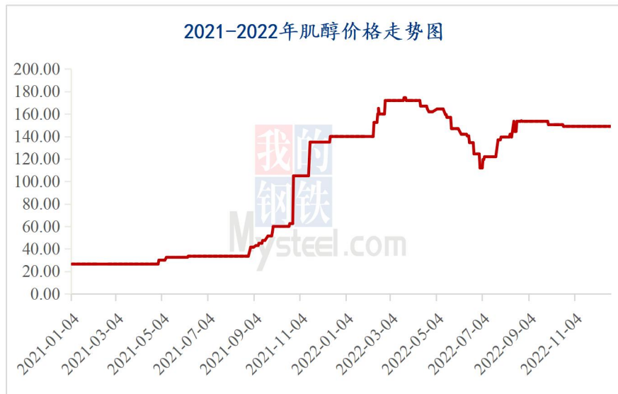
图 14 2021-2022 年肌醇价格走势