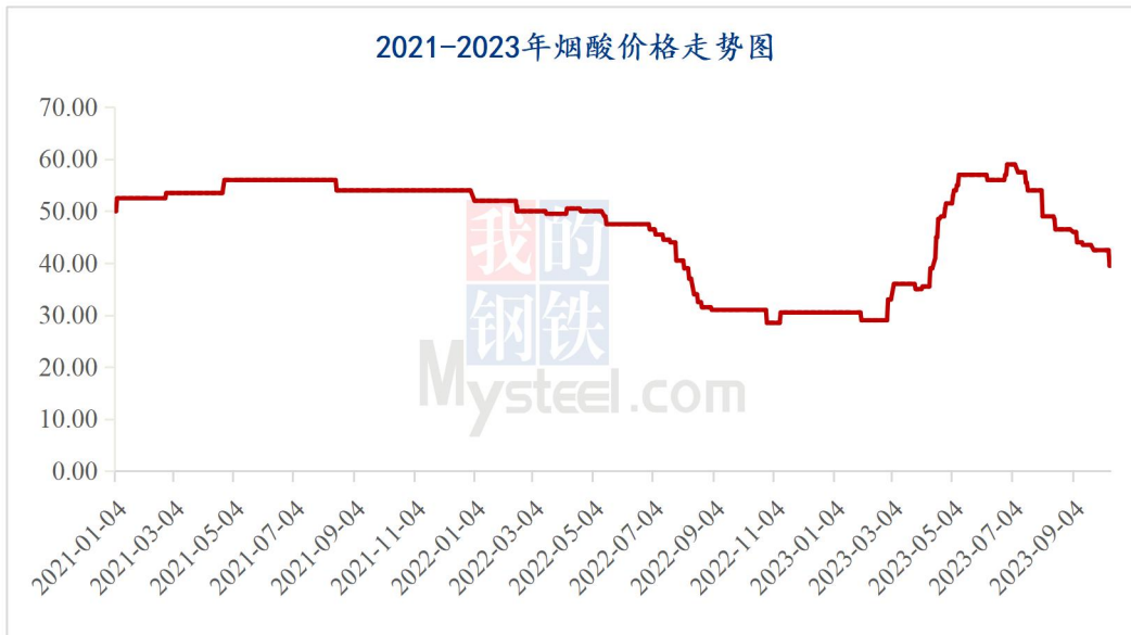
图 15 2021-2023 年烟酸价格走势图

本周国内市场主流报价 38-41 元/kg，市场成交较为平稳，市场询单一般，交投价格平稳偏弱，部分价格略低。