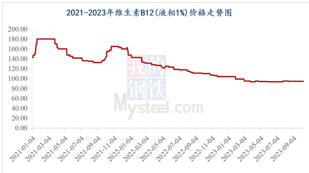
图 9 2021-2023 年维生素 B12 价格走势图

本周国内市场主流报价 93-96 元/kg，整体价格基本平稳，市场需求一般，价格较上周平稳运行。