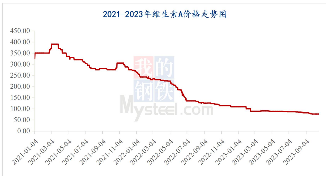
图 1 2023 年维生素 A 价格走势图

据 Mysteel 对全国维生素市场价格调查，本周维生素 AVA500 市场价格 75-77 元/kg，采购需求持续偏弱，市场报价基本维持平稳，根据品牌、日期不同，局部价格略低。5月23日，浙江医药维生素 A 报价 90 元/kg。