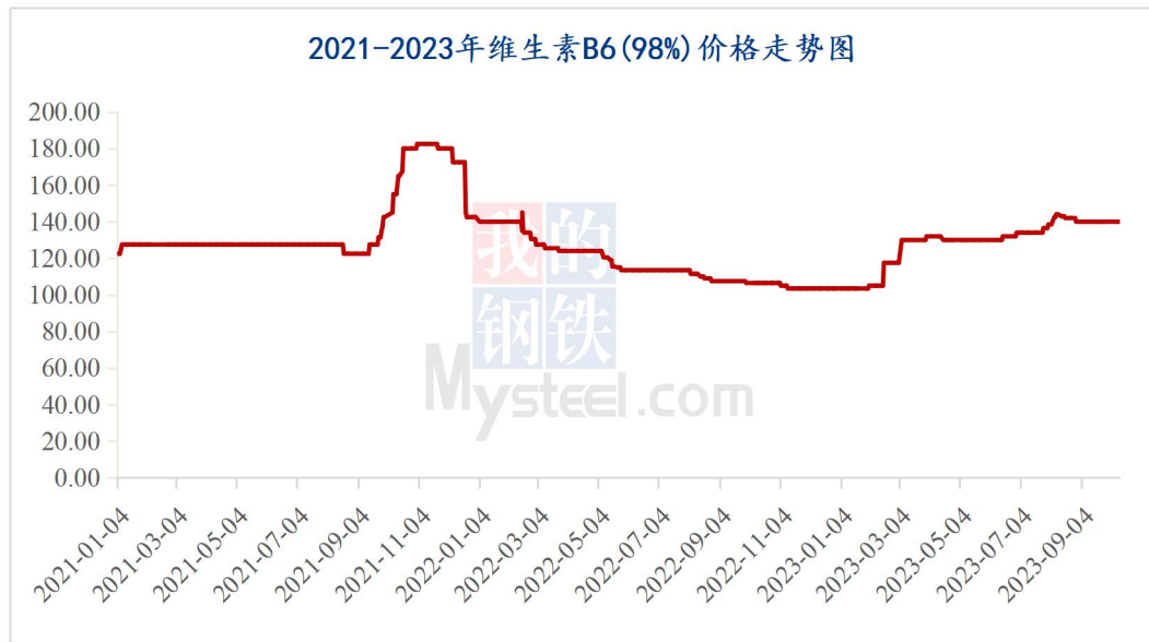
图 8 2021-2023 年维生素 B6 价格走势图