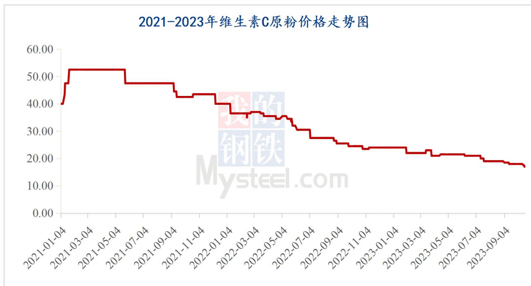
图 3 2021-2023 年维生素 C 价格走势图

本周 VC 原粉国内市场报价 16-18 元/kg，价格平稳，下游需求一般，终端适量补货，部分品牌略低一些。