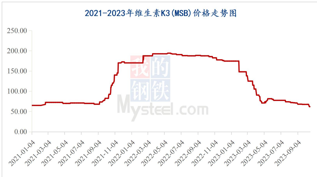
图 10 2021-2023 年维生素 K3 价格走势图

本周国内维生素 K3（MSB）市场主流价格在 60-64 元/kg，MNB 市场价格在 70-74 元/kg。下游需求一般，下游需求一般，上游工厂发货正常，市场价格基本维持平稳，实单议价成交为主。