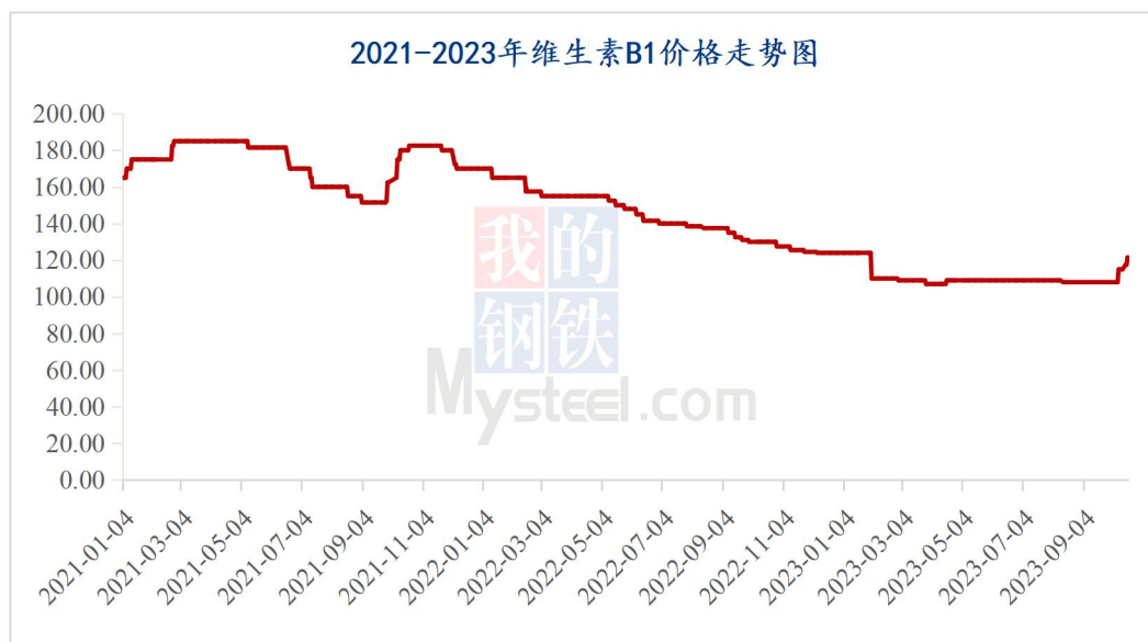
图 6 2021-2023 年维生素 B1 价格走势图

本周国内维生素 B1（80%）市场报价在 118-125 元/kg，下游需求较弱，上游工厂暂停报价，市场观望为主，市场询单和寻货较活跃，价格平稳运行，天新药业计划于 7 月 1 日开始，进行为期 8-10 周的夏季停产检修。4 月 21 日，受维生素 B1 主要原材料价格上涨影响，兄弟科技硝酸 B1 报价 120 元/kg，盐酸 B1 报价 150 元/kg。