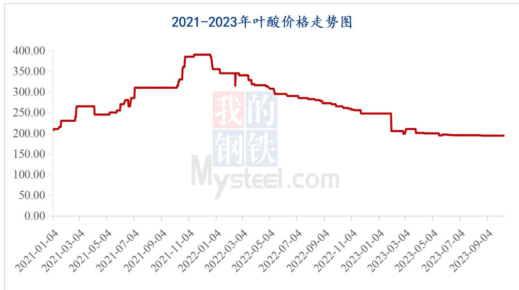
图 11 2021-2023 年叶酸价格走势走势图