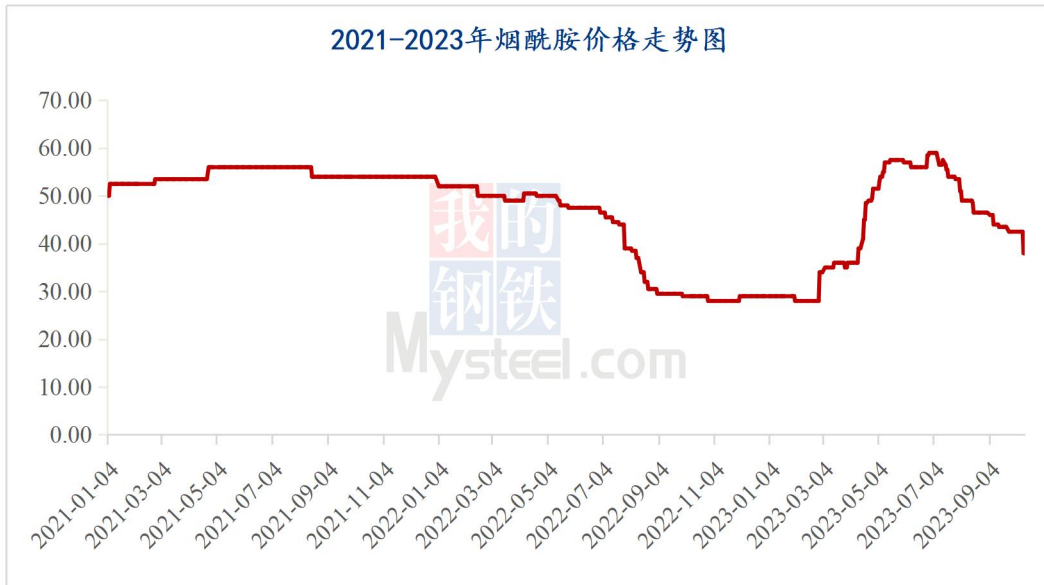
图 13 2021-2023 年烟酰胺价格走势图

本周国内市场主流报价 36-40 元/kg，价格较为平稳，市场询单一般，交投价格平稳偏弱，部分价格略低。