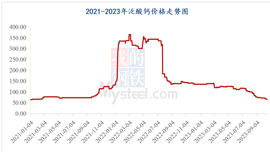
图 5 2021-2023 年泛酸钙价格走势图