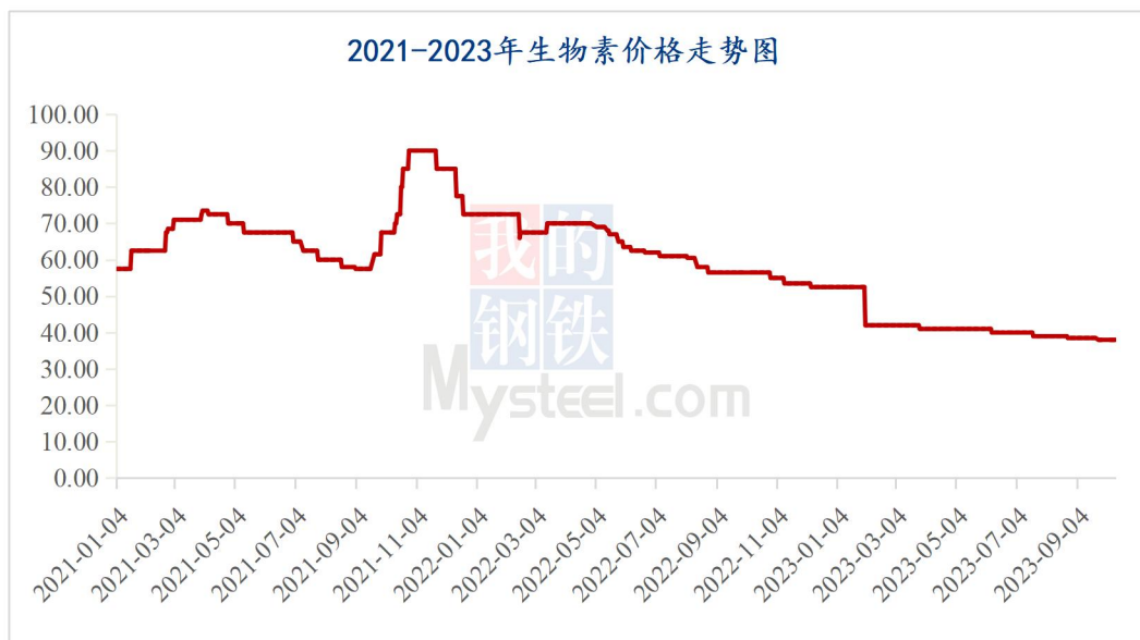
图 12 2021-2023 年生物素价格走势走势图

本周国内 2%生物素市场价格在 36-38 元/kg，市场询单一般，交投价格平稳偏弱，部分价格略低，欧洲 2%生物素报价 3.90-4.10 欧元/kg。