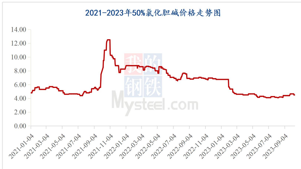
图 16 2021-2023 年氯化胆碱价格走势图