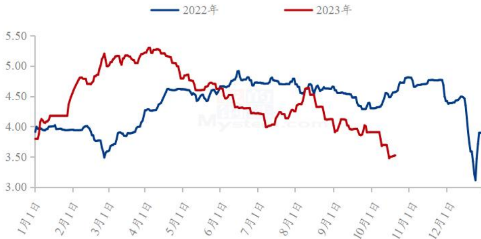
图 19 全国白羽肉鸡均价走势图