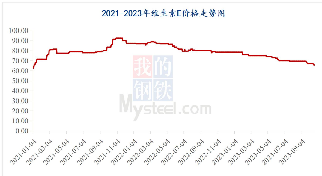
图 2 2021-2023 年维生素 E 价格走势图