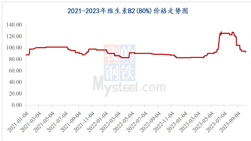
图 7 2021-2023 年维生素 B2（80%）价格走势图

本周国内 VB2(80%)市场价格 90-95 元/kg，VB2(98%)市场价格 335-370 元/kg。市场询单活跃，上游工厂挺价意愿强烈，贸易渠道报价相对坚挺，观望情绪较浓，成交一般，根据品牌、日期不同，局部价格略低。7月4日，广济药业饲料级 80%维生素 B2 价格上调至 160 元/KG。7月5日，海嘉诺饲料级 80%维生素 B2 价格上调至 162 元/kg。7月7日，山东丰银饲料级 80%维生素 B2 价格上调至 165 元/kg。6月13日，海嘉诺上调 80%维生素 B2 报价为 153 元/kg。6月13日，山东恩贝丰银调整报价 155 元/kg。6月6日，梅花生物上调 80%维生素 B2 报价为 150 元/kg。