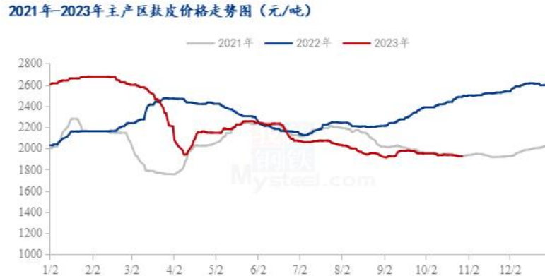
图 7 2021-2023 年全国麸皮均价走势图

截至 10 月 19 日，本周主产区混合麸皮均价 1931 元/吨，环比下跌 0.52%，同比下跌 21.31%。本周麸皮价格先落后涨，市场观望氛围浓厚。周初麸皮走货滞缓，部分企业为了防止库存积压小幅降价促销。近日龙头企业麸皮价格小幅上调，中小企业小幅跟涨后价格维持平稳。天气转凉后麸皮利于存储，但需求暂无明显改善，预计下周麸皮价格维持平稳，关注企业开机动态。