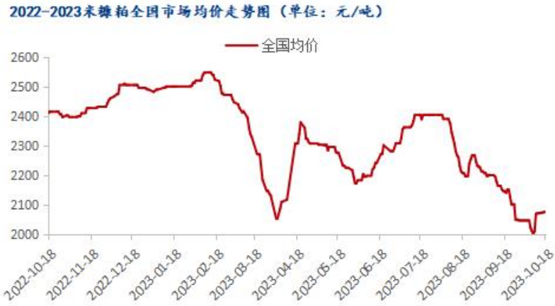
图 1 2022-2023 年全国米糠粕均价走势图