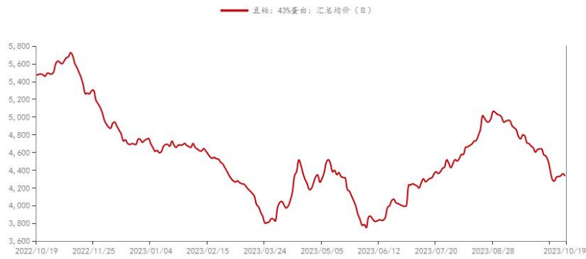
图8 国内沿海区域豆粕主流出厂价走势图

示，截至2023年10月12日当周，美国大豆出口检验量为201.1万吨，此前市场预估为65-130万吨。巴西中部阵雨仍在继续。周三和周四，南方地区将再次迎来强降雨天气。暴雨和洪水引起人们对冬小麦质量和收割以及玉米和大豆种植的担忧，但种植速度接近正常水平。国内方面，豆粕期现货经历一轮大幅下跌后，最近几天有所反弹，关注是否仍有空间。连粕主力合约M2401关注3900点得失。