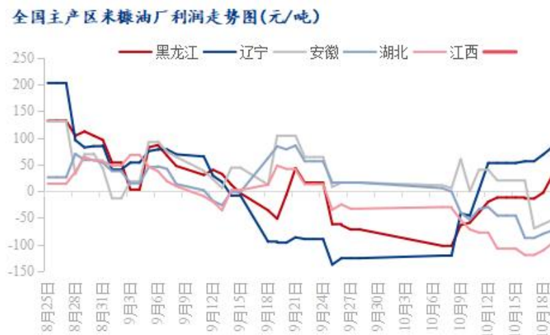
图 3 全国主产区米糠油厂利润走势图

本周各主产区油厂利润较情况如下：黑龙江米糠油厂主副产品对冲后利润为 29 元/吨，较上周提高 49 元/吨；辽宁米糠油厂主副产品对冲后利润为 83 元/吨，较上周减少 30 元/吨；安徽米糠油厂主副产品对冲后利润-54 元/吨，较上周减少 94 元/吨；湖北米糠油厂主副产品对冲后利润-74 元/吨，较上周减少 44 元/吨；江西米糠油厂主副产品对冲后利润-98 元/吨，较上周减少 22 元/吨。（备注：以上利润是理论估算值，各厂因规模大小不同将有所差异）