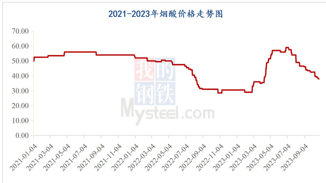
图 15 2021-2023 年烟酸价格走势