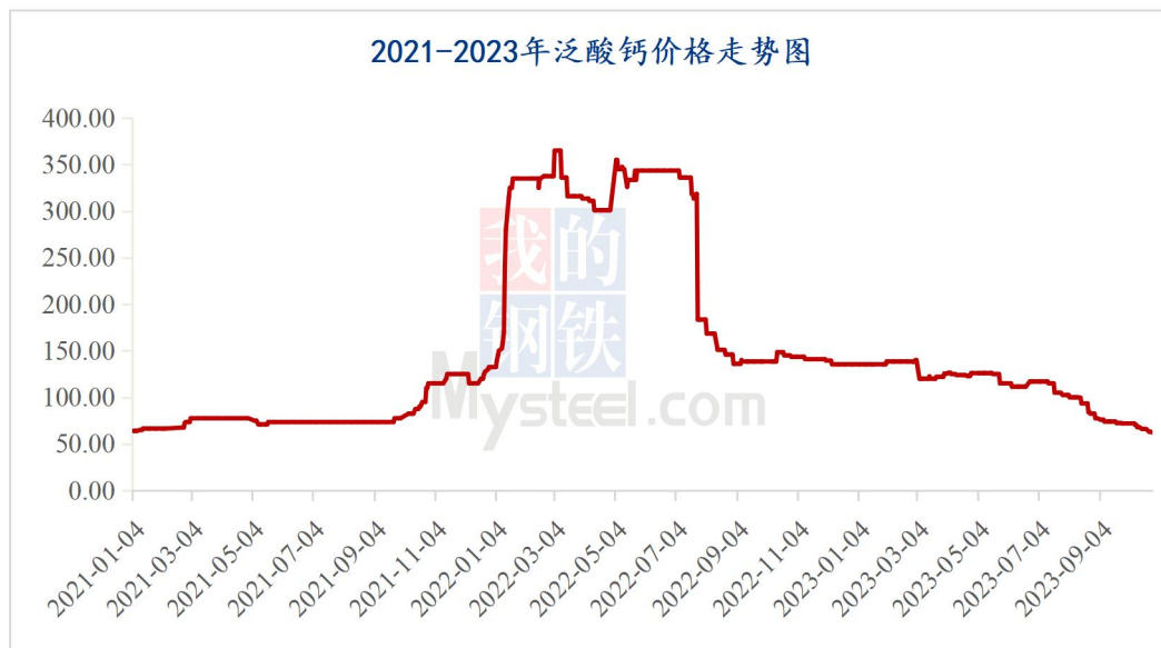
图 5 2021-2023 年泛酸钙价格走势图

本周国内泛酸钙市场主流价格在 60-65 元/kg，上游工厂挺价意愿强烈，下游需求一般，市场价格偏弱运行，实单议价。