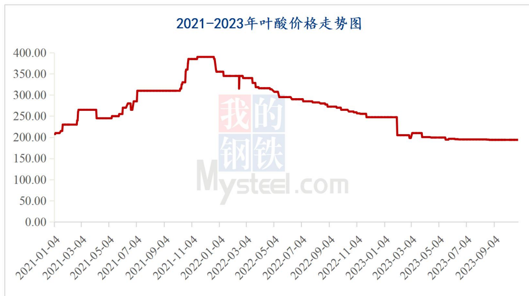
图 11 2021-2023 年叶酸价格走势

本周国内市场主流报价 192-196 元/kg，叶酸目前总体需求不旺，市场成交一般，价格平稳。6 月 15 日，天新药业饲料级叶酸停报停签。