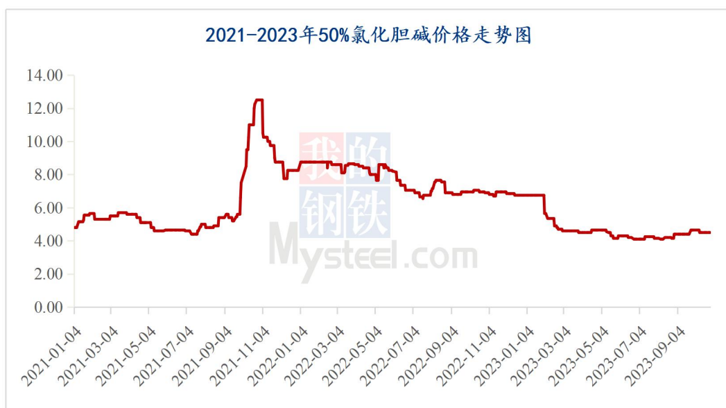
图 16 2021-2023 年氯化胆碱价格走势

本周国内氯化胆碱市场价格 4.4-4.6 元/kg。胆碱，受原料三甲胺价格小幅波动，胆碱工厂报价动态调整，后续主要关注其原料端三甲胺及环氧乙烷变化情况。7 月 12 日，受上游原料价格上涨影响，山东丰银饲料级 50%氯化胆碱价格上调至 4.1 元/kg，60%氯化胆碱价格上调至 4.6 元/kg。7 月 13 日，受原料价格上涨影响，辽宁中信生物上调 50%氯化胆碱报价为 4.4 元/kg。