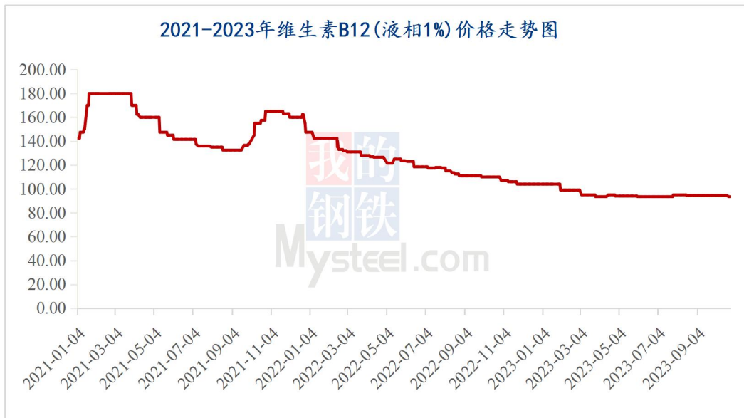
图 9 2021-2023 年维生素 B12 价格走势图

本周国内市场主流报价 92-95 元/kg，整体价格基本平稳，市场需求一般，价格较上周平稳运行。