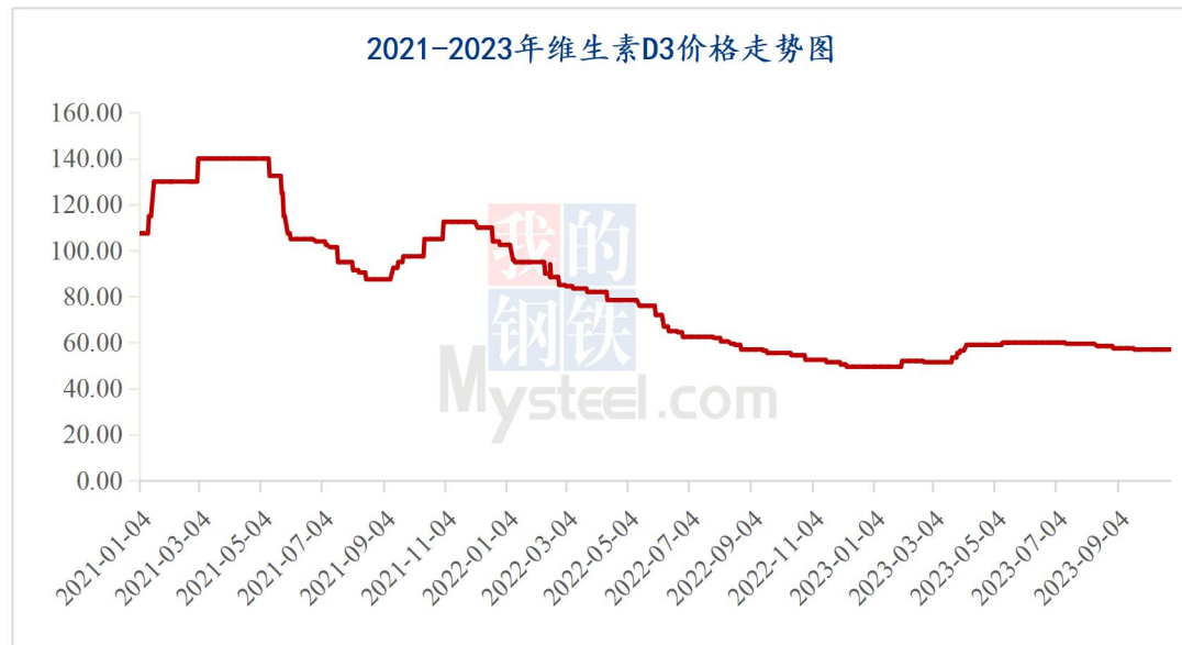
图 4 2021-2023 年维生素 D3 价格走势图

本周国内维生素 D3 国内市场主流价格为 55-59 元/kg，市场需求一般，上游挺价意愿较强，经销渠道出货积极，价格平稳运行。