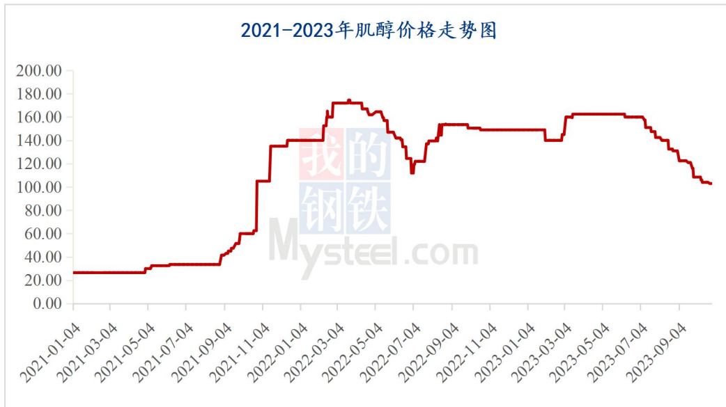
图 14 2021-2023 年肌醇价格走势

本周国内肌醇主流厂家提高报价至 98-108 元/kg，市场需求较弱，后期需关注工厂生产和发货情况。