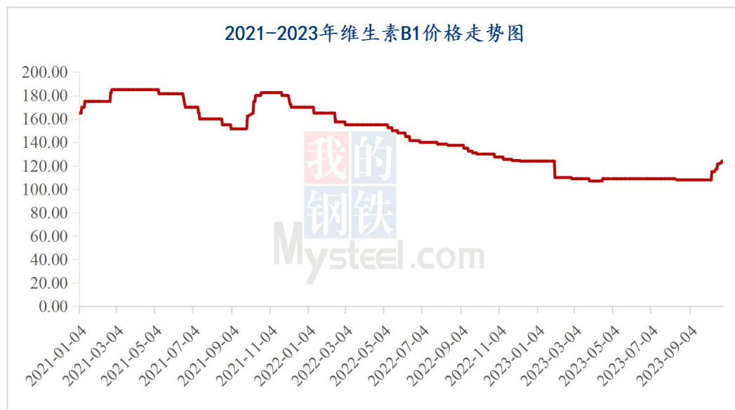
图 6 2021-2023 年维生素 B1 价格走势图

本周国内维生素 B1（80%）市场报价在 122-126 元/kg，下游需求较弱，市场观望为主，市场询单和寻货较活跃，成交价格平稳小幅上行；天新药业计划于 7 月 1 日开始，进行为期 8-10 周的夏季停产检修。4 月 21 日，受维生素 B1 主要原材料价格上涨影响，兄弟科技硝酸 B1 报价 120 元/kg，盐酸 B1 报价 150 元/kg。