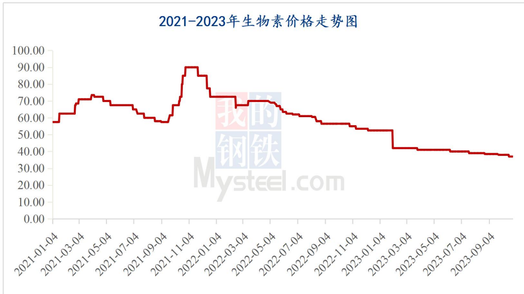
图 12 2021-2023 年生物素价格走势图

本周国内 2%生物素市场价格在 36-38 元/kg，市场询单一般，交投价格平稳偏弱，部分价格略低，欧洲 2%生物素报价 3.90-4.10 欧元/kg。