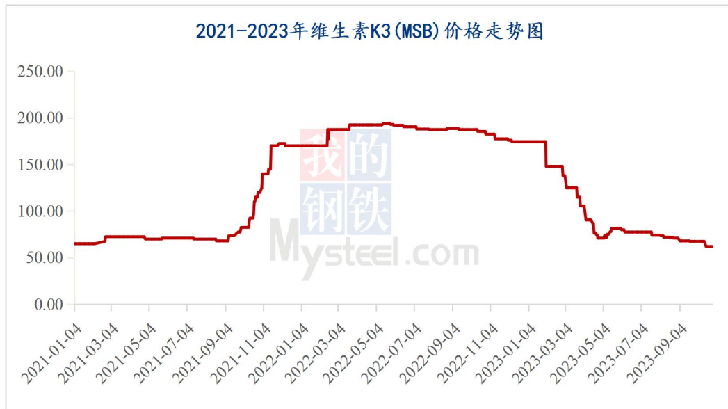
图 10 2021-2023 年维生素 K3 价格走势