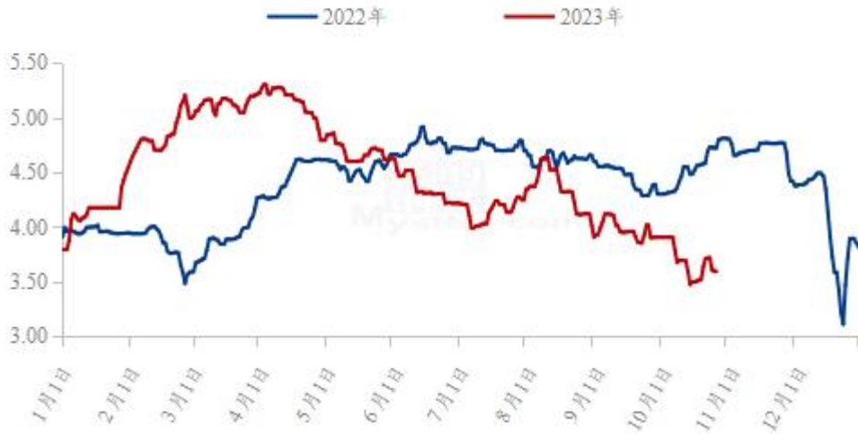
图 19 全国白羽肉鸡均价走势图