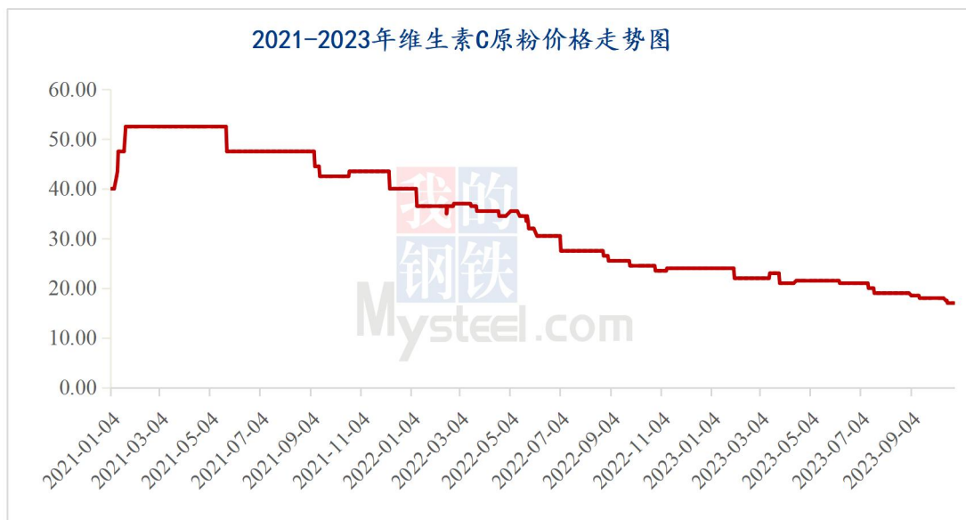
图 3 2021-2023 年维生素 C 价格走势图

本周 VC 原粉国内市场报价 16-18 元/kg，价格平稳，下游需求一般，终端适量补货，部分品牌略低一些。