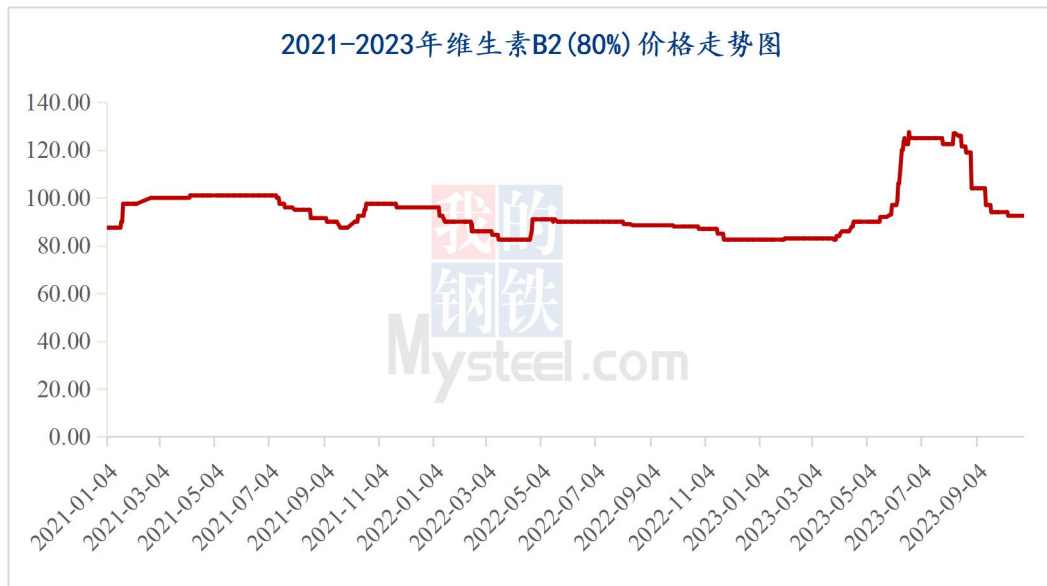
图 7 2021-2023 年维生素 B2（80%）价格走势图