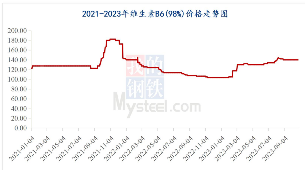
图 8 2021-2023 年维生素 B6 价格走势图

本周国内市场主流报价 138-142 元/kg，价格暂时企稳。市场需求一般，价格较上小幅上调。6月15日，天新药业饲料级 VB6 停报停签。10月11日，天新药业饲料级 VB6 停报停签。