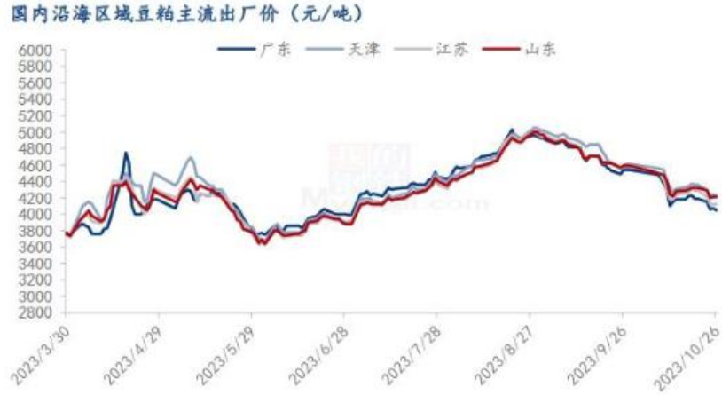
图 8 国内沿海区域豆粕主流出厂价走势图