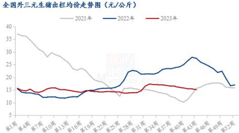
图 4 全国外三元生猪出栏均价走势图

响，市场恐慌情绪偏浓，养户认卖积极性提升，短期供应较充足。需求方面来看，节后需求延续低迷表现，虽宰量较前期增加，但企业出货及冻品出库表现难言转好，贸易成交价格略显混乱，需求好转仍待时日。整体来看，当前市场供强需弱延续，局部地区疫病影响亟待回归平稳，月底出栏压力不减，不过月末月初或有情绪支撑，短期行情或止跌趋稳震荡。