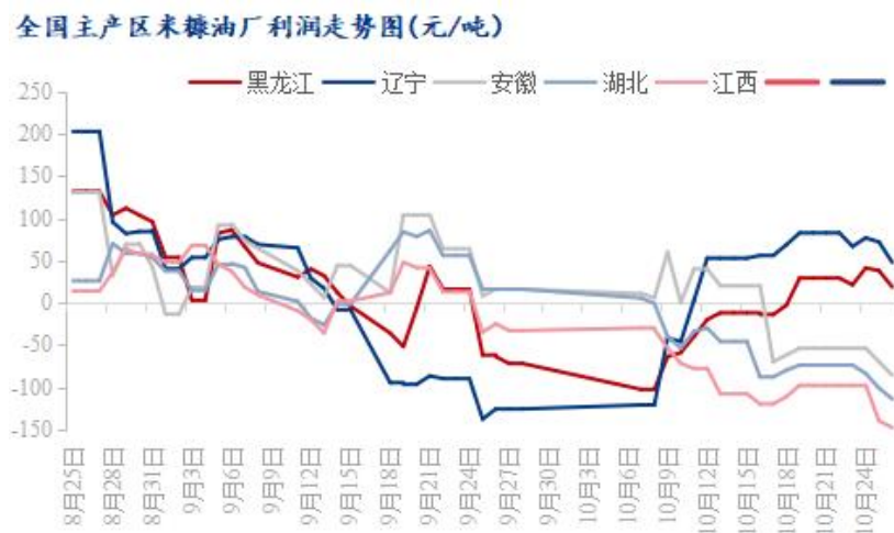
图 3 全国主产区米糠油厂利润走势图

本周各主产区油厂利润较情况如下：黑龙江米糠油厂主副产品对冲后利润为 19 元/吨，较上周减少 10 元/吨；辽宁米糠油厂主副产品对冲后利润为 48 元/吨，较上周减少 35 元/吨；安徽米糠油厂主副产品对冲后利润-86 元/吨，较上周减少 32 元/吨；湖北米糠油厂主副产品对冲后利润-114 元/吨，较上周减少 40 元/吨；江西米糠油厂主副产品对冲后利润-148 元/吨，较上周减少 50 元/吨。（备注：以上利润是理论估算值，各厂因规模大小不同将有所差异）