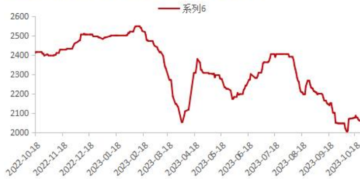
图 1 2022-2023 年全国米糠粕均价走势图