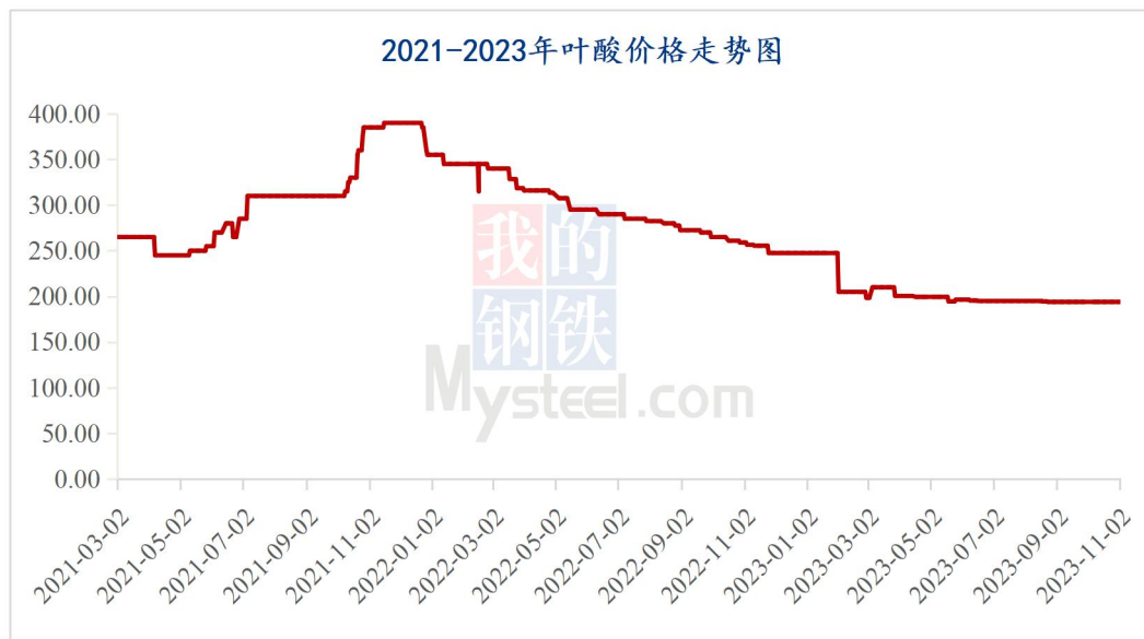
图 11 2021-2023 年叶酸价格走势图

本周国内市场主流报价 192-196 元/kg，叶酸目前总体需求不旺，市场成交一般，价格平稳。6月15日，天新药业饲料级叶酸停报停签。