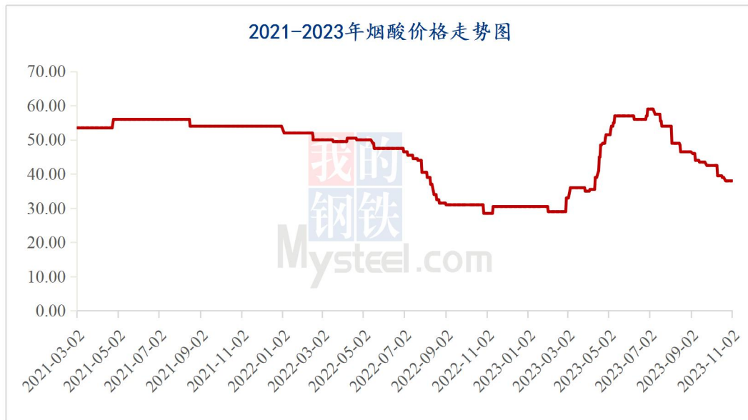
图 15 2021-2023 年烟酸价格走势