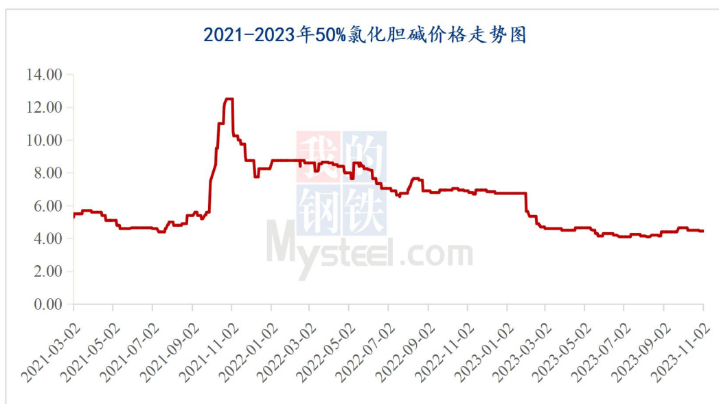
图 16 2021-2023 年氯化胆碱价格走势

本周国内氯化胆碱市场价格 4.4-4.6 元/kg。胆碱，受原料三甲胺价格小幅波动，胆碱工厂报价动态调整，后续主要关注其原料端三甲胺及环氧乙烷变化情况。7 月 12 日，受上游原料价格上涨影响，山东丰银饲料级 50%氯化胆碱价格上调至 4.1 元/kg，60%氯化胆碱价格上调至 4.6 元/kg。7 月 13 日，受原料价格上涨影响，辽宁中信生物上调 50%氯化胆碱报价为 4.4 元/kg。