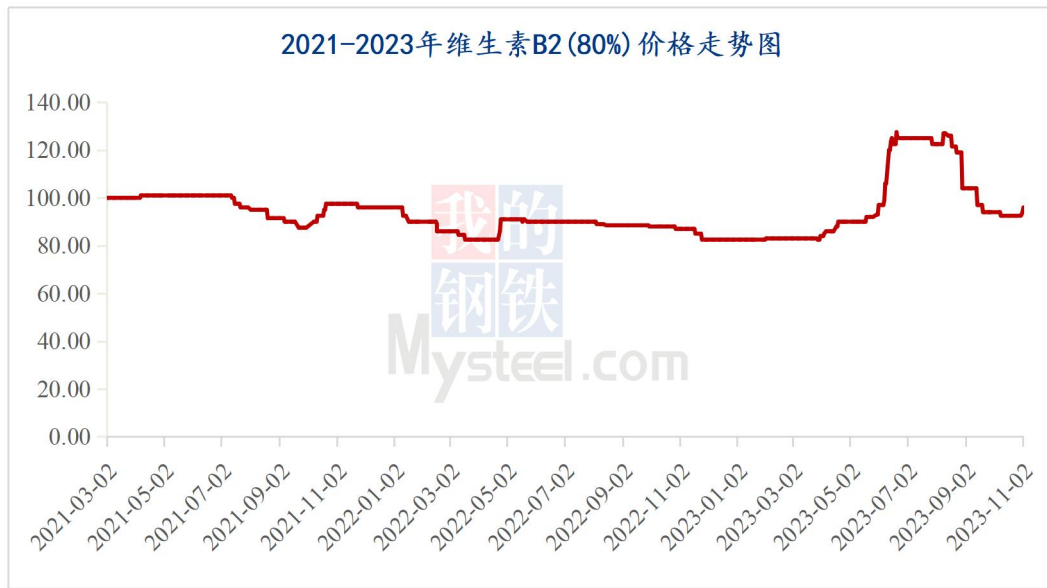
图 7 2021-2023 年维生素 B2（80%）价格走势