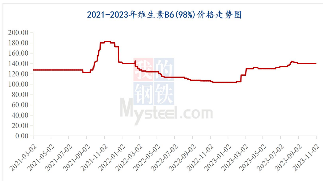
图 8 2021-2023 年维生素 B6 价格走势

本周国内市场主流报价 138-142 元/kg，价格暂时企稳。市场需求一般，价格较上小幅上调。6 月 15 日，天新药业饲料级 VB6 停报停签。10 月 11 日，天新药业饲料级 VB6 停报停签。