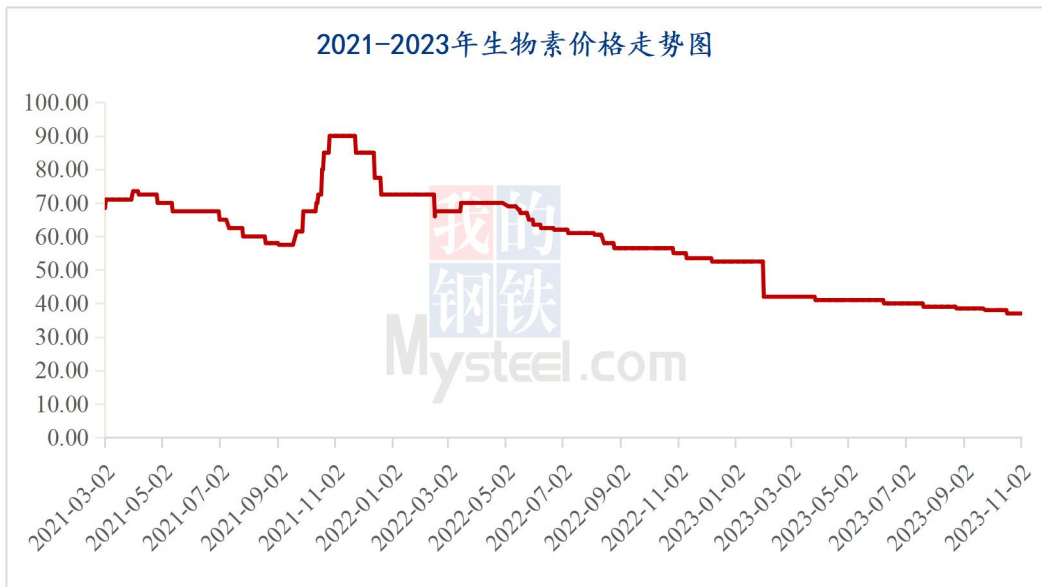
图 12 2021-2023 年生物素价格走势图

本周国内 2%生物素市场价格在 36-38 元/kg，市场询单一般，交投价格平稳偏弱，部分价格略低，欧洲 2%生物素报价 3.90-4.10 欧元/kg。