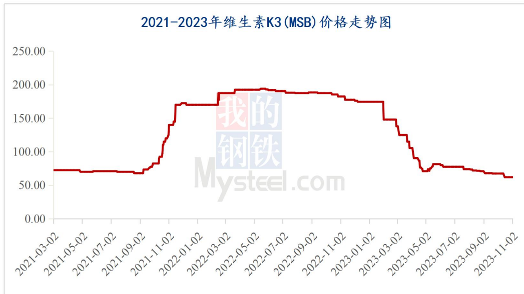
图 10 2021-2023 年维生素 K3 价格走势图