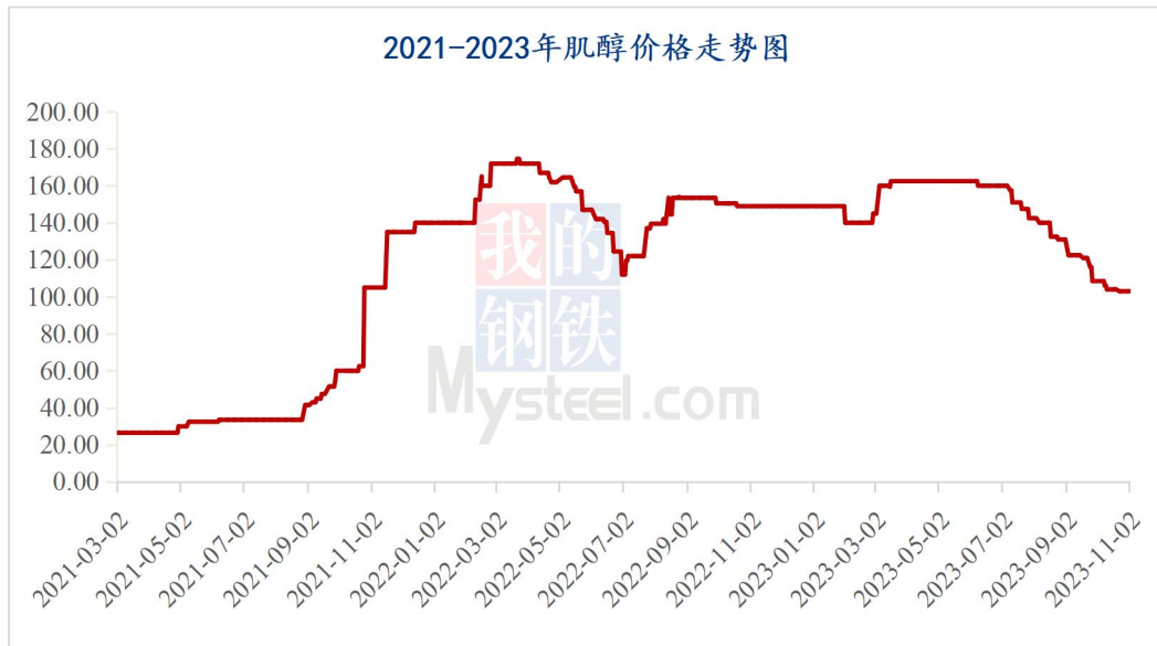
图 14 2021-2023 年肌醇价格走势

本周国内肌醇主流厂家提高报价至 98-108 元/kg，市场需求较弱，后期需关注工厂生产和发货情况。