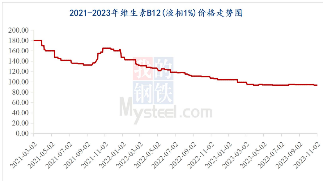
图 9 2021-2023 年维生素 B12 价格走势

本周国内市场主流报价 92-95 元/kg，整体价格基本平稳，市场需求一般，价格较上周平稳运行。