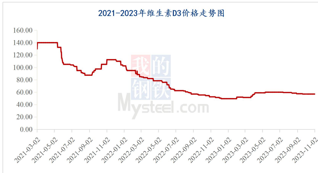
图 4 2021-2023 年维生素 D3 价格走势图

本周国内维生素 D3 国内市场主流价格为 55-59 元/kg，市场需求一般，上游挺价意愿较强，经销渠道出货积极，价格平稳运行。