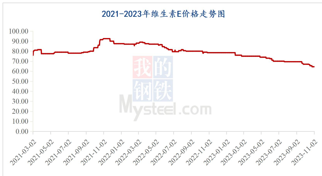
图 2 2021-2023 年维生素 E 价格走势图

计划六月中旬开始进行为期 10 周的停产检修。7 月 21 日，新和成维生素 E 出口美元报价上调 20%。