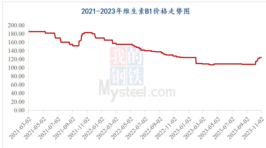
图 6 2021-2023 年维生素 B1 价格走势

本周国内维生素 B1（80%）市场报价在 122-126 元/kg，下游需求较弱，市场观望为主，市场询单和寻货较活跃，成交价格平稳小幅上行；天新药业计划于 7 月 1 日开始，进行为期 8-10 周的夏季停产检修。4 月 21 日，受维生素 B1 主要原材料价格上涨影响，兄弟科技硝酸 B1 报价 120 元/kg，盐酸 B1 报价 150 元/kg。