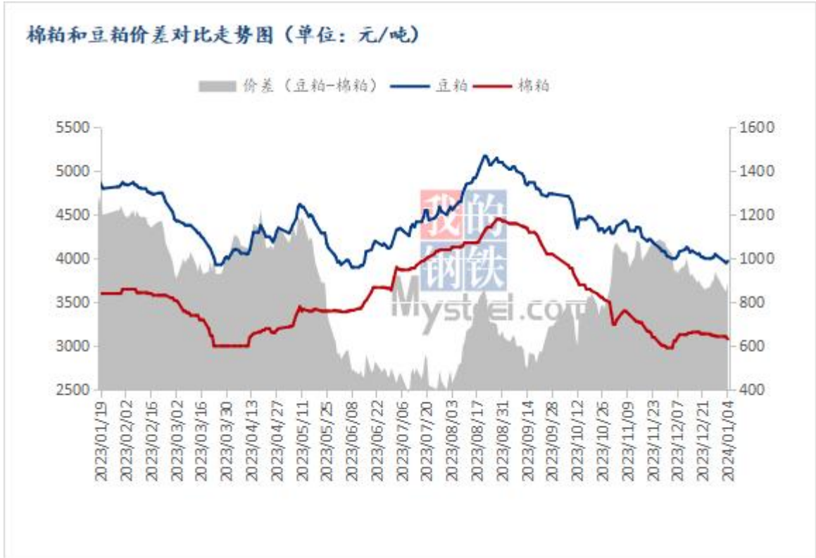
图 1 棉粕和豆粕价差对比走势图