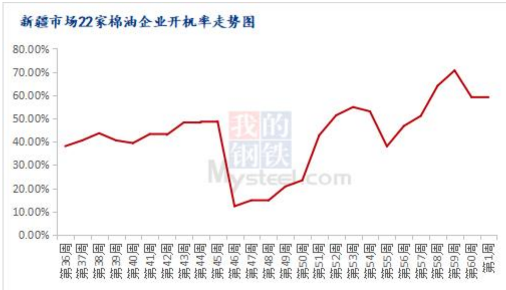
图 2 新疆棉油企业开机率走势图