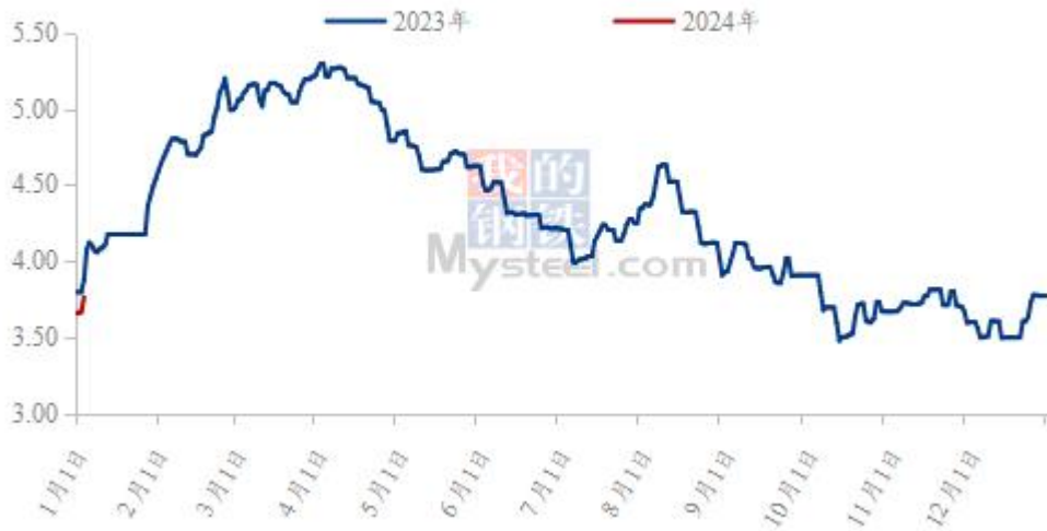
图3 全国白羽肉鸡均价走势图