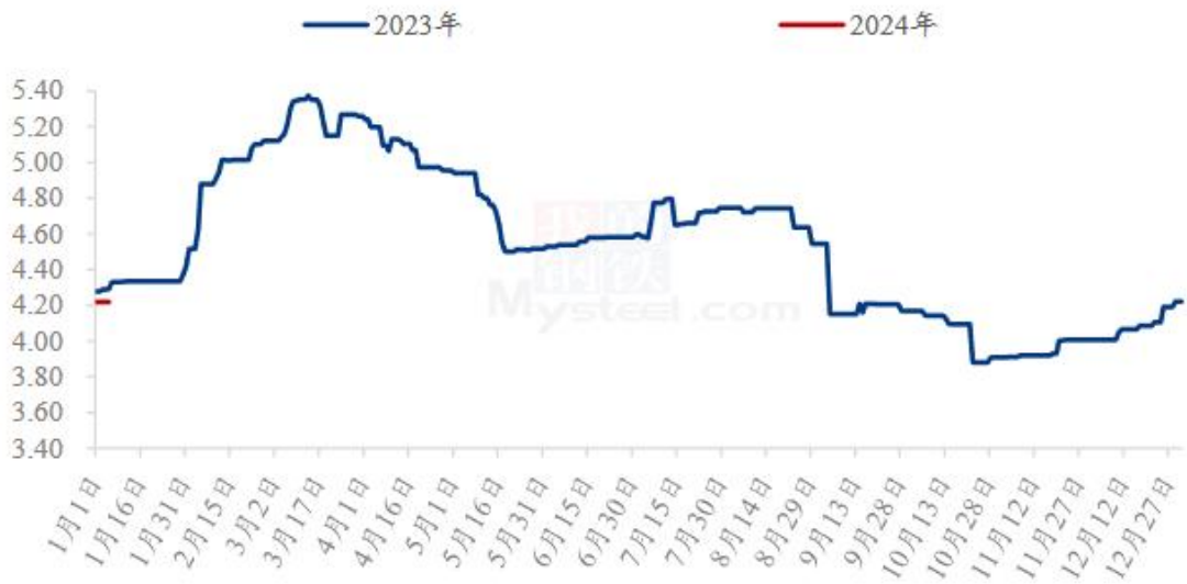
图 4 全国肉鸭均价走势图