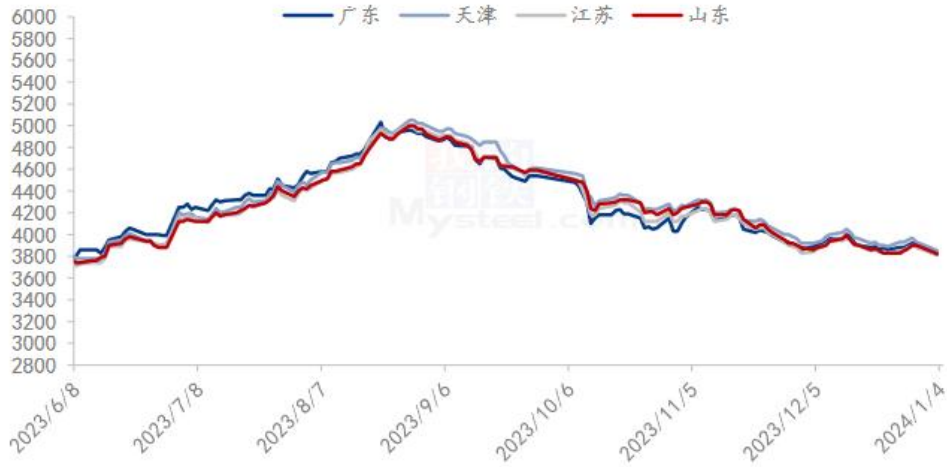
图 5 国内沿海区域豆粕主流出厂价