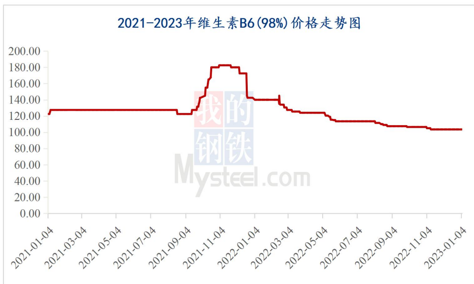
图 8 2021-2023 年维生素 B6 价格走势图

本周价格仍缓慢下跌，近日有企稳迹象。今年以来，B6 竞争格局变化，进入洗牌期，部分厂家接单积极，以价换量。虽然当前进入传统采购旺季，客户对后市预期一般，以即买即用为主。出口报价 USD14/KG 左右。国内市场主流报价 108 元/kg，市场需求一般，价格较上周平稳运行。