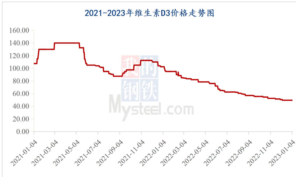
图 4 2021-2023 年维生素 D3 价格走势