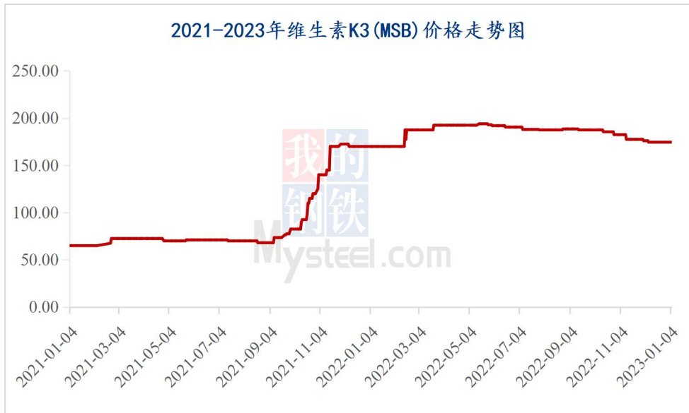
图 10 2021-2023 年维生素 K3 价格走势图