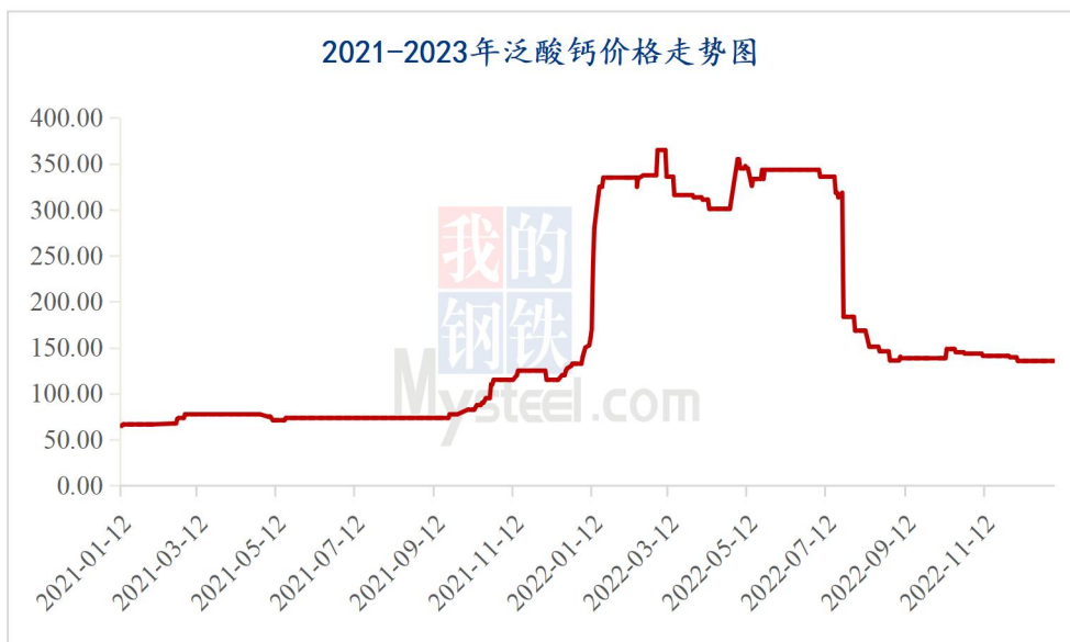
图 5 2021-2023 年泛酸钙价格走势

本周国内泛酸钙市场主流价格在 150-160 元/kg，市场需求一般，整体价格基本平稳，略有小幅波动。据了解,本周国内有厂家泛酸钙报价上调至 RMB180/KG。近期工厂一直供货紧张，限量签单。欧洲市场主流报价 22.2-23.5 欧元/kg，价格平稳。后续关注工厂发货情况。