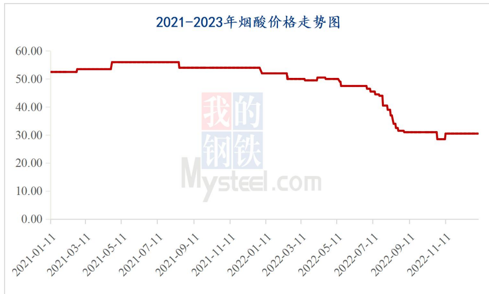
图 15 2021-2023 年烟酸价格走势图

本周国内市场主流报价 28-32 元/kg，本周询单较上周价格小幅上调，整体弱势调整。由于工厂前期低价位持续接单，外加疫情等不可控因素对生产和物流造成的影响，主流工厂均超负荷运行，部分工厂交期排到中国年后。虽市场报价略微提高，但成交价格仍有可议空间。市场报价国内 CNY 27-28 左右，出口 USD 3.6-3.8 左右；预计交货会持续紧张，但价格是否上一个台阶，还有待观望。