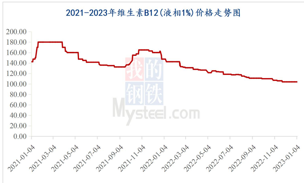
图 9 2021-2023 年维生素 B12 价格走势