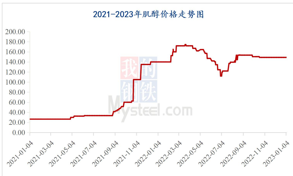
图 14 2021-2023 年肌醇价格走势

本周国内市场主流报价 150-160 元/kg，肌醇近期货源基本消耗完，主流工厂价格有所上调。目前，根据不同品牌，主流厂家报价在 165-180 元/kg，中国出口 FOB 价格在 19-21 美元左右。整体价格基本平稳。