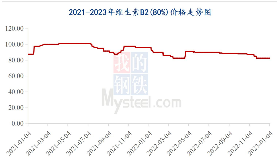
图 7 2021-2023 年维生素 B2 (80%) 价格走势图