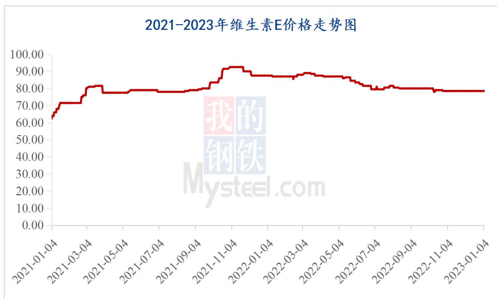
图 2 2021-2023 年维生素 E 价格走势图

本周国内维生素 E 市场报价 78-81 元/kg，下游需求一般，终端适量补货，市场价格平稳偏弱，根据品牌、日期不同，局部有低价货源。欧洲市场贸易商报价 8.80-9.30 欧元/kg。