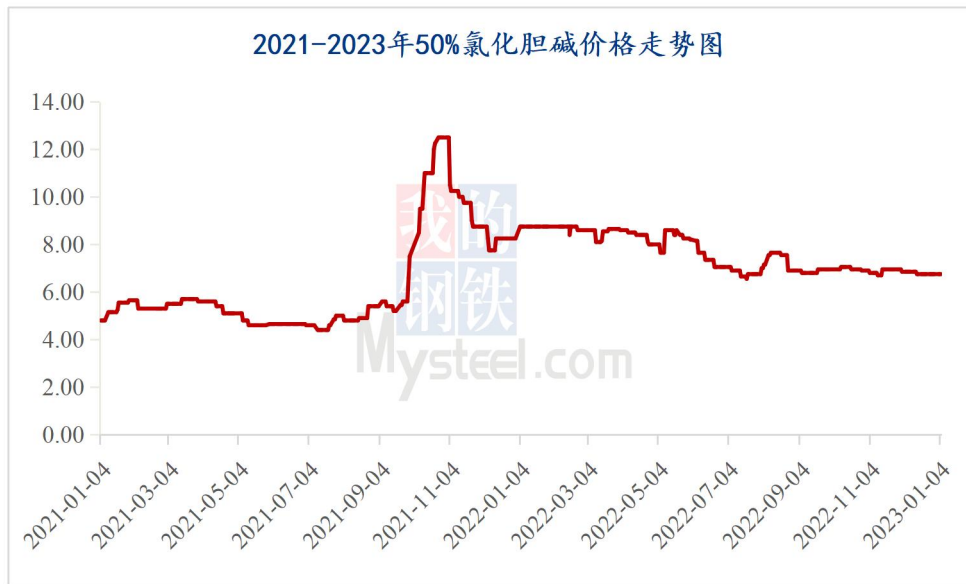
图 16 2021-2023 年氯化胆碱价格走势