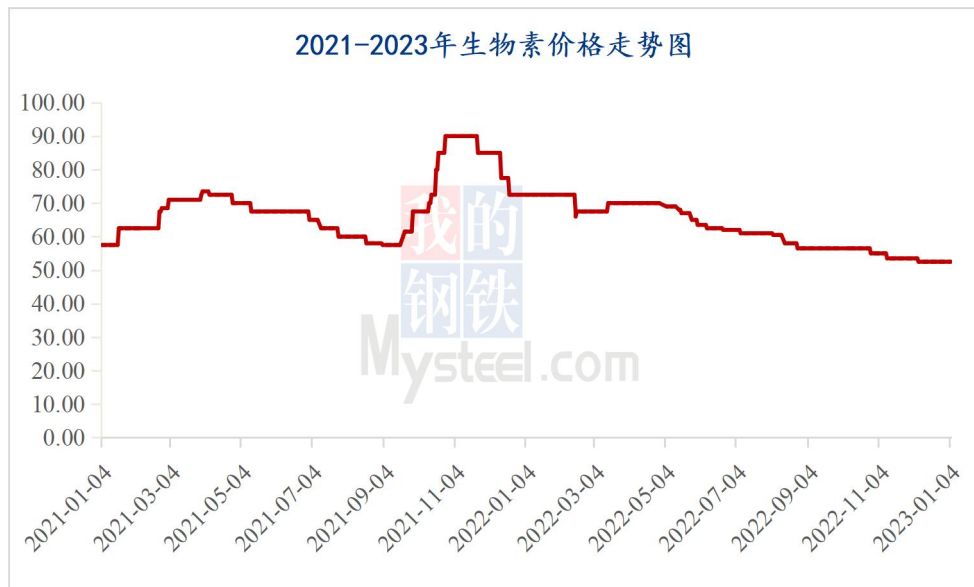
图 12 2021-2023 年生物素价格走势图

本周国内 2%生物素市场价格在 43-46 元/kg，市场询单一般，交投价格平稳偏弱，部分价格略低。欧洲 2%生物素报价 5.45-5.70 欧元/kg。