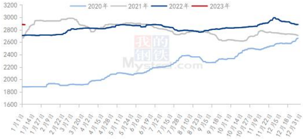
图 17 2020-2023 年全国玉米均价走势图