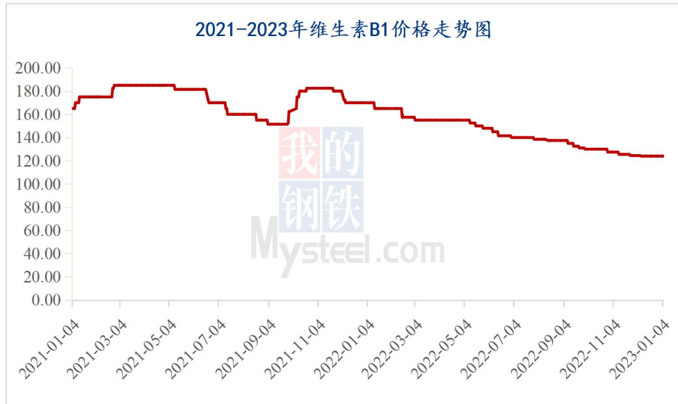
图 6 2021-2023 年维生素 B1 价格走势图

本周国内维生素 B1 市场报价在 118-124 元/kg，受成本上涨影响，B1 工厂挺价意愿较强，下游需求偏弱，询单一般，市场价格维持弱稳。