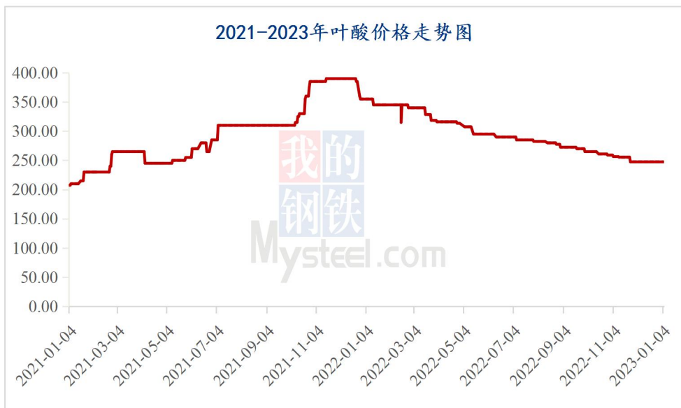
图 11 2021-2023 年叶酸价格走势图