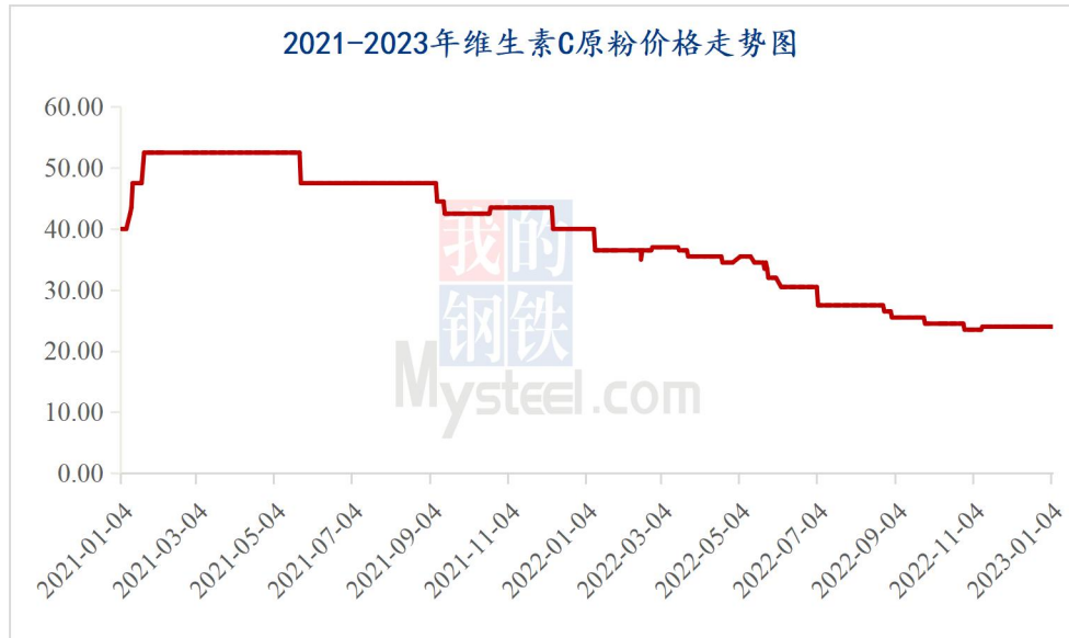
图 3 2021-2023 年维生素 C 价格走势

本周 VC 原粉国内市场报价 22-23 元/kg，下游需求一般，终端适量补货，出口 FOB 报价在 2.6-2.8 美元，部分品牌略低一些。