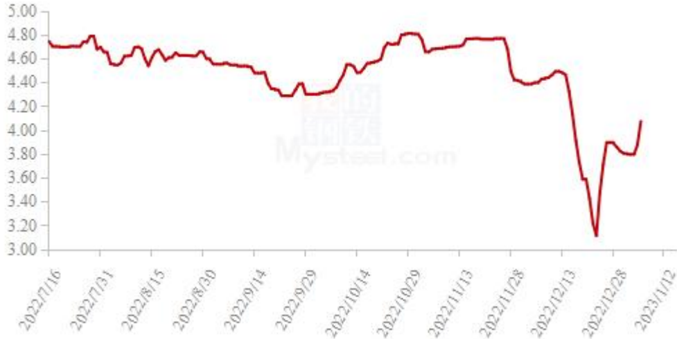
图 19 全国白羽肉鸡均价走势图