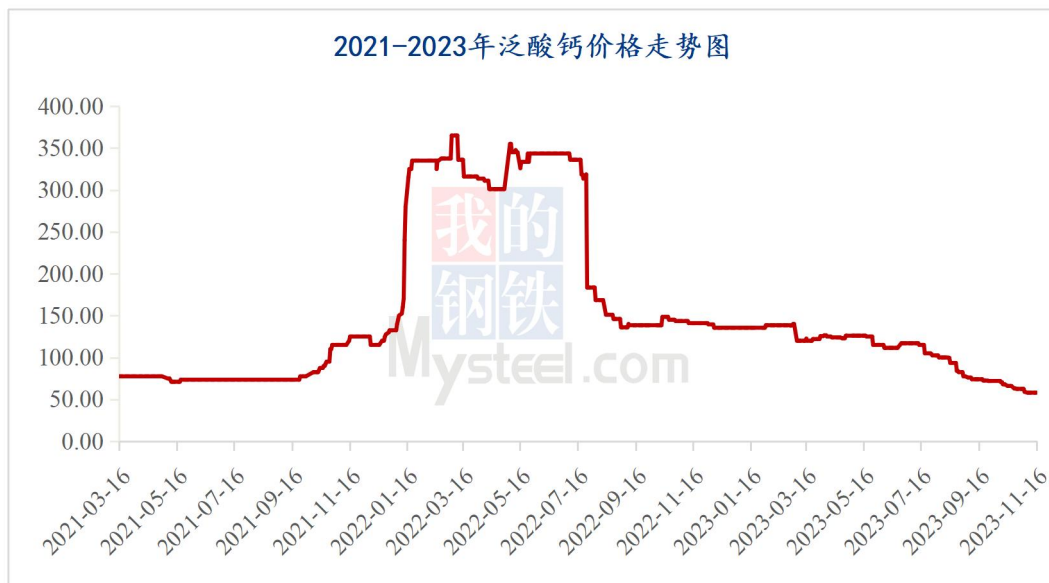
图 5 2021-2023 年泛酸钙价格走势图

本周国内泛酸钙市场主流价格在 58-62 元/kg，上游工厂报价暂稳，下游需求一般，市场价格偏稳运行，实单议价。