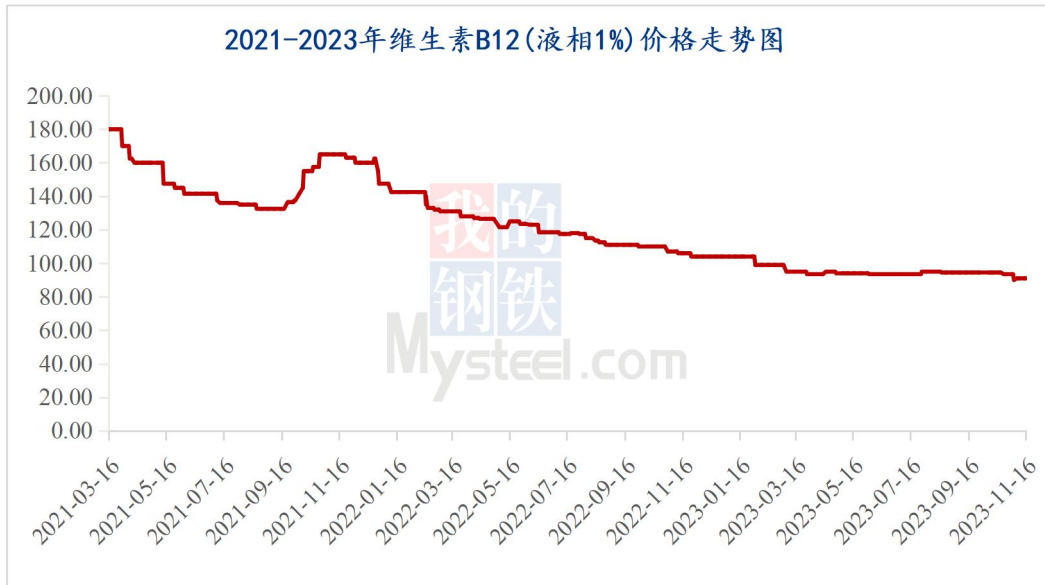
图 9 2021-2023 年维生素 B12 价格走势图

本周国内市场主流报价 92-96 元/kg，整体价格基本平稳，市场需求一般，价格较上周小幅下调。