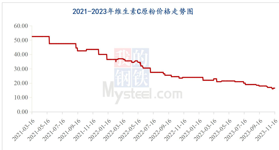
图 3 2021-2023 年维生素 C 价格走势图

本周 VC 原粉国内市场报价 16.5-18.5 元/kg，价格平稳，下游需求一般，终端适量补货，部分品牌略低一些。