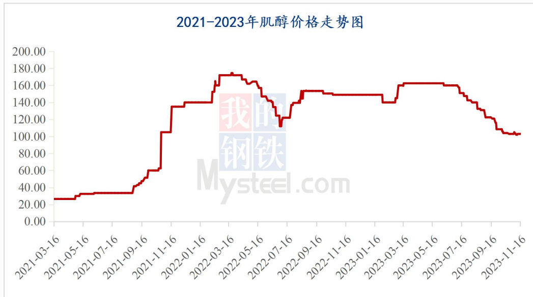
图 14 2021-2023 年肌醇价格走势

本周国内肌醇主流厂家提高报价至 95-108 元/kg，市场需求较弱，后期需关注工厂生产和发货情况。