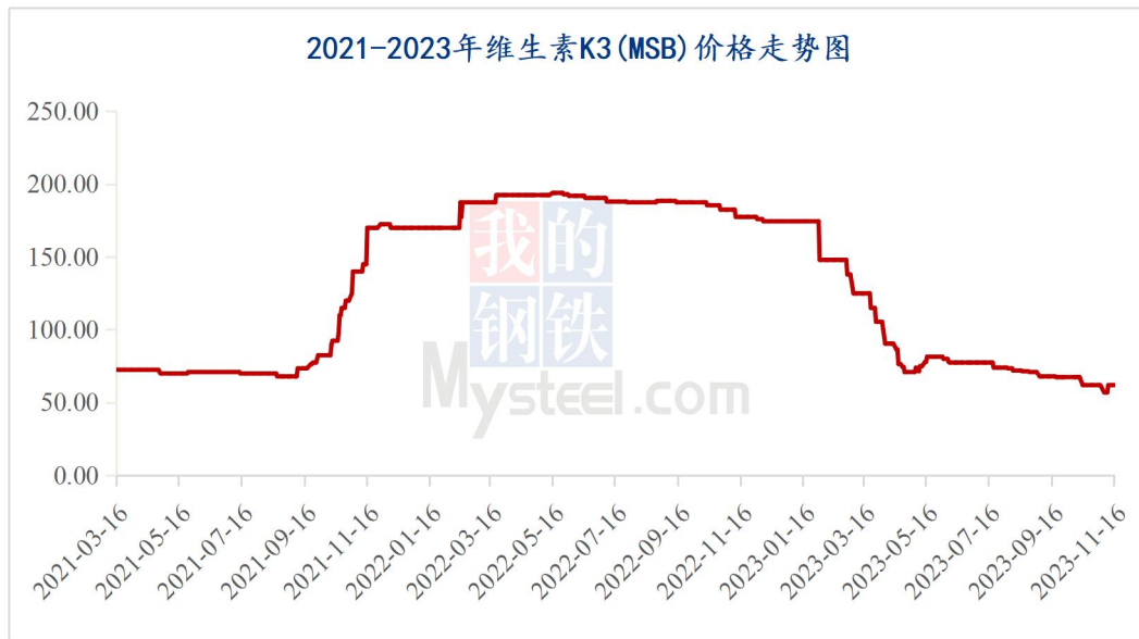
图 10 2021-2023 年维生素 K3 价格走势