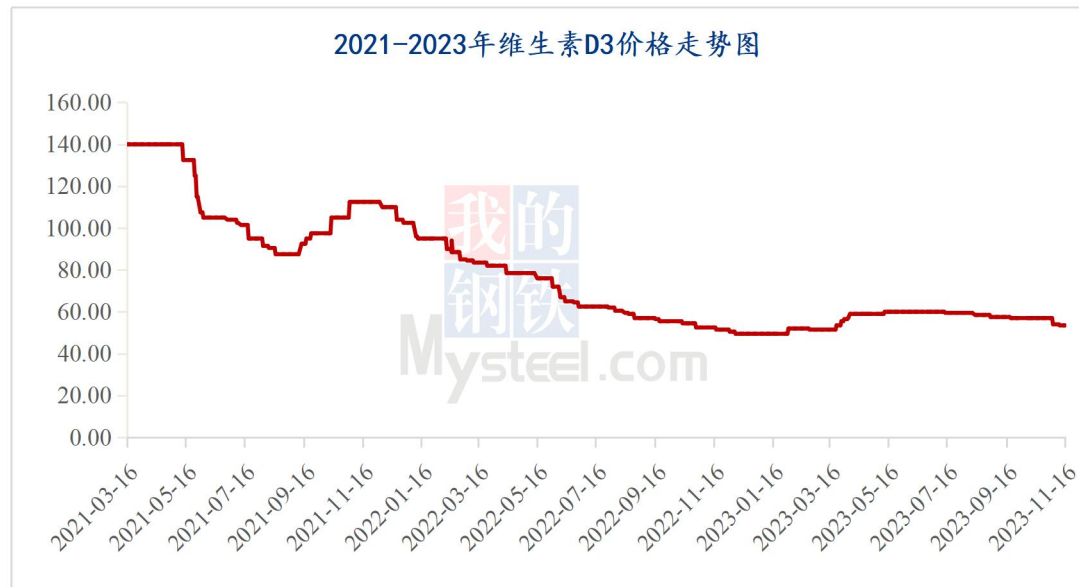
图 4 2021-2023 年维生素 D3 价格走势图

本周国内维生素 D3 国内市场主流价格为 58-62 元/kg，市场需求一般，上游挺价意愿较强，经销渠道出货积极，价格平稳运行。