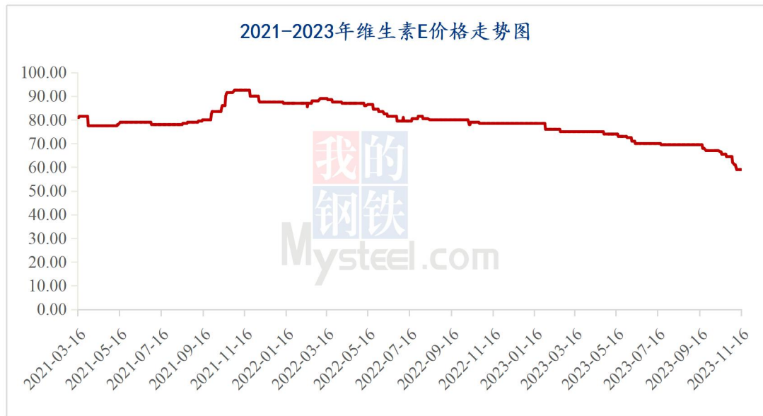
图 2 2021-2023 年维生素 E 价格走势图