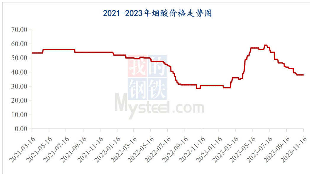
图 15 2021-2023 年烟酸价格走势