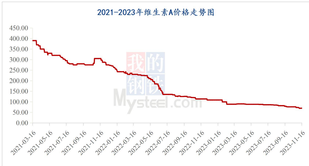
图 1 2023 年维生素 A 价格走势

据 Mysteel 对全国维生素市场价格调查，本周维生素 AVA500 市场价格 69-72 元/kg，采购需求持续偏弱，市场报价止跌企稳，个别厂家近期有停报计划。