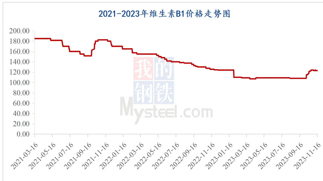
图 6 2021-2023 年维生素 B1 价格走势图

本周国内维生素 B1（80%）市场报价在 124-130 元/kg，下游需求较弱，市场观望为主，市场询单和寻货较活跃，成交价格偏稳运行。