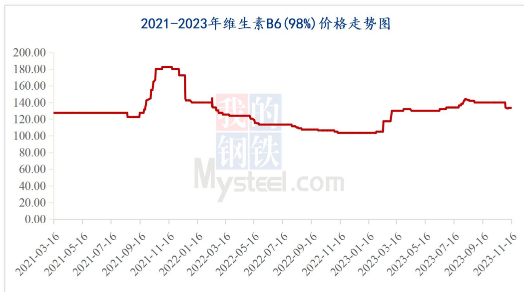
图 8 2021-2023 年维生素 B6 价格走势图

本周国内市场主流报价 137-142 元/kg，价格暂时企稳。市场需求一般，价格较上周小幅下调。6 月 15 日，天新药业饲料级 VB6 停报停签。10 月 11 日，天新药业饲料级 VB6 停报停签。