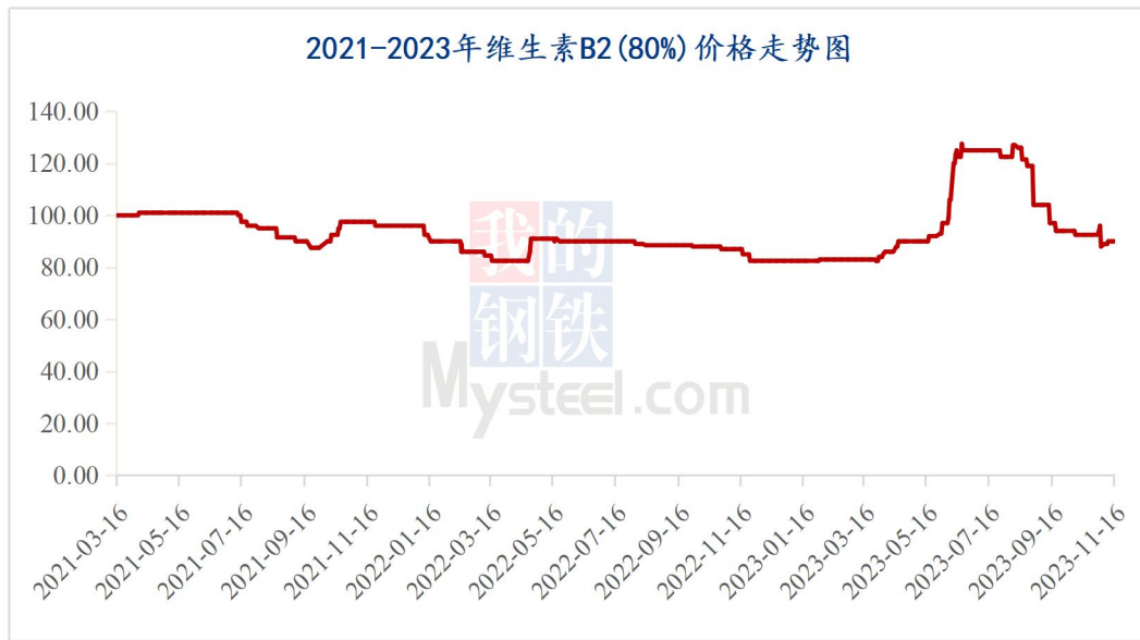
图 7 2021-2023 年维生素 B2（80%）价格走势图