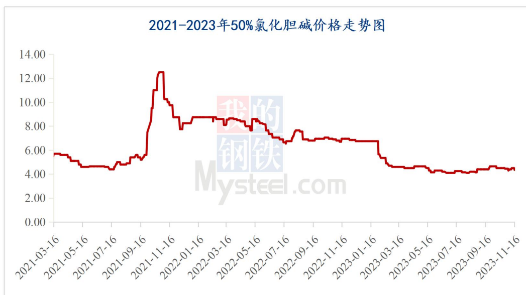
图 16 2021-2023 年氯化胆碱价格走势

本周国内氯化胆碱市场价格 4.2-4.4 元/kg。胆碱，受原料三甲胺价格小幅波动，胆碱工厂报价动态调整，后续主要关注其原料端三甲胺及环氧乙烷变化情况。7 月 12 日，受上游原料价格上涨影响，山东丰银饲料级 50%氯化胆碱价格上调至 4.1 元/kg，60%氯化胆碱价格上调至 4.6 元/kg。7 月 13 日，受原料价格上涨影响，辽宁中信生物上调 50%氯化胆碱报价为 4.4 元/kg。