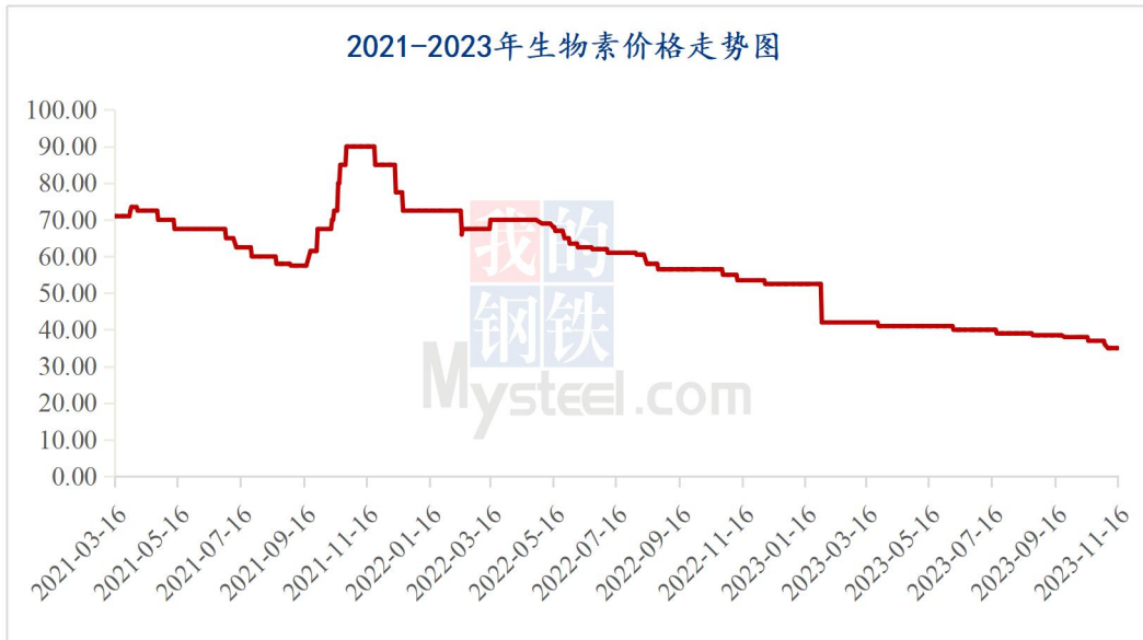
图 12 2021-2023 年生物素价格走势图

本周国内 2%生物素市场价格在 36-39 元/kg，市场询单一般，交投价格偏稳，部分价格略低。