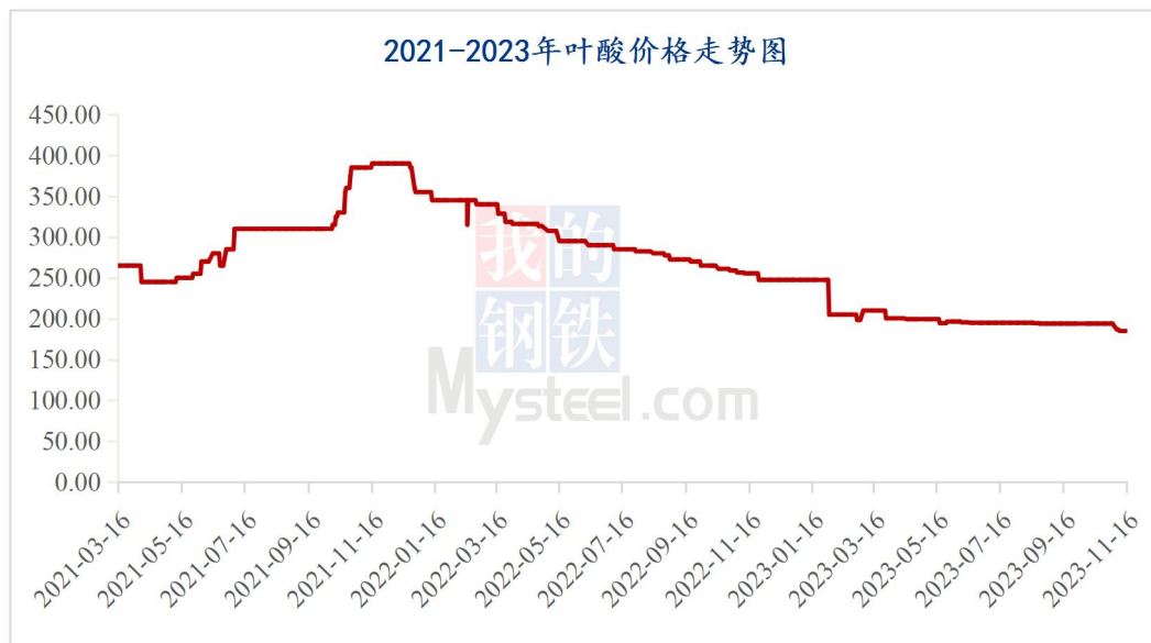
图 11 2021-2023 年叶酸价格走势

本周国内市场主流报价 192-196 元/kg，叶酸目前总体需求不旺，市场成交一般，价格下滑。6 月 15 日，天新药业饲料级叶酸停报停签。