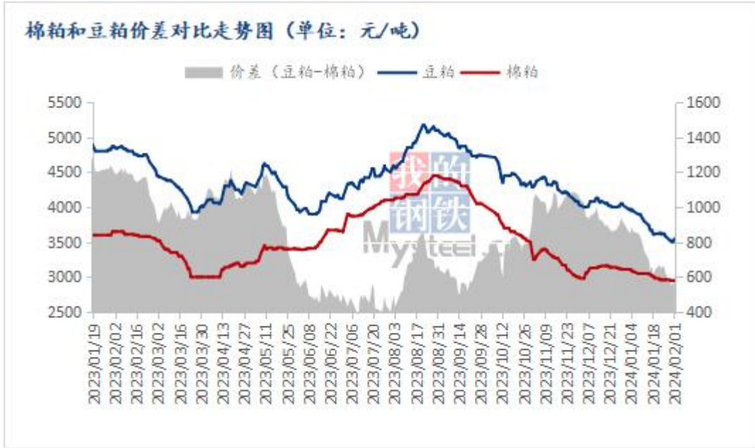
图 1 棉粕和豆粕价差对比走势图