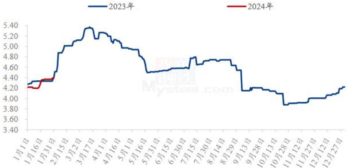
(2023-2024年) 全国肉鸭均价走势图 (元/斤)

本周全国毛鸭震荡运行，北方市场基本停宰，鸭源供应及均价较上周基本持平。南方活禽交投偏旺，老鸭缺货明显，受节前活禽常规需求增量及生猪带动，主产区市场报价上行，短期维持震荡运行趋势。