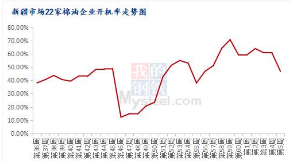
图 2 新疆棉油企业开机率走势图