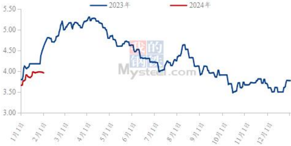
图3 全国白羽肉鸡均价走势图