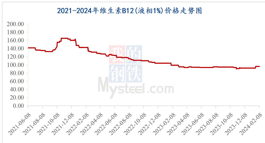
图 9 2021-2024 年维生素 B12 价格走势图

本周国内市场主流报价 94-98 元/kg，工厂上调报价，市场整体价格偏稳运行，市场需求一般。