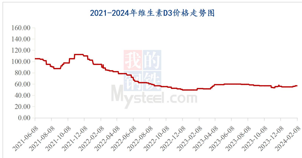
图 4 2021-2024 年维生素 D3 价格走势图

本周国内维生素 D3 市场主流价格为 56-58 元/kg，上游工厂停报停签，市场需求较活跃，市场情绪一般。