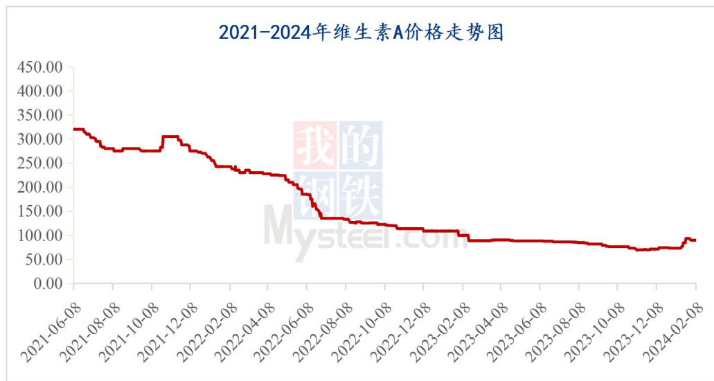
图 1 2021-2024 年维生素 A 价格走势图

据 Mysteel 对全国维生素市场价格调查，本周维生素 VA500 市场价格 84-88 元/kg，工厂停报停签，下游需求一般，市场报价偏稳震荡。