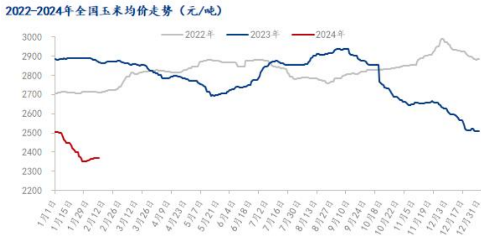
图 17 2022-2024 年全国玉米均价走势图

本周玉米价格整体维持稳定。春节临近，基层购销逐渐转淡，农历小年之后，下游深加工企业陆续发布停收公告，玉米价格整体维持稳定，个别企业价格窄幅调整，主流价格保持稳定。下游企业节前备货已经完成，刚性采购为主。关注春节之后农户售粮恢复快慢、贸易商建库以及下游企业补库需求。