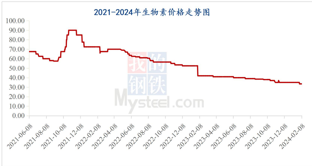
图 12 2021-2024 年生物素价格走势图

本周国内 2%生物素市场价格在 32-35 元/kg，价格偏稳运行，市场询单一般，交投价格偏弱，部分价格略低。