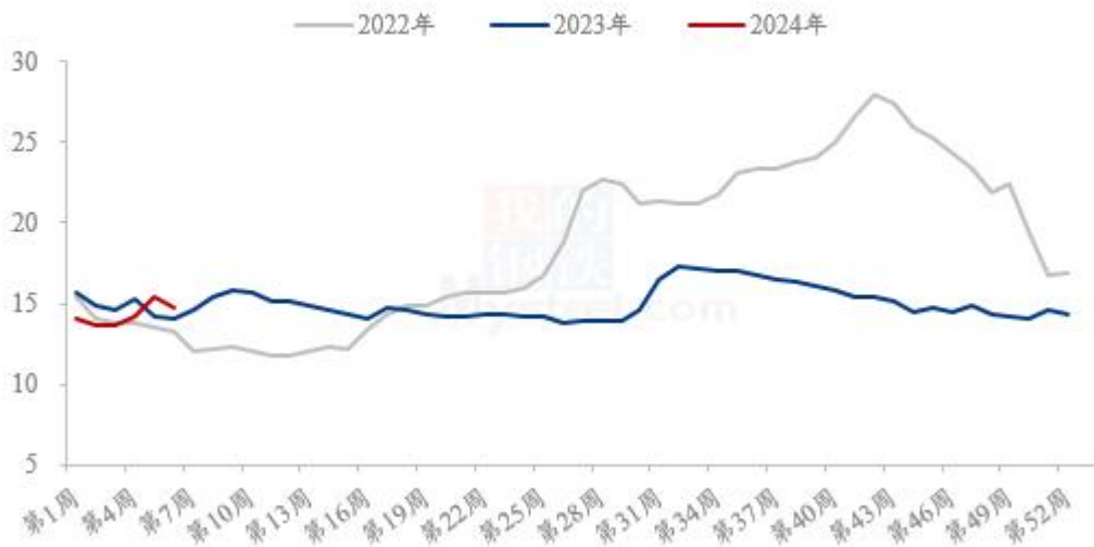
图 18 全国外三元生猪出栏均价走势图