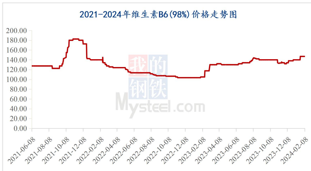
图 8 2021-2024 年维生素 B6 价格走势图

本周国内市场主流报价 142-148 元/kg，市场偏稳运行，市场需求较一般。11 月 29 日，天新药业公布饲料级维生素 B6 报价 148 元/kg，出口报价 19 美元/kg。