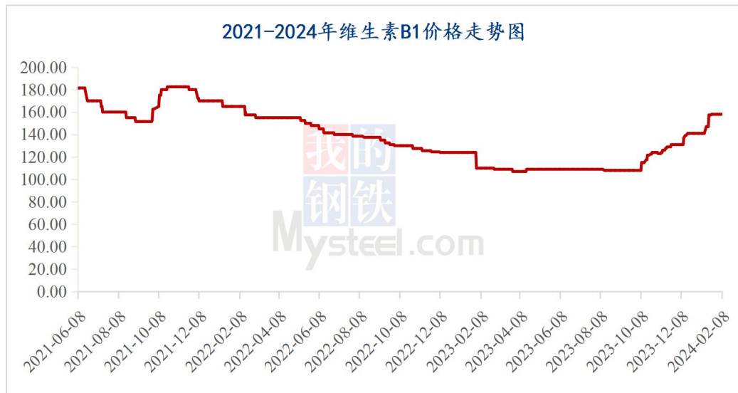
图 6 2021-2024 年维生素 B1 价格走势图

本周国内维生素 B1（80%）市场报价在 148-154 元/kg，下游需求较强，市场询单和寻货略一般，市场成交价格偏稳震荡。