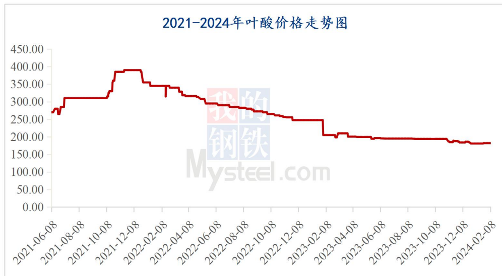
图 11 2021-2024 年叶酸价格走势图

本周国内市场主流报价 179-185 元/kg，叶酸目前总体需求有所提振，市场实际成交一般，价格偏稳稍强运行，涨价情绪强烈。6月15日，天新药业饲料级叶酸停报停签。