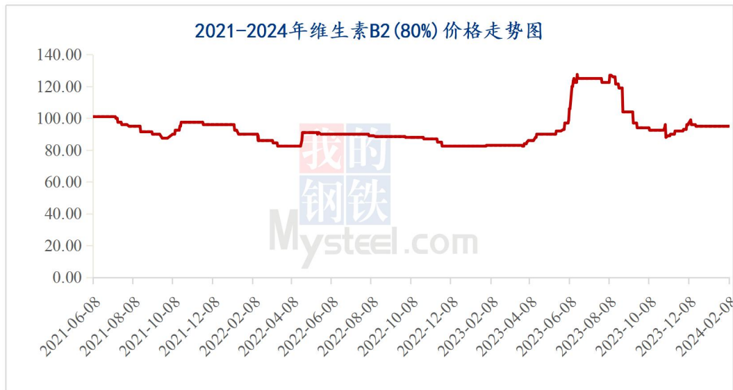
图 7 2021-2024 年维生素 B2 (80%) 价格走势图