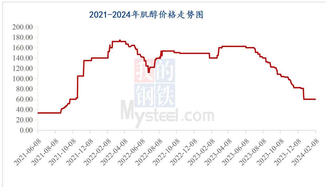
图 14 2021-2024 年肌醇价格走势

本周国内肌醇市场报价 55-65 元/kg，价格偏弱运行，市场需求较弱，市场供大于需，后期需关注工厂生产和发货情况。