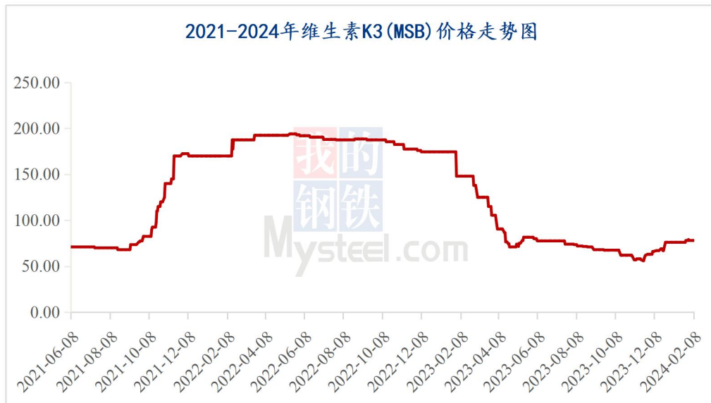
图 10 2021-2024 年维生素 K3 价格走势图