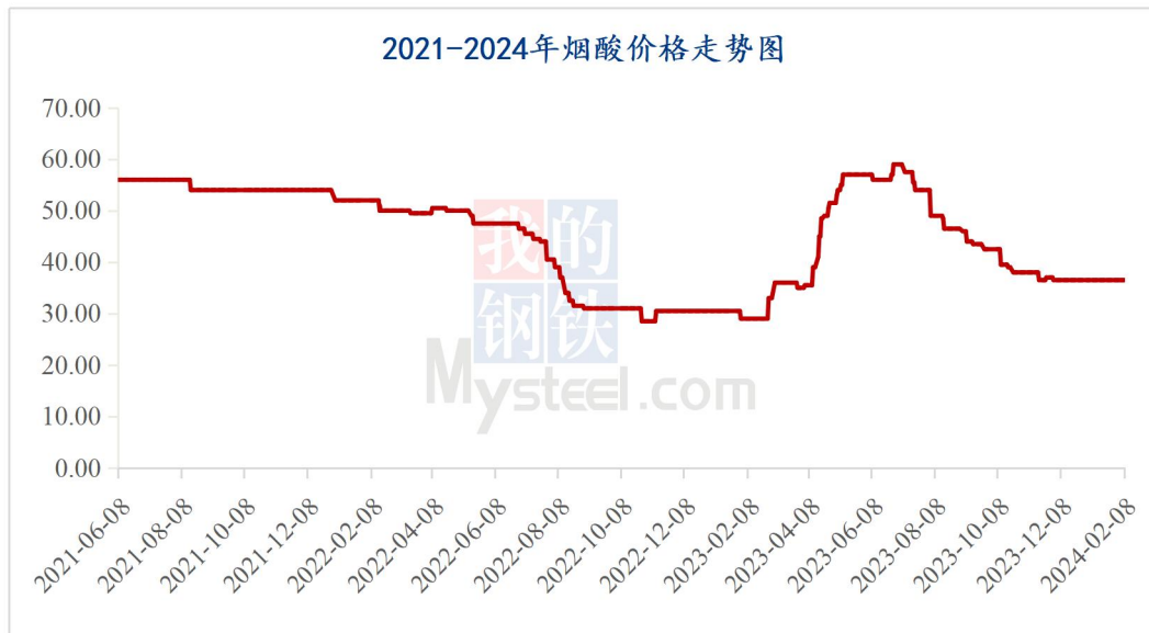
图 15 2021-2024 年烟酸价格走势