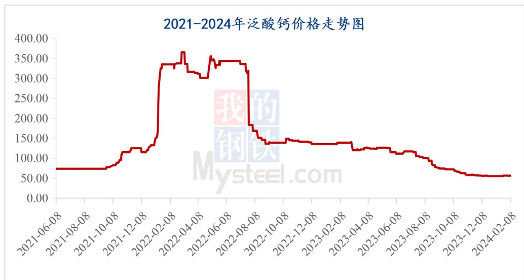
图 5 2021-2024 年泛酸钙价格走势图

本周国内泛酸钙市场主流价格在 54-58 元/kg，下游需求一般，市场低价货源减少，市场价格弱稳运行。