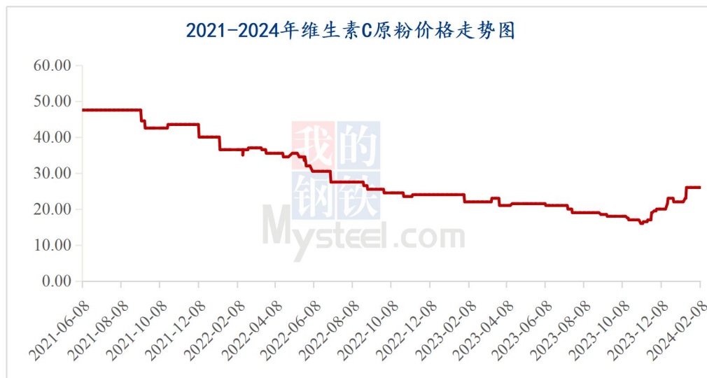
图 3 2021-2024 年维生素 C 价格走势图

本周 VC 原粉国内市场报价 25-27 元/kg，市场价格偏稳运行，低价货源减少，下游需求一般。