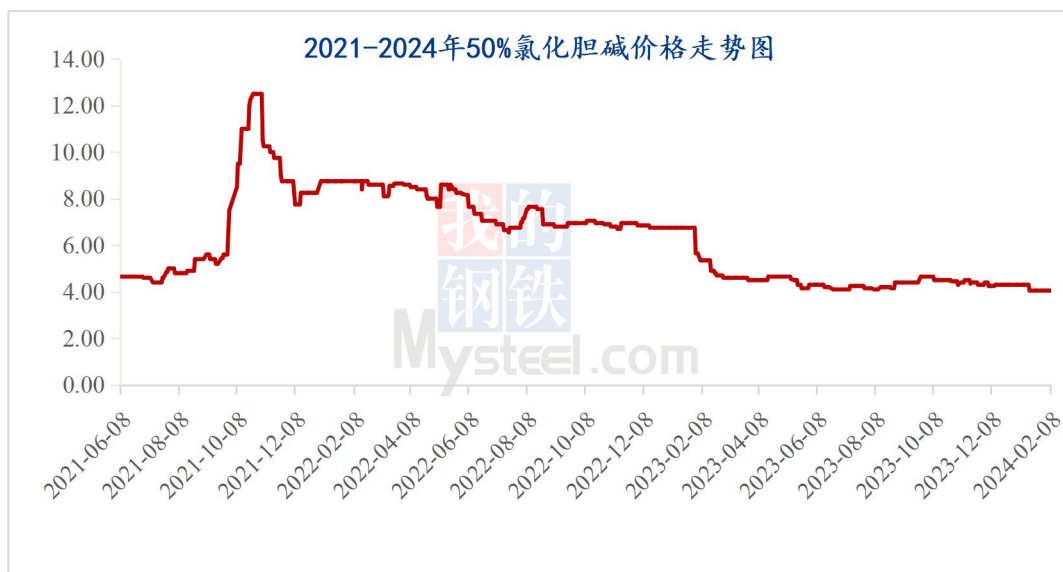
图 16 2021-2024 年氯化胆碱价格走势

本周国内氯化胆碱市场价格 3.9-4.2 元/kg。胆碱，受原料三甲胺价格小幅波动，胆碱工厂报价动态调整，后续主要关注其原料端三甲胺及环氧乙烷变化情况。7 月 12 日，受上游原料价格上涨影响，山东丰银饲料级 50%氯化胆碱价格上调至 4.1 元/kg，60%氯化胆碱价格上调至 4.6 元/kg。7 月 13 日，受原料价格上涨影响，辽宁中信生物上调 50%氯化胆碱报价为 4.4 元/kg。