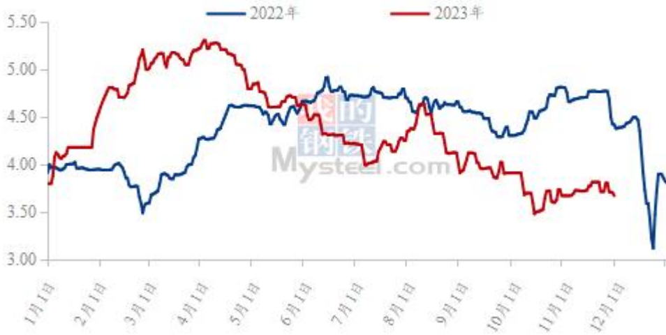
图 19 全国白羽肉鸡均价走势图