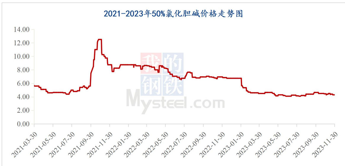
图 16 2021-2023 年氯化胆碱价格走势图

本周国内氯化胆碱市场价格 4.3-4.4 元/kg。胆碱，受原料三甲胺价格小幅波动，胆碱工厂报价动态调整，后续主要关注其原料端三甲胺及环氧乙烷变化情况。7 月 12 日，受上游原料价格上涨影响，山东丰银饲料级 50%氯化胆碱价格上调至 4.1 元/kg，60%氯化胆碱价格上调至 4.6 元/kg。7 月 13 日，受原料价格上涨影响，辽宁中信生物上调 50%氯化胆碱报价为 4.4 元/kg。