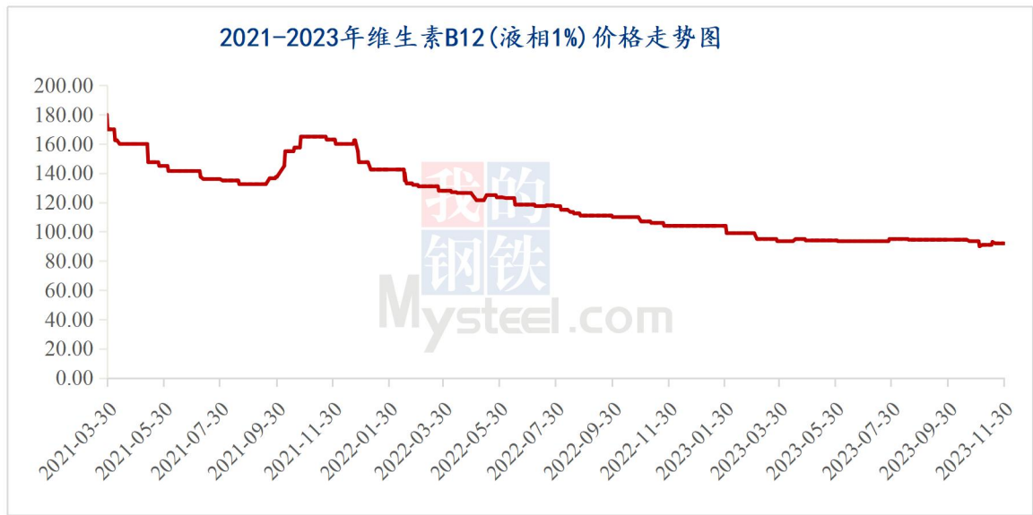
图 9 2021-2023 年维生素 B12 价格走势