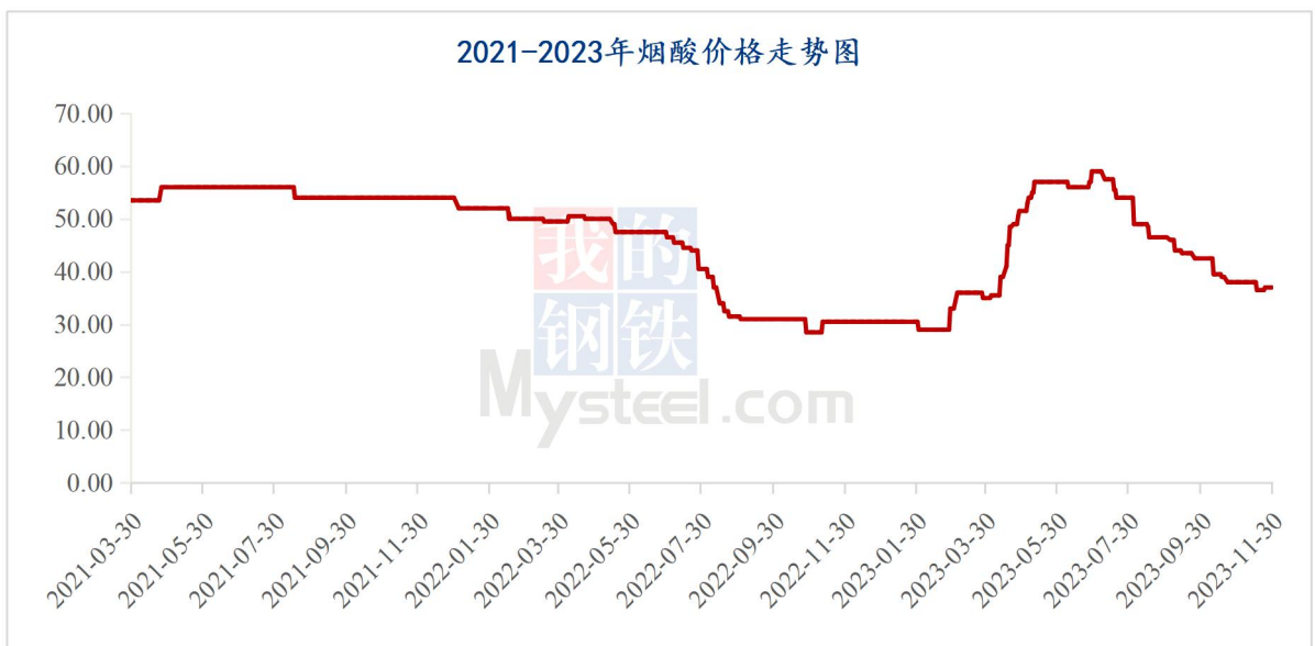
图 15 2021-2023 年烟酸价格走势图

本周国内市场主流报价 36-38 元/kg，市场成交较为平稳，市场询单一般，交投价格平稳偏弱，部分价格略低。