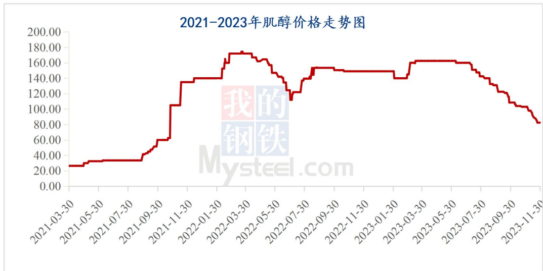
图 14 2021-2023 年肌醇价格走势图

本周国内肌醇主流厂家提高报价至 80-85 元/kg，市场需求较弱，后期需关注工厂生产和发货情况。