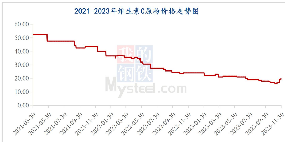
图 3 2021-2023 年维生素 C 价格走势

本周 VC 原粉国内市场报价 19-20 元/kg，市场价格偏稳运行，下游需求一般，终端适量补货，部分品牌略低一些。