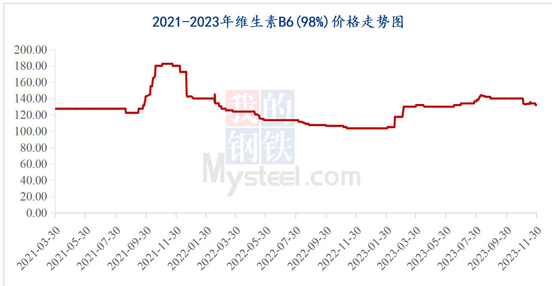
图 8 2021-2023 年维生素 B6 价格走势

本周国内市场主流报价 130-134 元/kg，市场需求一般，价格偏稳较上周小幅下调。6 月 15 日，天新药业饲料级 VB6 停报停签。10 月 11 日，天新药业饲料级 VB6 停报停签。