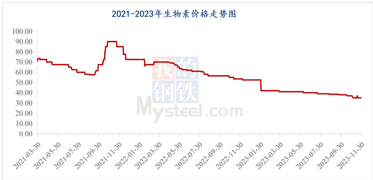
图 12 2021-2023 年生物素价格走势