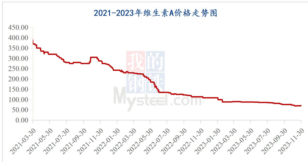
图 1 2023 年维生素 A 价格走势

据 Mysteel 对全国维生素市场价格调查，本周维生素 VA500 市场价格 70-72 元/kg，采购需求较活跃，市场报价偏强运行。