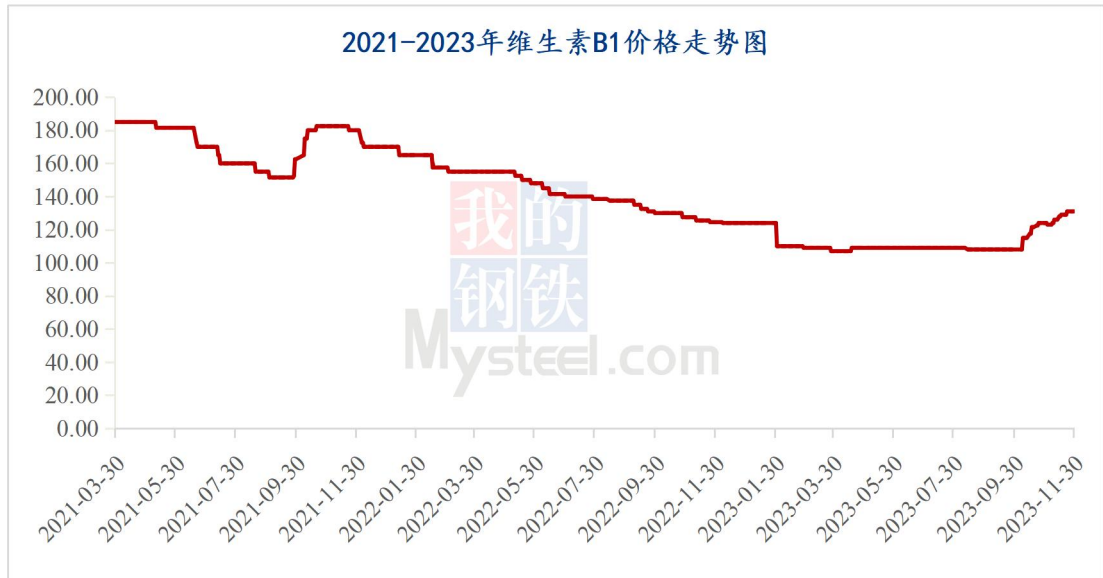
图 6 2021-2023 年维生素 B1 价格走势图

本周国内维生素 B1（80%）市场报价在 130-132 元/kg，下游需求较稳，市场询单和寻货一般，成交价格偏稳运行。