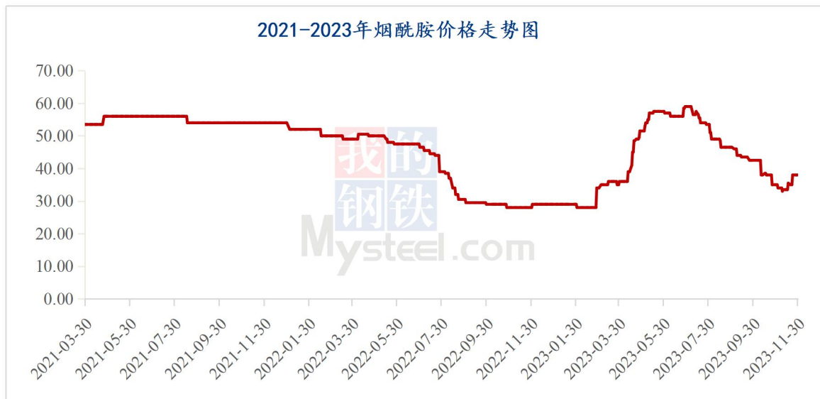
图 13 2021-2023 年烟酰胺价格走势

本周国内市场主流报价 36-40 元/kg，市场价格偏稳运行，市场询单一般，交投价格平稳偏稳，部分价格略低。