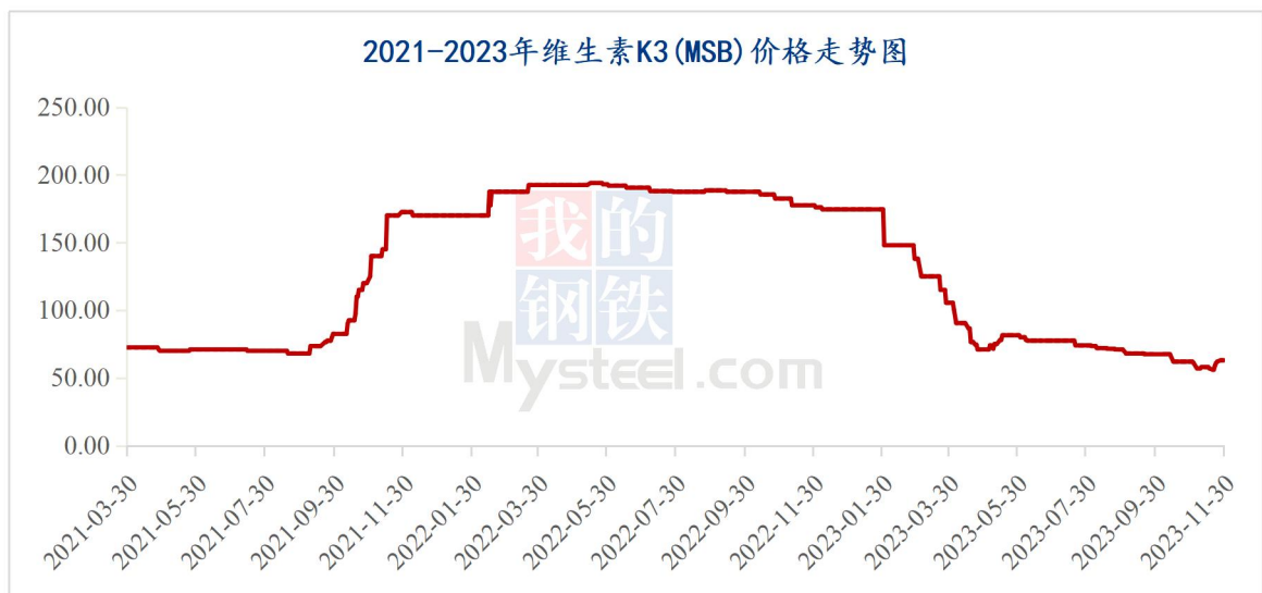
图 10 2021-2023 年维生素 K3 价格走势

本周国内维生素 K3 (MSB) 市场主流价格在 61-65 元/kg，MNB 市场价格在 71-77 元/kg。下游需求活跃，上游工厂发货正常，市场价格较上周上调，实单议价成交为主。