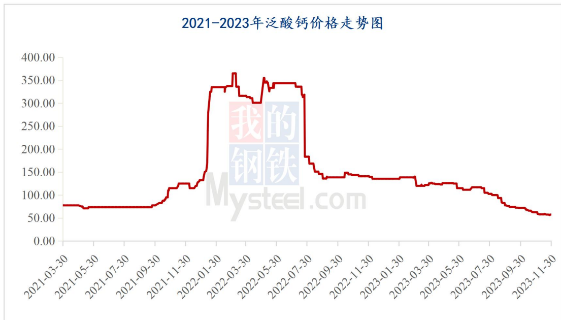
图 5 2021-2023 年泛酸钙价格走势

本周国内泛酸钙市场主流价格在 57-58 元/kg，上游工厂报价暂稳，下游需求一般，市场价格偏稳运行，实单议价。