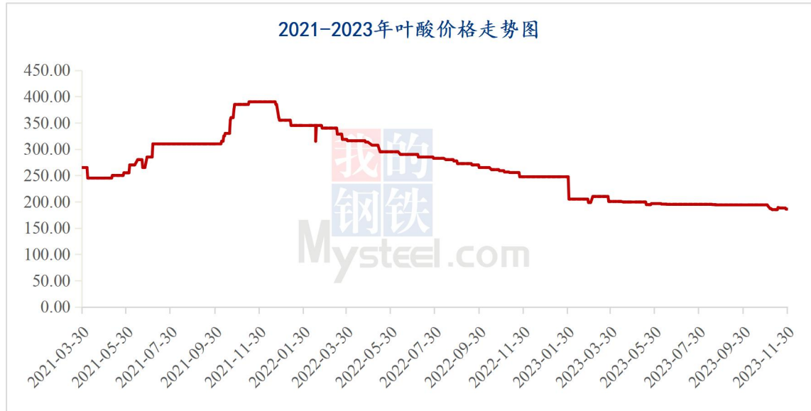
图 11 2021-2023 年叶酸价格走势图

本周国内市场主流报价 185-187 元/kg，叶酸目前总体需求不旺，市场成交一般，价格偏弱运行。6 月 15 日，天新药业饲料级叶酸停报停签。