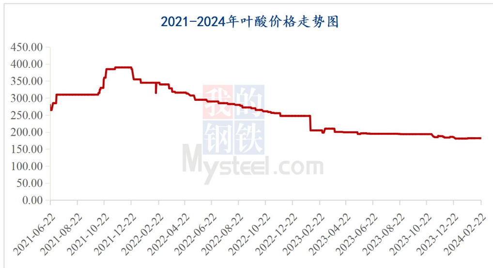
图 11 2021-2024 年叶酸价格走势图