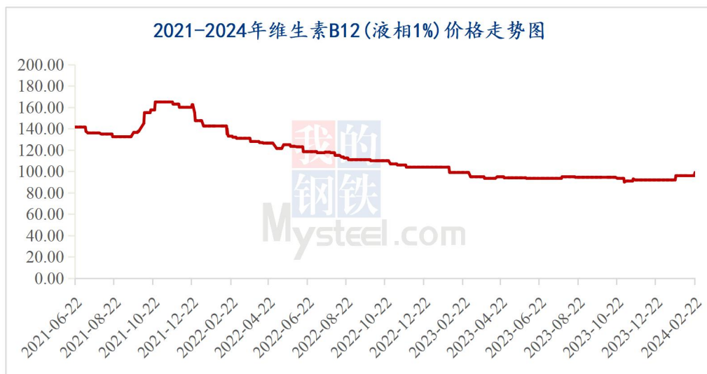
图 9 2021-2024 年维生素 B12 价格走势图

本周国内维生素 B12 市场报价 98-100 元/kg，工厂上调报价，市场整体价格小幅上调。