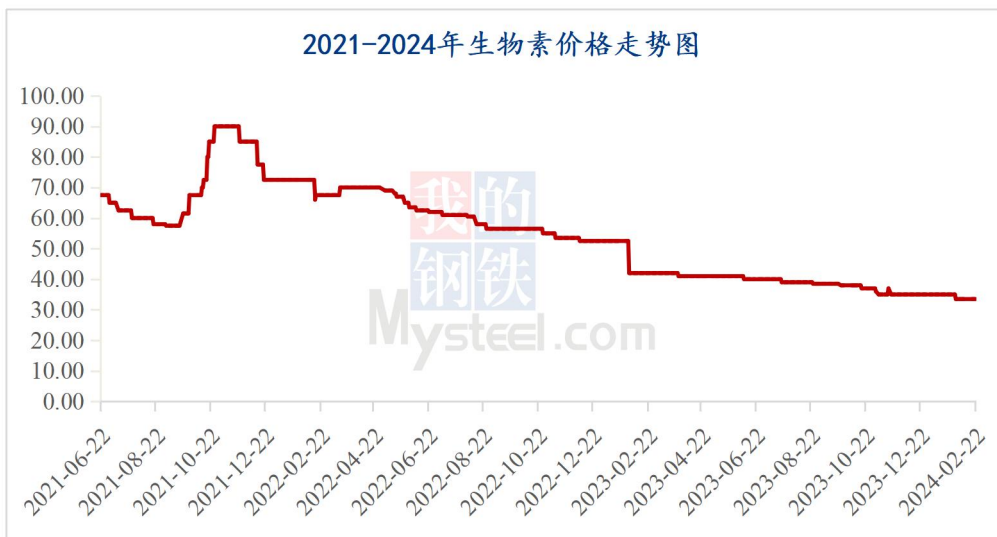
图 12 2021-2024 年生物素价格走势图

本周国内 2%生物素市场价格在 32-35 元/kg，价格偏稳运行，市场询单一般，交投价格偏弱，部分价格略低。