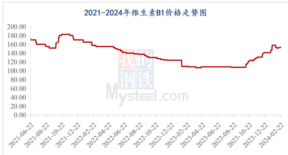
图 6 2021-2024 年维生素 B1 价格走势