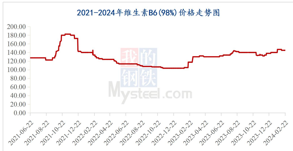
图 8 2021-2024 年维生素 B6 价格走势图

本周国内市场主流报价 142-148 元/kg，市场偏稳运行，市场需求较一般。11 月 29 日，天新药业公布饲料级维生素 B6 报价 148 元/kg，出口报价 19 美元/kg。