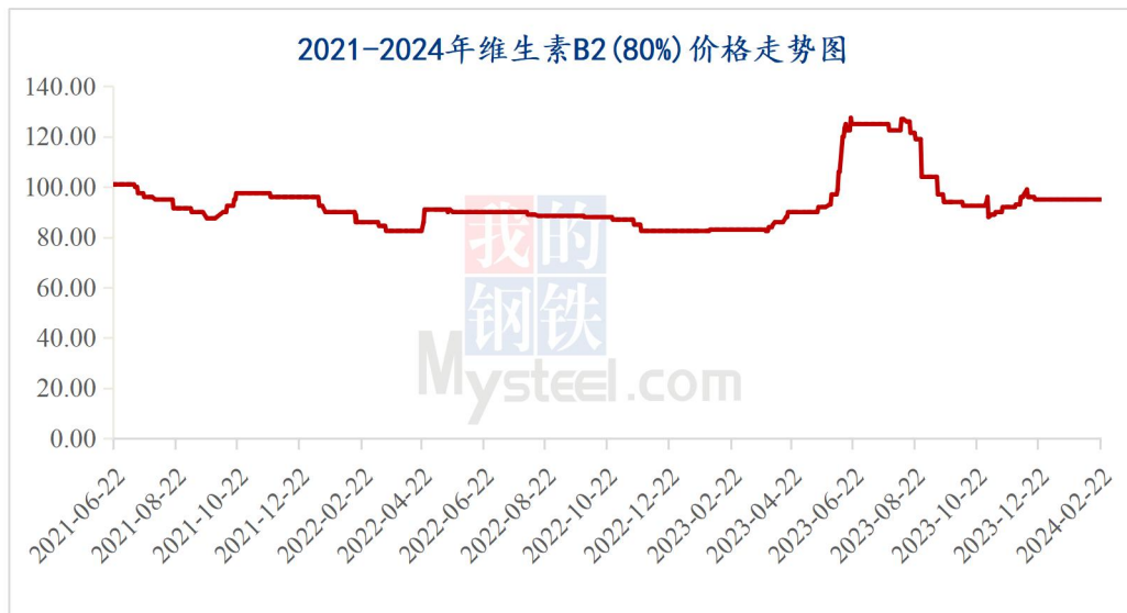
图 7 2021-2024 年维生素 B2 (80%) 价格走势

本周国内 VB2(80%)市场价格 90-100 元/kg，VB2(98%)市场价格 280-300 元/kg。厂家恢复报价，市场报价偏稳运行，市场实际需求一般，根据品牌、日期不同，局部价格略低。