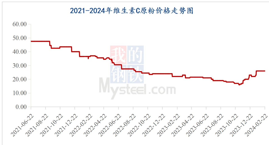
图 3 2021-2024 年维生素 C 价格走势

本周 VC 原粉国内市场报价 25-27 元/kg，市场价格偏稳运行，下游需求一般。