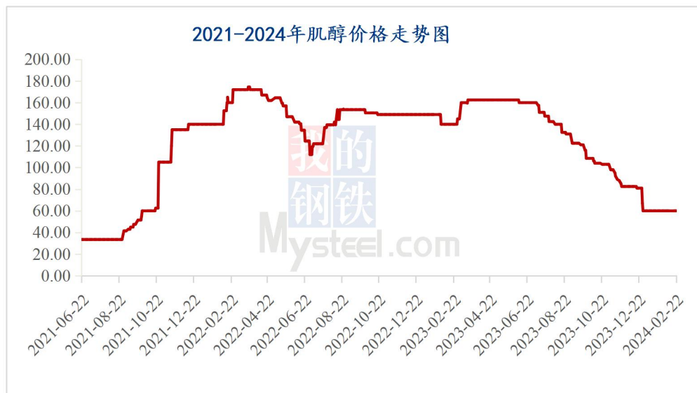
图 14 2021-2024 年肌醇价格走势

本周国内肌醇市场报价 55-65 元/kg，价格偏弱运行，市场需求较弱，市场供大于需，关注后期市场成交情况。