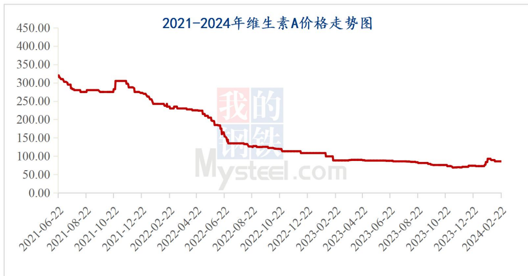
图 1 2021-2024 年维生素 A 价格走势图

据 Mysteel 对全国维生素市场价格调查，本周维生素 VA500 市场价格 84-88 元/kg，工厂停报停签，下游需求一般，市场报价偏稳震荡。