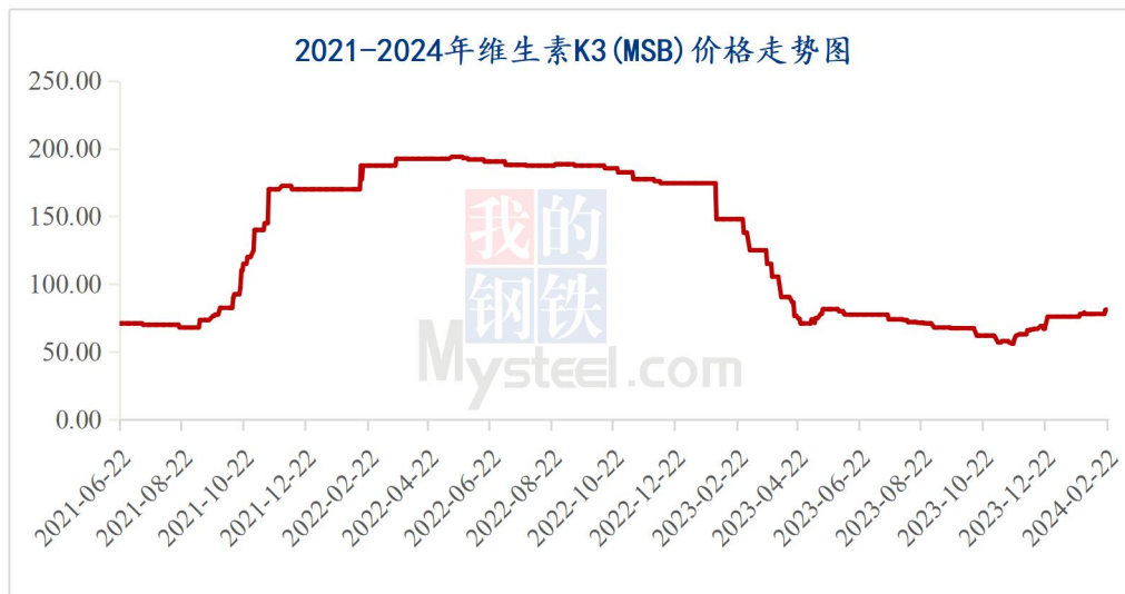
图 10 2021-2024 年维生素 K3 价格走势图

本周国内维生素 K3（MSB）市场主流价格在 79-83 元/kg，MNB 市场价格在 88-92 元/kg。下游需求一般，工厂供货偏紧，市场惜售，价格偏稳运行。