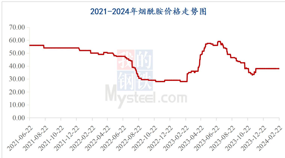
图 13 2021-2024 年烟酰胺价格走势

本周国内市场主流报价 36-40 元/kg，市场价格偏稳运行，市场询单一般，交投价格平稳，部分价格略低。