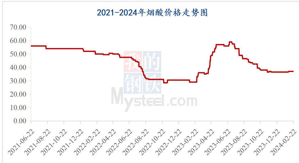
图 15 2021-2024 年烟酸价格走势

本周国内市场主流报价 36-38 元/kg，市场成交较一般，市场询单一般，交投价格平稳偏弱，部分价格略低。