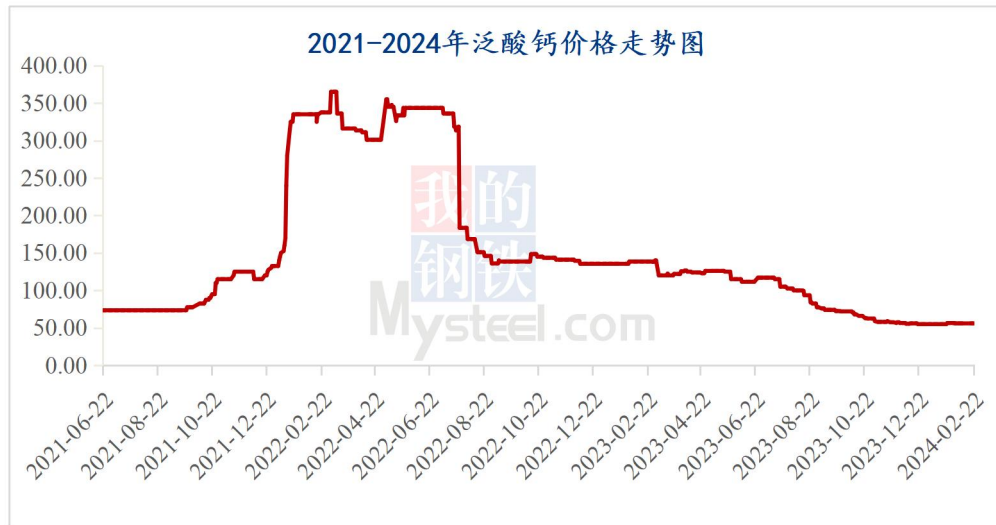
图 5 2021-2024 年泛酸钙价格走势

本周国内泛酸钙市场主流价格在 54-58 元/kg，下游需求一般，市场低价货源减少，市场价格平稳运行。