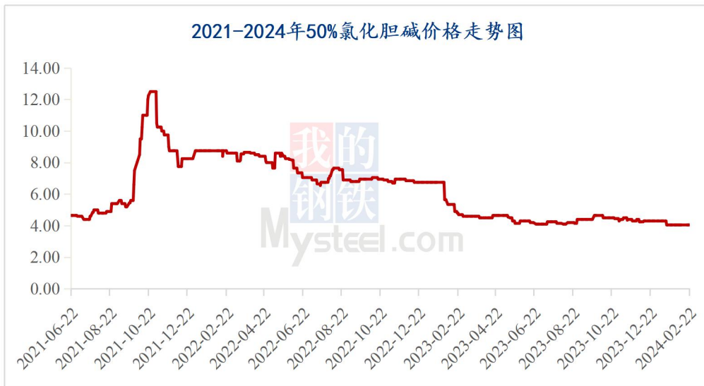
图 16 2021-2024 年氯化胆碱价格走势图