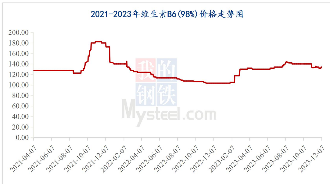
图 8 2021-2023 年维生素 B6 价格走势图

本周国内市场主流报价 132-136 元/kg，市场需求一般，价格偏稳较上周小幅上调。11 月 29 日，天新药业公布饲料级维生素 B6 报价 148 元/kg，出口报价 19 美元/kg。