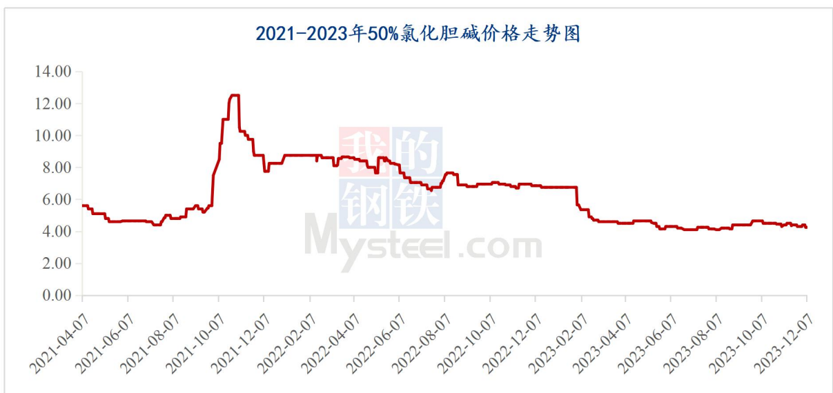
图 16 2021-2023 年氯化胆碱价格走势图

本周国内氯化胆碱市场价格 4.2-4.3 元/kg。胆碱，受原料三甲胺价格小幅波动，胆碱工厂报价动态调整，后续主要关注其原料端三甲胺及环氧乙烷变化情况。7月12日，受上游原料价格上涨影响，山东丰银饲料级 50%氯化胆碱价格上调至 4.1 元/kg，60%氯化胆碱价格上调至 4.6 元/kg。7月13日，受原料价格上涨影响，辽宁中信生物上调 50%氯化胆碱报价为 4.4 元/kg。