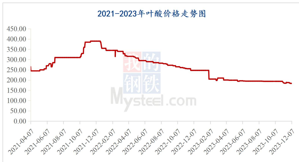
图 11 2021-2023 年叶酸价格走势图

本周国内市场主流报价 183-185 元/kg，叶酸目前总体需求不旺，市场成交一般，价格偏弱运行。6月15日，天新药业饲料级叶酸停报停签。