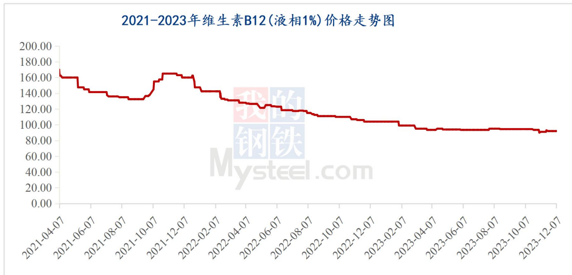
图 9 2021-2023 年维生素 B12 价格走势

本周国内市场主流报价 90-94 元/kg，整体价格基本平稳，市场需求一般，价格偏稳运行。