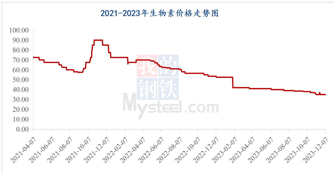
图 12 2021-2023 年生物素价格走势

本周国内 2%生物素市场价格在 34-36 元/kg，价格偏稳运行，市场询单一般，交投价格偏弱，部分价格略低。