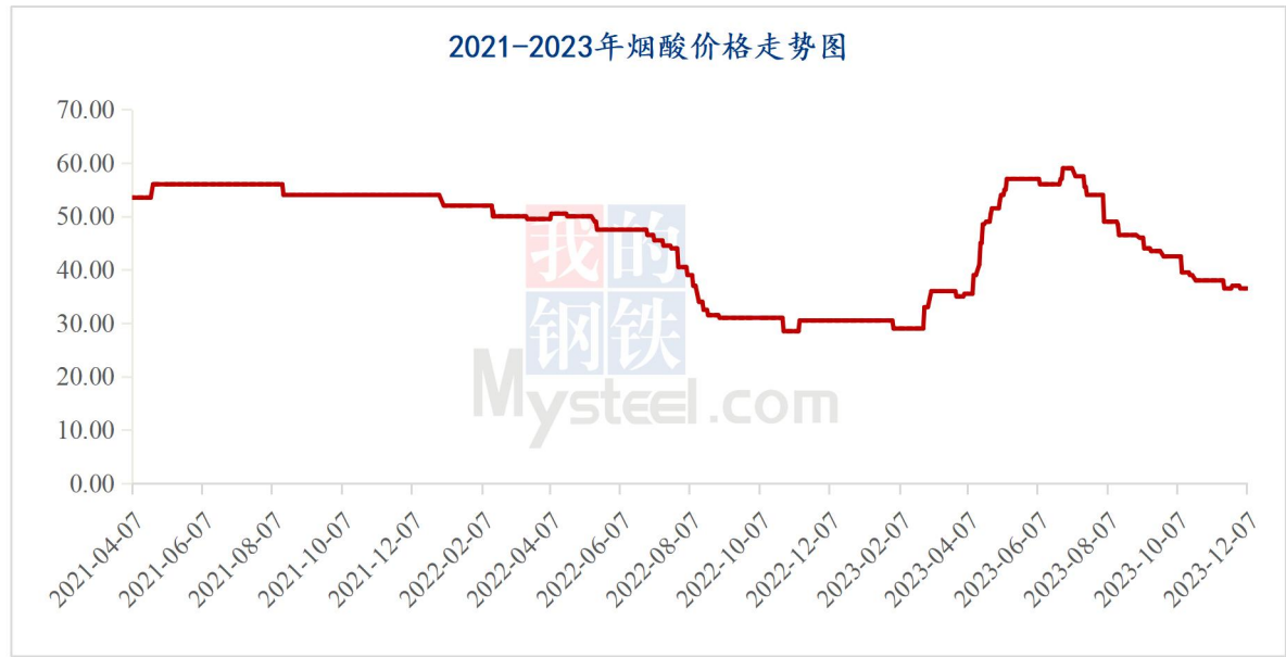
图 15 2021-2023 年烟酸价格走势图