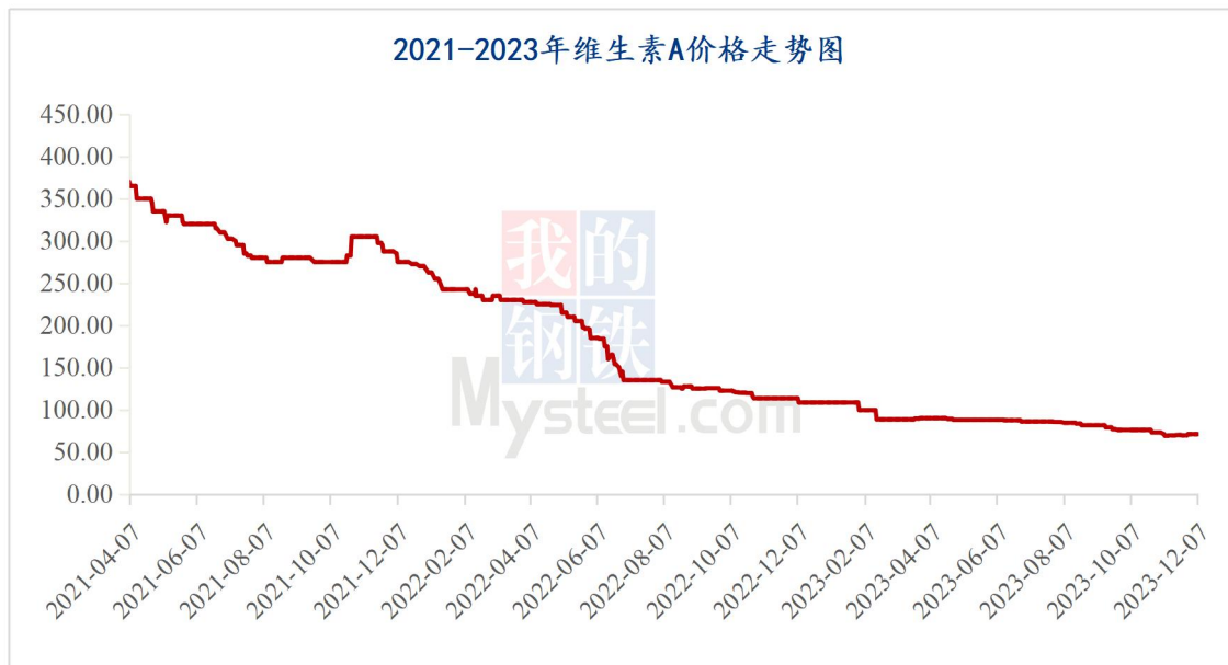
图 1 2023 年维生素 A 价格走势

据 Mysteel 对全国维生素市场价格调查，本周维生素 VA500 市场价格 70-72 元/kg，采购需求一般，市场报价偏稳运行。