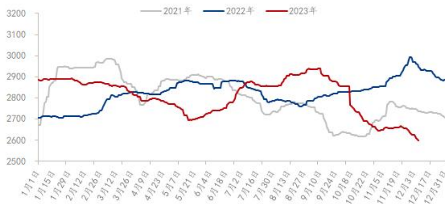
图 17 2021-2023 年全国玉米均价走势图