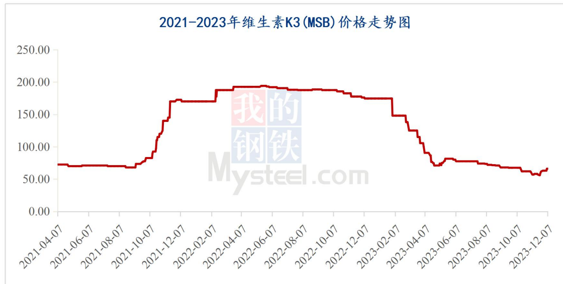
图 10 2021-2023 年维生素 K3 价格走势图