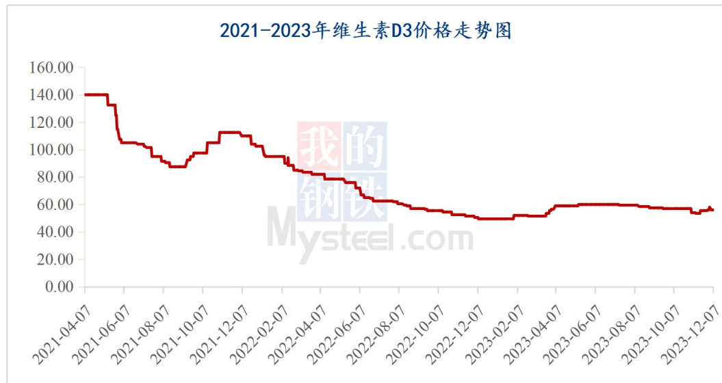
图 4 2021-2023 年维生素 D3 价格走势图

本周国内维生素 D3 国内市场主流价格为 55-57 元/kg，市场需求一般，上游挺价意愿较强，经销渠道出货积极，价格平稳运行。