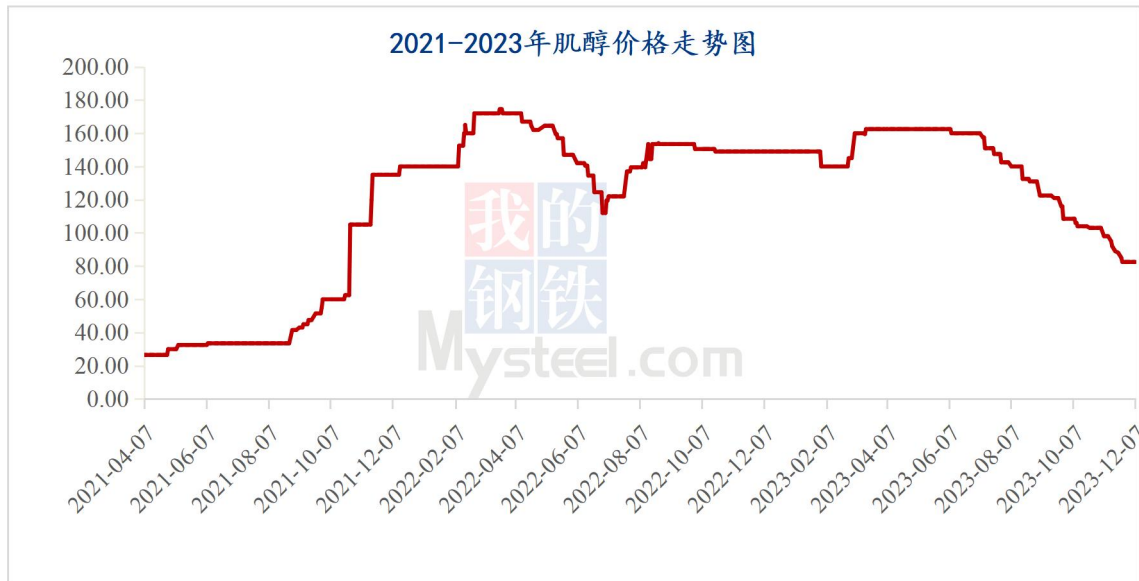
图 14 2021-2023 年肌醇价格走势

本周国内肌醇主流厂家提高报价至 80-85 元/kg，市场需求较弱，后期需关注工厂生产和发货情况。