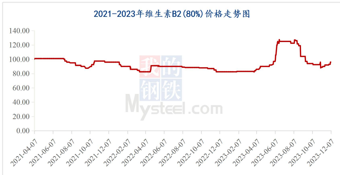
图 7 2021-2023 年维生素 B2 (80%) 价格走势图