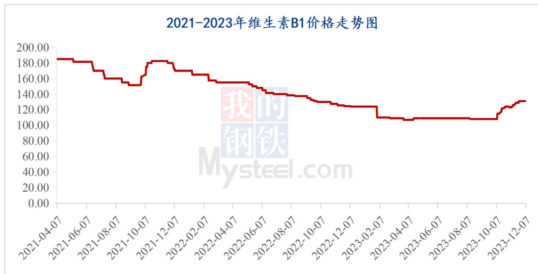
图 6 2021-2023 年维生素 B1 价格走势图

本周国内维生素 B1（80%）市场报价在 130-132 元/kg，下游需求较稳，市场询单和寻货一般，成交价格偏稳运行。