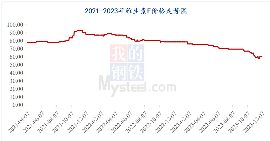
图 2 2021-2023 年维生素 E 价格走势图