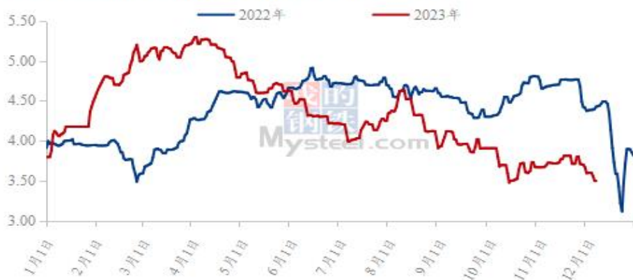
图 2 全国白羽肉鸡均价走势图