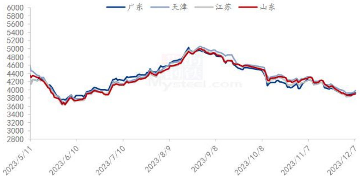
图4 国内沿海区域豆粕主流出厂价