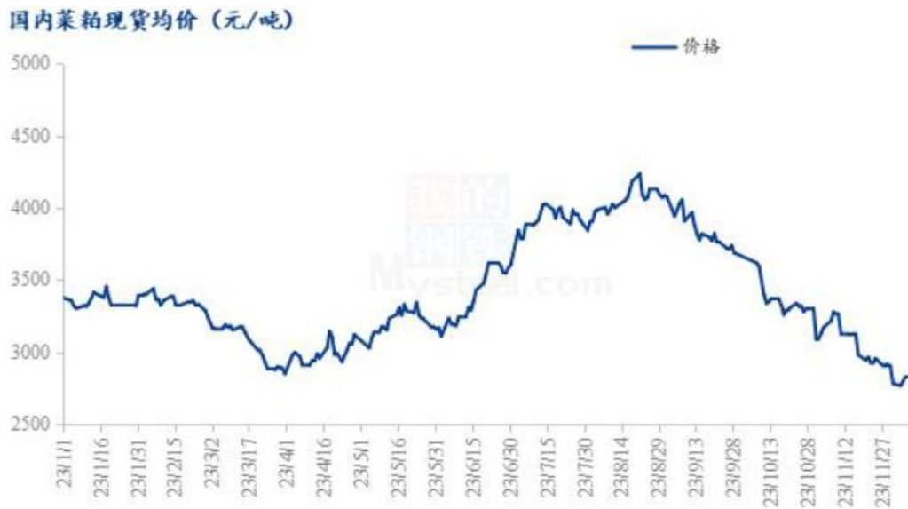
图 5 国内菜粕现货均价及预测

截止到发稿，菜粕全国均价为 2830 元/吨，较上周下跌 65 元/吨，跌幅 2.25%，菜粕基差延续跌势。直接进口端值得一提的是，由于前期的地域价差回归，所以目前华南已有进口菜粕到港。从菜籽压榨产粕角度看，同菜油一致，华南菜籽大供应兑现，区别于菜油的是，菜粕水产旺季结束背景下，刚需减少。但是由于与豆粕的价差不断拉大，菜粕的性价比相对凸显，在一定程度上支撑菜粕在淡季的消费。不过四季度的供需极度不平衡的态势下，菜粕与相关产品的价格相比或仍处于弱势。